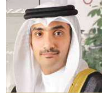
الشيخ عبدالله بن خليفة

تنفيذ أهداف سموه تلك الرؤية الداعمة لتطوير وارتقاء الرياضة البحرينية بصورة عامة ورياضة كرة القدم بصورة خاصة.