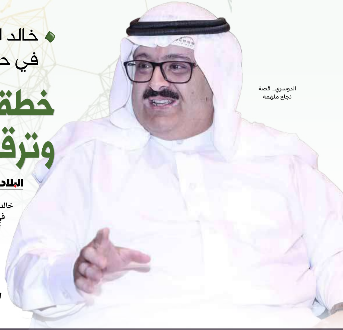
الدوسري... قصة نجاح ملهمة

شعبية التطبيقات انخفضت و"يوتيوب" تراجع والقوة لمنصتين