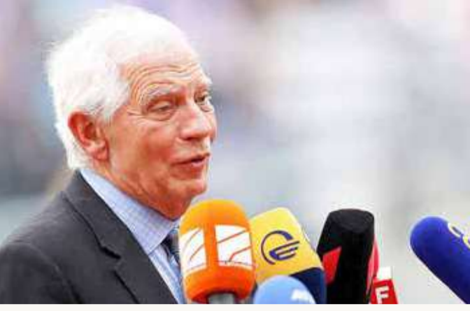
بوريل: أوروبا حديقة والعالم الآخر أدغال