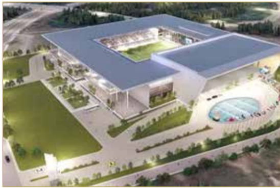
استاد الاتحاد الآسيوي لكرة القدم

وشدد معالي الشيخ سلمان بن إبراهيم آل خليفة على أهمية هذا المشروع للاتحاد الآسيوي لكرة القدم والاتحادات الوطنية والإقليمية الأعضاء، وقال: كان مقر الاتحاد الآسيوي لكرة القدم نقطة ارتكاز من أجل تطوير كرة القدم، وذلك عبر مجموعة كبيرة ومتنوعة من الدورات وورشات العمل والندوات في المجالات الفنية والتحكيمية،