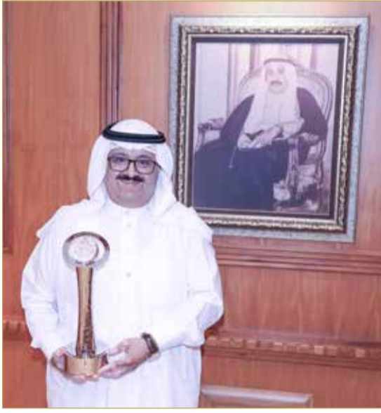
الدوسري حاملاً جائزة منتدى الإعلام الرياضي العربي لأفضل منصة رياضية رقمية عربية

- لا يوجد لدي نادٍ محلي أو عالمي أشجعه، ليس من باب الالتزام بالحياد بسبب تراسي موقع كووورة؛ وإنما لأنني أتابع كرة القدم من أجل المتعة، ولكنني بكل تأكيد أعشق منتخب بلادي البحرين.