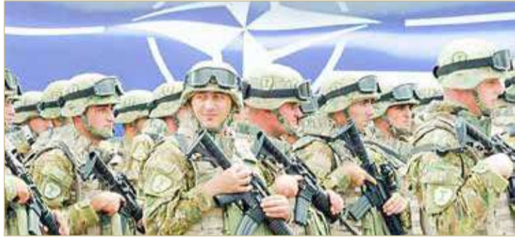
الناتو يبدأ تدريبات لاختبار منظومته لردع النووي