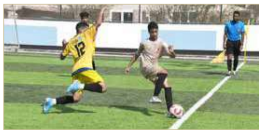
بطولة دوري ناصر بن حمد للمدارس

حقق فريق مدرسة الهداية الخليفية وفريق معهد الشيخ خليفة بن سلمان للتكنولوجيا انطلاقاً ناجحة في المجموعة الثالثة لبطولة ناصر بن حمد لكرة القدم للمرحلة الثانوية للبنين للمدارس الحكومية والخاصة للعام الدراسي الجاري 2022-2023 والتي تقام برعاية بلائيمية من بنك البحرين الوطني والراعي الذهبي شركة البحرين للسينما، إذ ضرب فريق الهداية بقوة وحقق انتصاراً كبيراً للغاية على مدرسة البحرين الخاصة بلغ 14 هدفاً مقابل هدف واحد، بينما معهد الشيخ خليفة دشن مشواره بالفوز على مدرسة النسيم الخاصة برعاية نظيفة، وبالتالي حصد الهداية والمعهد أول 3 نقاط والصدارة للهداية بفارق الأهداف، بينما بقي النسيم والبحرين بلا نقاط، والأمور في المجموعة توجي مبركاً بأفضلية الهداية والمعهد في بلوغ الدور الثاني.