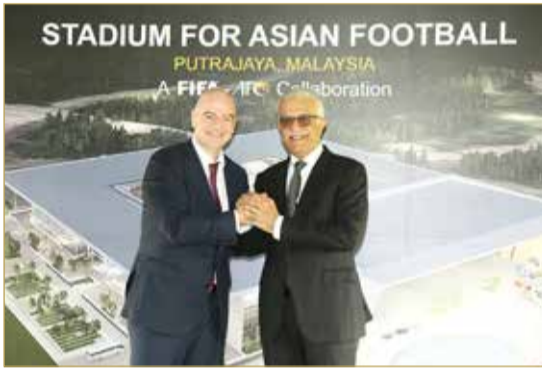
سلمان بن إبراهيم وانفانتينو خلال الإعلان عن المشروع

صحافيين وغرفة للمعلقين، إلى جانب نافورة مياه في مدخل الملعب. ويقع الاستاد على بعد 30 كيلومتراً من مقر الاتحاد الآسيوي لكرة القدم في كوالالمبور، حيث سيتم تشييده على أرض مساحتها 15.43 هكتار، وسيكون مجهزاً بالكامل بمنصة للجماهير وميدان للجري ومنصة ومكاتب إدارية وموقف للسيارات تحت الأرض.