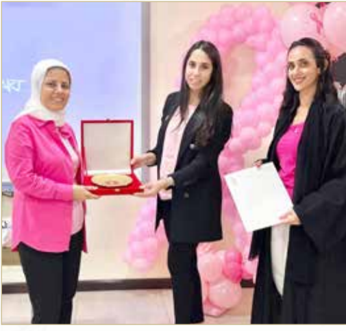
جانب من الفعالية

من الإحصائيات والمعلومات وذلك بهدف التوعية. وفي ختام المحاضرة، تم إهداء درع اللجنة الأولمبية تقديراً لمستشفى الهلال والمراكز الطبية على تعاونهم في تنظيم هذه المحاضرة التوعوية والتي كان لها أبلغ الأثر الطيب لدى موظفات اللجنة الأولمبية.