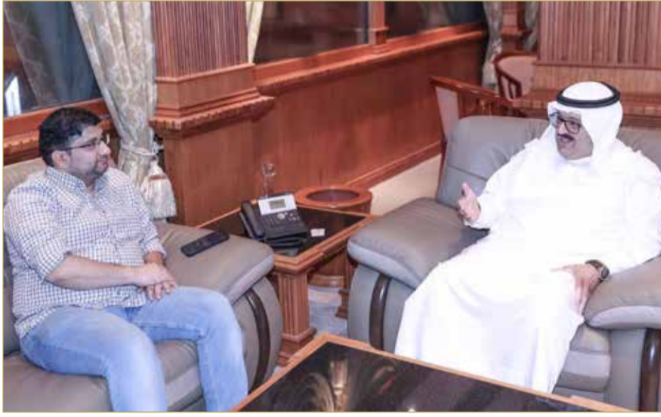
الدوسري متحدثاً لـ"البلاد سبورت"

« جمعك اجتماع رسمي مع وزير الإعلام رمزان النعيمي فهل سيكون هناك تعاون تآلفي؟