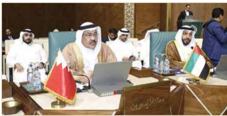
رئيس مركز الملك حمد للتعايش يشارك في المؤتمر الدولي رفيع المستوى بالفاهرة

كل مكان؛ ليكونوا سفراء التسامح للعالم، وأوصى رئيس المركز الدولي للتعايش والتعليمية وتطوير المناهج في كافة المراحل لخلق جيل يحمل قيم التسامح والتعايش وقبول الاختلافات بالإضافة إلى إصدار تشريعات جديدة أو مراجعة التشريعات القائمة فيما يخص التسامح ومحاربة الكراهية، مع اعتبارات التطور التقني والإعلامي. كما دعا إلى تضمين الدول سياسات معنية بالتسامح والسلام محليا ودوليا، مع ضرورة استحداث قطاع أو فرع في جهاز الأمانة العامة لجامعة الدول العربية معني بشؤون التسامح والتعايش السلمي، وتعيين مبعوث خاص يتولى مهامه.