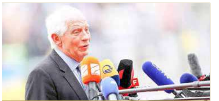
بوريل: أوروبا حديقة والعالم الآخر أدغال