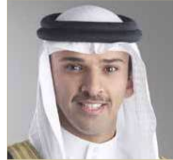
الشيخ علي بن خليفة

وأعرب سعادة الشيخ علي بن خليفة بن أحمد آل خليفة عن تقديره الكبير لحرص الشركة على الحفاظ على شراكتها الفاعلة في هذا القطاع، موضحاً أن إسهام الشركة في دعم منافسات دوري وكأس كرة القدم بالمملكة متواصل منذ سنوات طويلة. ومن جهته، أعرب رئيس مجلس إدارة شركة بتلكو الشيخ عبدالله بن خليفة آل خليفة عن اعتزازه بدعم شركة بتلكو لمسابقة كأس جلالة الملك المعظم ومسابقات دوري ناصر بن حمد الممتاز لكرة القدم والإسهام في نجاحهما، حيث يأتي ذلك بالتماشى مع إستراتيجية الشركة