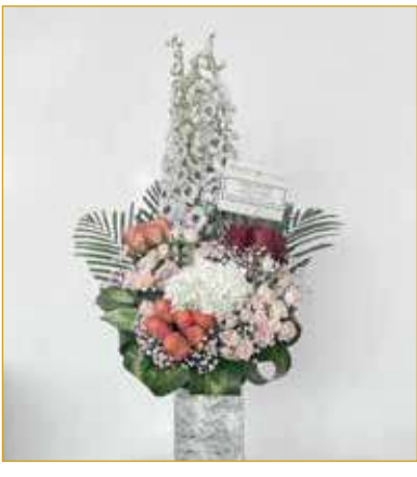
تهنئة سفير دولة فلسطين

السنة الخامسة عشرة - العدد 5118 الأربعاء 19 أكتوبر 2022 - 23 ربيع الأول 1444