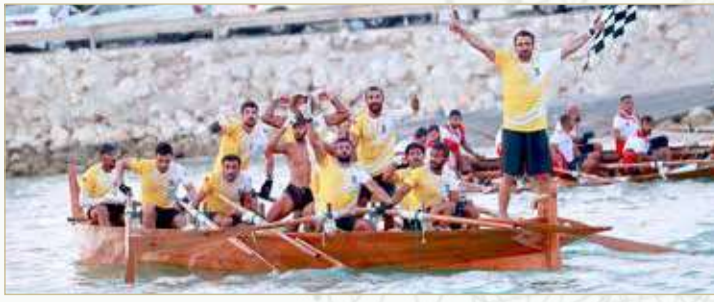
الرفاع - لجنة الموروث

ويأتي السباق على كأس سمو الشيخ خالد بن حمد آل خليفة ضمن افتتاح موسم ناصر بن حمد لرياضات الموروث البحري في نسخته الخامسة، حيث أقيم السباق وسط تنافس كبير بمشاركة 16 فريقاً تمكن 13 منهم من إنهاء السباق بنجاح. ويقام الأسبوع المقبل سباق قوارب التجديف الشعبي على كأس ممثل جلالة الملك للأعمال الإنسانية وشؤون الشباب رئيس المجلس الأعلى للشباب والرياضة سمو الشيخ ناصر بن حمد آل خليفة.