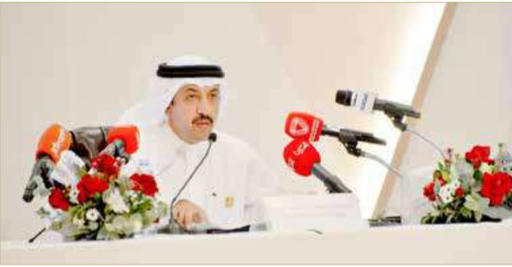
مؤتمر صحفي لوكيل وزارة الخارجية للشؤون السياسية

أورسولا فون دير لاين خطاباً رئيساً لللمة التي ستشهد حضور كبار صانعي السياسات في العديد من دول العالم، مشيراً إلى الاعتزاز بمشاركة وزارة الخارجية في تنظيم هذا الحدث. وفي الوقت ذاته، نوه بالنجاح الفائق الذي حققه معرض البحرين الدولي للطيران في نسخته السادسة، والذي عزز مكانة مملكة البحرين على الخارطة العالمية للاستثمار في قطاع الطيران، مضيفاً أن المعرض يُعبر عن ما وصلت إليه مملكة البحرين من نهضة قومية وحضارية ومشاركة دولية لافتة وحضور جماهيري مميز. وأشار إلى ما شهدته مملكة البحرين من نجاح سير العملية الانتخابية بمقار البعثات الدبلوماسية وقنصليات مملكة البحرين بالخارج، والتي نُظمت منتصف الأسبوع الجاري، وحظيت بمشاركة مشرفة، متوجهاً بالشكر إلى اللجنة العليا للإشراف على سلامة الانتخابات برئاسة وزير العدل والشؤون الإسلامي والأوقاف نواف المععودة، وإلى اللجنة التنفيذية للانتخابات، على التعاون المتمر مع وزارة الخارجية لتمكين المواطنين من ممارسة حقوقهم السياسية في انتخاب أعضاء مجلس النواب بنزاهة وشفافية تامة في 37 سفارة وقنصلية وبعثة دبلوماسية وإشراف قضائي كامل، مبيهاً أن رؤساء البعثات الدبلوماسية والقنصليات بالخارج والدبلوماسيين والإداريين بالإضافة إلى غرفة العمليات بوزارة الخارجية قد قاموا بدور مشهود ومميز من أجل ضمان سير العملية الانتخابية بكل يسر وشفافية.