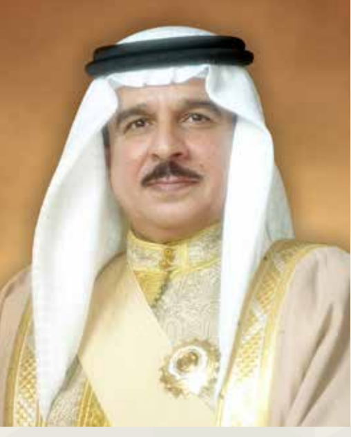
جلالة الملك المعظم

ومستقبل وطنهم في الاستحقاقات الانتخابية وعبر المؤسسات الدستورية. وأكد جلالتة أن نهج الشورى سيبقى بالمشاركة في العملية الديمقراطية من قبل ممثلي شعب البحرين، والذين تم اختيارهم من قبل أهل البحرين في انتخابات حرة ونزيهة ومباشرة، وسيظل هذا نهج حياة وعمل لمملكة البحرين وأهلها، وأن المسيرة مستمرة ومتواصلة بإذن الله بزعامة صادقة وإرادة راسخة لتحقيق كل الأهداف الخيرة المباركة وبناء مستقبل أفضل لأجيالنا القادمة.