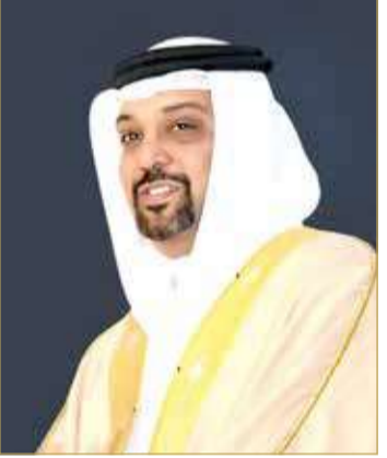
الشيخ سلمان بن خليفة

تقرير جودة خدمات المطارات الصادر من مجلس المطارات الدولي عن فئة "المساعدة والتعاون في خدمة المسافرين"، لافتاً إلى أن مملكة البحرين تسطر يوماً بعد يوم قصص نجاح بارزة بإرادة وعزيمة فريق البحرين وما تبذله الكوادر الوطنية من جهود طيبة ومشهودة لاستضافة الفعاليات والأحداث العالمية، ما مكن المملكة لأن تكون وجهة متميزة وجاذبة لمعارض الطيران في المنطقة في ظل الرؤية الاقتصادية الطموحة للمملكة.