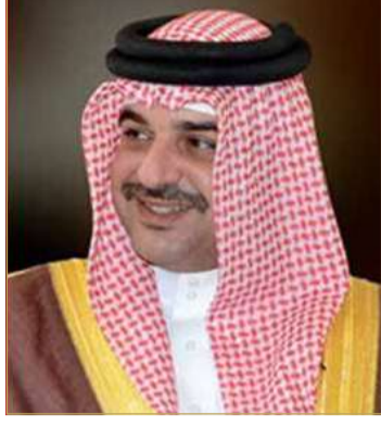
سمو الشيخ عبدالله بن حمد

التنفيذيين من شركات الطيران العالمية وكبار الشخصيات من القطاعين العام والخاص، كما تم عرض ما يقارب 100 طائرة من مختلف أنواعها التجارية والعسكرية في العرض الثابت والعرض الجوي، من بينها طائرات عسكرية من سلاح الجو الملكي البحريني، وشركة طيران الخليج، وسلاح الجو الملكي السعودي (صقور السعودية)، وسلاح الجو الإماراتي (فرسان الإمارات)، والقوات الجوية البحرية الأمريكية، وفريق غلوبال ستارز البريطاني، وفريق سهام الحمراء red arrows التابع لسلاح الجو الملكي البريطاني، والقوات الجوية الباكستانية، حيث قدمت هذه المشاركات عروضًا باهرة حظيت بإعجاب جميع الحضور.