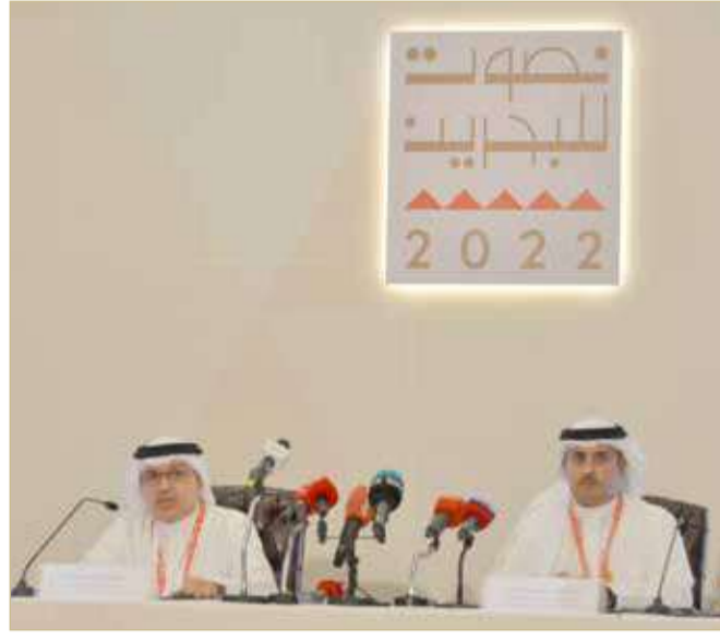
مؤتمر صحفي لوزير العدل والشؤون الإسلامية