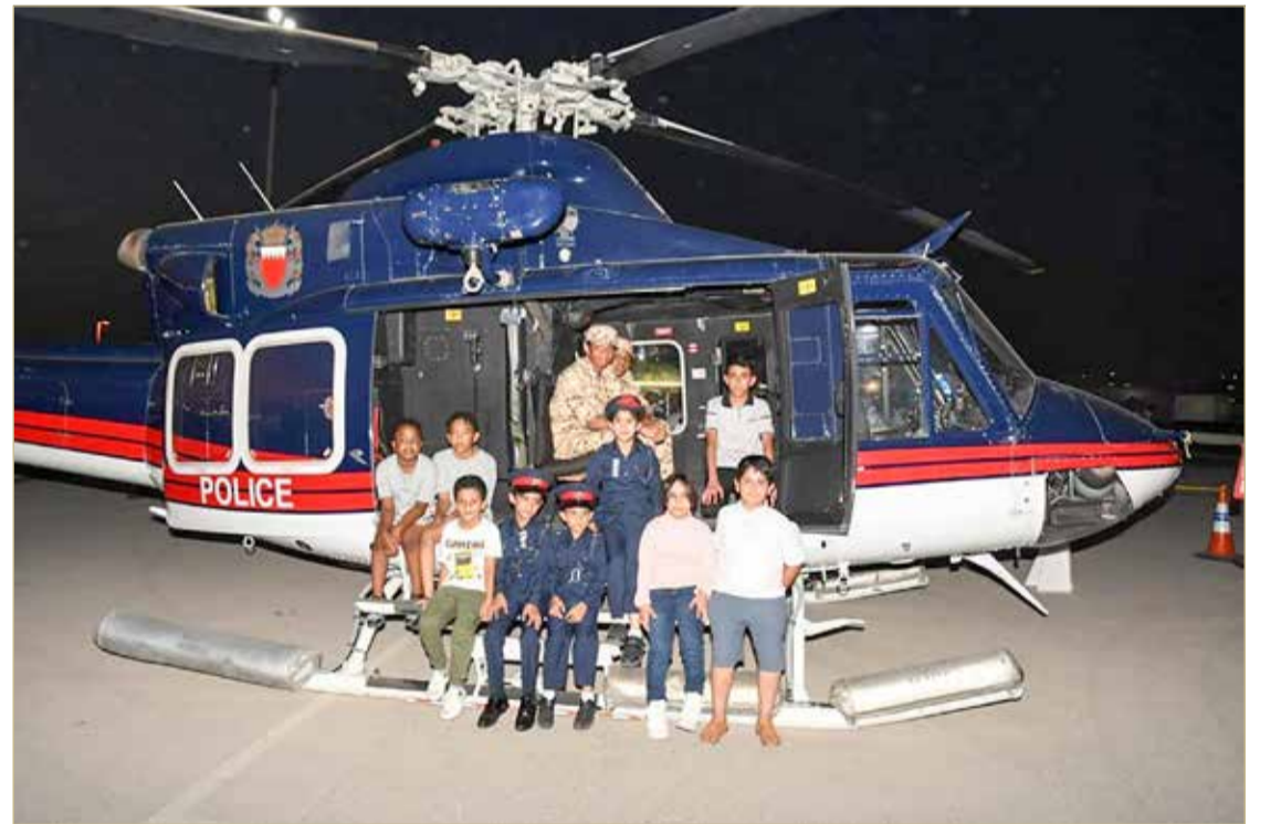
المنامة - بنا

أكد مدير الجهاز الإداري للصندوق الملكي لشهداء الواجب الشيخ خالد بن سلمان بن خالد آل خليفة الحرس على مواصلة تنفيذ توجيهات ولي العهد رئيس مجلس الوزراء صاحب السمو الملكي الأمير سلمان بن حمد آل خليفة، رئيس الهيئة العليا للصندوق الملكي لشهداء الواجب، بأن تحظى شؤون أسر الشهداء بكل الاهتمام والمتابعة تقديراً للتضحيات التي قدمها شهداء الواجب في سبيل الدفاع عن الوطن تلبيةً لنداء الحق. جاء ذلك بمناسبة تنظيم الصندوق الملكي لشهداء الواجب زيارة لأسر الشهداء وذويهم إلى معرض البحرين الدولي للطيران في نسخته السادسة بقاعدة الصخير الجوية، حيث لفت الشيخ خالد بن سلمان بن خالد آل خليفة إلى أن الجهاز الإداري للصندوق يحرص على تعزيز التواصل مع أسر شهداء الواجب