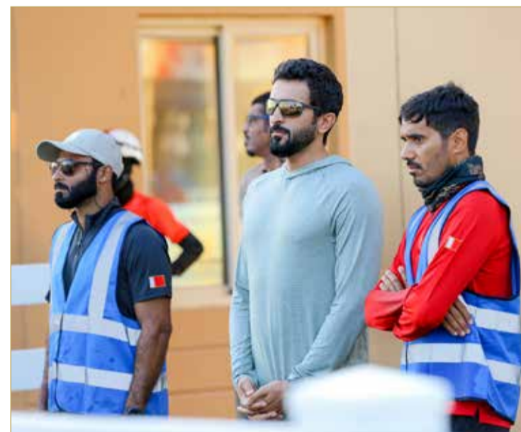
تغطية - اللجنة الإعلامية

بحضور ممثل جلالة الملك للأعمال الإنسانية وشؤون الشباب الرئيس الفخري للاتحاد الملكي للفروسية وسباقات القدرة سمو الشيخ ناصر بن حمد آل خليفة، توج سمو الشيخ عيسى بن عبدالله آل خليفة رئيس الاتحاد الملكي، الفارس عاصم عبدالواحد من فريق الزعيم بالمركز الأول وكأس سباق 120 كم دولي في ثاني سباقات الموسم الجديد 2022 / 2023 الذي نظمه الاتحاد الملكي للفروسية وسباقات القدرة بمشاركة واسعة من الفرسان والاستقطبات في قرية البحرين الدولية للقدرة.