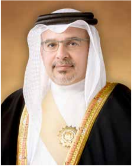
سمو ولي العهد رئيس الوزراء