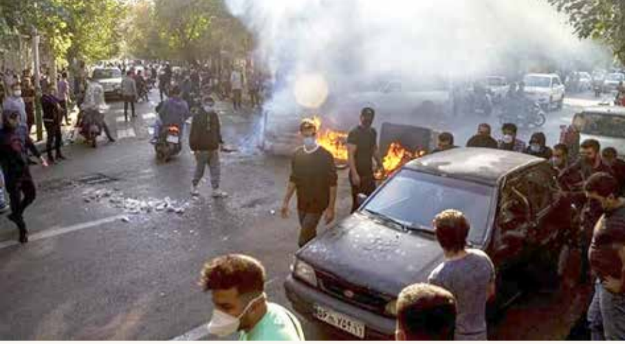
حملة قمع عنيفة في زاهدان الإيرانية

مع تصاعد الاحتجاجات في إيران منذ وفاة الشابة الكردية مهسا أميني، في 16 سبتمبر الماضي، أطلقت قوات الأمن النار أمس (الجمعة) نحو متظاهرين في مدينة زاهدان، مركز محافظة سيستان وبلوشستان جنوب شرقي البلاد، وفق "إيران إنترناشيونال". كما انطلقت تظاهرات في مدينة تشابهار بالمحافظة، إذ ردد المحتجون هتافات مناوئة للمرشد علي خامنئي. ومع استمرار عنف القوى الأمنية ضد المحتجين في إيران، حذر عشرات الأطباء في البلاد من إطلاق الرصاص الحي. وفي رسالة وجهها 140 اختصاصياً في طب العيون إلى جمعية طب العيون الإيرانية، أكدوا أن عدداً كبيراً من المتظاهرين فقدوا إحدى العينين أو كليهما، بسبب إصابتهم برصاص الصيد خلال الاحتجاج. كما طالب الأطباء بتحذير المسؤولين في البلاد من أضرار لا تعوض، تترتب على الإصابات، بحسب ما أفادت شبكة "إيران إنترناشيونال". إلى ذلك، أعلن قائد القوات البرية في الحرس الثوري إرسال وحدات مدعزة وقوات خاصة إلى عدد من المناطق الكردية؛ بهدف "منع تسلسل إرهابيين" من العراق المجاور، وفق زعمه. وقال الجنرال محمد باكور إن "بعض الوحدات