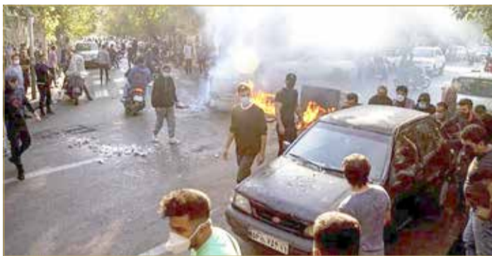
حملة قمع عنيفة في زاهدان الإيرانية

وأنت النصيحة بعد أن استهدف الحرس خلال هذا الأسبوع، مرتين بالصواريخ والمسيّرات المفخخة قواعد تابعة للمعارضة الإيرانية الكردية المتمركزة منذ الثمانينات في كردستان العراق. (06)