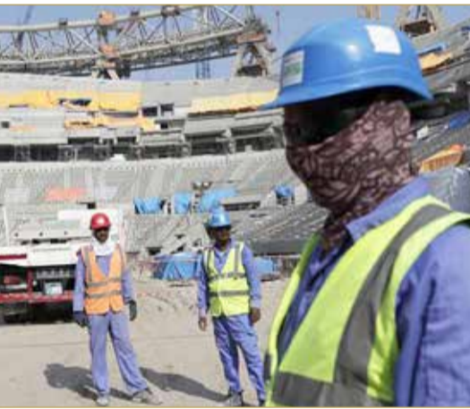
عمال وافدون يشاركون في بناء منشآت "موندリアル قطر" (أرشيفية)

جميع ضحايا الاستعدادات لكأس العالم، ومع وجود ما يقدر بأكثر من مليوني مواطن أجنبي يشكلون حوالي 94% من القوى العاملة في البلاد، رحب القرار بأن الحكومة القطرية، ووفقاً لمنظمة العمل الدولية، سددت 320 مليون دولار لضحايا الانتهاكات من خلال "صندوق دعم وتأمين العمال". ولكن أعضاء البرلمان الأوروبي عبروا عن أسفهم باستبعاد العديد من العمال في قطر وعائلاتهم من التعويض، داعين إلى توسيع نطاق الصندوق ليشمل جميع المتضررين منذ بدء العمل في منشآت كأس العالم، بحيث يغطي أيضاً وفيات العمال وغيرها من انتهاكات حقوق الإنسان.