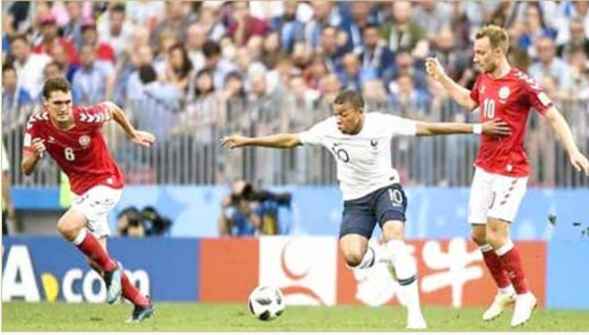
من مباراة فرنسا والدنمارك

تكتسب مواجهة فرنسا حاملة اللقب والدنمارك طابع الأثر في سعي "الديوك" لتعويض سقوطهما مزيّن أمام المنتخب الإسكندنافي في دوري الأمم الأوروبية، ضمن منافسات الجولة الثانية للمجموعة الرابعة في مونديال قطر لكرة القدم. واستهل المنتخب الفرنسي حملة الدفاع عن لقبه بفوز كبير على أستراليا 4-1 على استاد الجنوب في الوكرة، في حين فرضت تونس تعادلاً سلبياً ثميناً على الدنمارك في استاد المدينة التعليمية في الدوحة. وتملك فرنسا التي تحتل الصدارة (3) فرصة بلوغ الدور الثاني باكراً في حال الفوز على الدنمارك، في حين ان تعادل تونس مع