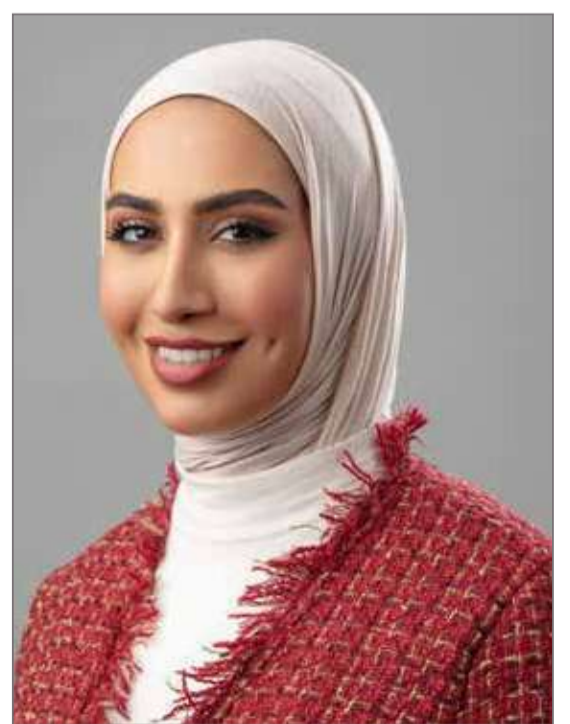
مديرة الامتثال بشركة "بنفـت"

تنظر مملكة البحرين بعين الاعتبار والاهتمام للمرأة البحرينية.. ما أثر ذلك على مساهمة المرأة في المجتمع البحريني؟ لذلك أثر كبير في تمكين وتقدم المرأة البحرينية، عبر التركيز على إبراز دور المرأة الفعال والأساسي في المجتمع البحريني. وكوني جزءاً من هذا المجتمع فأنتي أعز بالاهتمام الكبير الذي توليه القيادة الرشيدة وصاحبة السمو الملكي الأميرة سبيكة بنت إبراهيم آل خليفة رئيسة المجلس الأعلى للمرأة لدعم وتمكين المرأة البحرينية في مختلف المجالات والأصعدة، وما تقلدته المرأة البحرينية من مناصب ومسؤوليات سواء محلياً أو دولياً لهو دليل واضح الأثر على هذه المساهمة. ماذا أضاف لك العمل في شركة مرموقة كشركة بنفـت؟ عملي في "بنفـت" أضاف لي الكثير، لا سيما مع الدور البارز والرئيسي الذي تلعبه الشركة لخدمة مملكة البحرين ومساندة رؤية البحرين الاقتصادية 2030. وسعيدة بوجودي كجزء مهم من الفريق الإداري بمجلس إدارة الشركة. وما يميز شركة بنفـت على وجه الخصوص هو بيئة العمل المناسبة للمرأة، إذ