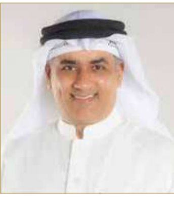
النائب ممدوح الصالح

الهمم ضمن المجتمع خاصة على صعيد التعليم والصحة، وحرصت على تسهيل وتوفير الخدمات ضمن بنية تحتية تمثل بيئة صديقة تراعي احتياجاتهم. ولفت الصالح إلى أن مملكة البحرين بمختلف قطاعاتها الحكومية والخاصة والأهلية تحرص على النهوض بفضة "ذوي الهمم"، والارتقاء بمستوى الخدمات المقدمة لهم، والحرص على صون حقوق جميع المواطنين دون إغفال هذه الفئة المهمة، مشيداً بدور الشراكة المجتمعية الفاعلة في إدماجهم بالمجتمع من خلال المشروعات والبرامج المختلفة، بما يبرهن على مستوى الوعي في الشارع البحريني بجميع فئاته وقطاعاته. وقال الصالح إن هناك مساعي جادة لتطوير المنظومة التشريعية واستحداث المزيد من القوانين التي من شأنها الارتقاء بأوضاع هذه الفئة العزيرة والحفاظ على المكتسبات التي تحققت بفضل الجهود الوطنية الصادقة، والعمل على مراجعة وتعديل معايير صرف مخصصات دعم