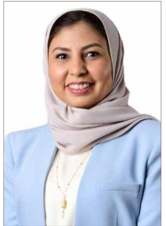
المدير المساعد لمركز البحرين للمعلومات الائتمانية في "بنفـت"

تنظر مملكة البحرين بعين الاعتبار والاهتمام للمرأة البحرينية.. ما أثر ذلك على مساهمة المرأة في المجتمع البحريني؟ المرأة البحرينية متميزة في مختلف المجالات والقطاعات سواء في المجالات المجتمعية أو العملية، مثلما كانت سباقة في التعليم والصحة والقطاعات المصرفية، واليوم تواصل المرأة تميزها في القطاعات الحديثة وعلوم المستقبل، ونرى أثر ذلك في قيادتها لتلك القطاعات، وذلك استناداً لرؤية قرينة جلالة الملك المعظم رئيسة المجلس الأعلى للمرأة صاحبة السمو الملكي الأميرة سبيكة بنت إبراهيم آل خليفة، إذ امتازت المؤسسات الحكومية والخاصة بتحقيق تمكين المرأة وإشراكها في مناصب قيادية عالية باعتبارها جزءاً لا يتجزأ من المجتمع العملي في مملكة البحرين. ماذا أضاف لك العمل في شركة مرموقة كشركة بنفـت؟ عملي في "بنفـت" أضاف لي الكثير، لا سيما مع الدور البارز والرئيسي الذي تلعبه الشركة لخدمة مملكة البحرين ومساندة رؤية البحرين الاقتصادية 2030. وسعيدة بوجودي كجزء مهم من الفريق