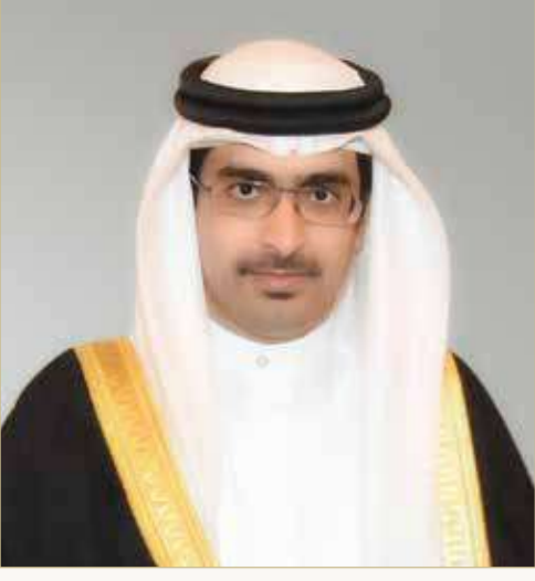
سمو الشيخ خليفة بن علي آل خليفة