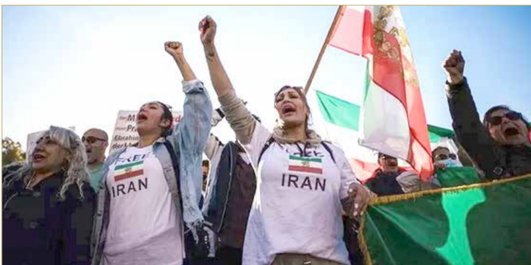
خرجت مظاهرات حول العالم دعماً للحراك في إيران

تظاهرة نسائية نادرة في زاهدان.. وكندا توسع عقوباتها ضد النظام