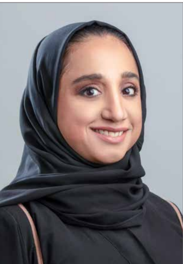
رئيس خدمات المدفوعات في "بنفـت"