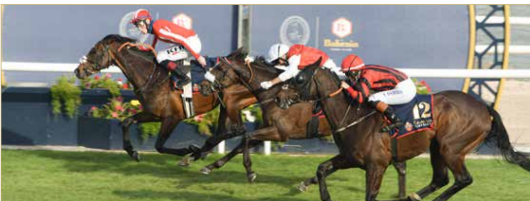
لقطة من سباقات البطولة الدولية الأولى

عالميين بما يساهم في تعزيز مكانة مملكة البحرين على خريطة سباقات رياضة الخيل العالمية، كما تشكل هذه البطولة الدولية إضافة مميزة وداعمة لتطوير السباقات المحلية الموسمية التي ينظمها نادي راشد من مختلف النواحي، بجانب الاستفادة من ذلك في توفير فرص الاحتكاك للمدربين والفرسان البحرينيين ورفع مستوياتهم. وتشتمل بطولة البحرين الدولية على سلسلة من السباقات عبر 10 أشواط مخصصة للخيل المصنفة من "84 إلى 100"، وستقام على سباقات متفرقة الصغير: نادي راشد للفروسية وسباق الخيل ستكون مملكة البحرين مجدداً محط الأضواء في عالم سباقات الخيل، حيث سيشهد ظهر اليوم الجمعة انطلاق سباقات النسخة الثانية من بطولة البحرين الدولية لسباق الخيل "برعاية بنك البحرين والكويت وسايا كورب" والتي ينظمها نادي راشد للفروسية وسباق الخيل على مضمار سباق النادي وبمشاركة ملاك ومدربين وجياد من مختلف أنحاء العالم وذلك ضمن السباق التاسع للخيل لهذا الموسم. ويأتي تنظيم بطولة البحرين الدولية لسباق الخيل على أثر النجاحات