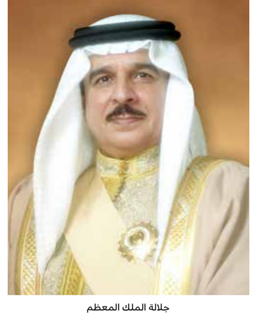
جلالة الملك المعظم

المنامة - بنا أعلن الديوان الملكي أن ملك البلاد المعظم صاحب الجلالة الملك حمد بن عيسى آل خليفة، سيغادر أرض الوطن اليوم (الجمعة)، متوجهاً إلى المملكة العربية السعودية إلى الشقيقة ليتراءى وفد مملكة البحرين إلى اجتماع الدورة الثالثة والأربعين للمجلس الأعلى لمجلس التعاون لدول الخليج العربية.