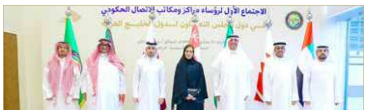
المشاركون بالاجتماع الأول لرؤساء مراكز الاتصال الخليجية

المناسبات الخليجية والعربية والإسلامية والعالمية، وتحديد قوائم الفعاليات المشتركة، وتفعيل التعاون والعمل المشترك فيما يتعلق بالتدريب في مجالات العمل الإنتاجي والإبداعي، وتشكيل فريق عمل لإعداد تصور لاستدامة أعمال التواصل الحكومي المشترك.