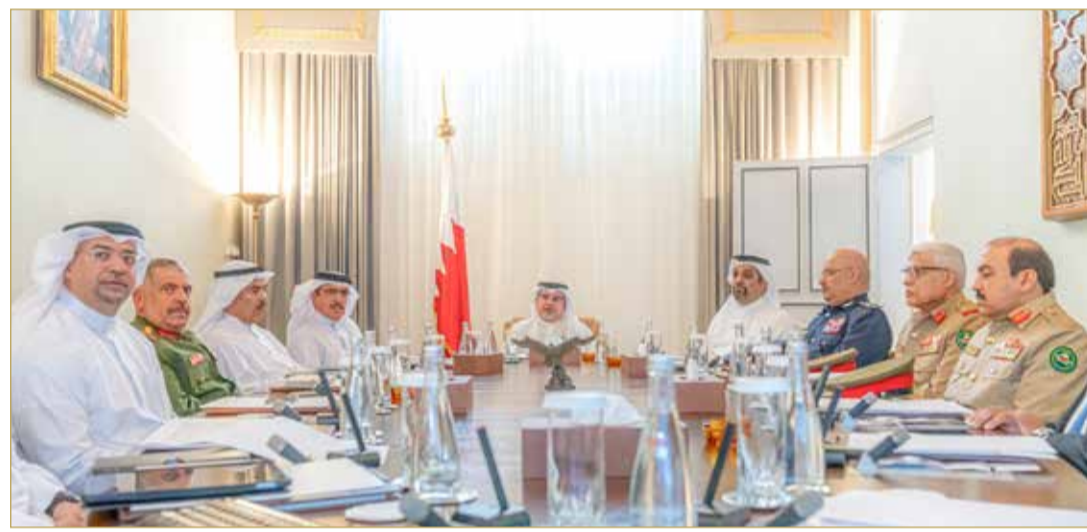
سمو ولي العهد رئيس مجلس الوزراء يترأس اجتماع الهيئة العليا للصدوق الملكي لشهداء الواجب

من خلال مواقفهم النبيلة أروع الأمثلة في حب الوطن والإخلاص له. (02)