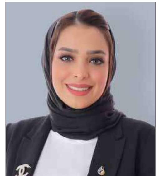
مدير أول التأمينات العامة

تحظى بالفرص المتكافئة وتصف فجر شعورها بما تشهده البحرين من تميز على صعيد تمكين المرأة بالإشارة إلى جهود صاحبة السمو الملكي الأميرة سبيكة بنت إبراهيم آل خليفة قريبة جلالة العاهل المعظم رئيسة المجلس الأعلى للمرأة التي شجعت المرأة وقدمت كل الفرص والخطط والبرامج التي تكون ثمارها الارتقاء بمكانة