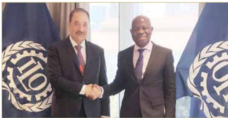
وزير العمل بلنقي المدير العام لمنظمة العمل الدولية

بما قامت به المملكة من جهود لتفادي الآثار السلبية لجائحة (كوفيد - 19) على سوق العمل وحرصها على تحقيق الدعم المالي والاقتصادي والاجتماعي لجميع العاملين في البحرين.