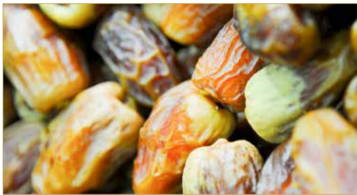
المشروع بعد أحد المشروعات الإستراتيجية للأمن الغذائي (ارشيفية)

واستبدال الأقطاب الكهربائية لمولدات غاز الأوزون بمحطة المعالجة الثلاثية في محطة توبلي، لمعالجة مياه الصرف الصحي تقدّمت إليها شركة وحيدة هي شركة أكوا لنقل التكنولوجيا بنحو 1.4 مليون دينار. (19)