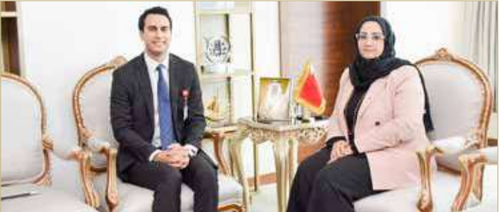
صاحب السمو الملكي الأمير سلمان بن حمد آل خليفة. العوضي، من منتسبي الدفعة السابعة من برنامج رئيس مجلس الوزراء لتنمية الكوادر الحكومية. جاء ذلك خلال استقبالها، محمد

المنامة - وزارة الصحة أكدت وزيرة الصحة جليدة السيد أهمية برنامج رئيس مجلس الوزراء لتنمية الكوادر الحكومية في إعداد الكوادر الوطنية وتمكينهم من المساهمة في تطوير الأداء الحكومي بما يدعم المسيرة التنموية الشاملة بقيادة ملك البلاد المعظم صاحب الجلالة الملك حمد بن عيسى آل خليفة، مثنئةً مخرجات البرنامج التي تعكس رؤى ولي العهد رئيس مجلس الوزراء