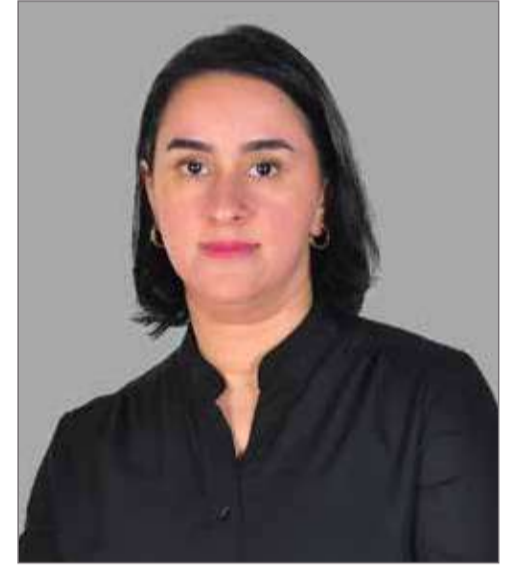
مدير الموارد البشرية والشؤون الإدارية

الحصول على فرصة النجاح ومن المهم الإشارة إلى أن برامج التوازن بين الجنسين وتكافؤ الفرص أصبحت موضع اهتمام الكثير من القطاعات، بل إن الكثير من المؤسسات على اختلاف تخصصها تسعى لمواكبة تمكين المرأة في إطار خطط عمل