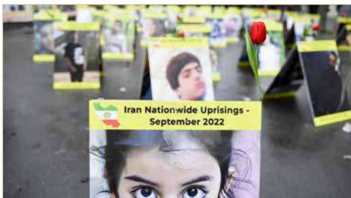
لافات عليها صور ضحايا حملة القمع في إيران أثناء اعتصام في باريس

شخصاً عدد المحكوم عليهم بالإعدام في إيران على خلفية الاحتجاجات، في إطار ما وصفتها منظمة العفو الدولية بأنها "محاكمات صورية". (14)