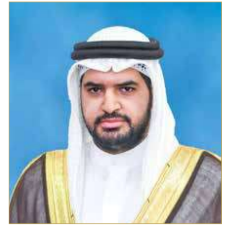
سمو الشيخ عيسى بن علي آل خليفة