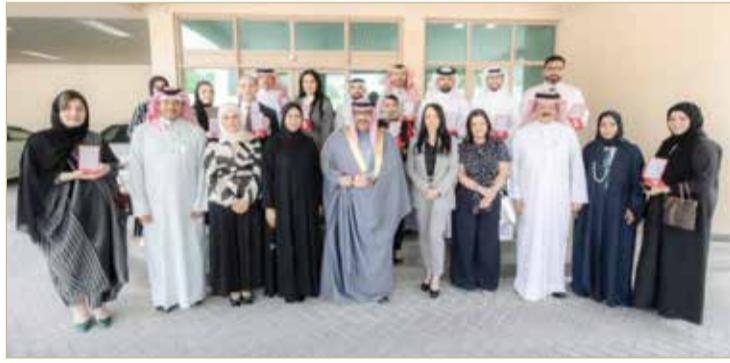
وزير التربية سلم منتسبي الوزارة وسام الأمير سلمان بن حمد للاستحقاق الطبي

شكره وتقديره لجهودهم المخلصة التي يبذلونها في خدمة الوطن، ونموها بأهمية مواصلة المساعي نحو تحقيق المزيد من المكتسبات المثمرة وبما يعود بالخير والنماء لصالح الجميع، وامتنباً لهم وللجميع دوام التوفيق والنجاح. من جانبهم، أعرب منتسبو وزارة التربية والتعليم الذين تسلموا وسام الأمير سلمان بن حمد للاستحقاق الطبي، عن بالغ الفخر والاعتزاز بهذا التكريم السامي، مؤكداً أن هذا الوسام يُعد دافعاً لهم لمواصلة العمل وبذل المزيد في خدمة مملكة البحرين ودعم تقدمها.