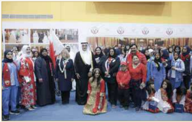
جمعية "هذه هي البحرين" تطلق مهرجانها بمناسبة الأعياد الوطنية