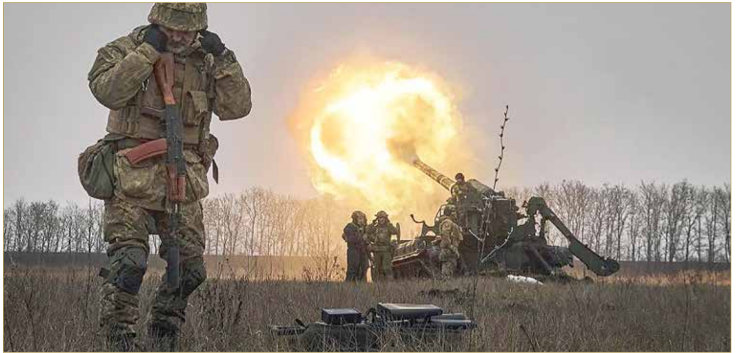
روسيا تعلن تحقيق تقدم كبير في نزع سلاح أوكرانيا

ألكسندر دارتشيف، إن على سفيرة واشنطن الجديدة لدى موسكو لين تزيبي عدم التدخل في شؤون بلاده "بحجة العمل مع المجتمع المدني". من جهته، أكد المتحدث باسم الكرملين، دميتري بيسكوف، أنه لا توجد أي اتصالات مع الولايات المتحدة بشأن عقد لقاء بين الرئيسين فلاديمير بوتين وجو بايدن. (08)