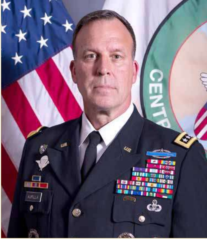
الجنرال مايكل إيريك كوربلا

شراكتنا مع حلفائنا قائمة على القيم ما يجعلنا الشريك المفضل في المنطقة