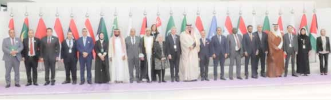
وزير شؤون مجلس الوزراء لدى مشاركته في أعمال الدورة العادية الرابعة للمجلس العربي للسكان والتنمية

مرت بها الدول خلال جائحة فيروس كورونا (كوفيد-19) وكيفية التعافي منها على مستوى السياسات والبرامج السكانية، بالإضافة إلى المراجعة الإقليمية الثانية لإعلان القاهرة للسكان والتنمية 2013 والتي تنفذ بالشراكة مع اللجنة الاقتصادية والاجتماعية لغربي آسيا (الإسكوا) وصندوق الأمم المتحدة للسكان.