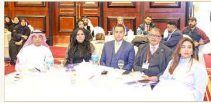
جانب من الحضور في الحلقة النقاشية

بذكر أن الندوة ناقشت 3 محاور رئيسية في مقدمتها الوساطة في المنازعات المدنية ثم في المسائل الشرعية وأخيراً الوساطة في المنازعات الجنائية.