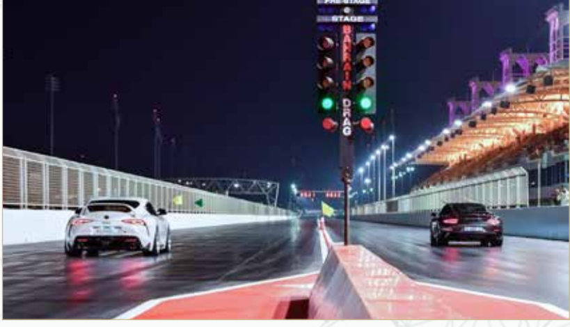
فعالية من فعاليات الحلبة، يتم اتباع معايير السلامة على أعلى مستوى في جميع الأوقات في الفعاليات للسائقين والمشاهدين على حد سواء.