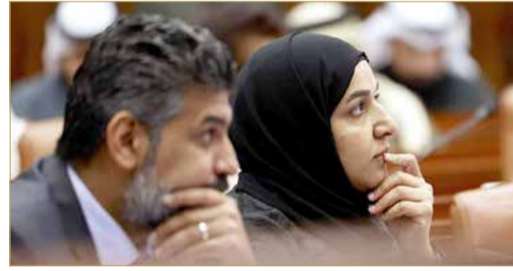
السيد والفردان وتفكير عميق

البلاد صوت أعضاء مجلس النواب بالموافقة على طلب لجنة دراسة برنامج الحكومة بشأن تمديد عمل اللجنة لمدة عشرة أيام من تاريخ انتهاء المدة الأولى والمنقضية يوم الجمعة الموافق 30 ديسمبر 2022 بقصد استكمال دراسة برنامج الحكومة وإعداد تقرير بشأنه وبناء على ذلك وافق المجلس على تمديد المدة إلى 10 أيام وبناء عليه تم تمديد المدة.