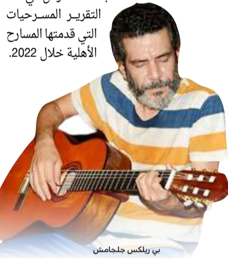
بي ريلكس جلامش

لقد حفل العام 2022 بحراك مسرحي جاد متميز وسعت المسارح الأهلية إلى تحقيق ما هو أكمل وأجمل على الدوام وكذلك التجديد والأصالة في الإنتاج، فمسارح حقت الجوائز الدولية، وأخرى تفتحت عندها الأزهار وارتفعت البناء "البلاد" تستعرض في هذا التقرير المسرحيات التي قدمتها المسارح الأهلية خلال 2022.