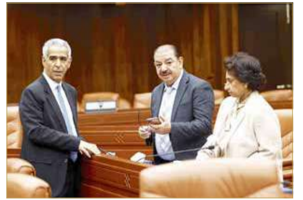
التقدميون على هامش الجلسة