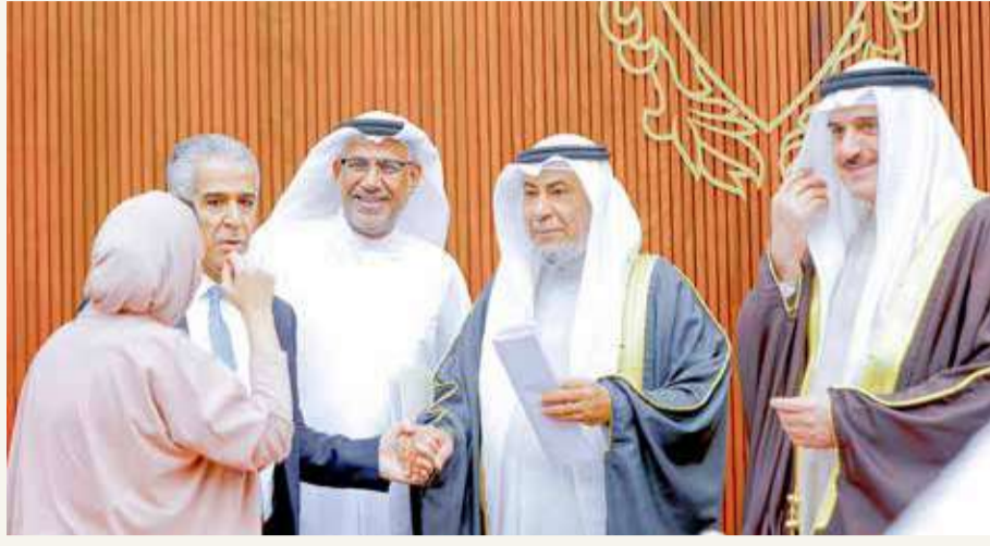
منصة الرئاسة بعد رفع الجلسة

البلاد عقد مجلس النواب صباح أمس جلسته الثالثة إلا أن اللافت هو أن الجلسة عقدت في مدة لا تتجاوز 10 دقائق عبر تمرير 7 بنود واستدراك واحد.