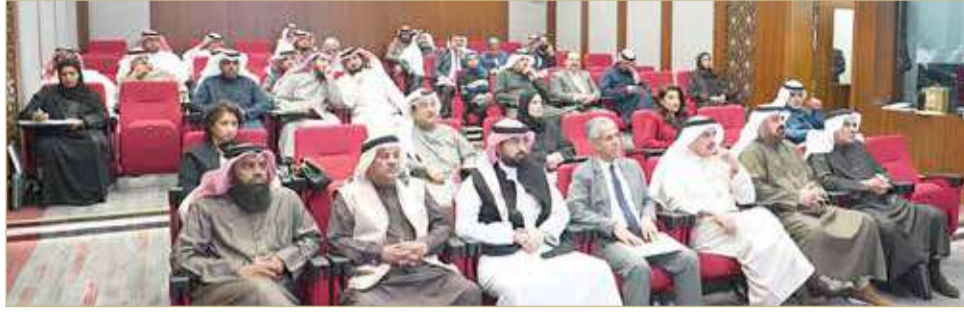
جانب من لقاء النواب