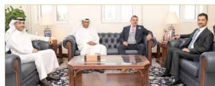
المنامة - وزارة شؤون البلديات والزراعة

أكد وزير شؤون البلديات والزراعة وائل المبارك، أن القطاع الخاص يعد شريكاً أساسياً في مجال صناعة الأمن الغذائي، وأن الفرص الاستثمارية في مملكة البحرين واعدة ومن الممكن الاستفادة منها في تطوير الصناعات الغذائية والإسهام في مجال الأمن الغذائي بما يحقق الأهداف الإستراتيجية في هذا المجال.