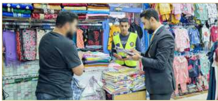
ضاحية السيف - هيئة تنظيم سوق العمل

المخالفين من أصحاب العمل والعمال. وقالت الهيئة إن الحملتين التفتيشيتين التي قامت بها أسفرتا عن رصد عدد من المخالفات التي تتعلق بأحكام قانون هيئة تنظيم سوق العمل وقانون الإقامة بمملكة البحرين، واتخاذ الإجراءات القانونية بشأنها.