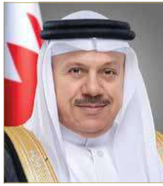
عبد اللطيف الزياتي

جرت اتصال هاتفي أمس بين وزير الخارجية عبد اللطيف الزياتي ووزير الخارجية في دولة إسرائيل إيلي كوهين.