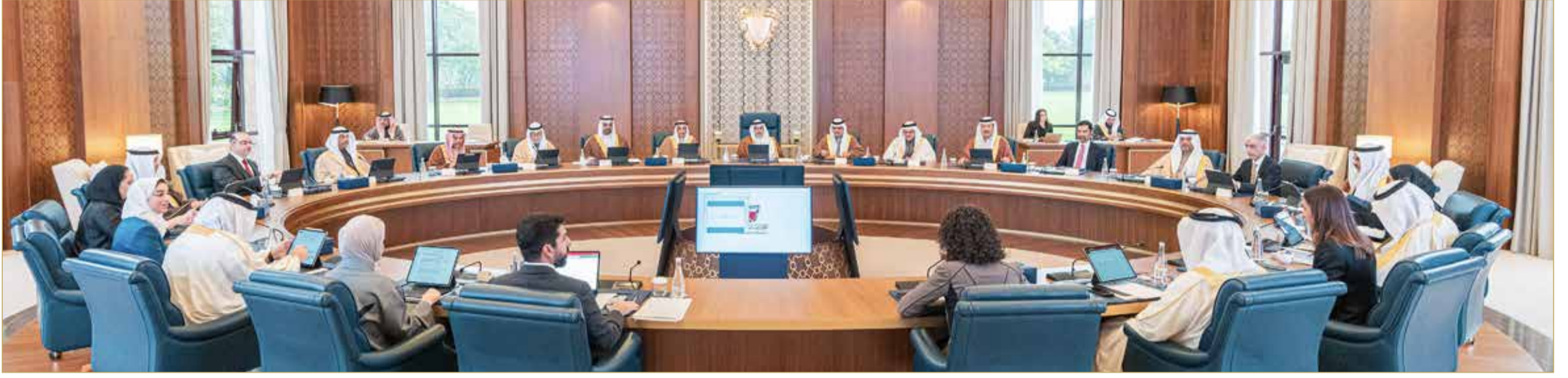
سمو ولي العهد رئيس الوزراء يتأسس جلسة مجلس الوزراء

◆ تسهيل اختصامات لجنة محاربة التطرف ومكافحة الإرهاب وتمويله وغسل الأموال