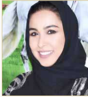
عهدود مال الله