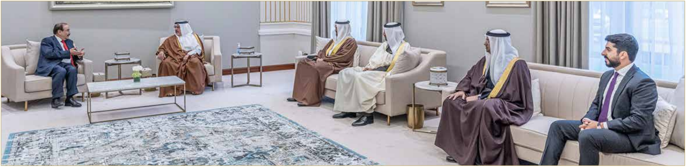
سمو ولي العهد رئيس الوزراء يستقبل مستشار مجلس إدارة الشركة القابضة للنفط والغاز