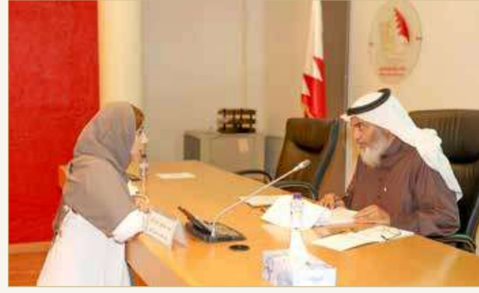
رئيس المجلس وأمين السر