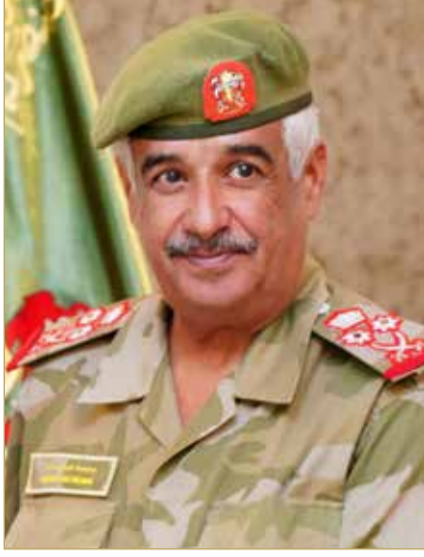
سمو رئيس الحرس الوطني

منذ مراحل تأسيسه الأولى، كان له الدور الكبير في تعزيز دور هذا الصرح الوطني في الحفاظ على أمن مملكة البحرين والذود عن منجزاتها التي تحققت في ظل المسيرة التنموية الشاملة بقيادة ملك البلاد المعظم القائد الأعلى للقوات المسلحة صاحب الجلالة الملك حمد بن عيسى آل خليفة.