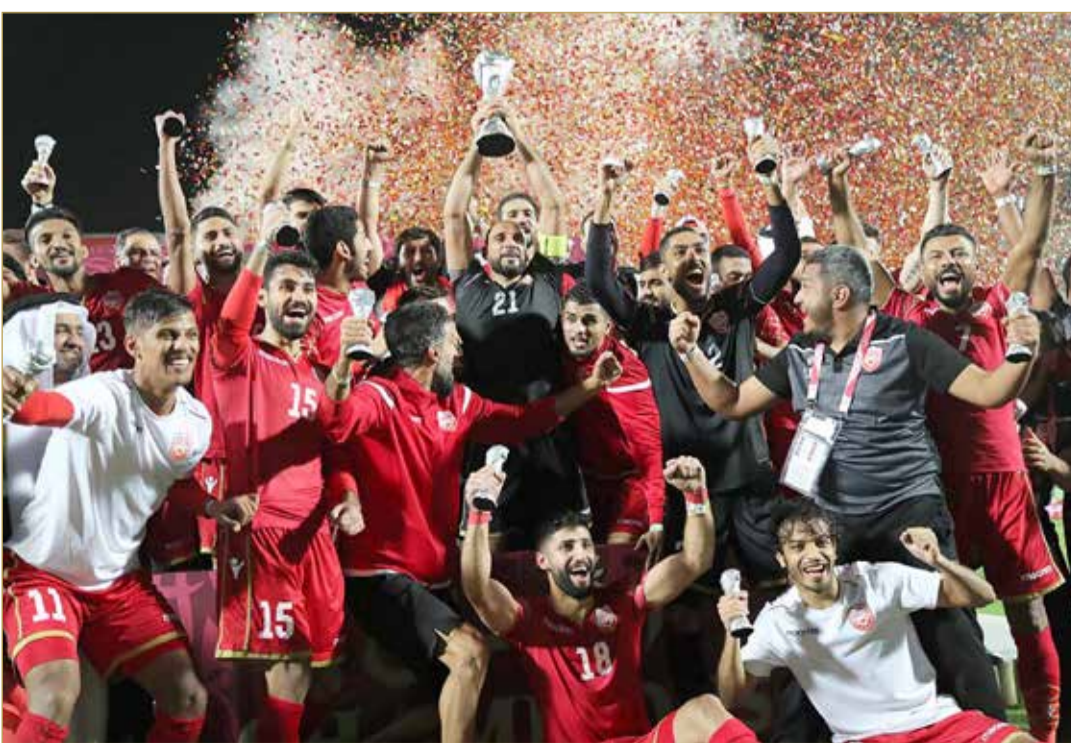
البحرين تنتزع اللقب الثاني

البحرين هي مهد انطلاقا بطولات كأس الخليج العربي لكرة القدم في العام 1970، وهي آخر من فاز بلقب الخليجي ولأول مرة بتاريخها في النسخته الماضية بالدوحة 2019. ولم تقب البحرين عن جميع النسخ الـ 24 التي أقيمت على مدار السنوات الماضية، وتمكنت من الصعود على منصة التتويج والوجود بين الكبار (أصحاب المراكز الثلاث الأوائل) في عشر نسخ. بعد الفوز بلقب خليجي 24 بأخر نسخة، حصد منتخبنا الوطني مركز الوصافة 4 مرات في البحرين 1970 والإمارات 1982 وقطر 1992 والكويت 2003، فيما كان