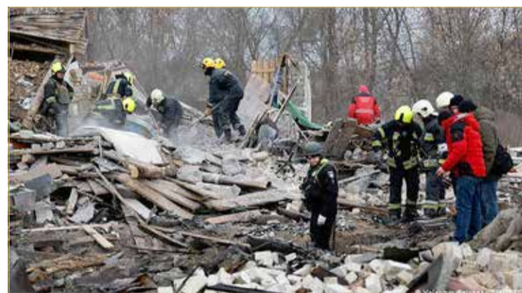
كيفية تتحدث عن ضربات روسية رغم وقف إطلاق النار المعلن

سريان وقف إطلاق النار في هذه المدينة التي دمرت شوارعها إلى حد كبير جراء المعارك التي تراجعت حديثاً مقارنة مع الأيام السابقة. وأمر بوتين بوقف إطلاق النار لمدة 36 ساعة في الحرب المستمرة منذ 10 أشهر في تحرك مفاجئ الخميس، قائلاً إنه بمناسبة الاحتفال بعيد الميلاد المسيحي الأرثوذكسي في روسيا.