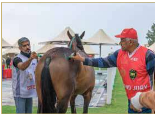
سمو الشيخ ناصر بن حمد آل خليفة

« سباق 40 كم، المرحلة الثانية (لون أزرق) لمسافة 30 كم، المرحلة الثالثة (لون أخضر) لمسافة 30 كم.