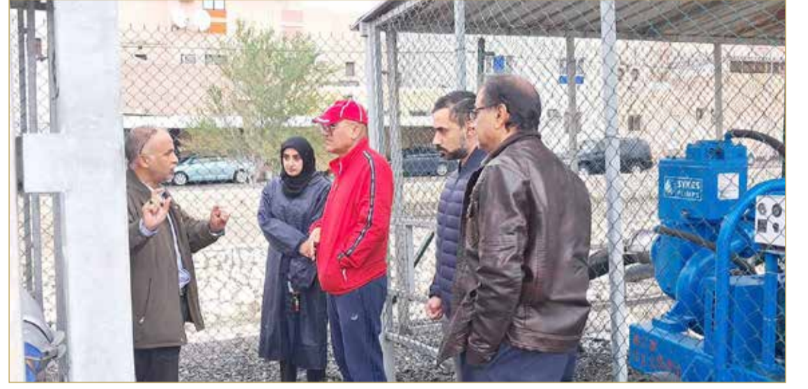
محافظة الشمالية في زيارة تفقدية لمنطقة وبحيرة اللوزي