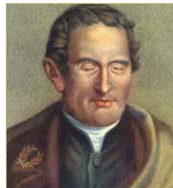
لوحة فنية لوجه برايل

ولكن بارزة على ألواح، فكانت الكتب بهذه الطريقة ثقيلة، وكانت القراءة بهذه الطريقة بطيئة ومتعبة للكفيف؛ لأنها تأخذ وقتا وجهدا من الكفيف حتى يتلمس كل حرف ويتعرف على الحرف، وكان الكفيف عندما ينتهي من قراءة السطر ينسى عم كان السطر يتحدث، غير أنه بهذه الطريقة كان الكفيف يقرأ ولا يكتب؛ لأن الكتابة تكون بأجهزة خاصة في المصنع. تخرج لويس وظل يفكر في اختراع