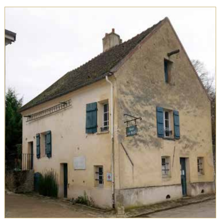
مسقط رأس برايل الحقيقي

اليوم تتكون من نقط أقصاها 6، وقد استخدم دبوس (مثقاب) والده الذي تسبب في كف بصره في إبراز النقط واستخدمه كوسيلة للكتابة. ويعتبر الرابع من يناير هو يوم برايل العالمي، الذي يصادف مولد لويس