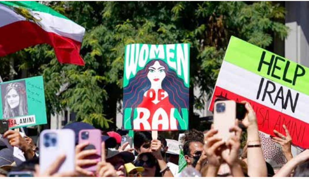
تظاهرة في الولايات المتحدة دعماً للمحتجزات في إيران