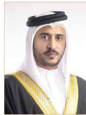
سمو الشيخ خالد بن حمد آل خليفة