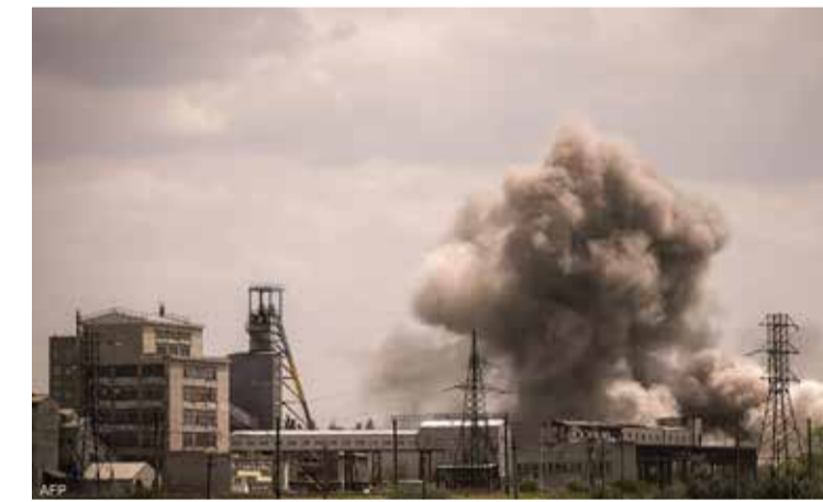
القوات الروسية تحرز تقدماً على محور باخموت شرقاً

وإصابة اثنين آخرين بجروح جراء قصف المناطق السكنية ومرافق البنى التحتية بدونيتسك. ومن المرجح أن تصبح سوليدار نقطة انطلاق موسكو للهجوم على مدينة باخموت التي استعصت على موسكو منذ أشهر. فالقوات الروسية إلى جانب مجموعة فاغنر ستصبح قادرة على استهداف باخموت من الجهة الشمالية الشرقية للمدينة ما سيمكنها من الضغط أكثر على المدينة. وتأمل موسكو في السيطرة على خطوط الإمداد في شرق أوكرانيا، ما يسهل مأموريته في السيطرة على منطقة دونباس الشرقية بأكملها. من جانب آخر، قال مسؤول بوزارة الخارجية الروسية أليكسي بوليشوك،