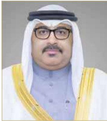
وزير التربية والتعليم

ولفت إلى أنه في ضوء مخرجات الفصل الدراسي الأول، فإن فرق العمل المختصة بالوزارة ستقوم بعملية مراجعة وتحليل النتائج من أجل الوقوف على أهم نقاط التطوير المطلوبة في أنظمة التقويم وفي احتساب النتائج وكذلك تحديد الدروس والموضوعات والمهارات التي سوف تدخل ضمن امتحانات نهاية الفصل الدراسي الثاني، وبما لا يمس جودة الأداء التعليمي أو يخلّ بدقة عمليات التقويم.