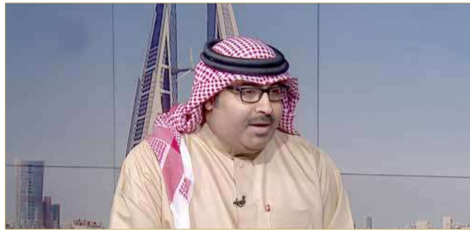
وزير التربية والتعليم

كشف وزير التربية والتعليم محمد مبارك عن أن الوزارة تقوم حالياً بعمليات مراجعة شاملة للمناهج والمقررات والمواد الدراسية في جميع المراحل التعليمية بهدف تأكيد مواكبتها للمهارات والمعارف العالمية المطلوبة. وأضاف أن ذلك سوف يشمل استبدال مقررات بأخرى وزيادة الجرعات التعليمية في المواد الأساسية. وأكد الوزير أن الفصل الدراسي الأول من العام الدراسي الجاري شهد ختام عملياته التعليمية بنجاح، بعد أكثر من 4 أشهر من العمليات التعليمية والتقييمية المكثفة، منذ بدء الدراسة والعودة الإلزامية الشاملة في المؤسسات التعليمية المدرسية في مطلع شهر سبتمبر الماضي. ولفت إلى أنه في ضوء مخرجات الفصل الدراسي الأول، فإن فرق العمل المختصة