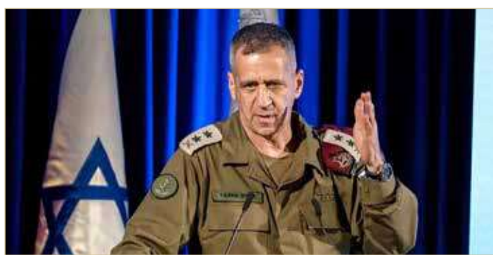
رئيس أركان الجيش الإسرائيلي

وأضاف كوخافي "نحن نعمل على أمرين مهمين: الأول هو تحديد موقع الصواريخ الإيرانية لكي نقوم يوم التنفيذ بضرب أكبر عدد ممكن منها. والأمر الثاني إنشاء نظام دفاع جوي لتحديد هذه الصواريخ". وأضاف أننا "نفترض افتراضاً