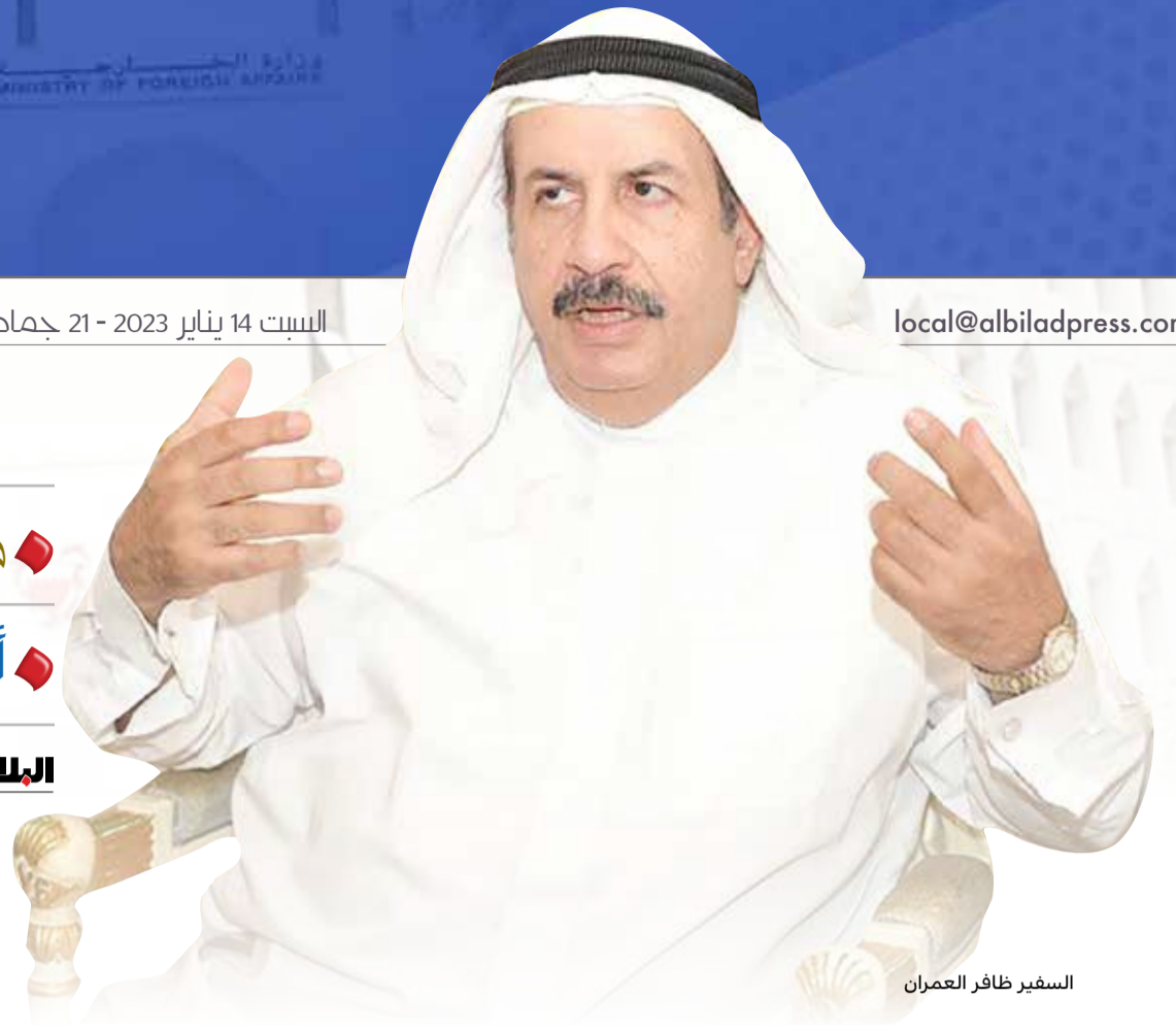
السفير ظافر العمران

قال الوكيل المساعد الأسبق لشؤون مجلس التعاون والدول الغربية بوزارة الخارجية السفير ظافر أحمد العمران، إن القوة الناعمة هي القدرة في التأثير على الآخرين عن طريق الإقناع وليس الإكراه أو استخدام القوة الصلبة، والدبلوماسية تستخدم القوة الناعمة في جذب الآخرين؛ من أجل تحقيق مصالح الدولة، التي تستخدم الوسائل الحضارية والإعلامية والاقتصادية والدعائية للترويج للبلاد، وليس استخدام الوسائل القمعية أو العسكرية.