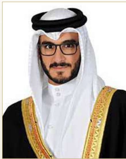
سمو الشيخ عيسى بن سلمان بن حمد آل خليفة

بناف أعلن نادي الفرسان البريطاني "The Jockey Club" عن منح رئيس الهيئة العليا لنادي راشد للفروسية وسباق الخيل سمو الشيخ عيسى بن سلمان بن حمد آل خليفة لقب عضو فخري بنادي الفرسان البريطاني وذلك تقديراً لإسهامات سموه في مواصلة تطوير قطاع سباقات الخيل على مختلف المستويات، والتي انعكست من خلال ما تحققت من إنجازات في هذا المجال على الصعيد الاقليمي والعالمي بمتابعة وإشراف سموه، وبما يؤكد التقدير الدولي لإسهاماته الشخصية في قطاع سباقات الخيل على مختلف المستويات، ويضاف إلى سلسلة الإنجازات التي تواصل مملكة البحرين تحقيقها في قطاع سباقات الخيل. وبهذه المناسبة، أكد سمو الشيخ عيسى بن سلمان بن حمد آل خليفة رئيس الهيئة العليا لنادي راشد للفروسية وسباق الخيل أن التقدير الدولي الذي تحظى به إنجازات مملكة البحرين في مختلف المجالات وخاصة قطاع سباقات الخيل جاء بفضل الدعم اللامحدود الذي يحظى به القطاع من صاحب الجلالة الملك حمد بن عيسى آل خليفة، والمتابعة المستمرة من ولي العهد رئيس مجلس الوزراء صاحب السمو الملكي الأمير سلمان بن حمد آل خليفة.