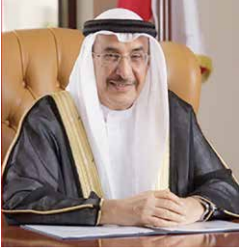
نائب رئيس مجلس الوزراء