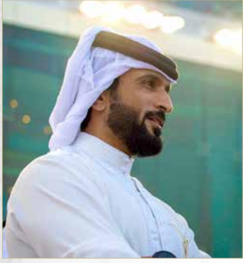
سمو الشيخ ناصر بن حمد آل خليفة