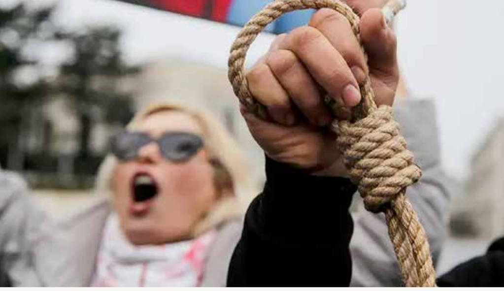
أستراليا: إعدام المتظاهرين في إيران محاولة مخزية لترويعهم

يبحث مندوبو الدول الأعضاء في الاتحاد الأوروبي إمكانية إدراج الحرس الثوري الإيراني في قوائم الإرهاب الأوروبية. وبحسب المصادر، تقترح ألمانيا منذ مدة إدراج الحرس الثوري ككل في قائمة الإرهاب الأوروبية. وأضافت المصادر أن هولندا وجمهورية التشيك تدعمان مقترح ألمانيا. وتقدم فرنسا مقترحاً بهذا الشأن خلال اجتماع المندوبين الأسبوع المقبل تمهيداً لاجتماعات وزراء الخارجية الأوروبيين لاحقاً. وبحسب المصادر، يبحث المندوبون إمكانية اتخاذ حزمة رابعة من العقوبات ضد إيران، على أن تصدر إثر اجتماع وزراء الخارجية يوم الاثنين 23 يناير الجاري. المصادر ذاتها رجحت أن يأخذ موضوع إدراج الحرس الثوري على قوائم الإرهاب الأوروبية بعض الوقت للبحث والتدقيق بسبب الجوانب القانونية والسياسية والدبلوماسية.