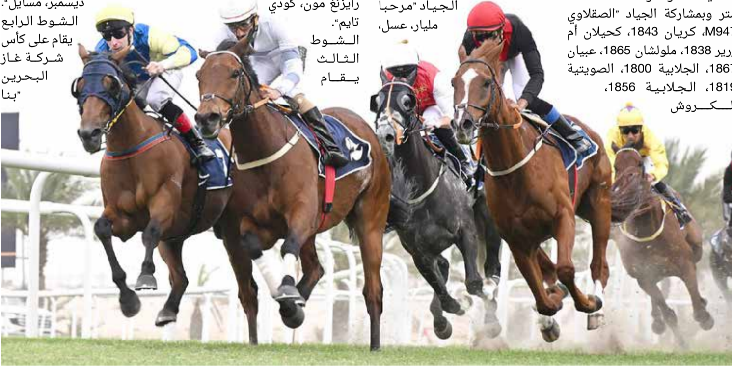
لقطة من السباقات

1854، الصقلاوية 1863، الصقلاوية M1006. الشوط الثاني يقام على كأس صحيفة "البلاد" ليجاد سباق التوازن "مستورد" مسافة 1200 متر مستقيم وبمشاركة الجياد "مرحبا مليار، عسل،