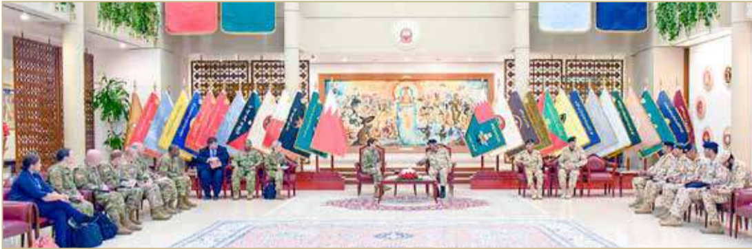
مديرية الإعلام والتوجيه المعنوي

المتحدة الأمريكية وسبل تعزيزها وما تشهد من تطور على مختلف الأصعدة خاصة ما يتعلق منها بالتنسيق العسكري والتعاون الدفاعي بين البلدين الصديقين. حضر اللقاء اللواء الركن حسن محمد سعد مدير ديوان القيادة العامة، واللواء الركن غانم إبراهيم الفضالة مساعد رئيس هيئة الأركان للعمليات، واللواء الركن طيار الشيخ محمد بن سلمان آل خليفة مدير التعاون العسكري، وعدد من كبار ضباط قوة دفاع البحرين.