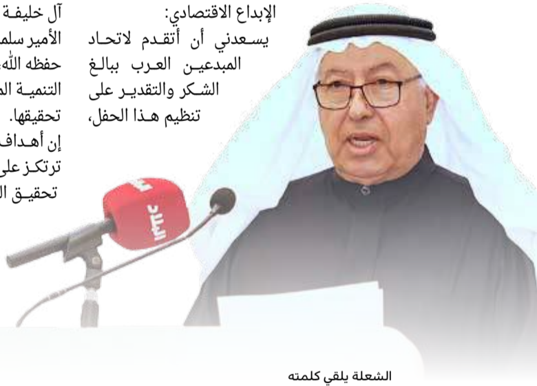
الشعلة يلقي كلمته

يسعدني أن أتقدم لاتحاد المبدعين العرب ببالغ الشكر والتقدير على تنظيم هذا الحفل،