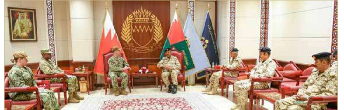
مديرية الإعلام والتوجيه المعنوي

في المجال العسكري. حضر اللقاء اللواء الركن حسن محمد سعد مدير ديوان القيادة العامة، واللواء الركن غانم إبراهيم الفضالة مساعد رئيس هيئة الأركان للعمليات، واللواء الركن طيار الشيخ محمد بن سلمان آل خليفة مدير التعاون العسكري، وعدد من كبار ضباط قوة دفاع البحرين.