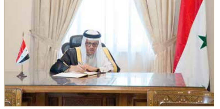
المنامة - وزارة الخارجية

قام وزير الخارجية عبداللطيف الزياني، أمس، بزيارة لسفارة الجمهورية العربية السورية لدى مملكة البحرين؛ وذلك لتقديم واجب العزاء في ضحايا الزلزال الذي وقع في المناطق الشمالية من سوريا وجنوبي