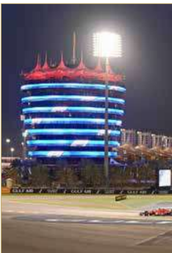
على 450000 17 أو زيارة الموقع الإلكتروني www.bahraingp.com

سباقات الفورمولا وان. ولمزيد من المعلومات الرجاء الاتصال