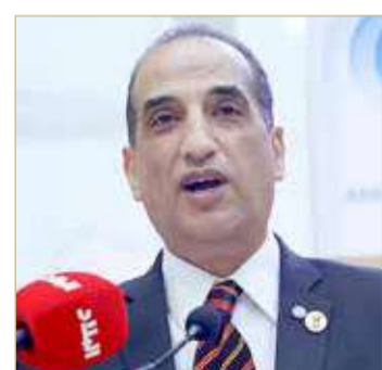
د. أحمد نور

هذا الاختيار الذي صادف أهله جاء عن مسيرة عمل وعطاء متميزة تواكب الرؤية العالمية وأهداف التنمية المستدامة وأجندة 2030 وتدعم المسؤولية المجتمعية؛ لذا فإن الاتحاد أطلق مبادرة الوسام؛ لتسليط الضوء على دور الاقتصاديين والاقتصاديين العرب في دعم أجندة 2030، والسعي لتحقيق أهداف التنمية المستدامة في إطار توصيات وتوجيهات المجلس الاقتصادي والاجتماعي بالأمم المتحدة لأعضائه من المنظمات.