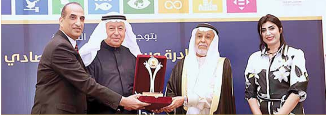
الشعلة يتسلم وسام الإبداع الاقتصادي من رئيس اتحاد الإعلاميين ونائبه

البلاد | فريق التغطية: هبة محسن، حسن عبدالرسول ومثال الشيخ | البث الرقمي: محمد الدرازي ومعاذ توفيق