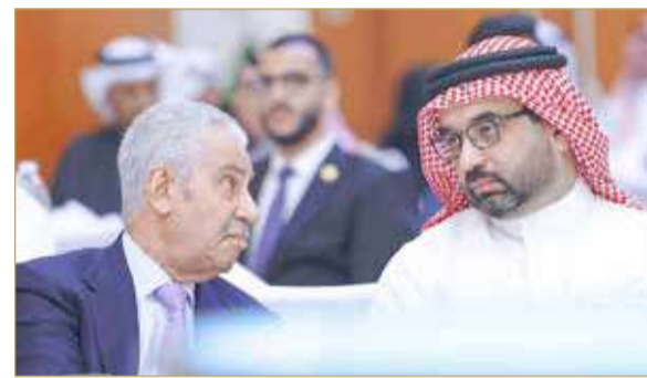
النائب أحمد السلوم والشوري جواد حبيب