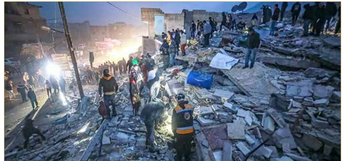
سوريا. ارتفاع حصيلة ضحايا الزلازل إلى 1559 قتيلاً