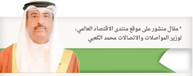
* مقال منشور على موقع منتدى الاقتصاد العالمي، لوزير المواصلات والاتصالات محمد الكعبي

خارطة طريق للاستدامة الممتدة على مدى 3 سنوات، وتقف شاهداً على فاعلية إطار عمل الحوكمة البيئية والاجتماعية وحوكمة الشركات (ESG)، وهو ما يصب لصالح دعم مساعي