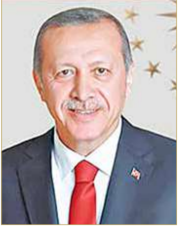
رئيس جمهورية تركيا