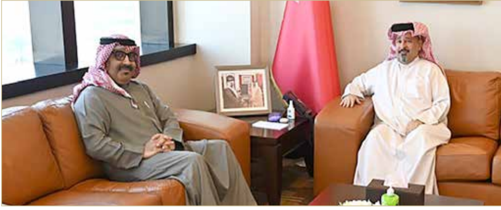
رئيس ديوان الرقابة المالية والإدارية يستقبل وزير التربية والتعليم

من جانبه، شكر وزير التربية والتعليم، الشيخ أحمد بن محمد آل خليفة على حسن الاستقبال، مؤكداً استعداد وزارته لمزيد من التعاون والتنسيق مع ديوان الرقابة المالية والإدارية لما فيه المصلحة الوطنية.