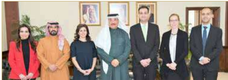
حميدان متوسطا وقد صندوق النقد الدولي

وفي هذا السياق، تطرق وزير العمل أيضاً إلى المشروعات الجديدة التي أطلقتها مملكة البحرين لدعم بيئة الأعمال، وفي مقدمتها مشروع حماية الأجور للعائلة الوافدة، وإطلاق حزم تدريبية متخصصة للخريجين الجامعيين لتزويدهم بالمهارات المهنية لتأهيلهم لسوق العمل، وتحقيق موازنة أكبر بين مخرجات التعليم والتدريب واحتياجات سوق العمل.