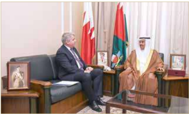
مديرية الإعلام والتوجيه المعنوي

شؤون الدفاع بسفير جمهورية استونيا، مشيداً بعلاقات الصداقة المستمرة والمتميزة القائمة بين البلدين الصديقين. حضر اللقاء اللواء الركن طيار الشيخ محمد بن سلمان آل خليفة مدير التعاون العسكري.