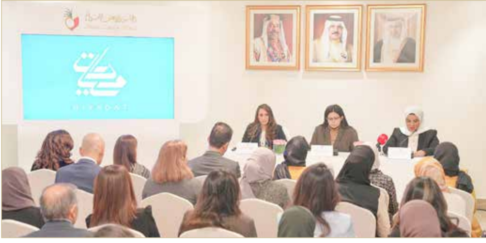
الرفاع - المجلس الأعلى للمرأة

إضافة إلى الاستفادة من برامج أخرى كبرنامج إبدأ مشروعك للمشروعات الناشئة وبرنامج التحول الرقمي للمؤسسات الراغبة في تعزيز عملياتها عن طريق توظيف الحلول الرقمية، إلى جانب عدد من البرامج التدريبية والإرشادية الخاصة لدعم تطور الأعمال.