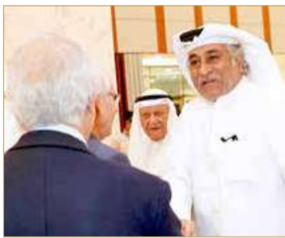
رئيس التحرير مرحبا بالضيوف