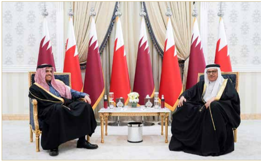
وزير الخارجية يجتمع مع وزير الخارجية القطري

عقد اجتماع بمقر الأمانة العامة لمجلس التعاون لدول الخليج العربية أمس بين وفدين من مملكة البحرين ودولة قطر. وترأس وفد مملكة البحرين وزير الخارجية عبداللطيف الزبيري، كما ترأس وفد دولة قطر نائب رئيس مجلس الوزراء وزير الخارجية الشيخ محمد بن عبدالرحمن آل ثاني. وتناول الاجتماع وضع الآليات والإجراءات اللازمة لإطلاق مسار المباحثات على مستوى اللجان الثنائية وفقاً لما تضمنه بيان العلاء الصادر عن قمة العلاء بالمملكة العربية السعودية الصادر في الخامس من يناير 2021، لإنهاء الملفات الخاصة المتعلقة بينهما. كما أكد الجانبان أهمية العمل والتعاون بين البلدين الشقيقين