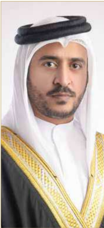
سمو الشيخ خالد بن حمد آل خليفة