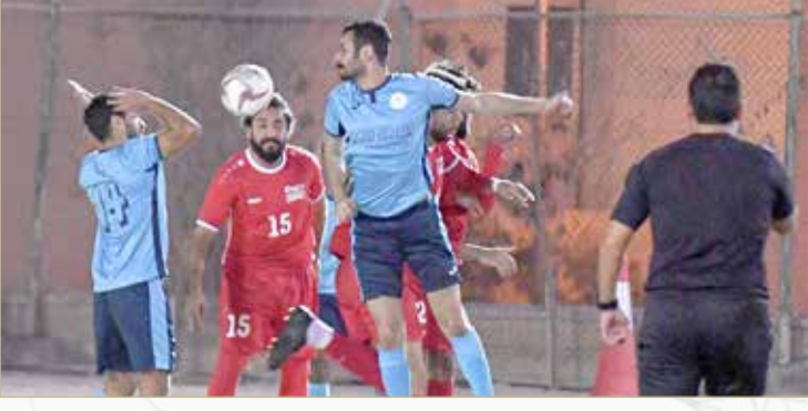
من لقاء جيبك وتطوير