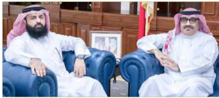
وزير التربية والتعليم مستقبلاً النائب جميل ملا حسن

واقترح النائب على الوزير الاستفادة من بعض الكتب التي تنمي الفكر الإبداعي والتي يمكن إدراجها في المناهج التعليمية؛ كونها كفيلة بتغيير طريقة تفكير الطلاب ومساعدتهم على ابتكار الوظائف وخلقها بدلاً من البحث عن الوظيفة.