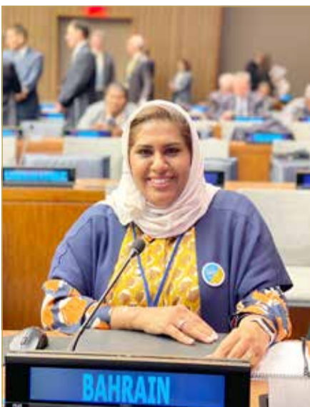
هيئة المعلومات والحكومة الإلكترونية

وأكدت سلطان أن هذا الاجتماع السنوي والذي يعقد في شهر مارس من كل عام يعد من أكبر التجمعات الدولية التي تضم كبار الإحصائيين في الدول الأعضاء من حول العالم، وتحضر الهيئة على المشاركة فيه في ظل ما يمثله هذا التجمع من أهمية بالغة، سيما من حيث مشاركة رؤساء ومدراء الأجهزة والمراكز الإحصائية الوطنية من مختلف دول العالم الأعضاء عدا عن الخبراء والمستشارين وممثلي منظمات الأمم المتحدة، إضافة إلى المنظمات الإقليمية والدولية الأخرى ذات العلاقة بالعمل الإحصائي.