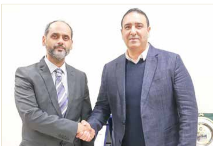
المتحدث الرسمي باسم العاصمة الإدارية الجديدة والرئيس النهم

وأضاف "وتضم المدينة أكثر من أربعين مدرسة، والحي الدبلوماسي والذي نستهدف خلاله انتقال كل السفارات والبعثات الدبلوماسية، وهو أمر تحقق بنسبة جيدة جداً. وهناك سفارات ستنتقل كالسعودية وسلطنة عمان وبالنسبة للبحرين لاتزال هناك مناقشات، والأمر بحد ذاته اختياري". وواصل الحسيني "نعمل على مدار الساعة لشق الطرق، وبناء الجسور،