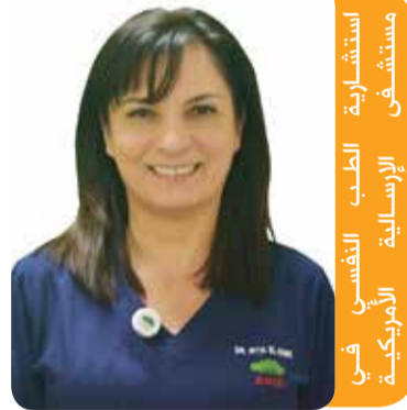
استشارية الطب النفسي في مستشفى الإرسالية الأمريكية