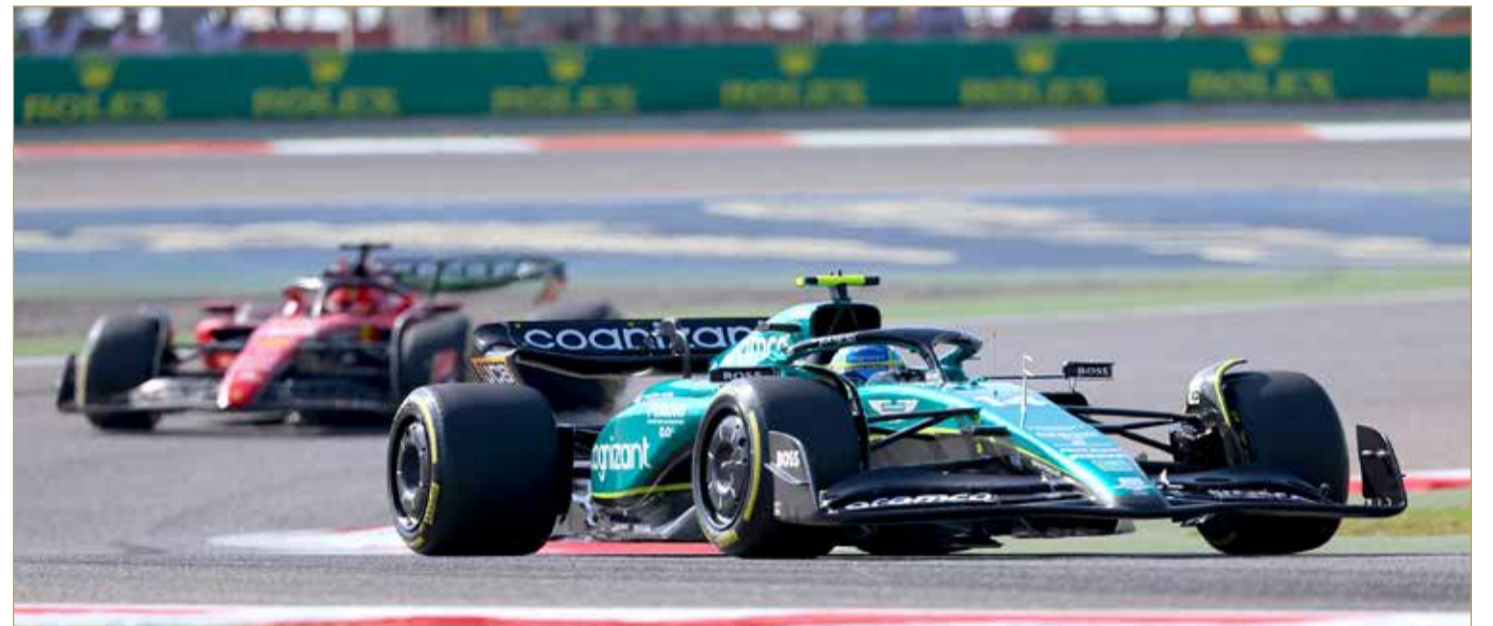
الموعد يتجدد اليوم مع إثارة الفورمولا 1 على مضمار حلبة البحرين الدولية

بأهمية كبرى على مستوى العالم كونه الجولة الافتتاحية، إلى جانب جدول حافل بالسباقات المساندة، والفعاليات الترفيهية في "قرية الفورمولا وان" والحفلات الغنائية الصاخبة التي استقطبت أعداداً غفيرة من الجماهير. وتمكن سيرجيو بيريز سائق فريق ريد بول ريسينغ من تسجيل الزمن الأسرع أمس ضمن أولى منافسات الجولة من حصة التجارب الأولى للجولة الافتتاحية، وسوف تقام اليوم التجارب التأهيلية والتي تتحدد مراكز الفرق عند خط الانطلاق. (13) و(14)