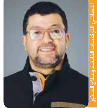
أخصائي الترسبات التاجية وعلاج الجذور (جندل الكلية الملكية البريطانية لندن)