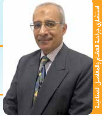
استشاري جراحة العظام والمفاصل التخصصية في المستشفى الملكي التخصصي