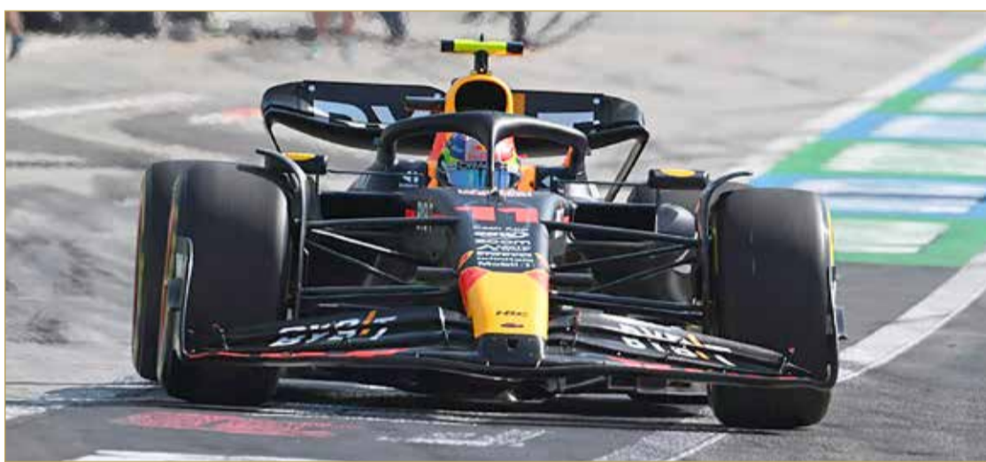
الصغير-حلبة البحرين الدولية:

انطلقت بالأمس أولى فعاليات سباق الـ FORMULA 1 الكبرى لطيران الخليج 2023 على مضمار حلبة البحرين الدولية "موطن رياضة السيارات في الشرق الأوسط"، حيث تتواصل فعاليات السباق ليومين آخرين حتى الأحد 5 مارس الجاري، وتنتقل النسخة الـ 19 لسباقات الفورمولا وان في مملكة البحرين، معلنة انطلاق الجولة الافتتاحية لهذا الموسم إلى جانب جدول حافل بالسباقات المساندة، الفعاليات الترفيهية في "قرية الفورمولا وان" والحفلات الغنائية.