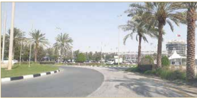
المنامة - وزارة الأشغال

وأهابت وزارة الأشغال مستخدمي الطريق أخذ الحيطة والحذر والالتزام بقواعد السلامة المرورية خلال فترة الفعالية لضمان سلامتهم والتعاون من أجل إنجاز سباق الفورمولا 1.