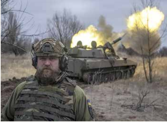
أوكرانيا تنشط باخموت... وقائد "فاغنر": المدينة "محاصرة عملياً"

4 معاهدات رئيسية، منها معاهدة الصواريخ المضادة للصواريخ الباليستية، التي انسحبت منها الولايات المتحدة في العام 2002، ومعاهدة القوات النووية متوسطة المدى، التي منها انسحبت واشنطن العام 2019، ومعاهدة الأجواء المفتوحة التي انسحبت منها الولايات المتحدة العام 2020. وذكر أن بلاده علقت مشاركتها في معاهدة "ستارت الجديدة" للحد من الأسلحة النووية على خلفية "تجاهل" طلبات تقدمت بها موسكو للإشراف على المنشآت النووية في الولايات المتحدة. واعتبرت الخارجية الروسية أن