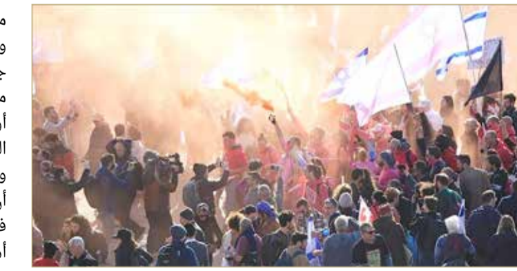
تصاعد الاحتجاجات بالنوازي مع استمرار الحكومة بعملية إقرار التشريعات في الكنيست

الطبيعة الديمقراطية الأساسية التي كانت سائدة منذ عقود، سواء ما يتعلق بهيكل الحكم أو النظام القانوني". وأضاف غورين: "هناك الكثير يعارضون هذه التشريعات ويخرجون إلى الشوارع، ولا تعرف حتى الآن إذا ما كان هناك مجال لنوع من التسوية أو أن نتنياهو وحكومته سيسيران بسرعة كاملة في الاتجاه الذي يريدون، وإذا ما حدث ذلك، فستكون أزمة دستورية غير