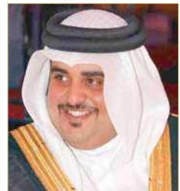
سمو الشيخ خليفة بن حمد