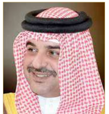
سمو الشيخ عبدالله بن حمد

كرواسدر - سهارا سيرير - مرحيا مليار - أورا - عسل - هاليك - أربيا أربيا - سيد تشانس - الأبرار - جامي اساي - تولوز لي بلوت - فارس كودياك - روزا مايسيتيكا - دايم - بي أوف وسيريس - هميش ماكيت - الناي - كودي تايم - الشوط الثامن والأخير يقام على كأس الشركة العربية لبناء وإصلاح السفن "أسري" لجيلاد سباق التوازن "مستورد" مسافة 1600 متر وبمشاركة 13 جواداً هي "مدمن - رويال سيميتار - ويزارد دامور - زيزونيا - كينكس - تفاخر - ليت - مياس - فولو سوت - فوربد - لاند - بلو بوي - ناين بيلو زيرو - المختار ستار".