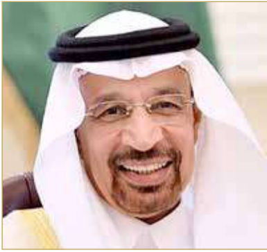
وزير الاستثمار السعودي خالد الفالح