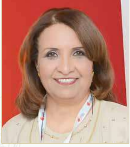
الشبيخة حياة بنت عبدالعزيز

أقر المكتب التنفيذي لاتحاد اللجان الأولمبية الوطنية العربية إنشاء لجان جديدة أبرزها لجنة المساواة بين الجنسين برئاسة الشبيخة حياة بنت عبدالعزيز آل خليفة. وعقد المكتب التنفيذي اجتماعه الـ 38 في مدينة جدة السعودية برئاسة سمو الأمير عبدالعزيز بن تركي الفيصل، وحضور سمو الأمير فهد بن جلوي بن عبدالعزيز وسائر الأعضاء.