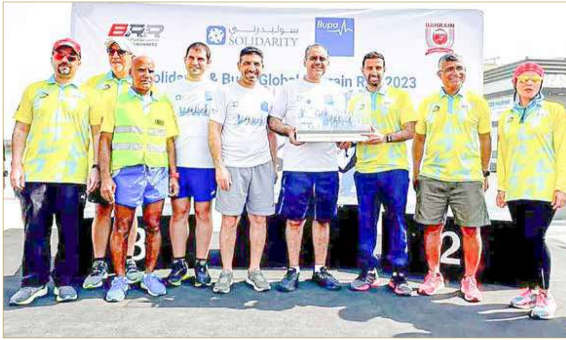
جانب من الترويج

الثقافة الرياضية وتعزيز الصحة العامة في المجتمع. وأضاف قائلاً: "تعرب لجنة عدائي البحرين عن خالص امتنانها لوزارة الداخلية والإدارة العامة للمرور، ولمنتسبي الهيئة العامة للرياضة. كما تتوجه بالشكر للمتطوعين ولتعاون العديد من الهيئات والمؤسسات الحكومية والخاصة في إقامة هذه الفعالية ومستشفى رويال البحرين وفريق كن مستعداً وشركة فيتنس فيرست وشركة بوكاري سويت وشركة ماينا وذلك في إطار الشراكة المجتمعية". وتميز السباق بالحماس الواضح من المشاركين كافة الذين أبدوا عن سعادتهم البالغة بالمشاركة في هذه الفعالية المميزة، وفي نهاية السباق تم توزيع الكؤوس والجوائز النقدية على الفائزين في المراكز الأولى من فئات الرجال والنساء والأطفال.