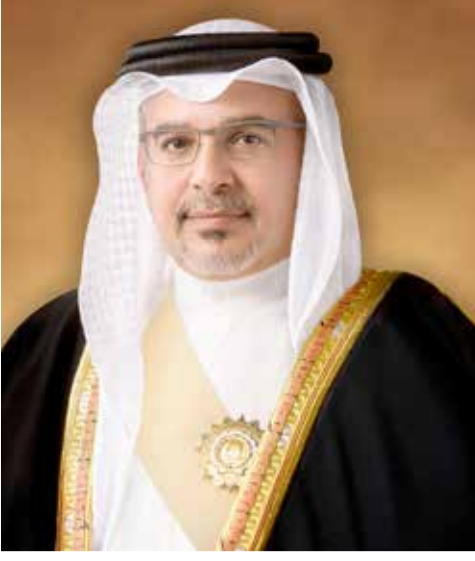
سمو ولي العهد رئيس الوزراء

الحدث الدولي الكبير وثقة العالم بما تمتلكه البحرين من إمكانيات وقدرات لاستضافة وتنظيم مثل هذه الفعاليات والأحداث الدولية في ظل اهتمام ورعاية جلالتهم، متمنياً لمملكة البحرين المزيد من التقدم والازدهار في ظل قيادة جلالتهم الحكيمة، سائلاً الله تعالى أن يمتع جلالتهم بموفور الصحة والسعادة وأن يسدد على طريق الخير خطاه.