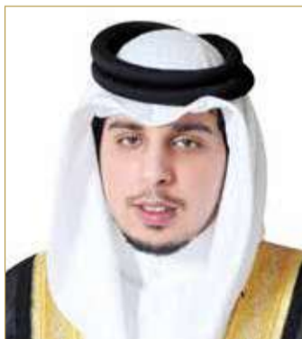
سمو الشيخ سلطان بن حمد