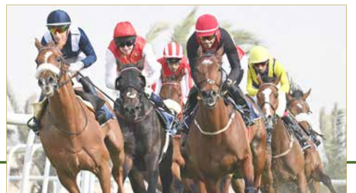
منافسات قوية يشهدها السباق الختامي للخيل

- مويسكي دي لانوي - برليت إنجل - غاره - زومان". الشوط الرابع يقام على كأس سمو الشيخ خليفة بن حمد آل خليفة لجيلاد سباق التوازن "إنتاج محلي" مسافة 2400 متر وبمشاركة الجياد "مغيرة - المختار - جدله - لحوق - ساموراي