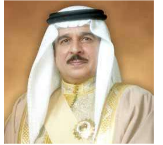
جلالة الملك المعظم

أصدر ملك البلاد المعظم صاحب الجلالة الملك حمد بن عيسى آل خليفة، الرئيس الفخري للمؤسسة الملكية للأعمال الإنسانية، أمر جلالاته السامي بصرف المكرمة الرمضانية السنوية لجميع الأسر المنتسبة إلى المؤسسة الملكية للأعمال الإنسانية، وذلك بمناسبة حلول شهر رمضان المبارك لعام 2023 ميلادية الموافق 1444 هجرية، جرياً على العادة السنوية.