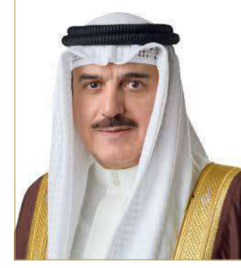
رئيس مجلس النواب

تلقى عاهل البلاد المعظم صاحب الجلالة الملك حمد بن عيسى آل خليفة، برقية شكر وتقدير من رئيس مجلس النواب أحمد المسلم، رفع فيها إلى المقام الكريم لصاحب الجلالة خالص الشكر وعظيم التقدير على تفضل جلالتهم برعاية افتتاح أعمال الجمعية 146 للاتحاد البرلماني الدولي تحت عنوان "تعزيز التعايش السلمي والمجتمعات الشاملة.. مكافحة التعصب" خلال الفترة من 11 إلى 15 مارس 2023م. وثن رئيس مجلس النواب رعاية وتوجيهات جلالتهم السامية للجمعية، معرباً لجلالتهم عن إشادته بالتقدم المتنامي الذي تشهده مملكة البحرين، مؤكداً على المكانة العالية التي تحتلها مملكة البحرين ودورها الرفيع والفاعل في المجتمع الدولي. كما أعرب عن فخره واعتزازه باحتضان مملكة البحرين لهذا