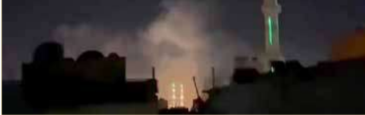
إسرائيل تقصف محيط دمشق

وأصيب عسكريان بجروح جراء قصف جوي إسرائيلي طاول مواقع في محيط دمشق في الساعات الأولى من فجر الخميس، وفق ما أعلنت وزارة الدفاع السورية. وشنت إسرائيل خلال الأعوام الماضية مئات الضربات الجوية في سوريا التي طاولت مواقع للجيش السوري، وأهدافاً إيرانية وأخرى لحزب الله اللبناني بينها مستودعات أسلحة وذخائر في مناطق متفرقة. وأفاد مراسل وكالة الصحافة الفرنسية بأنه مع الساعات الأولى من فجر الخميس سمع دوي انفجارات في دمشق. وأعلنت وزارة الدفاع السورية، في بيان باسم مصدر عسكري، "نفذت تل أبيب هجوماً جويًا بعدد من الصواريخ من اتجاه الجولان السوري مستهدفاً بعض النقاط في محيط مدينة دمشق". وأسفر القصف عن إصابة عسكريين اثنين بجروح ووقوع بعض الخسائر المادية، وفق الوزارة التي أضافت أن "وسائط الدفاع الجوي تصدت لصواريخ تل أبيب وأسقطت بعضها". وقال المرصد السوري لحقوق الإنسان، ومقره بريطانيا، إن هذه هي خامس ضربة تشنها إسرائيل على سوريا هذا الشهر. ورفضت السلطات الإسرائيلية التعليق. ولم تحدد السلطات السورية