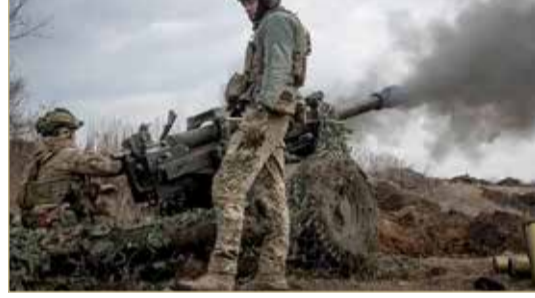
من المعارك في باخموت

مازالت مدينة باخموت محور القتال الشرس بين طرفي الصراع في أوكرانيا، وخصوصاً أن روسيا جعلت من السيطرة عليها أولوية في إستراتيجيتها لبسط نفوذها على كامل منطقة دونباس. وفي خضم المعارك، أعلن رئيس منطقة دونيتسك الموالي لروسيا فيتالي خوتسبينكو، أمس (الخميس)، أن تطويق المدينة الإستراتيجية بالكامل بات قريباً جداً. وأضاف في إحاطة عبر تيلغرام، أن القوات الروسية تتقدم في المنطقة إلى حد كبير. جاء هذا الإعلان في الوقت الذي اعترفت فيه أوكرانيا بالتقدم الروسي، حيث أعلنت كييف أن القوات الروسية حققت بعض المكاسب داخل باخموت شرق البلاد. إلا أنها لفتت إلى أن موسكو حصدت مكاسبها الأخيرة مقابل ثمن باهظ في الأرواح، وسط تلميحتها بإمكانية شن هجوم مضاد. آتت هذه التطورات على وقع قتال ضار تشهده باخموت، تلك المدينة الصغيرة القابعة في شرق أوكرانيا، حيث تستهدفها روسيا منذ أشهر للسيطرة عليها. فقد تحوّلت باخموت منذ أسابيع عدة إلى ساحة لأشرس