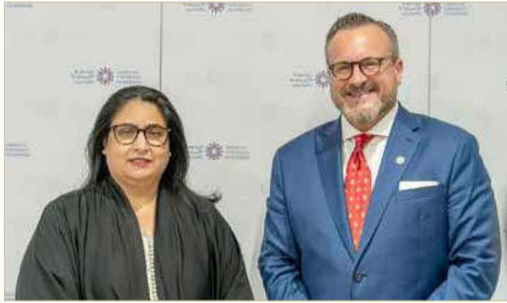
رئيس الجامعة الأميركية بالبحرين والشيخة رنا بنت عيسى

الجامعة الأميركية بالبحرين حاصلة على ترخيص مجلس التعليم العالي التابع لوزارة التربية والتعليم في البحرين، وهو جهة التنظيم الوطنية المعتمدة لمؤسسات التعليم العالي في المملكة، كما أنها عضو في مجموعة الجودة الدولية التابعة لمجلس اعتماد التعليم