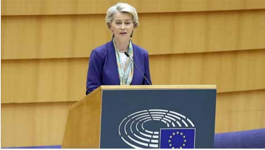
رئيسة المفوضية الأوروبية أورسولا فون دير لايه

واتهمت فون دير لايه الحزب الحاكم بالسعي إلى تغيير النظام الدولي. إلى ذلك، أشارت إلى أن دول الاتحاد ترصد زيادة الإنفاق الصيني العسكري، فضلاً عن حملات التضليل التي تقودها السلطات. وشددت على أن قوتها العسكرية والاقتصادية تؤكد أن بكين لم تعد دولة نامية. أما لجهة العلاقات الصينية الروسية، فاعتبرت فون دير لايه أن تعاون الصين مع روسيا ومقاربتها للحرب على أوكرانيا سيحدد مسار العلاقة معها. كما أشارت إلى وجوب أن تلعب بكين دوراً بناءً