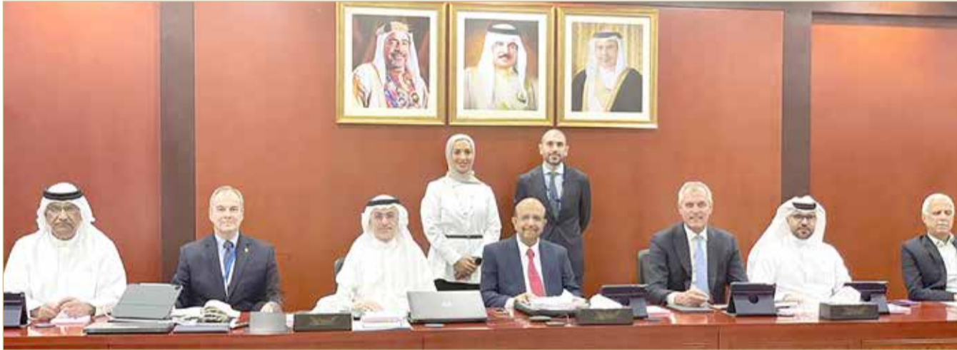
إدارة الشركة والإدارة التنفيذية وجميع العاملين؛ من أجل مواصلة إسهامات الشركة في دعم مسيرة النجاح في شركة تطوير للبترو، معاهداً إياها بمواصلة العمل الدؤوب والمخلص من قبل مجلس إدارة الشركة القابضة للنفط والغاز؛ لمساهماتهم الفعالة وتوجيهاتهم المتواصلة لتعزيز مسيرة

الاقْتِصَادِ الوَطْنِي وقدم الرئيس خالص التهنية للقيادة الرشيدة؛ بمناسبة شهر رمضان المبارك. باشر المجلس بالإطلاع على تقرير رئيس مجلس الإدارة لعام 2022م للأنشطة والأداء المالي لشركة تطوير للبترو، وهنا مجلس الإدارة الرئيس على أداء الشركة في عام 2022م. وتم خلال الاجتماع استعراض أداء الشركة في الربع الأول من العام 2023م فيما يتعلق بمشاريع وخطط الاستكشاف ومواصلة معدلات إنتاج النفط والغاز حسب الخطة الموضوعية مع التمسك بالالتزام الشركة بأعلى معايير الصحة والسلامة وحماية البيئة، بالإضافة إلى ترشيد التكلفة. وفي ختام الاجتماع، توجه المجلس بالشكر والتقدير إلى الإدارة التنفيذية وجميع العاملين في شركة تطوير للبترو، مشيداً بمساهماتهم المتواصلة في دعم مسيرة الشركة من أجل خدمة الاقتصاد الوطني لمملكة البحرين.