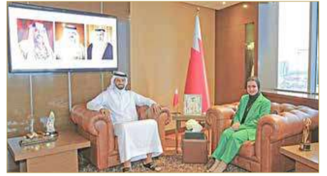
وزيرة شؤون الشباب مستقبلة النائب عبدالله الرميحي