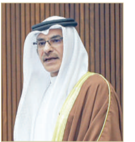
وزير التنمية الاجتماعية

أنواع متعددة من الدعم يتجاوز الدخل الأصلي من خلال علاوة تحسين المعيشة وتعويز اللحوم وخفض فواتير الكهرباء، كما لدى وزارة التنمية برنامج خطوة الذي يأتي لدعم وتحفيز الأسر من ذوي الدخل المحدود لأجل دعم المشاريع وزيادة الدخل الشهري للأسر. وأوضح وزير التنمية أن ما يتم تداوله من رقم لدخل الأسرة، وهو 336 ديناراً ما هو إلا مثال وليس تعريفاً لفئة تستوجب الدعم الخاص بالضمان الاجتماعي.