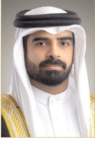
الشيخ سلطان بن محمد

جلالته في جعل مملكة البحرين واجهة رئيسة لاحتضان كبرى البطولات، حيث كان لذلك بالغ الأثر الإيجابي في تعزيز القدرات الفائقة للبحرين في التنظيم المميز لمختلف الأحداث الرياضية الدولية بما فيها سباق الفورمولا واحد.