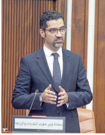
وزير شؤون البلديات والزراعة

من النواب بشأن طرح موضوع عام للمناقشة العامة للاستيضاح سياسة الحكومة حول سياسة وخطط وزارة الإسكان والتخطيط العمراني في التعاطي مع الطلبات الإسكانية، وإصدار بطاقة تموينية للمواطنين تمنح تخفيض مقداره 50% على السلع الضرورية للأسر البحرينية المستفيدة من قانون الضمان الاجتماعي.