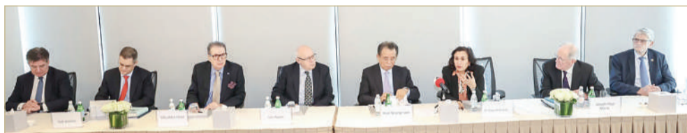
منصة المؤتمر الصحفي

رفع نتائج المؤتمر المنعقد في المملكة كتوصيات إلى الجمعية العامة للاستئناس بها