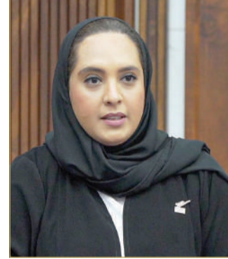
وزيرة الإسكان والتخطيط العمراني

أكدت الريمحي أن المبالغ تبدأ من 40 ألف دينار، وهو أقل تمويل اليوم لمن يبلغ راتبه 320 ديناراً فما فوق، ونظراً للإقبال تم البدء في منح التمويل لمن تبلغ رواتبهم 150 ديناراً، ويتم منحهم التمويل بقيمة 40 ألف دينار، ويعتبر دعم اجتماعي لا تطلب الحكومة أصحاب الدخل المحدود، وأقصى تمويل 70 ألف دينار. وولفت الوزيرة إلى إطلاق برامج جديدة لتلبية احتياجات المواطنين لتوفير الخدمات الفورية لعدد واسع من الخيارات للوحدات السكنية، مشيرة إلى استملاك عدد من الوحدات في منطقة الحورة ويجري حالياً الدراسة للتخطيط للمشاريع المقبلة. ورداً على سؤال النائب حسن