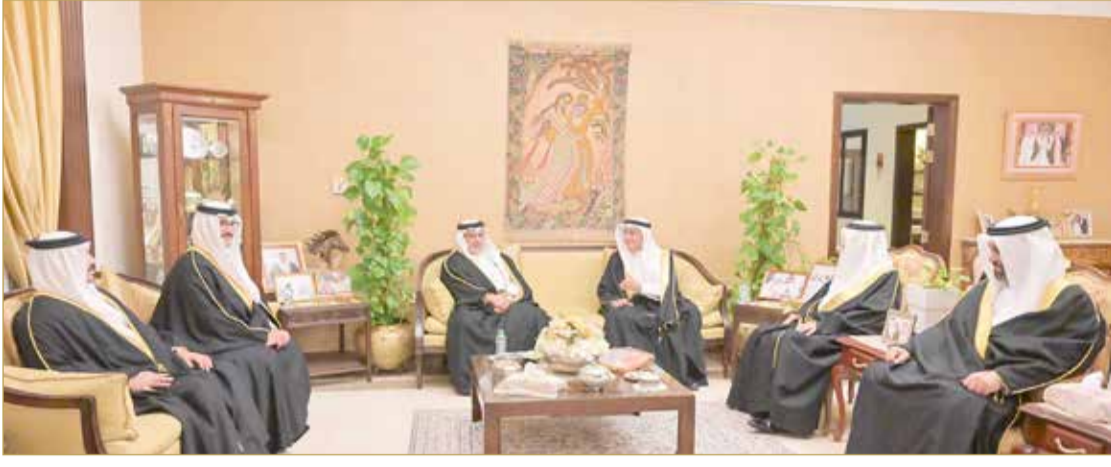
سمو ولي العهد رئيس مجلس الوزراء يقوم بزيارة مجلس مستشار جلاله الملك المعظم لشؤون الإعلام