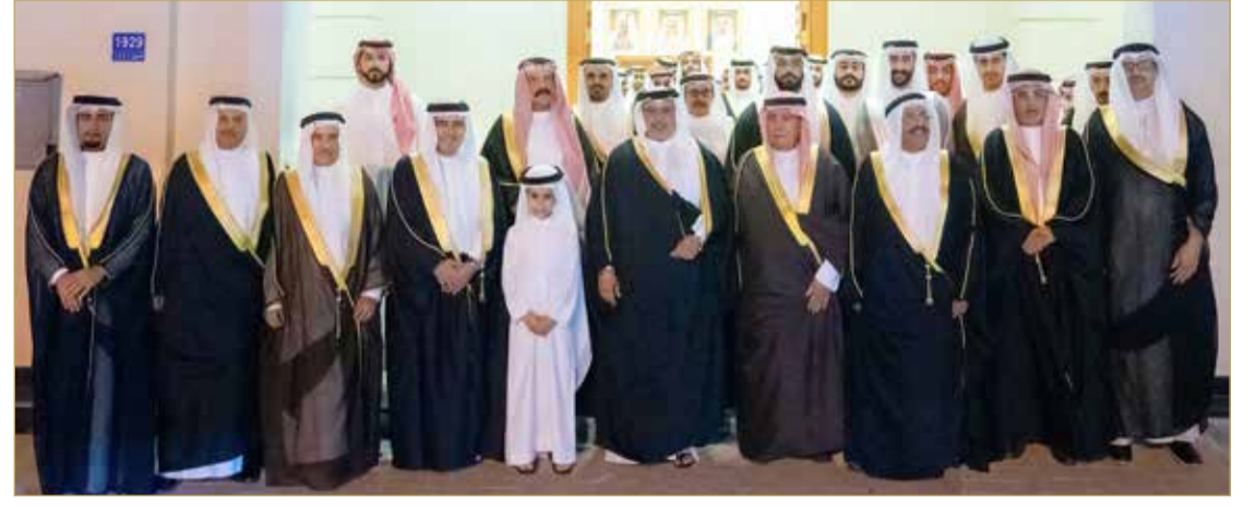
سمو ولي العهد رئيس مجلس الوزراء يقوم بزيارة مجلس عائلة الجلاهمة

يحقق الخير والنماء للجميع. وأكد سموه مواصلة مملكة البحرين الاهتمام بالتخطيط العمراني وجعله معززا لمسارات التنمية الحضريّة، لافتاً سموه إلى أن المملكة حرصت في كافة مشاريعها الاستراتيجية بأن تتضمن المبادرات والخطط الهادفة لخفض الانبعاثات لمواجهة التغير المناخي ومنها الخطة الوطنية للتشجير والسياسات المتعلقة بتوسعة الرقعة الخضراء. من جانبهم، أعرب أصحاب المجالس والحضور عن شكرهم وتقديرهم لصاحب السمو الملكي ولي العهد رئيس مجلس الوزراء على ما يبديه سموه من حرص على التواصل مع أبناء البحرين وزيارة مجالسهم الرمضانية، مشيدين بما يتحقق من منجزات وطنية هدفها نماء الوطن وتحقيق تقدمه في ظل القيادة الحكيمة لصاحب الجلالة ملك البلاد المعظم.