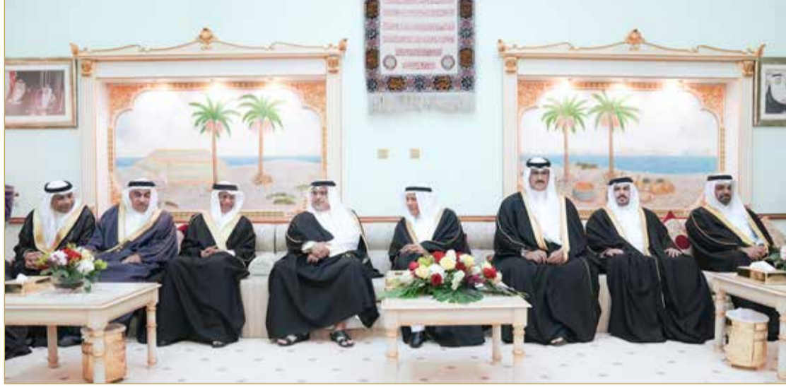
سمو ولي العهد رئيس مجلس الوزراء يقوم بزيارة مجلس أحمد منصور العالي

يحقق الخير والنماء للجميع. وأكد سموه مواصلة مملكة البحرين الاهتمام بالتخطيط العمراني وجعله معززا لمسارات التنمية الحضريّة، لافتاً سموه إلى أن المملكة حرصت في كافة مشاريعها الاستراتيجية بأن تتضمن المبادرات والخطط الهادفة لخفض الانبعاثات لمواجهة التغير المناخي ومنها الخطة الوطنية للتشجير والسياسات المتعلقة بتوسعة الرقعة الخضراء. من جانبهم، أعرب أصحاب المجالس والحضور عن شكرهم وتقديرهم لصاحب السمو الملكي ولي العهد رئيس مجلس الوزراء على ما يبديه سموه من حرص على التواصل مع أبناء البحرين وزيارة مجالسهم الرمضانية، مشيدين بما يتحقق من منجزات وطنية هدفها نماء الوطن وتحقيق تقدمه في ظل القيادة الحكيمة لصاحب الجلالة ملك البلاد المعظم.