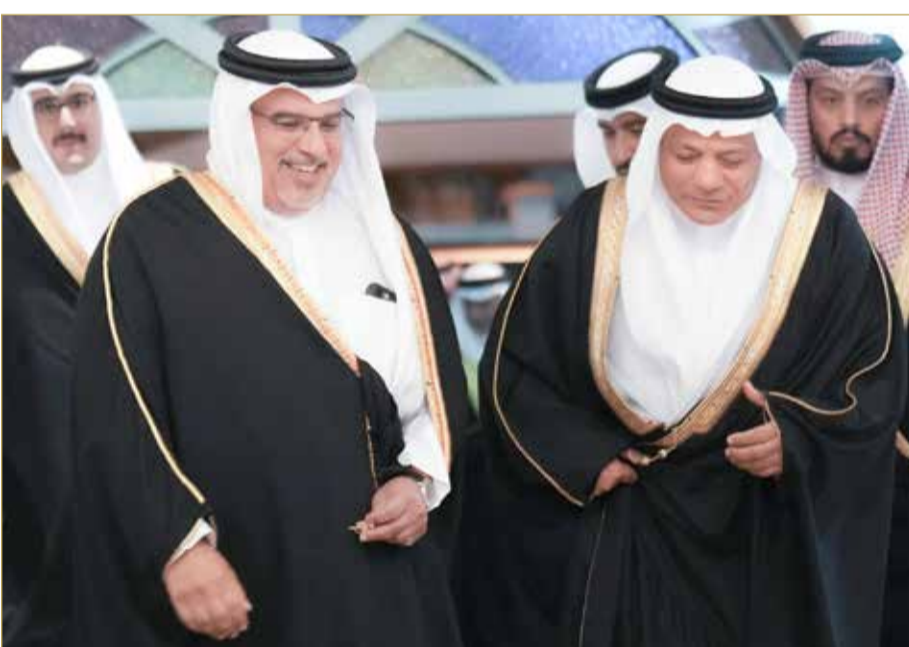
سمو ولي العهد رئيس مجلس الوزراء يقوم بزيارة مجلس أحمد منصور العالي

المنامة - بنا أعرب ولي العهد رئيس مجلس الوزراء صاحب السمو الملكي الأمير سلمان بن حمد آل خليفة عن فخره واعتزازه بما تم إنجازه من مشاريع إسكانية وتوسيع لشبكة الطرق وإنشاء وترميم للمدارس والمراكز والمستشفيات وما صاحبه من تطوير للخدمات الصحية ومبنى المطار الجديد وغيرها من المشاريع والخدمات لصالح المواطنين، وكل ذلك تم تحقيقه على الرغم من مواصلة المملكة تنفيذ مبادرات برنامج التوازن المالي الهادف لتحقيق التوازن بين المصروفات والإيرادات الحكومية، وهي جهود بارزة ومقدرة لكافة موظفي القطاع العام وبمعاون السلطة التشريعية والقطاع الخاص والأهلي. وأكد سموه، لدى زيارته أمس لمجلس الحاج أحمد منصور العالي، ومجلس مستشار جلالة الملك المعظم لشؤون الإعلام نبيل بن يعقوب الحمر ومجلس عائلة الجلامه، أهمية مواصلة تعزيز آفاق التعاون البناء بين السلطتين التنفيذية والتشريعية نحو تحقيق أولويات العمل الوطني خدمة لمصالح المواطنين وتحقيقاً للمزيد من المنجزات الوطنية. (03)