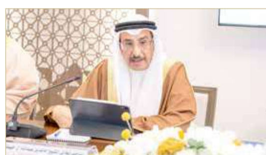
نائب رئيس مجلس الوزراء

دائمة في مختلف مسارات التنمية، ولأجل ذلك تستمر الجهود لتحقيق الأهداف المرسومة من خلال تنفيذ الخطط والبرامج للوصول للتطلعات المنشودة، وتبني المزيد من المبادرات الهادفة لتحقيق الاستدامة المالية. (04)