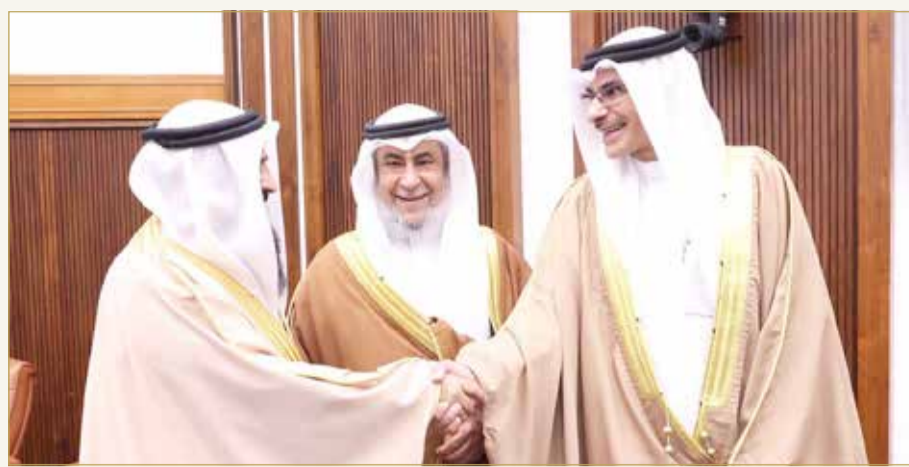
الوزيران العصفور والبوعيين والشوري معاودة

البلاد أكد وزير التنمية الاجتماعية أسامة العصفور، حرص الوزارة على التحقق من بيانات المسجلين والأفراد المتقدمين في طلب الحصول على الضمان الاجتماعي، عبر التأكد من الإقامة الفعلية في المملكة، مشيراً إلى أن وزارة التنمية الاجتماعية حريصة على توفير مناخ الأمن الاجتماعي لمستحقيه.