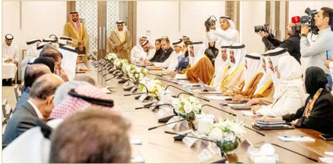
اجتماع السلطتين لبحث مشروع قانون الميزانية العامة للدولة

غير النفطية، وكوادة من ثمار العمل وفق مبادرات برنامج التوازن المالي. وأشار إلى أن الحكومة والتزام بما تم التوافق عليه في برنامجها للأعوام (2023 - 2026)، فقد روعي عند إعداد مشروع قانون الميزانية العامة للدولة، الحفاظ على الاستقرار المالي والنمو الاقتصادي الإيجابي، وخلق فرص واعدة للمواطنين، وتطوير برامج الدعم المالي والاقتصادي لرفع كفاءة توجيه الدعم لمستحقيه من المواطنين، والالتزام ببرنامج التوازن المالي، ومواصلة العمل على تطوير الأداء وجودة الخدمة الحكومية واستدامتها. من جانبه أكد وزير المالية والاقتصاد الوطني الشيخ سلمان بن خليفة آل خليفة أن مصلحة الوطن والمواطن هي أولوية دائمة في مختلف مسارات التنمية، ولأجل ذلك تستمر الجهود لتحقيق الأهداف المرسومة من خلال تنفيذ الخطط والبرامج للوصول للتطلعات المنشودة، وتبني المزيد من المبادرات الهادفة لتحقيق الاستدامة المالية، مشيراً إلى أن التفاؤل هو عنوان المرحلة القادمة على الرغم من التحديات العالمية الماثلة أمام الجميع والتي ستتمكن من تحطيمها متكاتفين جميعاً وبالعمل بروح الفريق الواحد ومنها تعزيز آفاق التعاون المشترك بين السلطتين التنفيذية والتشريعية.