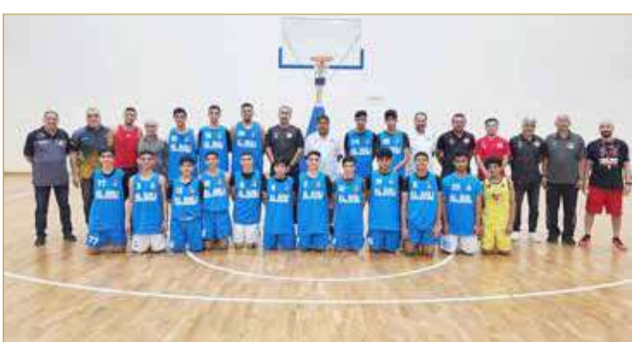
جانب من زيارة تدريبات الأهلي