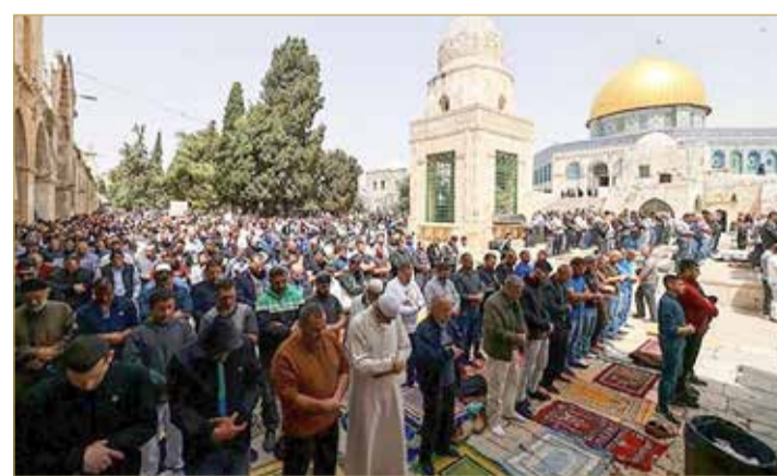
130 ألف فلسطيني يصلون الجمعة الثالثة من رمضان بالأقصى

القدس المحتلة - أف ب قتلت 3 مستوطنات بالرصاص أمس في هجوم في الضفة الغربية المحتلة، بعدما شنت إسرائيل غارات قبيل فجر الجمعة على جنوب لبنان وغزة في أحدث فصول تصعيد مفاجئ للعنف في المنطقة. وقالت إسرائيل إنها شنت ضرباتها على غزة ردا على إطلاق عشرات الصواريخ على أراضيها من القطاع ومن جنوب لبنان.