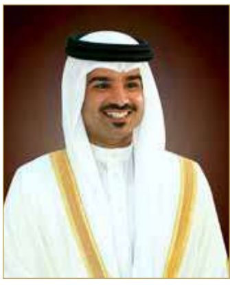
سمو الشيخ خليفة بن علي بن عيسى

أعضاء الجهازين الإداري والفني. وأشاد سمو الشيخ خليفة بن علي بن عيسى آل خليفة بالمستويات التي قدمها نادي الأهلي طوال مشواره للمباراة النهائية، لافتاً إلى أن ما قدمه جدير بالاحترام والتقدير، ومعتبراً أن خسارته لا تقلل من النجاح الذي حققه الفريق في نسخة هذا الموسم.