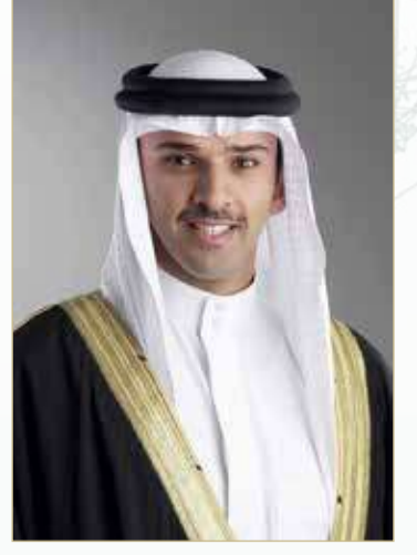
الشيخ علي بن خليفة

ثمن رئيس مجلس إدارة الاتحاد البحريني لكرة القدم الشيخ علي بن خليفة بن أحمد آل خليفة، دعم عاهل البلاد المعظم حضرة صاحب الجلالة الملك حمد بن عيسى آل خليفة، معتبرا إياه بمثابة الأساس والقاعدة التي تسير عليها الرياضة البحرينية في مختلف الألعاب الرياضية. وعبر الشيخ علي بن خليفة بن أحمد آل خليفة عن فخر واعتزاز الأسرة الرياضية عموماً والأسرة الكروية خصوصاً في مملكة البحرين بالدعم اللامحدود الذي يوليه عاهل البلاد