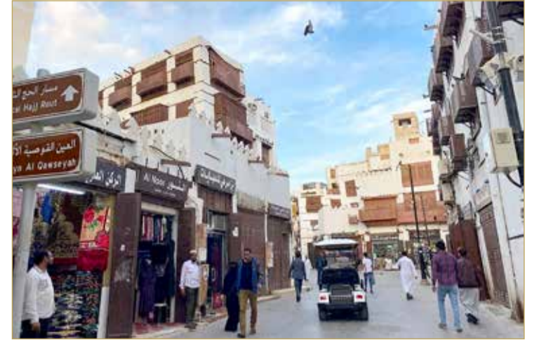
جدة القديمة.. من أكثر المناطق زيارة