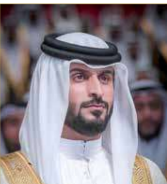
سمو الشيخ ناصر بن حمد آل خليفة الحالي، مؤكداً سموه أن هذا الفوز جاء عن جدارة واستحقاق بعد أن

قدم الفريق مستويات متميزة على امتداد مباريات المسابقة مشيداً سموه بالجهود الكبيرة التي بذلها لاعبو الفريق في المباراة النهائية والتي أسفرت عن تحقيق هذا اللقب. ونوه سمو الشيخ ناصر بن حمد آل خليفة بالأداء المتميز الذي ظهر عليه فريق الأهلي في المباراة النهائية على الرغم من الخسارة وحرص لاعبي الفريق على تقديم المستويات المتميزة في رحلتهم نحو المنافسة على اللقب الغالي، متمنياً للفريق التوفيق والنجاح في