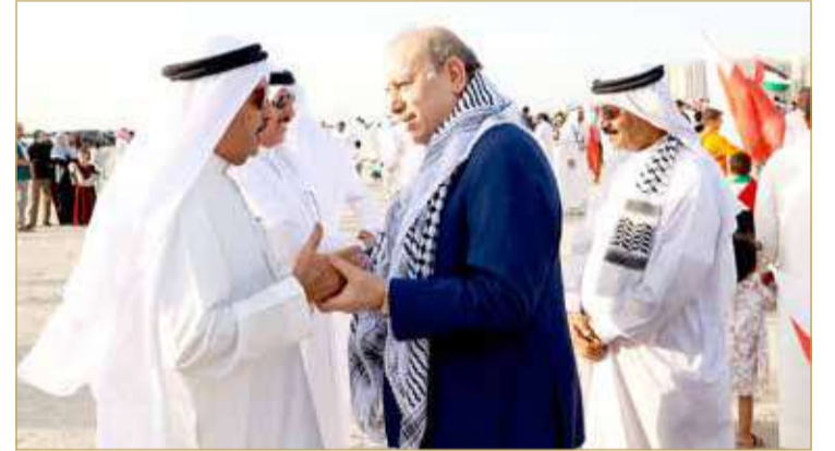
السفير الفلسطيني ومحافظ المرحق

25 جمعية سياسية وأهلية تندد باقتحام المسجد الأقصى والاعتداء على المعتكفين