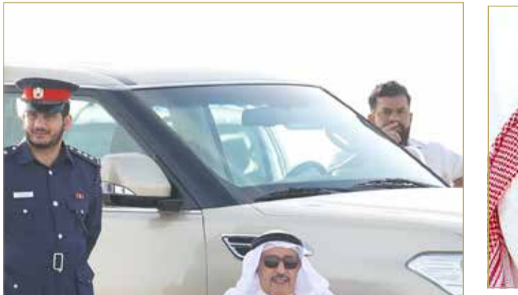
محافظ المرحق يتابع الوقفة