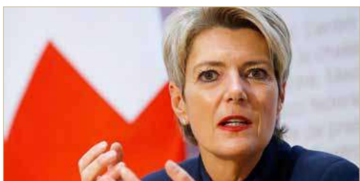
كارين كيلجر سوتير

قالت وزيرة المالية السويسرية كارين كيلجر سوتير، أمس السبت، إن استحوذ بنك "يو.بي.إس" على بنك "كريدي سويس" في صفقة بعدة مليارات ينبغي أن يمضي بسلاسة من دون عقبات سياسية. ومن المقرر أن يعقد البرلمان السويسري جلسة استثنائية بعد أيام لبحث عملية الدمج الطارئة التي نسقتها السلطات السويسرية بعد اقتراب "كريدي سويس" من الانهيار. وقدم قرابة 260 مليار فرنك سويسري (287 مليار دولار) من الدعم النقدي وضمانات من الدولة لدعم عملية الاستحواذ وتفاذي انهيار مالي ربما كان سيحدثه الانهيار الخارج عن السيطرة للبنك. وقالت سوتير في مقابلة مع صحيفة