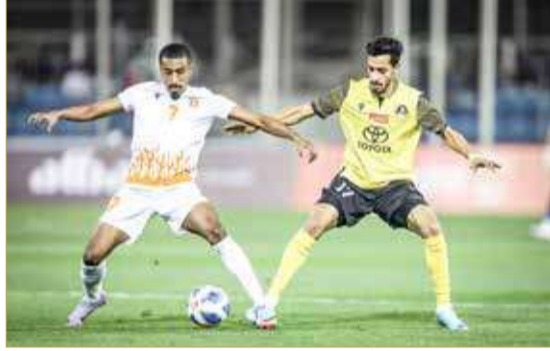
من لقاء الحالة والأهلي بالنهائي