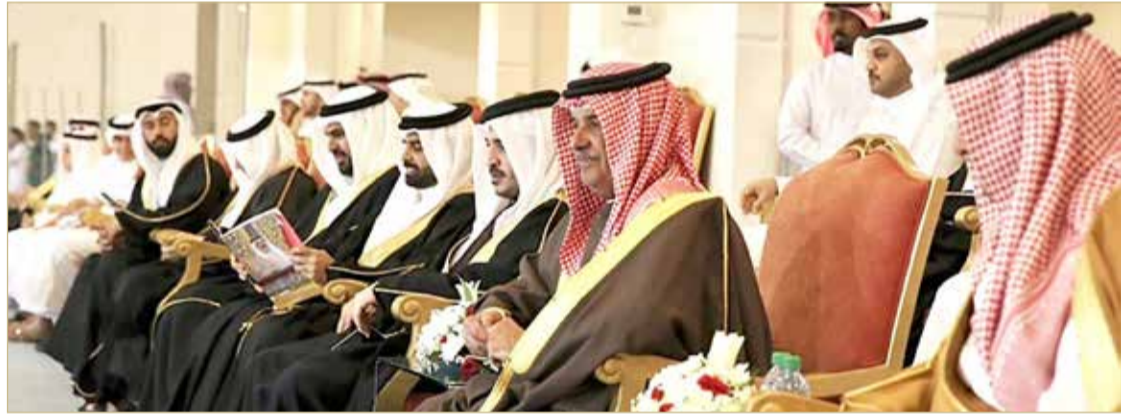
سمو الشيخ عيسى بن سلمان مع اصحاب السمو والمعالي في نهائي كأس الملك