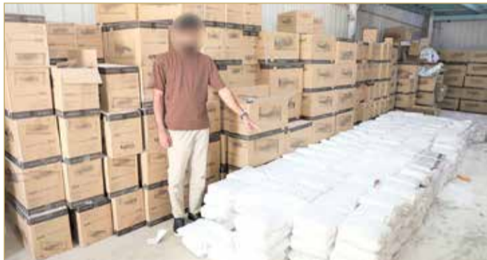
الغامة - وزارة الداخلية

تحديد هوية المذكورين والقبض عليهم وبحوزتهم المادة المضبوطة، فيما تم ضبط بقية المواد الممنوعة مخبأة في مستودع بمنطقة الهلمة، حيث قدرت قيمة المضبوطات بحوالي 61 ألف دينار، وأشارت مديرية شرطة محافظة العاصمة إلى أنه تم اتخاذ كافة الإجراءات القانونية اللازمة، تهديداً لإحالة القضية إلى النيابة العامة.