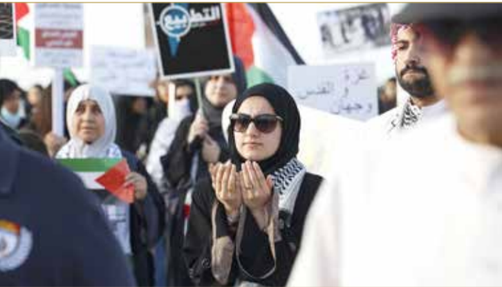
الدعاء للمرابطين والمعتكفين

البلاد | تصوير: رسول الجبري نظمت جمعية مناصرة فلسطين وقفة جماهيرية تحت عنوان "لبيك أقصانا" وذلك عصر أمس (السبت) في منطقة الساية بالسميتين. وشهدت الوقفة المرخصة حضوراً حاشداً من الجنسين، وتواجد السفير الفلسطيني طه عبدالقادر وعدد من أفراد الجالية الفلسطينية. ورفع المشاركون بالوقفة أعلام البحرين وفلسطين واللافتات التضامنية والشعارات الداعمة للأقصى وفلسطين.