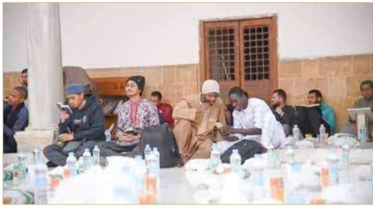
طلاب وافدون من 110 دول يلتقون بصحن الأزهر