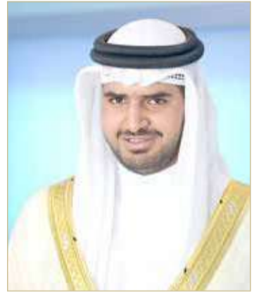
سمو الشيخ عيسى بن علي بن خليفة