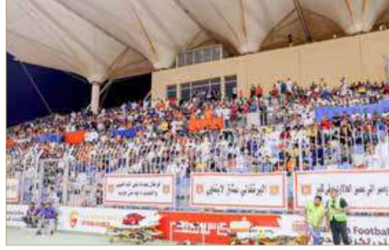
جماهير الحالة ساندت الفريق بقوة

اللاعبون بحجم المسؤولية الملقاة على عاتقهم، ولكن الحظ عاندهم في ظل الأداء المتميز الذي قدموه على امتداد المواجهة.