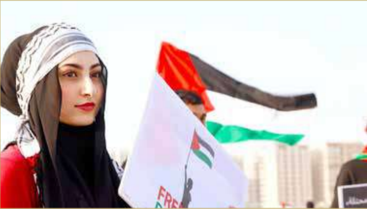
حملت لافتة داعمة لفلسطين