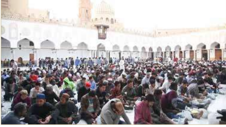
إفطار لأكثر من 5 آلاف طالب يوميا