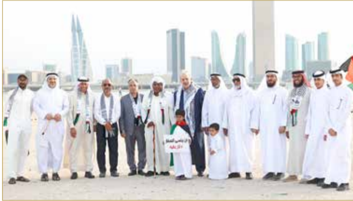
... ومتوسطاً النائب الحسيني وعدداً من ممثلي الجمعيات وآخرين