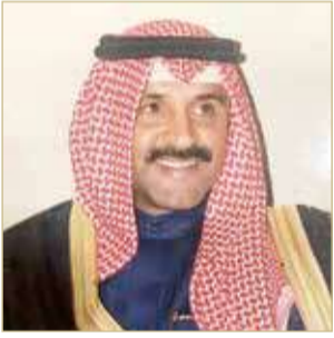
صالح بن عيسى بن هندي

هنا مستشار جلالة الملك لشؤون الشباب والرياضة صالح بن عيسى بن هندي المناعي، نادي الحالة بمناسبة الفوز بلقب كأس الملك جلالة الملك المعظم للموسم الرياضي 2022/2023.