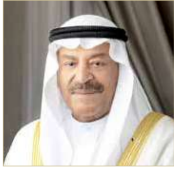
رئيس مجلس الشورى

على دعم ومساندة المساعي الدولية في نشر ثقافة السلام والحوار بين مختلف الشعوب والدول، يشكل امتداداً للتاريخ العريق، والحضارة المشهودة لمملكة البحرين منذ قرون، مؤكداً أن المجتمع البحريني يعتبر النموذج الأسمى للتلاحم والتقارب، والالتزام بالقيم والمبادئ الحميدة. ولفت رئيس مجلس الشورى إلى أن الضمير الإنساني، والفضرة البشرية السليمة تحتم على الدول والشعوب أن تتعااضد وتكاتف؛ من أجل تحقيق أهداف التنمية المستدامة، والنهوض بالمجتمعات، والعمل وفق أسس وركائز تضمن السلام والأمن والاستقرار لجميع الشعوب والدول.