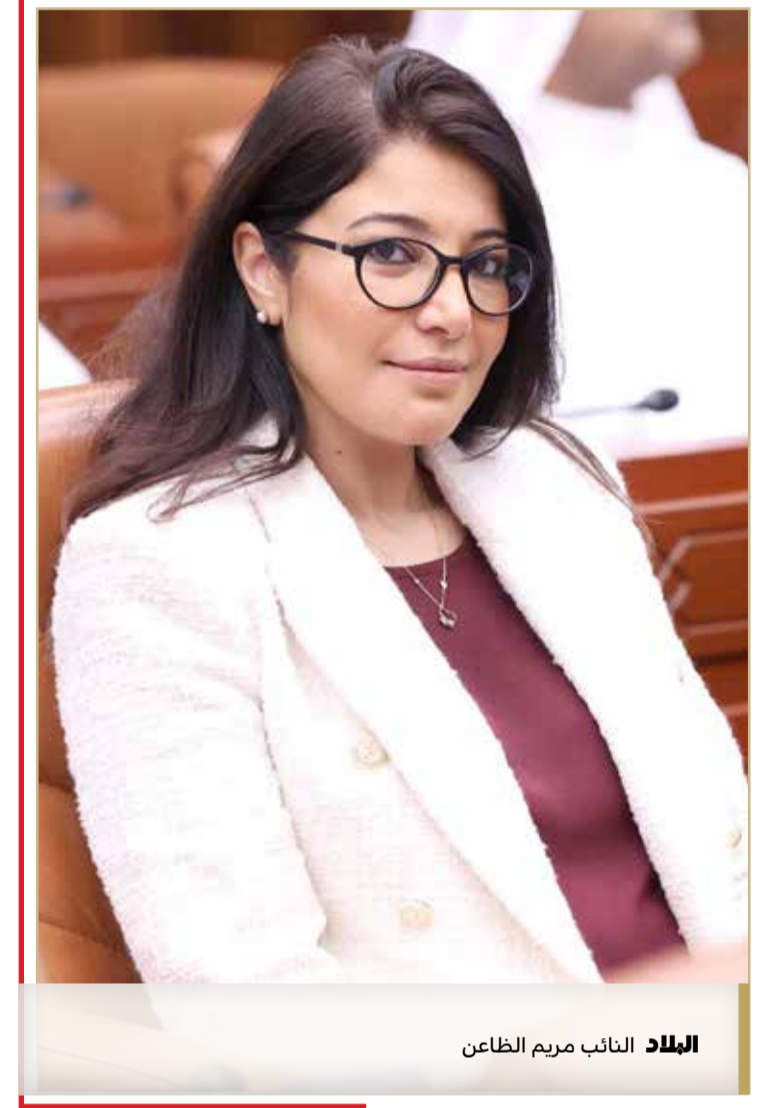
النائب مريم الظاهر

زيادة فعالية لرواتب الموظفين. بدوره، أكد وزير شؤون مجلس الشورى والنواب غانم البوعيين أن هناك ديناميكية لتحسين الوضع المعيشي للموظفين وأن الفرص والمزايا مستمرة لتحسين وضعه المعيشي.