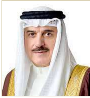
رئيس مجلس النواب

البحرين في مجال الحوار والتقارب بين الحضارات والثقافات والأديان، بجانب جهود وإنجازات المؤسسة الملكية للأعمال الإنسانية، ومركز الملك حمد العالمي للتعايش السلمي، وكرسي الملك حمد للحوار بين الأديان والتعايش السلمي في جامعة لاساينزا الإيطالية، وتدشين "إعلان مملكة البحرين" لتعزيز الحريات الدينية، والعديد من البرامج التي تسعى لخدمة الإنسانية. ودعا المجالس البرلمانات والاتحادات، إلى تعزيز التعاون والتكاتف الإنساني، وإطلاق وتبني المزيد من التشريعات والبرامج التي تساند الدول والحكومات والفاهج التعليمية والأنشطة الدينية والثقافية في تحقيق كل ما فيه خير البشرية في عالم يشهد الكثير التحديات المتعددة.