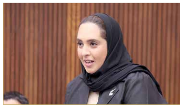
وزيرة الإسكان والتخطيط العمراني

للأخطاء الهندسية والتي تكون أخطاء جسيمة تهدد الإسكانية لتسليمها للمتفعين. وأشارت إلى أن الوزارة تتحقق من جودة الوحدة السكنية بعد تسلمها من المقاول مباشرة وخلال فترة الضمان، ففي حال وجود أي ملاحظات يتم توثيقها وإبلاغ المقاول بها لتعديلها أو تحسينها، كما تقوم الوزارة بعد تسليم الوحدة السكنية وفي حال تلقي أي ملاحظات من المواطنين سواء خلال فترة الضمان أو بعد انتهاء الضمان يتم دراستها والنظر في مدى وجود حلول فنية أو هندسية التزاماً منها بتحسين جودة الخدمة المقدمة للمواطن.