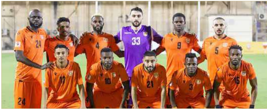
فريق الحالة لكرة القدم