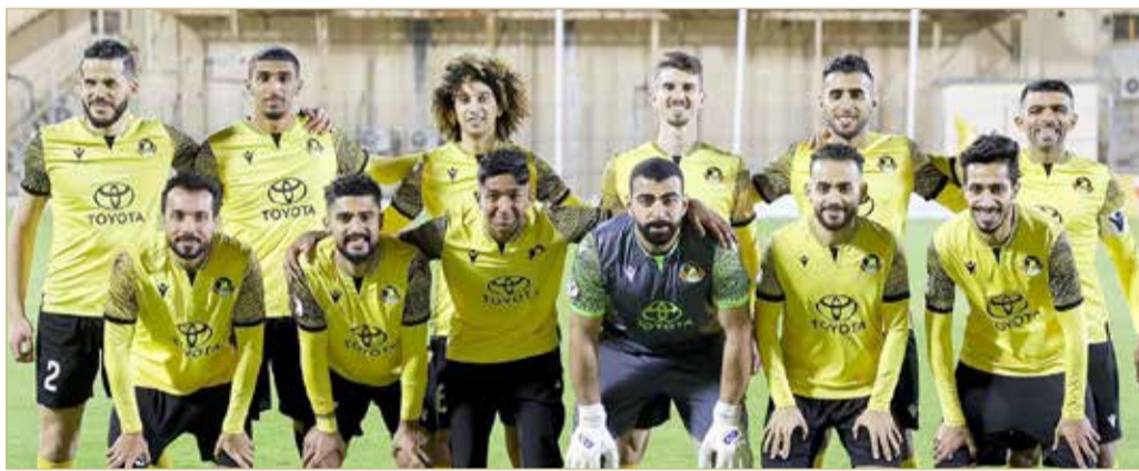
فريق الأهلي لكرة القدم