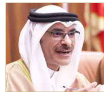
وزير التنمية الاجتماعية

قالت وزارة التنمية الاجتماعية إن عدد المستفيدين من الدعم المالي للأسر محدودة الدخل بلغ 130,234، منها 17,430 طلباً معتمداً في الضمان الاجتماعي وذلك بحسب آخر إحصائية مسجلة في أنظمة وزارة التنمية الاجتماعية لدفعة شهر مارس الماضي من العام الجاري 2023.