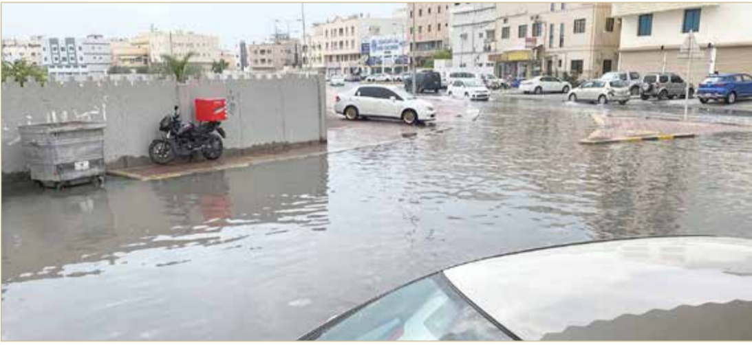
تجمعات الأمطار عند مقبرة المحرق

الوظيفي، مشيراً إلى أن المرودود المالي أكثر عدالة من التعويض بساعات الراحة وبذاته يعد حافظاً للموظف الحكومي للعطاء بشكل أكبر والإسهام في تعزيز جودة العمل.