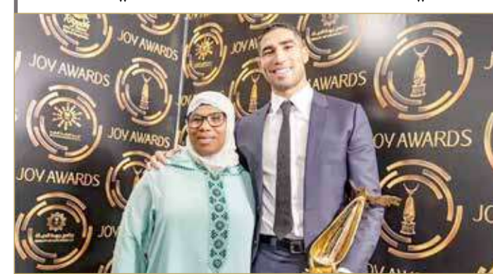
لاعب كرة القدم المغربي أشرف حكيمي مع والدته