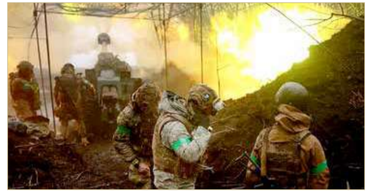
أوكرانيا تعلن عن هجمات روسية متواصلة على باخموت

من الرئيسة والحكومة، واحتجاجات ضد تجاهل مصالح التنمية الاقتصادية في البلاد، حيث أدان الغرب ذلك باعتباره محاولة للإطاحة بالسلطات الشرعية".