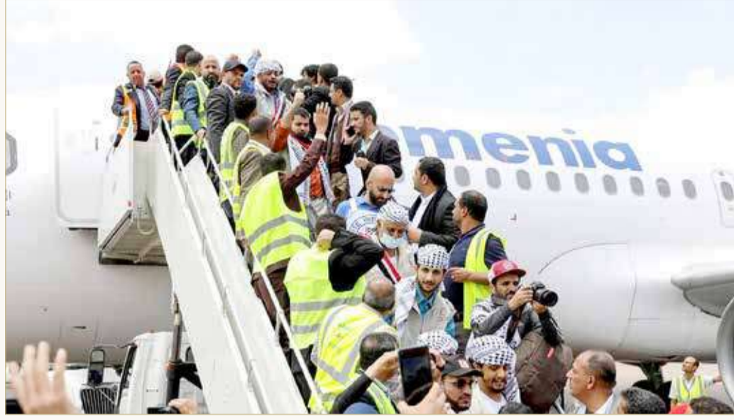
عملية التبادل ستجري على مدار ثلاثة أيام

وقالت في وقت لاحق "بعد وقت قصير، أقلت طائرة" نقل أسرى من الحوثيين "من مطار عدن". وتتخذ الحكومة من عدن مقرا مؤقتا لها. وستقل طائرة أخرى تابعة للجنة الدولية للصليب الأحمر من صنعاء وطائرة أخرى من عدن (جنوب)، وبلغ عدد الأسرى الإجمالي الذين نقلتهم الطائرات الأربع أمس نحو 320 سجيناً. وأفادت الحكومة اليمنية بأنه سيفرج عن 72 من أسراها، بينهم وزير الدفاع الأسبق اللواء الركن محمود الصبيحي واللواء الركن ناصر منصور هادي، شقيق الرئيس السابق عبد ربه منصور هادي. وسيصل هؤلاء إلى عدن قادمين من صنعاء، فيما ذكر مسؤول حوثي أن عملية الإفراج ستشمل 250 من أسرى الحوثيين سيعودون إلى صنعاء آتين من عدن. وتوصل الحوثيون والحكومة خلال مفاوضات انعقدت في برن الشهر الماضي إلى اتفاق على تبادل أكثر من 880 أسيراً. وبموجب الاتفاق،