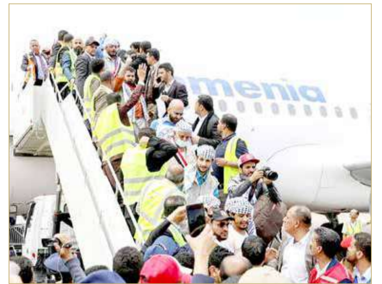
عملية التبادل ستجري على مدار ثلاثة أيام

بدأت في اليمن أمس عملية لتبادل مئات السجناء بين طرفي النزاع، في بارقة أمل جديدة تعطي دفعا للجهود الدبلوماسية الهادفة لوضع النزاع الدامي على سكة الحل. ويأتي ذلك غداة مغادرة وفد سعودي صنعاء بعد محادثات مع المتطرفين الحوثيين بعد التوصل إلى تفاهم "مبدئي" حول هدنة في البلاد وعقد جولة أخرى من المحادثات، وفق ما أفاد مسؤولان حوثيان ومسؤول حكومي يمني أمس. وقالت مستشارة الإعلام لدى اللجنة الدولية للصليب الأحمر جيسكا موسان "أقلت أول طائرة من صنعاء" وعلى متنها أسرى من قوات الحكومة اليمنية المعترف بها دولياً باتجاه عدن (جنوب). (11)