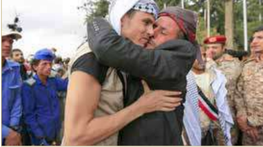
أسير حوثي خلال استقباله في مطار صنعاء

أعلن المتحدث الرسمي باسم قوات تحالف دعم الشرعية في اليمن العميد الركن تركي المالكي، استكمال عملية تبادل الأسرى والمحتجزين بإطلاق سراح 104 أسرى من الحوثيين لدى التحالف بمبادرة إنسانية من السعودية. وأضاف المالكي أن هذه المبادرة تأتي امتداداً للمبادرات الإنسانية السابقة من المملكة والمتعلقة بالأسرى، ودعم الجهود الرامية لتثبيت الهدنة وتهيئة أجواء الحوار بين الأطراف اليمنية للوصول إلى حل سياسي شامل ومستدام ينهي الأزمة اليمنية. وبحسب ما نشرته وكالة الأنباء السعودية "واس"، تهدف المبادرة "لحث أطراف النزاع على دعم عملية تبادل الأسرى والمحتجزين، وإنهاء هذا الملف انسجاماً مع القيم الإسلامية والمبادئ الإنسانية والتقاليد العربية الأصيلة، ونصوص القانون الدولي الإنساني الواردة بنصوص وأحكام اتفاقية جنيف الثالثة للأسرى".