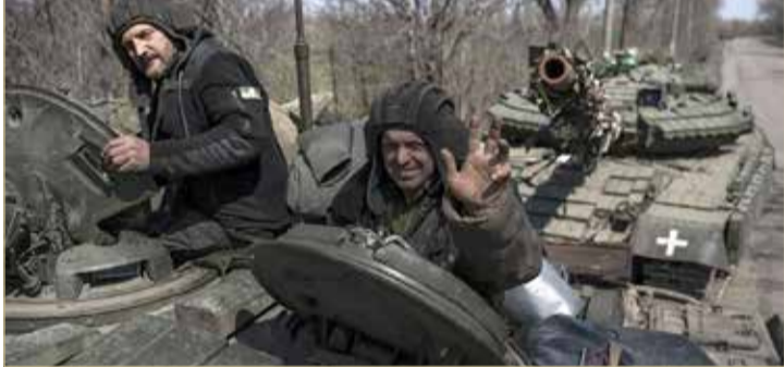
فاغنر، أكثر من 80% من مساحة باخموت تحت سيطرنا

بعمليات إطلاق إلكترونية. وكان وزير الدفاع الروسي، قد أعلن يوم الجمعة الماضي، في اجتماع مع قيادة وزارة الدفاع، أنه تم رفع تاهب أسطول المحيط الهادئ بكامل قوته إلى أعلى درجات الاستعداد في إطار إجراء فحص مفاجئ.