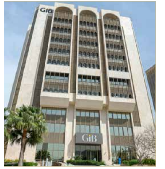
ووافق المساهمون على تسوية رصيد الأرباح المستبقاة السالبة والبالغة 729 مليون دولار بتاريخ ديسمبر 2022م من رأس المال والاحتياطيات. وبذلك، قام البنك بخفض رأسماله بمقدار 500 مليون دولار

وأعلن بنك الخليج الدولي (ش.م.ب.)، حصوله على موافقة مساهميه على إعادة هيكلة حقوق ملكية البنك، وذلك بعد أن حصل على موافقات الجهات الرقابية، وتم ذلك في اجتماع الجمعية العامة غير العادية المنعقد يوم الخميس 30 مارس 2023. وتهدف هذه الخطوة إلى دعم استراتيجية نمو بنك الخليج الدولي في مناطق التركيز الجغرافي والأسواق الاستراتيجية المستهدفة، استكمالاً لمسيرة التقدم والريحية التي تحققت خلال العامين الماضيين، مع بقاء حقوق ملكية المساهمين دون تغيير بعد إعادة الهيكلة.