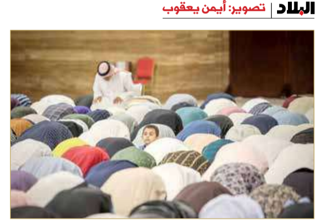
إحياء ليلة القدر المباركة بجامع مركز أحمد الفانح الإسلامي

◆ بجامع المغفور لها سمو الشيخة موزة بنت حمد آل خليفة