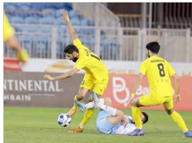
بقية مباريات الجولة التي شهدت تعثر معظم فرق المقدمة، حيث

وعلى الجانب الآخر، استطاع نادي سترة مواصلة نتائجه الإيجابية بعد فوزه على نادي الحالة بثلاثة أهداف مقابل هدفين، ليصل سترة بفضل هذا الفوز إلى النقطة الرابعة والثلاثين ويعزز موقعه في صراع