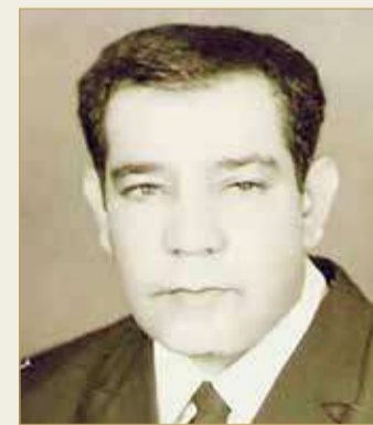
صنقور في صباه

وزير العدل والشؤون الإسلامية والأوقاف الأسبق سمو الشيخ عبدالله بن خالد آل خليفة رحمه الله سبق وأن قال عنه "الإنسان خلال حياته على الأرض واحد من اثنين، شخص يمضي ويطول النسيان، وشخص يبقى في ذاكرة بلده وصحبه وأهله أئراً طيباً يطوف في العقل والقلب وتستدعيه الذاكرة حيناً بعد حين".