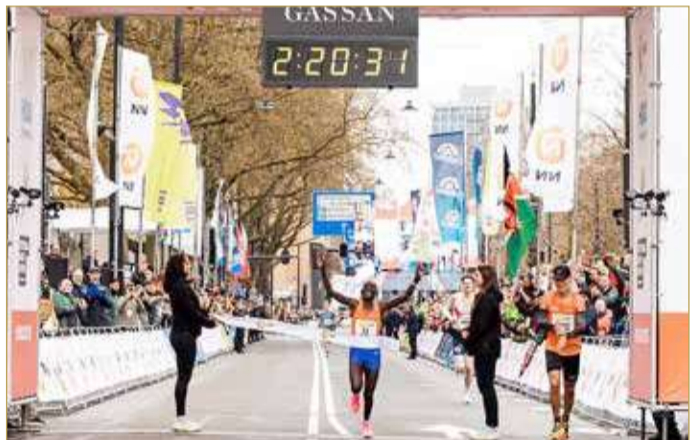
جومبا عند خط النهاية