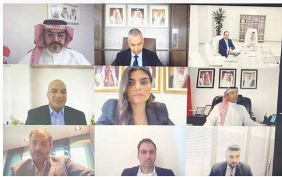
اجتماع مجلس إدارة هيئة البحرين للسياحة والمعارض عن بعد