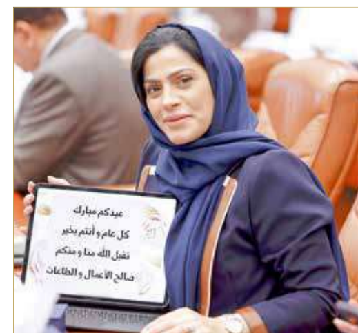
باسمة مبارك وتهنئة عيد الفطر السعيد

البلاد شكت النائب باسمة مبارك مما وصفته بـ "ضعف" صلاحيات النواب، معتبرة أن الأدوات الدستورية غير فعالة. من جانبه، رد النائب ممدوح الصالح عليها قائلاً "تشجعي واستجوبي".