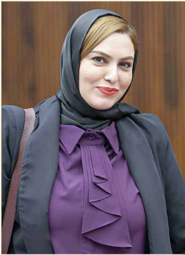
البلاد النائب زينب عبدالأمير