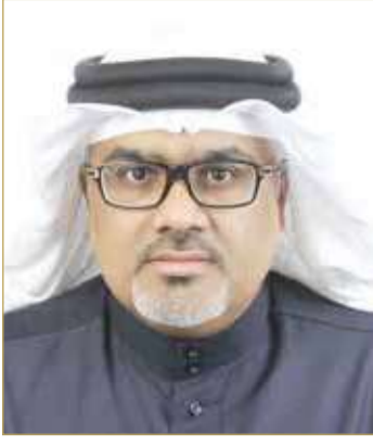
عارف خليفة العقار السكني والذهب على المدى المتوسط وال المدى الطويل، والنصف الثاني تستثمر في منتجات تحمل

الشخصية". وعن كيفية إدارة المتقاعد لأمواله، أوضح خليفة "أن الـ 50% الأولى تكون من غير استثمار وتوضع لوحدها ومنها لتغطية بعض القروض ولتكملة باقي مشاريع العمر لربما حج بيت الله والميزانية الرئيسية للعائلة (الضروريات، الكماليات والطوارئ) ولا بأس باستخدامها لتحقيق باقي الأمنيات الفردية مع الحذر كل الحذر من الإسراف والتبذير". أما الـ 50% الثانية فتوزع كالآتي: نصفها للاستثمار في المنتجات التي تحمل خطورة قليلة وتبدأ من الودائع في البنك وتنتهي في الاستثمار في