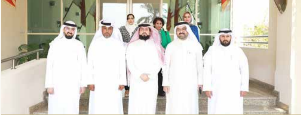
لجنة الشؤون المالية والاقتصادية بمجلس النواب

وأكد رئيس اللجنة أن الاجتماع استعرض البيان المالي والاقتصادي المرافق لمشروع القانون أعلاه، والمشروعات الحكومية للسنتين الماليتين 2023 - 2024م، وتفاصيل ميزانية الجهات المعنية، وقانون الميزانية العامة