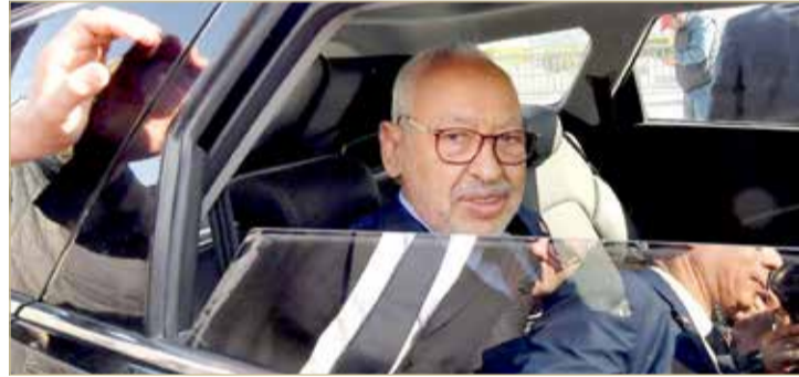
النهضة تصف قرار سجن رئيسها بأنه سياسي