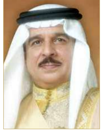
ملك البلاد المعظم

تلقى ملك البلاد المعظم صاحب الجلالة الملك حمد بن عيسى آل خليفة، برفقة تهنئة من ولي العهد رئيس مجلس الوزراء صاحب السمو الملكي الأمير سلمان بن حمد آل خليفة، رفع سموه فيها إلى مقام جللته السامي خالص التهاني والتبريكات بمناسبة حلول عيد الفطر المبارك، سائلا الله عز وجل في هذه المناسبة المباركة أن يمد جللته بموفور الصحة والعافية وطول العمر، وأن تبقى مملكة البحرين بقيادة جلالة الملك المعظم دائما كما يتمناها جللته في تقدم وتطور وسلام وازدهار، داعيا سموه المولى سبحانه وتعالى أن يعيد هذه المناسبة على جللته، والبحرين وأبنائها الأعداء، وعلى الأمتين العربية والإسلامية بالخير واليمن والبركات. وبعث عاهل البلاد المعظم برفقة شكر جوازية إلى صاحب السمو الملكي ولي العهد رئيس مجلس الوزراء، أعرب جللته فيها عن أسمى آيات التهاني والتبريكات لسموه بمناسبة حلول عيد الفطر المبارك، مقرونة بخالص الأمنيات بأن يحفظ الله سموه وأن يتمتع بموفور الصحة والعافية والسعادة، وأن يسدد على طريق الخير خطاه، وأن يعيد هذه المناسبة على سموه ومملكة البحرين وشعبنا الوفي والأمتين العربية والإسلامية بالخير واليمن والمسرات.