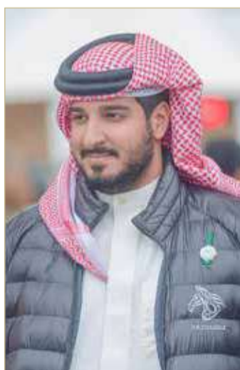
سمو الشيخ عيسى بن عبدالله آل خليفة

أعرب رئيس الاتحاد الملكي للفروسية وسباقات القدرة سمو الشيخ عيسى بن عبدالله آل خليفة عن شكره وتقديره إلى شركة أنفوناس بمناسبة تقديم الشركة دعماً لبطولة سمو الشيخ فيصل بن حمد آل خليفة (طيب الله ثراه) لجمال الخيل العربية للإنتاج المحلي في نسختها الثامنة، التي ستقام خلال الفترة من 27 حتى 29 أبريل الحالي على ميدان الاتحاد الرياضي العسكري بنادي راشد للفروسية وسباق الخيل.