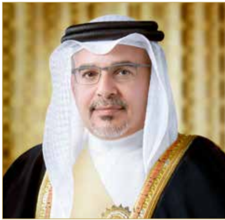
سمو ولي العهد رئيس مجلس الوزراء

على نائب رئيس مجلس الوزراء والوزراء والمعنيين - كلٌ فيما يخصه - تنفيذ أحكام هذا القرار، ويُعمل به من تاريخ صدوره.