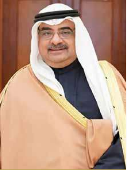
سمو الشيخ سلمان بن خليفة