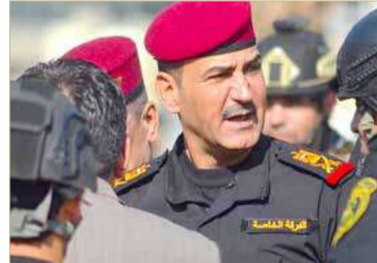
السوداني يقيل قائد الفرقة الخاصة الفريق حامد الزهيري

أداء الأجهزة الأمنية". وكان مسؤول في وزارة الداخلية قد قال الأربعاء طالبا عدم نشر اسمه إنه تم توقيف ثمانية ضباط و18 شرطيا على خلفية عملية الفرار هذه. وأمر السوداني بخلق مركز التوقيف في مركز شرطة كرادة مريم داخل المنطقة الخضراء، الذي شهد جريمة الهروب، ونقل المحكومين إلى سجون وزارة العدل، وإيداع كبار الفاسدين الموقوفين فيه في مراكز توقيف أخرى أسوة مع المطلوبين الآخرين.