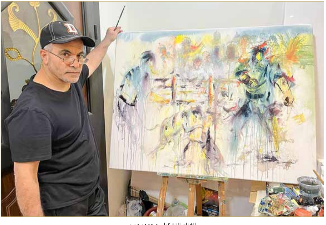
الفنان التشكيلي محمد بحرين