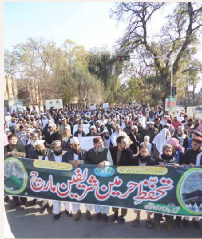
إحدى المسيرات المؤيدة للسعودية والرافضة للهجوم الحوثي على المملكة

◆ دول مجلس التعاون تتصدر دائماً تقديم المساعدات للدول المحتاجة