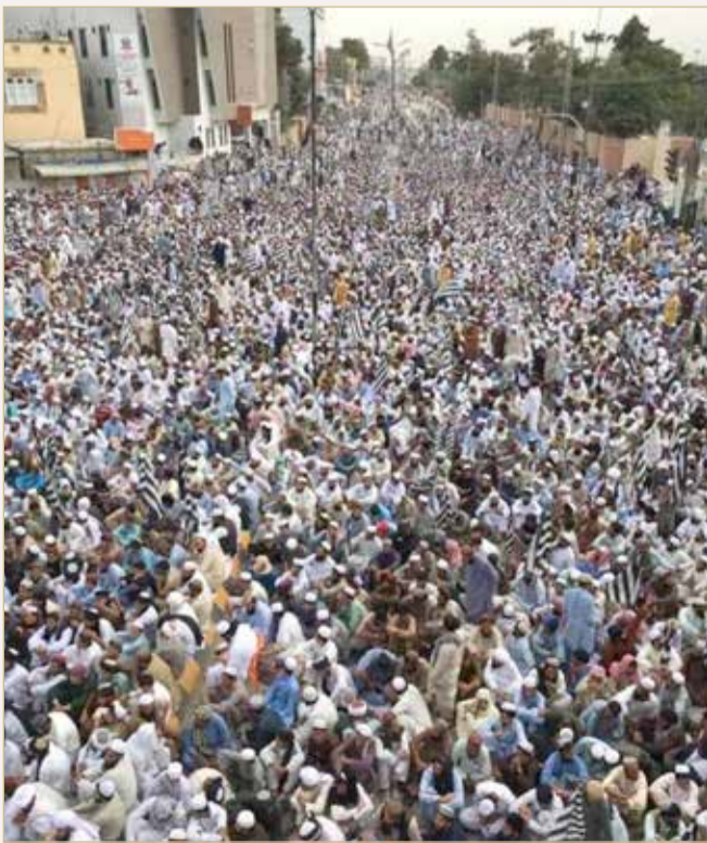
مسيرة في باكستان تدافع عن الحرمين الشريفين

للجمعية مواقف واضحة في مساندة الدول العربية والإسلامية ومناصرتها ضد الظلم، والجور، والتدخلات، منها موقفها من الاحتلال العراقي الغاشم لدولة الكويت العام 1990، حيث كانت للجمعية وقفة تاريخية ومناصرة للكويت وللشعب الكويتي جزاء ما حصل، ولقد أقمنا حينها العديد من المسيرات المناصرة، والمواقف السياسية المتعددة بذلك، حيث كنا مخالفين جملة وتفصيلاً لما فعله صدام حسين،