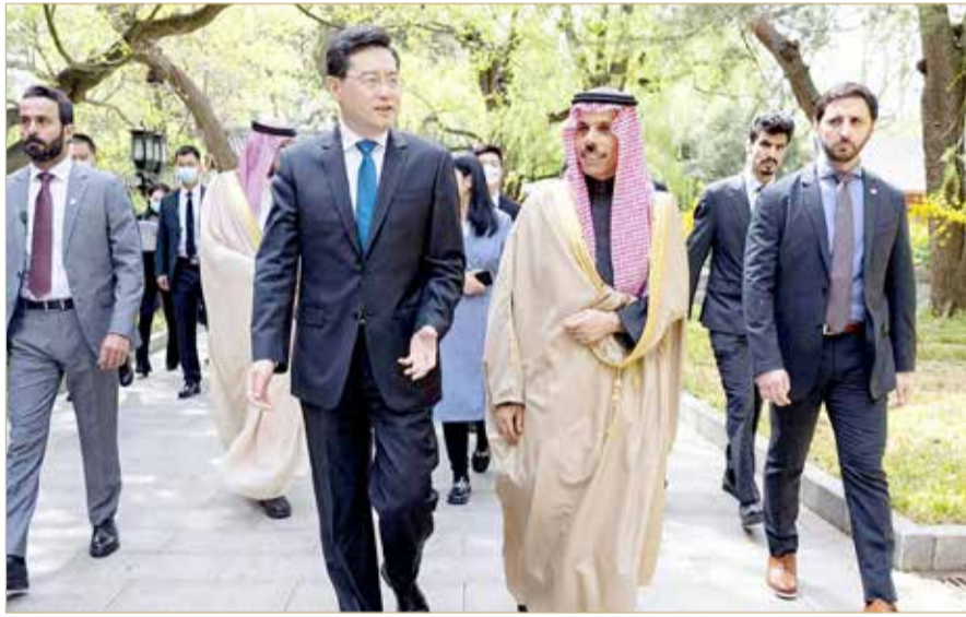
الصين تكسر هيمنة الدبلوماسية الأمريكية على قضايا الشرق الأوسط

وأشارت إلى بصمة صينية في الشرق الأوسط، معتبرة أنه لم يكن من الممكن تخمينها قبل ستة أشهر، في دلالة على فاعلية نشاط الدبلوماسية الصينية في فضاء جغرافيا سياسي كان تقليدياً ملعباً للدبلوماسية الأمريكية. ولفتت بلومبرغ إلى تنشيط الصين دبلوماسيتها في الشرق الأوسط. ولفتت إلى أن وزير الخارجية الصيني تشين غانغ أطلق جهوداً لتشجيع استئناف المحادثات الإسرائيلية الفلسطينية. وقالت أيضاً إنه "على الصعيد المالي، افتتح البنك الآسيوي للاستثمار في البنية التحتية ومقره بكين أول مكتب خارجي له في أبوظبي، بينما يهدف مقر المكتب التشغيلي للبنك في سوق أبوظبي العالمي إلى العمل كوجهة إستراتيجية لدعم أجيالته".