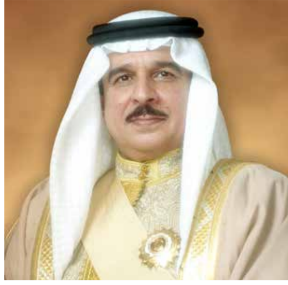
ملك البلاد المعظم

وتم خلال الاتصال الهاتفي تبادل التهاني والتبريكات بمناسبة عيد الفطر المبارك، سائلين المولى عز وجل أن يعيد هذه المناسبة المباركة على الشعبين والبلدين الشقيقين بمزيد من الرخاء والتقدم والرفعة، وعلى الأمتين العربية والإسلامية بالخير واليمن والبركات.