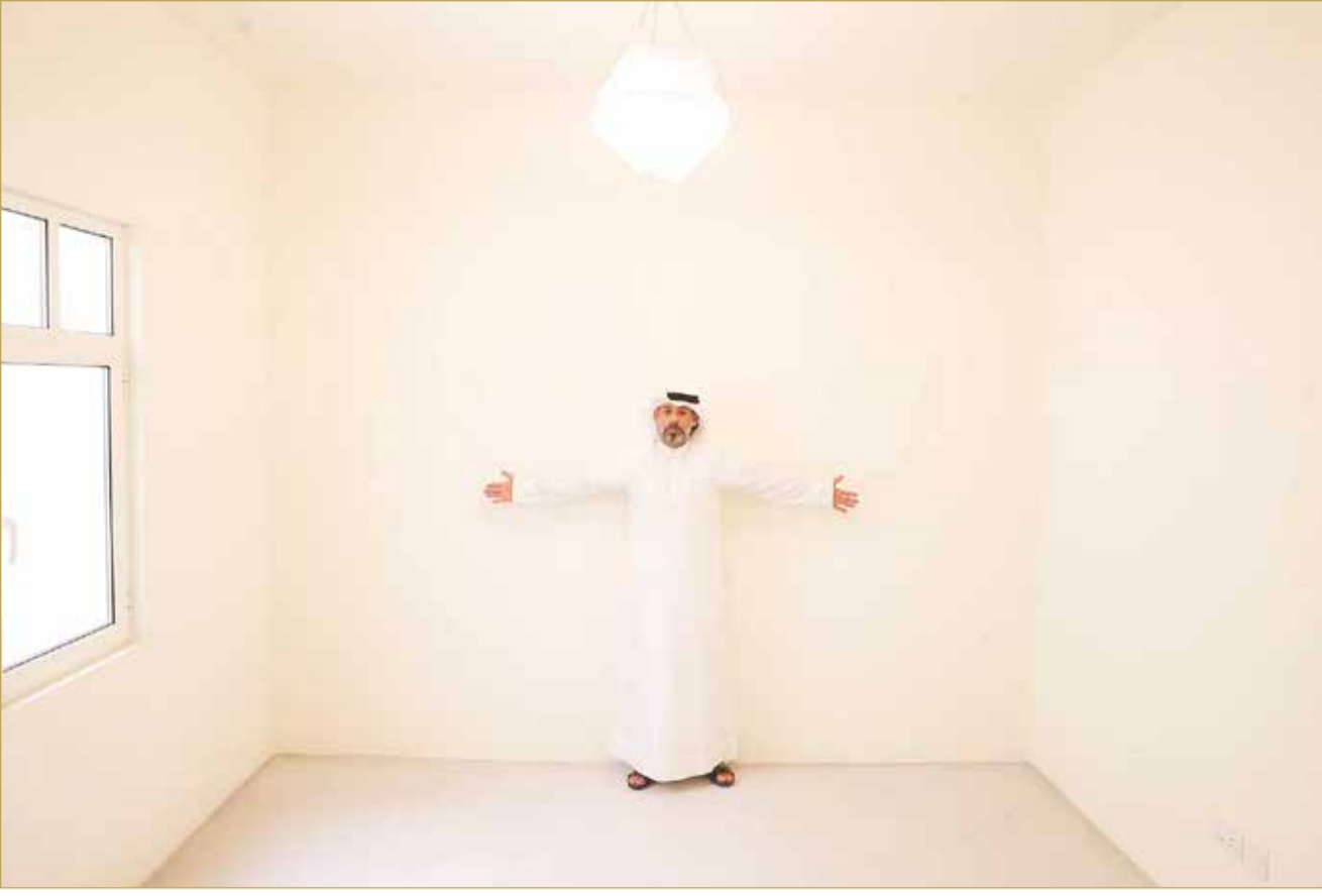
الطيار في لقطة توضيحية لمحدودية مساحة الصالة