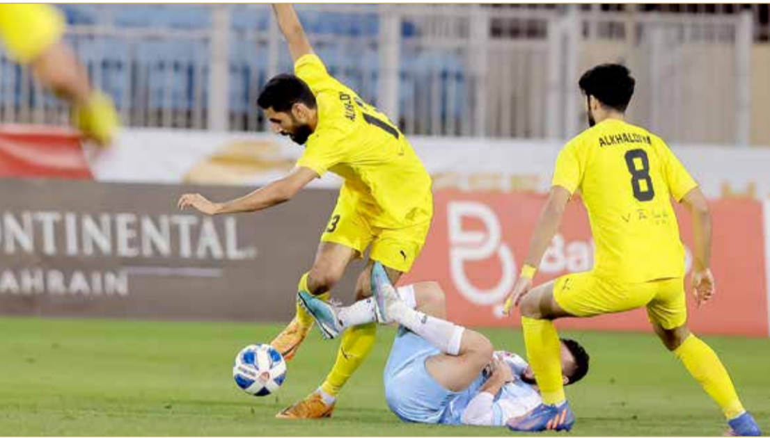
من منافسات كرة القدم في الموسم الحالي