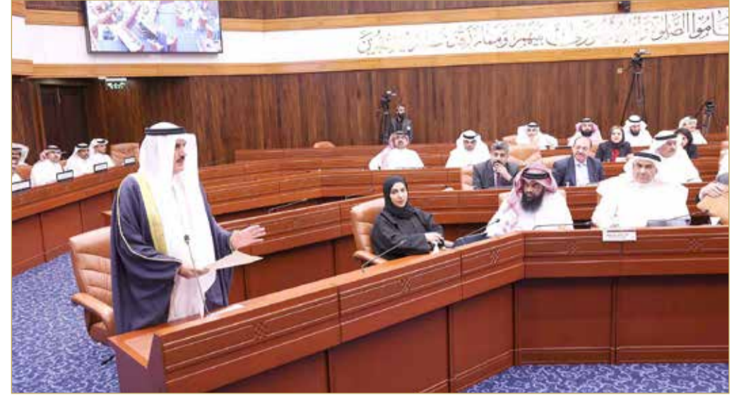
المسلم هبط من منصة الرئاسة للتعقيب على إجابة سؤاله البرلماني عن مشكلات "إسكان شرق الحد"