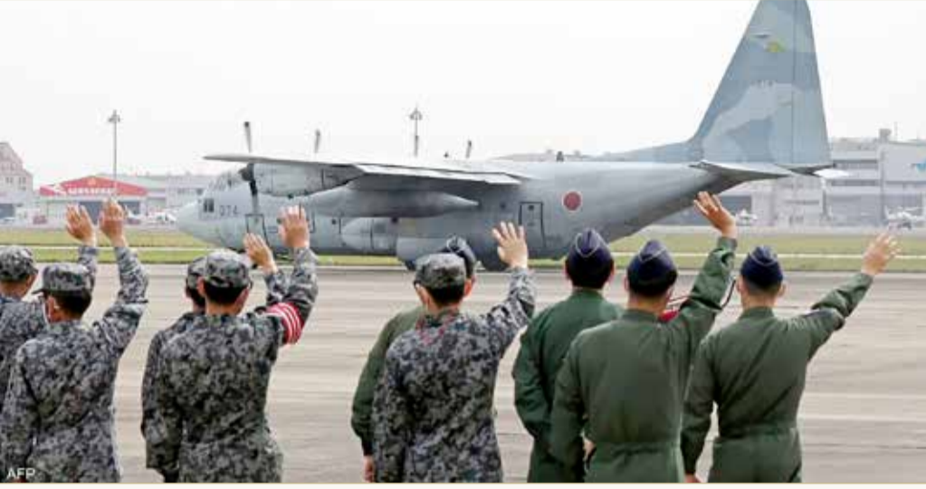
طائرة يابانية أقلعت صوب جيبوتي لإجلاء الرعايا بالسودان