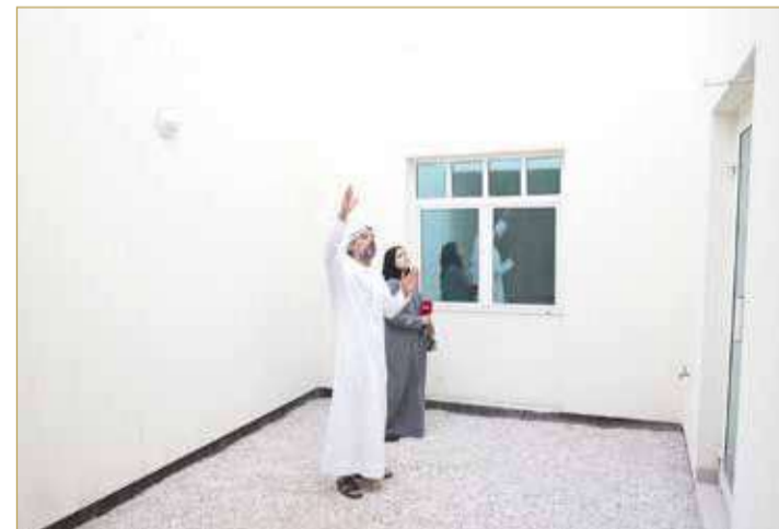
"البلاد" خلال الجولة الميدانية