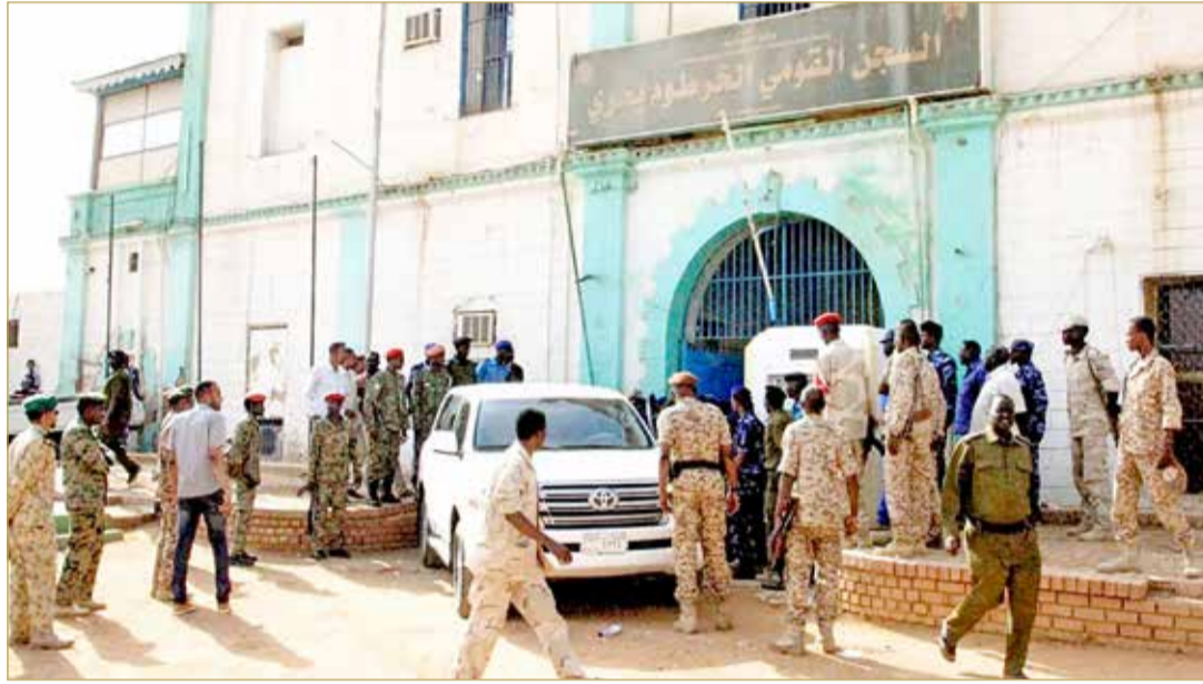
مصادر تنفي هروب البشير من سجن "كوبر" مؤكدة وجوده بمستشفى "السلاح الطبي"

موظفي سفارتها برا وجوا وبحرا، ويبدو أن العديد من جهود الإجلاء تتم عبر بورتسودان على البحر الأحمر، التي تقع مباشرة على بعد نحو 650 كيلومتراً شمال شرق الخرطوم، لكنها تبعد نحو 800 كيلومتر عن طريق البر. (12)