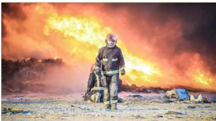
رجال الدفاع المدني يجارفون بأنفسهم لإبادة الأرواح