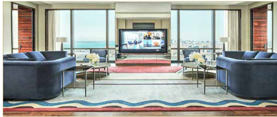
الغناح الملكي بفندق فور سيزونز - البحرين

الأسبوع 5718 ديناراً، مقارنة بسعر الغناح نفسه في فور سيزونز - دبي الذي يبلغ 90 ألف درهم، أي ما يعادل 9 آلاف دينار بحريني. (13)