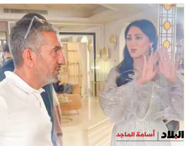
البلاد | أسامة الماجد

يصدر فيها المخرج الكبير أحمد المقلة قائمة أفضل المخرجين على مستوى الخليج، بل سبق أن اعتلى منصة التتويج مرات عديدة وحقق نجاحات مرموقة ونال عنها جوائز رفيعة، فالمقلة يعتبر مدرسة في الإخراج وعالمياً قائماً بذاته، وأهم ما يميزه هو وضعه اللقطة في نظام معين ويضيف إليها بعض الجماليات حتى تمتلك الأركان الأساسية التي تهر المشاهد. حقق المخرج القدير أحمد يعقوب المقلة أعلى نسبة أصوات كأفضل مخرج دراما خليجية في الاستفتاء الذي أجرته الخليج الإماراتية وشارك به نحو 8 آلاف وذلك عن مسلسل "طوق الحرير" من إنتاج مؤسسة دبي للإعلام، وتأليف منى النوفلي، وبطولة الفنان أحمد الجسمي، والفنانة سميرة أحمد، كما حصلت الفنانة هيفاء حسين على أفضل ممثلة دور ثان في الاستفتاء. وهذه ليست المرة الأولى التي