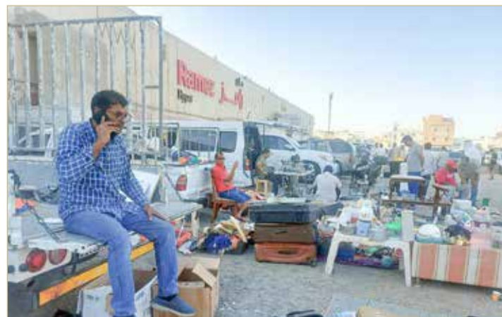
الباعة يفترشون الساحة المحاذية لرامز