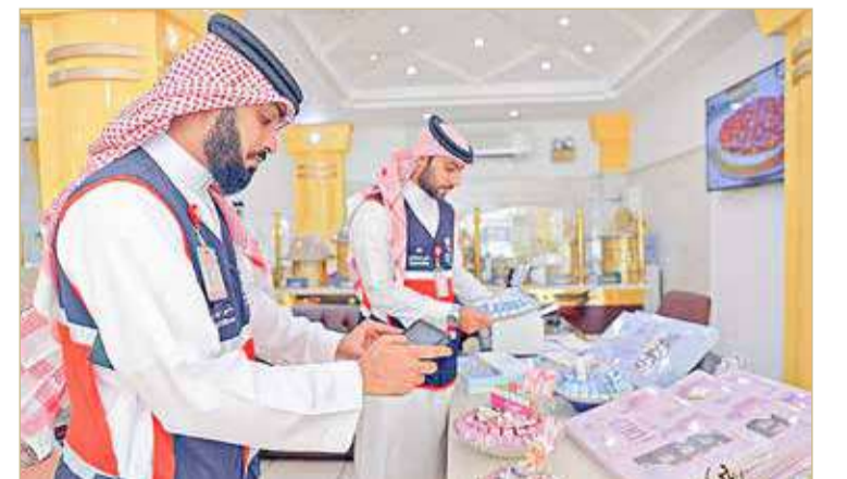
جانب من الحملات التفتيشية

وأوضحت العلوي أن إدارة التفتيش بوزارة الصناعة والتجارة تنظم حملات تفتيشية تناسب طبيعة المناسبة؛ للاطلاع على مدى التزام المحلات بالقوانين والأنظمة، وتشمل الحملة جميع المحال التجارية التي تلقى إقبالاً في جميع محافظات مملكة البحرين. وبيّنت العلوي أن التركيز يكون على أسعار المنتجات والتأكد من مطابقتها على المنتج، إضافة إلى التراخيص