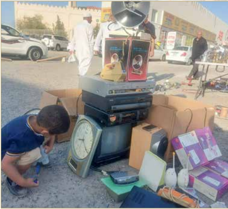
الباعة يفتروشون الساحة المحاذية لـ "رامز"