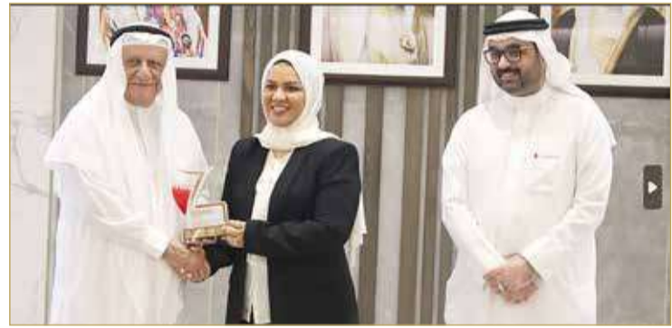
تكريم الرئيس التنفيذي لصندوق العمل (تمكين)