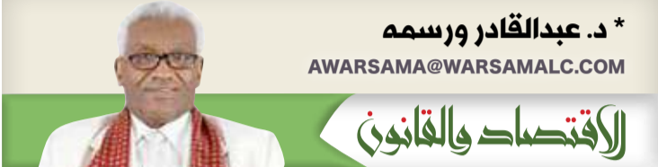
* د. عبدالقادر ورسمه

وأضاف أسد قائلاً "وارداتنا من السودان أغلبها سلع غير أساسية مثل اللبان والكردي وغيرها، وبالنسبة للسلع الأساسية مثل السمسم توجد دول إفريقية بديلة مثل نيجيريا وإثيوبيا نستورد منها وبالكميات المطلوبة". وأكد أسد أنه أيضاً لا تأثير على أسعار هذه السلع أو كمياتها لا على المدى القريب أو