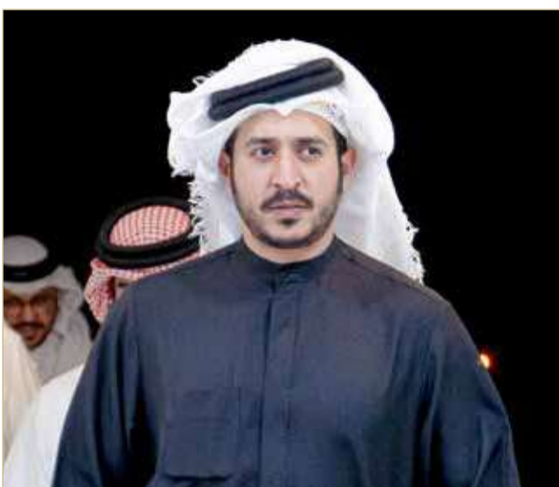
سمو الشيخ خالد بن حمد آل خليفة

عبر سمو النائب الأول لرئيس المجلس الأعلى للشباب والرياضة رئيس الهيئة العامة للرياضة رئيس اللجنة الأولمبية البحرينية الشيخ خالد بن حمد آل خليفة عن سعاده بالمستويات الفنية والتطور الكبير الذي تميزت به مسابقات الفئات العمرية في الموسم الحالي، مشيراً إلى أن تكاتف الجهود بين كافة الأطراف ساهم في تحقيق الكثير من أهداف مبادرة "دوري خالد بن حمد لجيل الذهب" في نسختها الأولى.