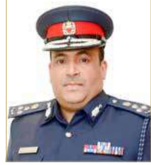
مدير عام المرور