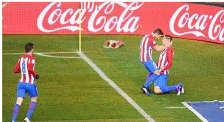
"كوكا-كولا" علامة تجارية حاضرة بقوة في ملاعب كرة القدم

التي تحظى باهتمام ومتابعة جماهيرية هي الأكبر على الإطلاق. وأضاف: "كوكا-كولا علامة تجارية عالمية، وتحظى بسمعة طيبة، وقد ارتبط اسم الشركة بكرة القدم لهذه واحدة من الشركات الداعمة لهذه اللعبة، ونأمل في أن تكون نتائج