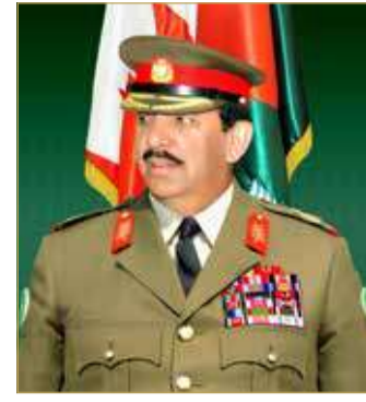
الشيخ خليفة بن أحمد