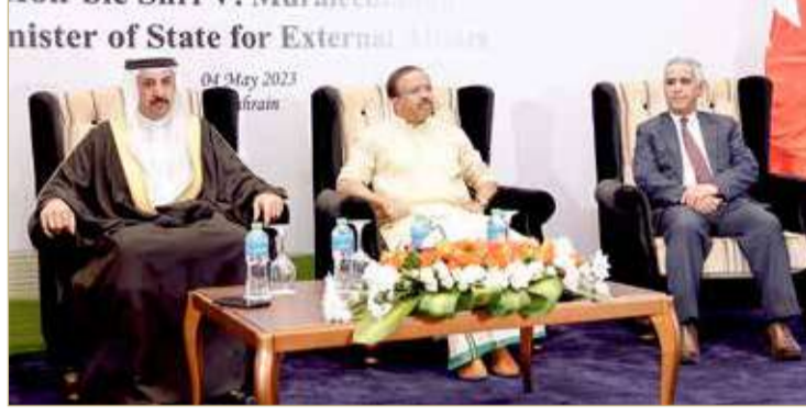
حفل استقبال لوزير شؤون البرلمان الهندي

وعبر عن اعتزازه بالتقدم المضطرد الذي تشهده العلاقات الوثيقة القائمة بين مملكة البحرين وجمهورية الهند، والجهود التي تبذل في سبيل تنمية علاقات التعاون التجاري والاقتصادي، مؤكداً في الوقت ذاته حرص بلاده على تعزيز التعاون الاقتصادي مع البحرين، ومعرباً عن استعداد السفارة الهندية في المملكة للتعاون لتحقيق الأهداف المشتركة.