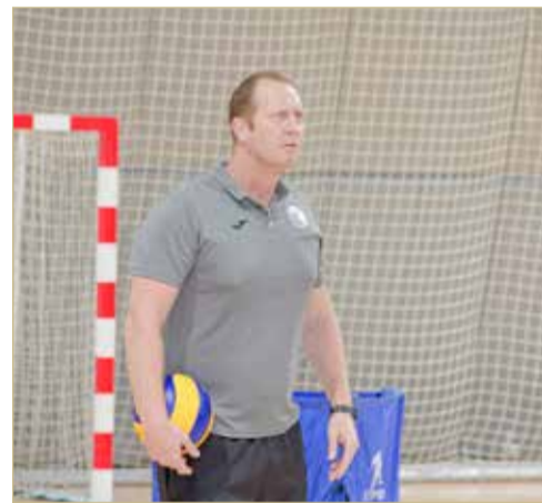
المدرّب البرازيلي سيدني

المدرّب برصد وتحليل أداء اللاعبين بالتواصل مع الطاقم الفني الوطني المساعد لاختيار قائمة المنتخب. ويأتي المدرّب البرازيلي سيدني ليخلف مواطنه "راميريز"، الذي قاد المنتخب لتحقيق المركز الثالث آسيويًا في إنجاز تاريخي هو الأول لطائرة البحرين.