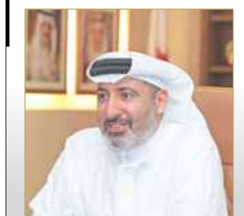
الشيخ داود بن سلمان

"ألبا": رفع الطاقة الإنتاجية لخط الصهر السادس لـ 560 ألف طن متري (13)