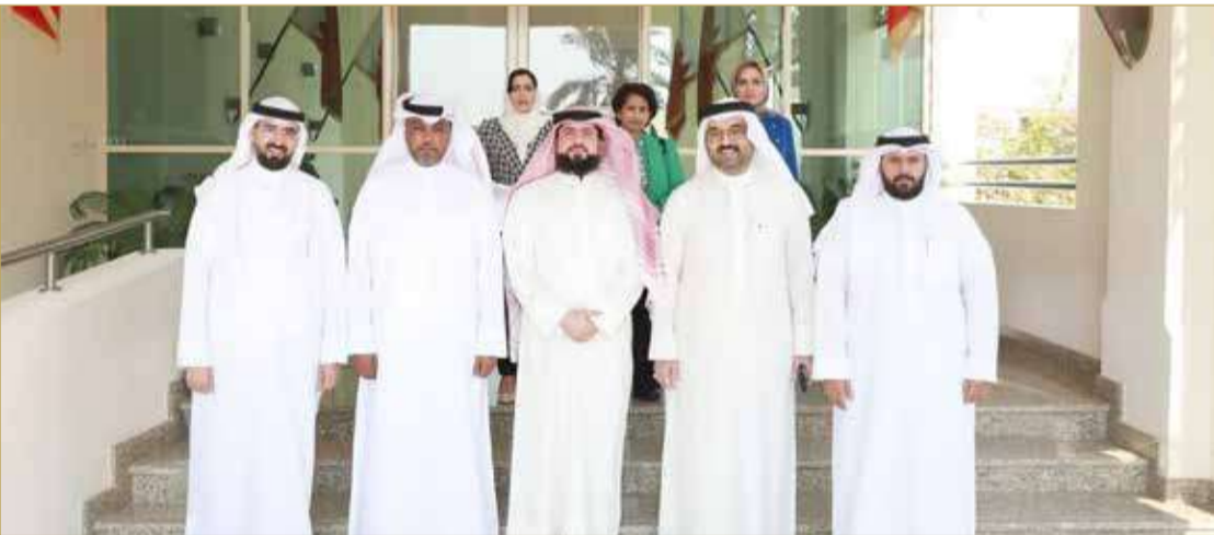
لجنة الشؤون المالية والاقتصادية بمجلس النواب

التزام الجهات المشمولة برقابة الديوان بالقوانين واللوائح والقرارات والإجراءات المتعلقة بمهامها ومسئولياتها. وقد أظهرت أعمال المتابعة التي قام بها الديوان على 662 توصية، قيام الوزارات والجهات الحكومية باتخاذ إجراءات فاعلة ساهمت في تنفيذ أو الشروع في تنفيذ 538 توصية، وذلك بنسبة 81.3% من إجمالي التوصيات، فيما بقيت 124 توصية دون تنفيذ، وذلك بنسبة 18.7%. كذلك قام الديوان خلال السنة المهنية 2022/2021 بمتابعة 26 تقريراً لرقابة الأداء، ويقصد برقابة الأداء التحقق من أداء الجهات المشمولة برقابة الديوان وفقاً لمبادئ الفعالية والكفاءة والاقتصاد. وقد أظهرت أعمال المتابعة التي قام بها الديوان على 715 توصية، قيام الوزارات والجهات الحكومية باتخاذ إجراءات فاعلة ساهمت في تنفيذ أو الشروع في تنفيذ 563 توصية، وذلك بنسبة 78.7% من إجمالي التوصيات، فيما بقيت 152 توصية دون تنفيذ، وذلك بنسبة 21.3%.