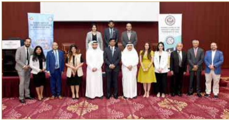
المشاركون في الندوة

البلاد | أمل الحامد من المنطقة الدبلوماسية | تصوير: خليل إبراهيم