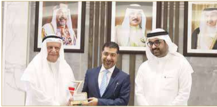
تكريم رئيس المؤسسة الوطنية لحقوق الإنسان