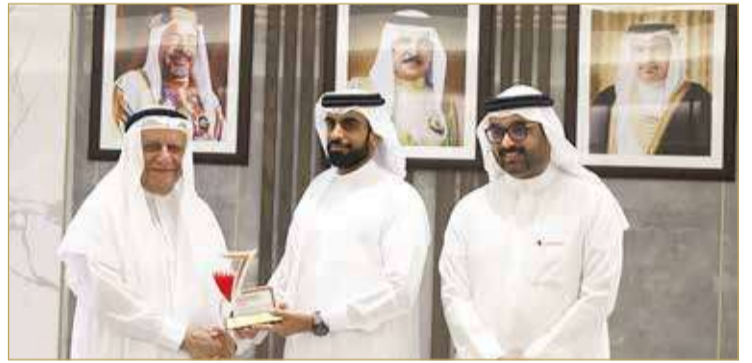
تكريم مدير عام الإدارة العامة لتنفيذ الأحكام والعقوبات البديلة