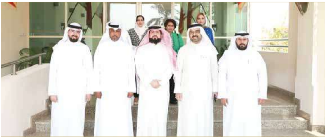
أعضاء لجنة الشؤون المالية والاقتصادية بمجلس النواب