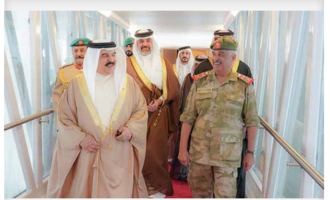
جلالة الملك المعظم يغادر أرض الوطن متوجهاً إلى المملكة المتحدة الصديقة