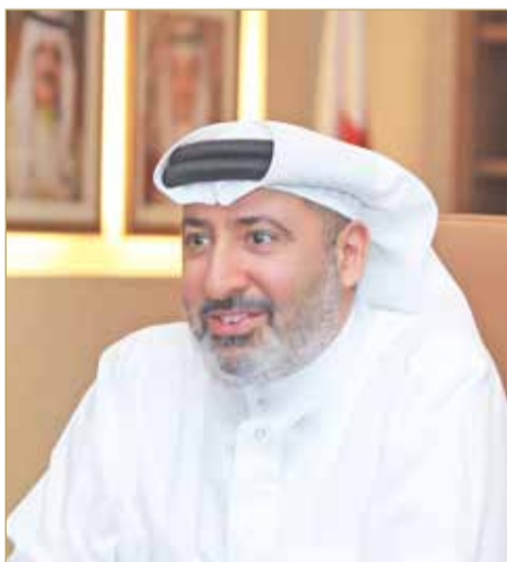
الشيخ دعيج بن سلمان

حققت شركة ألبا البحرينية ش.م.ب (ألبا) إنجازاً جديداً تمثل في رفع الطاقة الإنتاجية لخط الصهر السادس مؤخرًا من 540,000 طن متري سنوياً إلى 560,000 طن متري سنوياً إثر زيادة التيار الكهربائي من 460 كيلو أمبير إلى 478 كيلو أمبير.