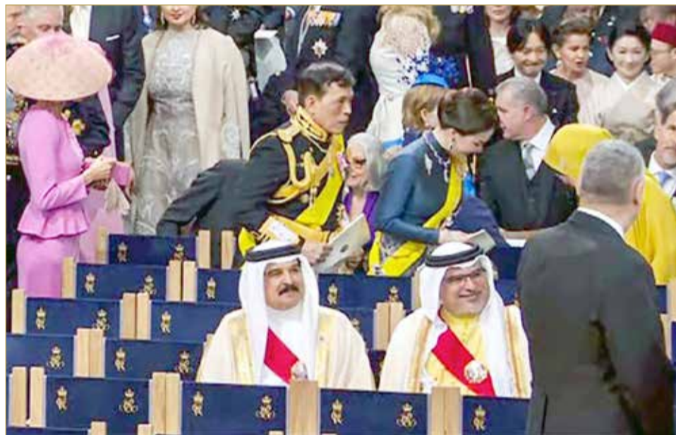
ملك البلاد المعظم برفقة سمو ولي العهد رئيس الوزراء في حفل مراسم تتويج الملك تشارلز الثالث

لندن - وكالات شارك عاهل البلاد المعظم صاحب الجلالة الملك حمد بن عيسى آل خليفة، برفقه ولي العهد رئيس مجلس الوزراء صاحب السمو الملكي الأمير سلمان بن حمد آل خليفة، في حفل مراسم تتويج صاحب الجلالة الملك تشارلز الثالث ملك المملكة المتحدة لبريطانيا العظمى وشمال أيرلندا، الذي أقيم أمس في كنيسة وستمنستر آبي في العاصمة البريطانية (لندن). وتأتي مشاركة الملك المعظم تلبية لدعوة كريمة تلقاها جلالاته من صاحب الجلالة الملك تشارلز الثالث ملك المملكة المتحدة لبريطانيا العظمى وشمال أيرلندا. وأكد ملك البلاد المعظم العزم على مواصلة العمل مع صاحب الجلالة الملك تشارلز الثالث؛ لدعم وتطوير هذه العلاقات المتميزة بما يخدم مصالح البلدين ويحقق تطلعات شعبيهما الصديقين. (02) و(09)