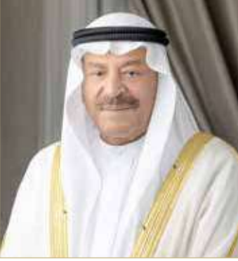
رئيس مجلس الشورى

تكريم قدامى العمال تقديرا لعطائهم... حميدان: