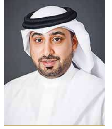
الشيخ أحمد بن عيسى

عبر مدير الشؤون الخارجية بهيئة تنظيم الاتصالات الشيخ أحمد بن عيسى آل خليفة عن ثقته بأن مملكة البحرين ستكون في طليعة الدول التي تتبنى تقنية الجيل السادس في المنطقة في الوقت الذي تبحث فيه الشركات العالمية الاستعداد لإطلاق هذه الخدمة في العام 2030، مؤكداً أن البنية التحتية ستكون جاهزة عند الحاجة لإطلاق الخدمة.