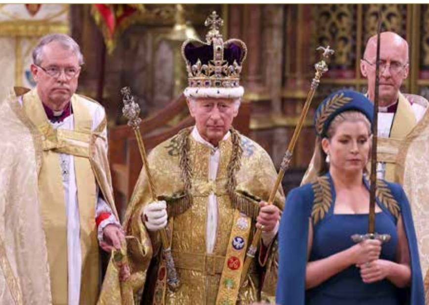
تتويج الملك تشارلز الثالث رسمياً ملكاً على العرش بعد أدائه القسم