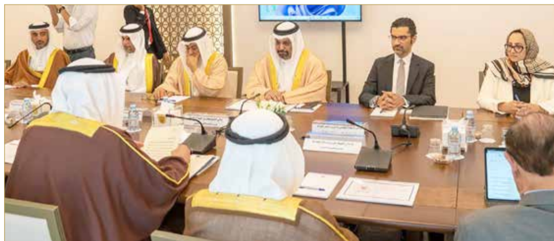
جانب من الاجتماع البرلماني الحكومي

عقدت السلطان التنفيذية والتشريعية اجتماعاً مشتركاً ظهر أمس؛ لمناقشة مشروع قانون باعتماد الميزانية العامة للدولة للسنتين الماليتين 2023 - 2024. والمرافق للمرسوم رقم (34) لسنة 2023. وأكد رئيس مجلس النواب أحمد المسلم أن السلطة التشريعية تضع مصلحة المواطن وتحسين مستواه المعيشي في صميم أولوياتها، وهو ذات الهدف الذي تسعى إليه السلطة التنفيذية، ويأتي ذلك تنفيذاً للتطلعات الملكية السامية من ملك البلاد المعظم صاحب الجلالة الملك حمد بن عيسى آل خليفة، وبدعم متواصل من ولي العهد رئيس مجلس الوزراء صاحب السمو الملكي الأمير سلمان بن حمد آل خليفة.