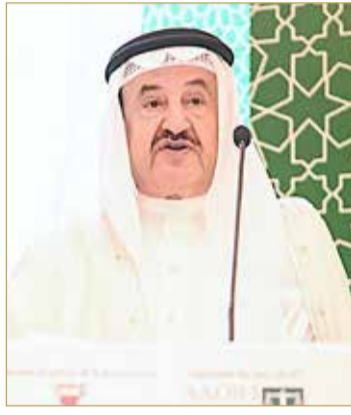
الشيخ إبراهيم بن خليفة

وأشار إلى أن تعزيز متطلبات رقمنة الصناعة المالية الإسلامية يبشر بعدد من المزايا الجوهرية للبنوك الإسلامية نفسها والاقتصاد وقطاع العملاء. وإن تعزيز كفاءة العمليات وسرعتها، وتقليل التكاليف ورفع مستوى الربحية، وإنما يمكن المؤسسات من تقديم طيف واسع من المنتجات والخدمات التي ستجذب قاعدة متنوعة من العملاء والمستثمرين وتكسب ولاءهم في خضم أسواق اليوم التي ترتفع فيها حدة المنافسة وتتصاعد.