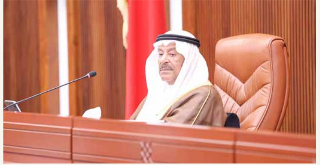
رئيس مجلس الشورى

لفت رئيس مجلس الشورى علي الصالح لعدم إدراج اسمه من ضمن المعتذرين عن حضور الجلسة الماضية رغم عدم حضوره؛ نظراً لوجوده خارج مملكة البحرين. وأشاد الصالح خلال جلسة مجلس الشورى التي عقدت أمس، بإدارة النائب الثاني لرئيس مجلس الشورى جهاد الفاضل للجلسة الماضية، مثنياً جهودها المبذولة، معلقاً "يقولون إن الدكتور جهاد أبلت بلاءً حسناً، وقالت لي "ما عليك زود وقت لها انتي صفقوا لك وأنا ما صفقوا لي؛ ولكنها تستاهل".