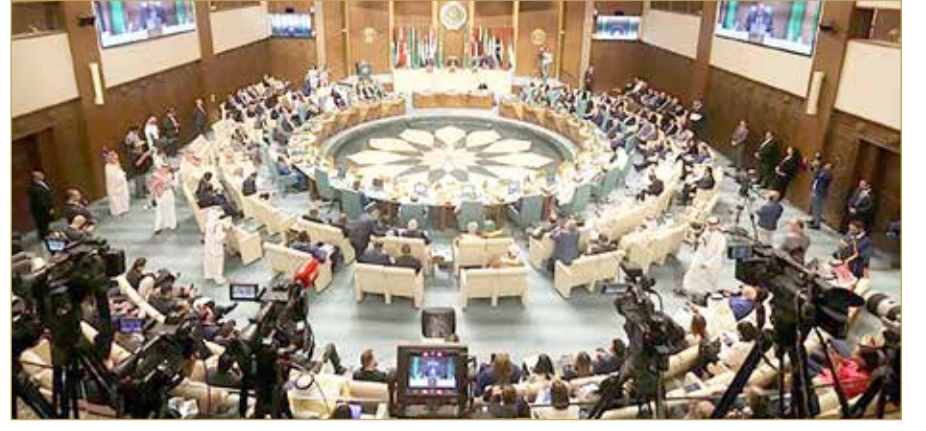
رسماً، سوريا تستعيد مقعدها في الجامعة العربية

اتفق وزراء الخارجية العرب، في اجتماعهم التشاوري الذي عقد بالقاهرة أمس برئاسة وزير الخارجية المصري سامح شكري، على عودة سوريا إلى جامعة الدول العربية، واستئناف مشاركة وفودها في اجتماعات الجامعة اعتباراً من يوم أمس. وأكد متحدث باسم جامعة الدول العربية أن اجتماع وزراء الخارجية العرب قرر عودة سوريا لشغل مقعدها الدائم في المنظمة بعد سنوات من استبعادها جراء الحرب الدامية في البلد الممزق. ويعتقد محللون أن عودة سوريا ستعزز من مناخ الاستقرار في المنطقة، وأن جميع الدول العربية عليها التناغم مع فكرة أنه لا حل للأزمة في سوريا من دون وجود بشار الأسد رئيساً في دمشق.