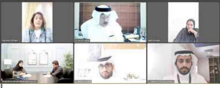
جانب من اللقاء التعريفي عبر "زوم"