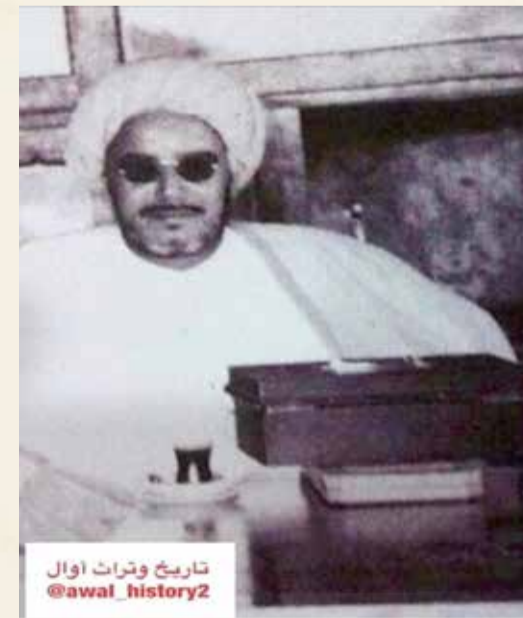
تاريخ وترات اوال @awal_history2

المنامة يحمل اسمه ما يزال قائماً إلى اليوم، ويشرف عليه حالياً الأحفاد ويحمل اسم ”ماتم المديقع“. وقد كان منصة للعمل الخيري في ذلك الوقت. ويقول إن جده كان شخصاً ذا هبة، وقد تعلم منه كيفية احترام الصغير للكبير، وهذا ما حاول زرعه في أبنائه، كما تعلم منه الكرم ومساعدة الضعيف والمعوز والفقير المحتاج، وكذلك تعلم منه احترام الصغير قبل الكبير، والحزم في المواقف التي تستدعي ذلك دون تردد.