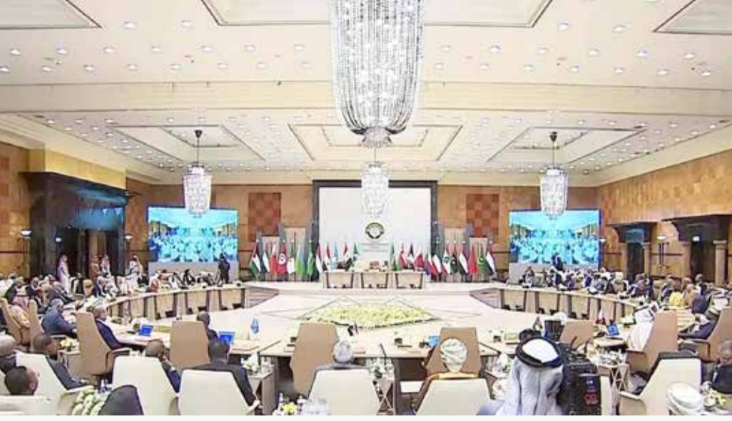
اجتماع وزراء الخارجية التحضيري