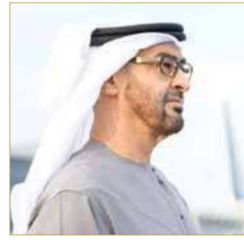
الشيخ محمد بن زايد