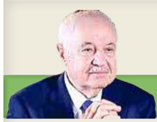
د. طلال أبوغزالة