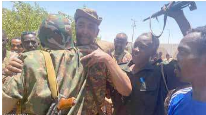
البرهان وسط جنود القوات البرية لأول مرة منذ بدء الأزمة

تفاقت الاحتياجات الإنسانية منذ اندلع نزاع دام في السودان في 15 أبريل، بحسب الأمم المتحدة التي رجعت خطتها من أجل الاستجابة للأزمة. وقال مدير مكتب الأمم المتحدة لتنسيق الشؤون الإنسانية في جنيف راميش راجاسينغهام للصحافيين "يحتاج اليوم 25 مليون شخص - أي أكثر من نصف سكان السودان - لمساعدات إنسانية وللحماية"، موضحاً أن هذا العدد "هو أكبر عدد"