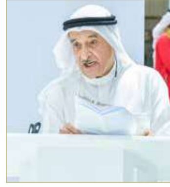
الشيخ محمد بن عبدالله