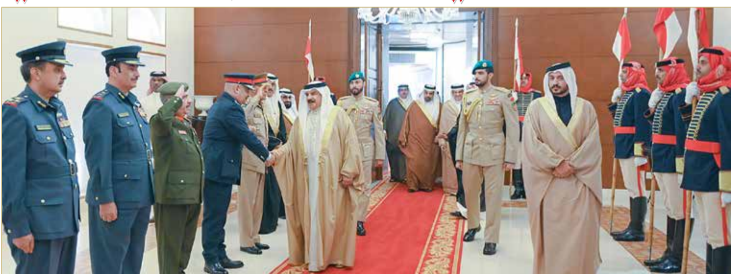
جلالة الملك المعظم يعود إلى أرض الوطن بعد مشاركة جلالاته في أعمال القمة العربية الثانية والثلاثين (02)