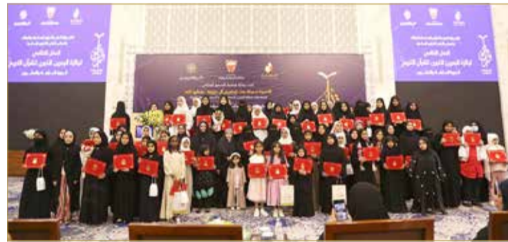
تكريم الفائزات بجوائز البحرين الكبرى لحفظ القرآن الكريم 4

وتفzلت نائبة راعية الحفل بتوزيع الشهادات والجوائز على الفائزات بحفظ القرآن الكريم وعددهن 89 حافظة،