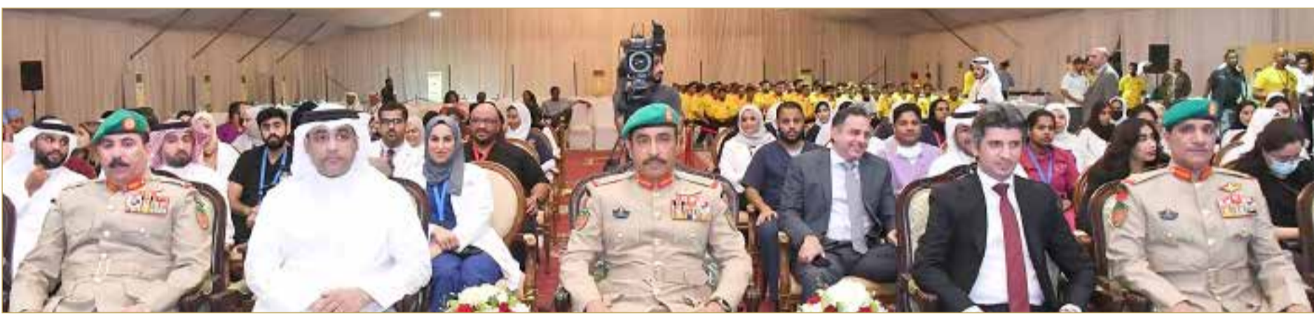
الرفاع - قوة دفاع البحرين

♦ تكاتف الجميع من قوة الدفاع ومنتسبي الحرس الملكي حافزاً للنجاح