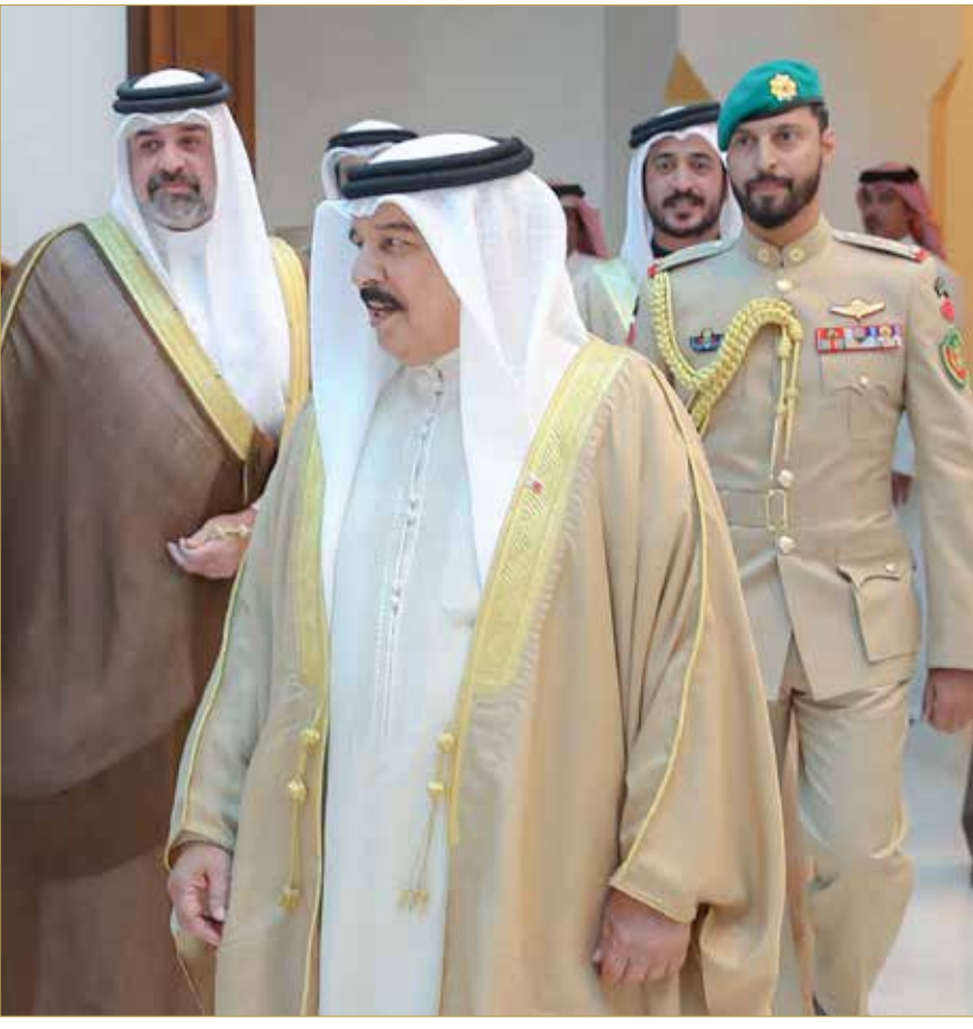
جلالة الملك المعظم يعود إلى أرض الوطن بعد مشاركة جلالته في أعمال القمة العربية الثانية والثلاثين