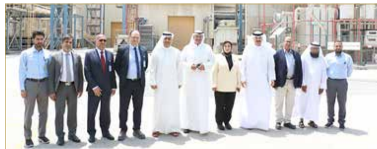
رئيس هيئة الكهرباء والماء يقوم بزيارة لمحطتي الحد والعزل ضمن الاستعدادات لفصل الصيف

كشف رئيس هيئة الكهرباء والماء كمال أحمد عن أن القدرة الإنتاجية لمحطة شركة الحد للكهرباء والماء تبلغ 929 ميغاوات من الكهرباء، أي ما يعادل نحو 18.4% من إجمالي قدرة إنتاج الطاقة الكهربائية في المملكة و90 مليون جالون من المياه يومياً، أي ما يعادل 42.9% من إجمالي الإنتاج اليومي للمياه في المملكة، كما وتبلغ قدرة محطة شركة العزل للكهرباء 941 ميغاوات من الكهرباء. جاء ذلك خلال زيارته شركة الحد للكهرباء والماء