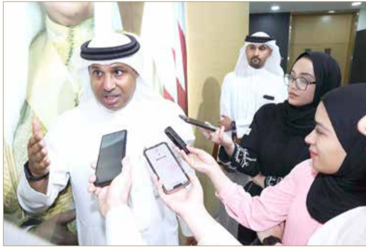
سبت مصرحا للصحافيين

كما أكدت استمرار في دعم القطاع الخاص بأي استفسارات في هذه المرحلة التي سيتم خلالها تقييم أدائهم وتصنيفهم والخدمات الموكلة لهم، والمرحلة التجريبية ستكون مرحلة