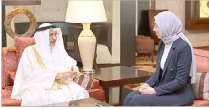
الشيخ خالد بن عبدالله متحدثاً إلى مراسلة وكالة أنباء الأناضول التركية الرسمية