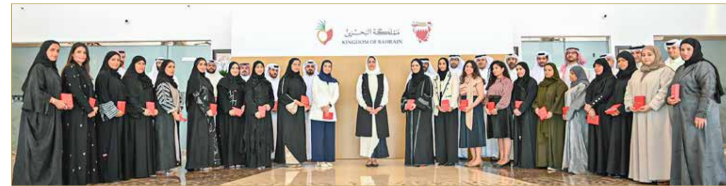
الأمين العام للمجلس الأعلى للمرأة استقبلت الموظفات الحاصلات على وسام سمو الأمير سلمان بن حمد للاستحقاق الطبي

من جانبهم، أعرب الموظفون الحاصلين على وسام "وسام سمو الأمير سلمان بن حمد آل خليفة للاستحقاق الطبي" عن الفخر والاعتزاز ببذل هذا الوسام الوطني الرفيع، بما يحمله من تقدير لجهودهم الوطنية المخلصة ومشاركتهم الفاعلة في جهود التصدي لهذه الجائحة، منوهين بهذا التكريم السامي، ومؤكدين تشرفهم بتسلم هذا الوسام الذي يعد حافزاً على مواصلة العمل والعباءة في خدمة مملكة البحرين.