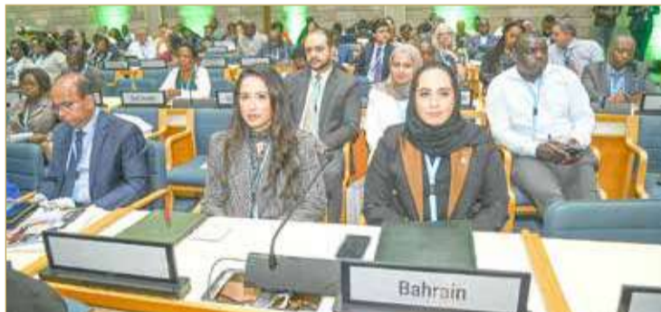
وزيرة الإسكان والتخطيط العمراني في اجتماع جمعية مؤئل الأمم المتحدة

وتم استعراض جهود البلدين الصديقين في مجال توفير الخدمات الإسكانية للمواطنين، وسبل استمرار التعاون بين الجانبين وتبادل الخبرات والتجارب، كما نوقش عدد من الموضوعات المطروحة للنقاش في اجتماعات (مؤئل) الأمم المتحدة.