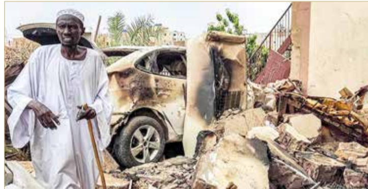
رجل يتفقد الأضرار أثناء سيره بين بقايا سيارة مدمرة جنوب الخرطوم

وأشتبك الطرفان الليلة الماضية في شوارع مدينة أم درمان حول قاعدة سلاح المهندسين الرئيسية التابعة للجيش. وتمكن الجيش، الذي يبدو أنه يفضل الضربات الجوية عن القتال على الأرض، من الحفاظ على أماكن تركزه حول القاعدة، لكنه لم يتمكن من دحر قوات الدعم السريع التي تسيطر على معظم أنحاء المدينة.