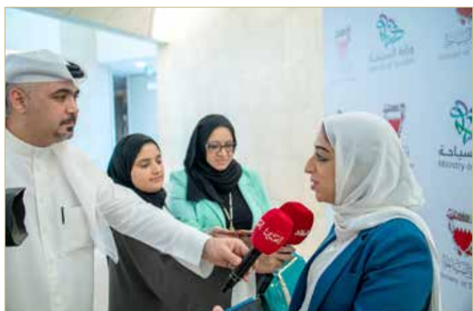
الصيرفي متحدة للصحافيين

الإقليمية والعالمية، مشيرة إلى أن هذه الاتفاقية باكورة للتعاون ما بين القطاع السياحي في المملكتين.