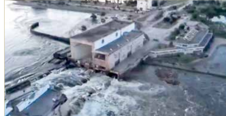
من انهيار سد نوفا كاخوفكا في خيرسون

أدلة فورية تظهر المسؤول عن تدمير السد. وألقت روسيا باللوم على ضربات أوكرانية في انهيار السد، فيما اتهمت كيف القوات الروسية بتفجيره. واتهم وزير الدفاع الروسي سيرجي أوفلاف شولتز إن ألمانيا تراقب بقلق الوضع في محطة زابوروجيا للطاقة النووية في جنوب أوكرانيا لا سيما بعد تفجير سد نوفا كاخوفكا الذي يمد المحطة بالمياه.