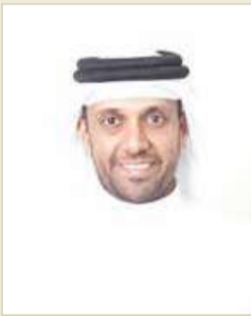
الشيخ خالد بن حمد