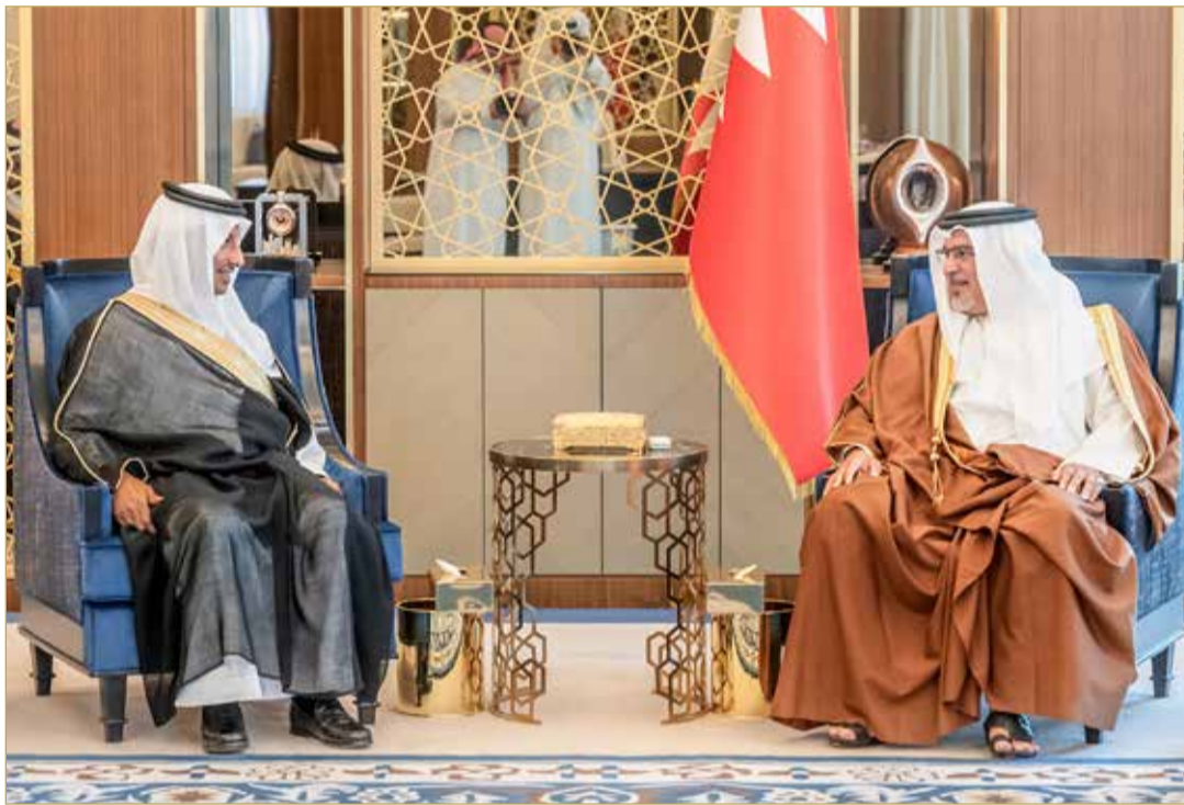
سمو ولي العهد رئيس الوزراء مستقبلاً وزير السياحة رئيس مجلس إدارة الصندوق السعودي للتنمية