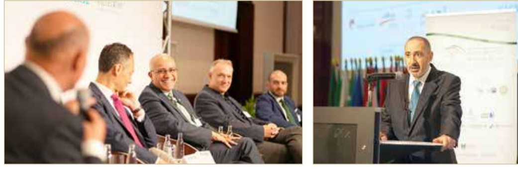
البعالي مشاركاً في الملتقى