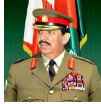
الشيخ خليفة بن أحمد

وأعرب القائد العام لقوة دفاع البحرين عن أطيب التهاني والتبريكات لسمو الرائد الركن بحري الشيخ عيسى بن سلمان بن حمد آل خليفة، داعياً العولى عز وجل أن يوفق سموه لخدمة مملكة البحرين في ظل قيادة صاحب الجلالة ملك البلاد المعظم القائد الأعلى للقوات