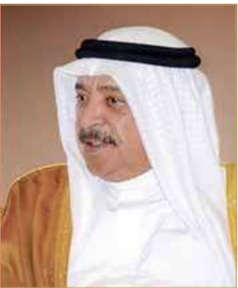
الشيخ خالد بن أحمد

الأميركية في مدينة كوانتيكو بولاية فرجينيا بالولايات المتحدة الأميركية، سائلاً الله سبحانه وتعالى أن يوفق سمو الرائد الركن بحري الشيخ عيسى بن سلمان بن حمد آل خليفة، وأن يكلل جميع جهوده وأعماله بالنجاح والسداد لخدمة هذا الوطن العزيز في ظل القيادة الحكيمة لملك البلاد المعظم القائد الأعلى للقوات المسلحة صاحب الجلالة الملك حمد بن عيسى آل خليفة.