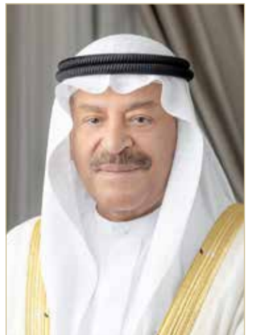
رئيس مجلس الشورى

رفع رئيس مجلس الشورى علي الصالح خالص التهاني وأجمل التبريكات إلى المقام السامي ملك البلاد المعظم القائد الأعلى للقوات المسلحة صاحب الجلالة الملك حمد بن عيسى آل خليفة؛ بمناسبة إنهاء سمو الرائد بحري الشيخ عيسى بن سلمان بن حمد آل خليفة بنجاح دورة القيادة والأركان المشتركة من جامعة المشاة البحرية الأميركية في مدينة كوانتيكو بولاية فرجينيا بالولايات المتحدة الأميركية.