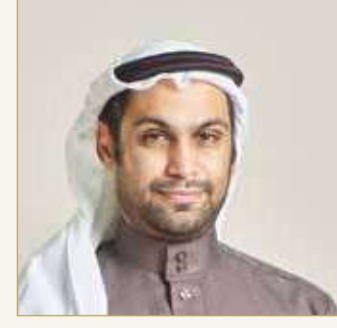
الشيخ محمد بن خليفة

أعلنت شركة Beyon Connect وهي جزء من مجموعة Beyon، عن التوقيع على اتفاقية شراكة مع شركة Adera Global الواقع مقرها في سنغافورة، وشركة Cumolo9 النيوزيلاندية لإطلاق “ONEVIEW”، المشروع المشترك في سنغافورة. وتشكل الاتفاقية التي وقع عليها ممثلو الشركات الثلاث في سنغافورة يوم 17 مايو 2023، خطوة مهمة للتعاون بين الشركات لتوفير منصة رقمية جديدة ومبتكرة لسنغافورة وباقي منطقة آسيان، من خلال إطلاق حلول الصناديق البريدية الرقمية على منصة OneBox التابعة لشركة Beyon Connect والتي تمثل المنتج الرئيس للشركة. وتهدف ONEVIEW إلى توفير منصة رقمية مشفرة تُمكن التواصل الآمن بين الهيئات العامة والشركات والمواطنين؛ لخلق نظام رقمي شامل يتيح للمستخدم التحكم الكامل في بياناته من خلال منصة آمنة واحدة. وسوف توفر ONEVIEW لزيائنها صناديق بريدية رقمية تتيح للهيئات الحكومية والشركات التواصل بشكل رقمي، أي من دون الحاجة إلى الحضور الفعلي لاستكمال المستندات المهمة، ويمكن للمستخدمين كذلك إرسال واستلام الرسائل، وتلقي المستندات والمعلومات الحساسة دون القلق بشأن اختراق البيانات أو التهديدات السيبرانية أو السرقة. وسوف يستفيد المشروع المشترك