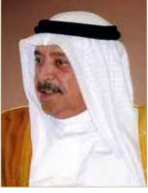
الشيخ خالد بن أحمد

بعث وزير الديوان الملكي الشيخ خالد بن أحمد آل خليفة برفقة تهنئة إلى سمو الرائد الركن بحري الشيخ عيسى بن سلمان بن حمد آل خليفة، أعرب فيها عن أطيب التهاني والتبريكات بمناسبة إنهاء سموه بنجاح دورة القيادة والأركان المشتركة من جامعة المشاة البحرية الأميركية في مدينة كوانتيكو بولاية فرجينيا بالولايات المتحدة الأميركية، متمنياً لسموه دوام التوفيق والسداد ومواصلة جهوده في خدمة مملكة البحرين في ظل القيادة الحكيمة لملك البلاد