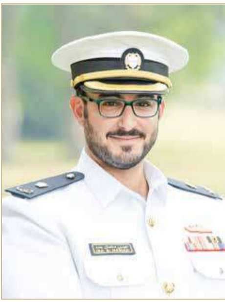
سمو الشيخ عيسى بن سلمان

الأكبر لإنهاء الدورة، معرباً عن بالغ الشكر والعرفان لصاحب السمو الملكي ولي العهد نائب القائد الأعلى للقوات المسلحة رئيس مجلس الوزراء، على ما أبداه سموه من متابعة مستمرة طوال الدورة كان لها الأثر البارز في بث العزم والإصرار على النجاح، مؤكداً سموه الحرص على توظيف مجالات العلوم والمعارف والنظريات الاستراتيجية والتطبيقات العملية العسكرية المكتسبة بما يتماشى مع الخطط التطويرية المتواصلة لمملكة البحرين في المجالين العسكري والمدني خدمةً للوطن وأبنائه. جاء ذلك في الحفل الذي أقيم بمقر الجامعة بحضور وزير الداخلية الفريق أول الشيخ راشد بن عبدالله آل خليفة، ورئيس ديوان ولي العهد الشيخ سلمان بن أحمد بن سلمان آل خليفة، وسفير مملكة البحرين لدى الولايات المتحدة الأميركية الشيخ عبدالله بن راشد آل خليفة، وعدد من القادة وكبار الضباط.