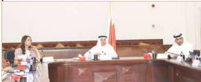
جانب من جلسة مجلس أمانة العاصمة أمس