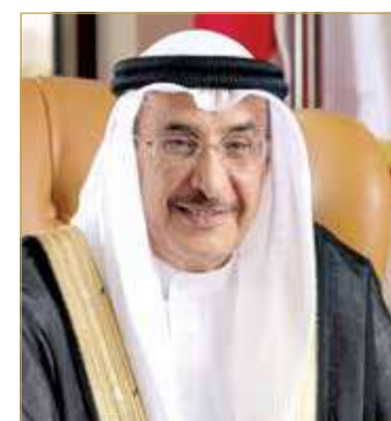
الشيخ خالد بن عبدالله

وذلك من منطلق الحرص على ما يمثله التعليم والتدريب من أداة