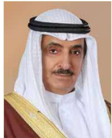
الشيخ سلمان بن عبدالله

من تفوق علمي عسكري يؤكد الدعم الكبير الذي يلقاه القطاع العسكري من صاحب الجلالة ملك البلاد المعظم القائد الأعلى للقوات المسلحة، ومتابعة صاحب سمو الملكي ولي العهد نائب القائد الأعلى للقوات المسلحة رئيس مجلس الوزراء؛ من أجل أن تؤدي القوات المسلحة دورها الوطني السامي، بمختلف قطاعاتها وتخصصاتها، للحفاظ على حياض الوطن ومكتسباته.