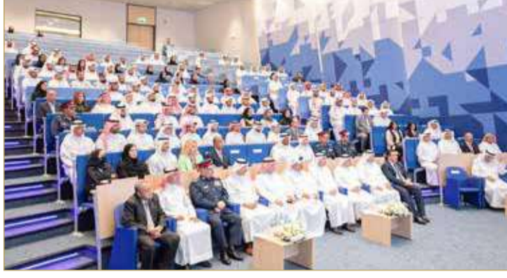
جانب من افتتاح البرنامج التدريبي بشأن الضبطية القضائية في الجرائم المالية

وقال البوعيين، في افتتاح البرنامج التدريبي الذي تنظمه النيابة العامة بشأن الضبطية القضائية في الجرائم المالية بالتعاون مع معهد البحرين للدراسات المصرفية والمالية، إن تنظيم الدورات والبرامج التدريبية يأتي لمتابعة سير العمل والتطبيق العملي لأحكام القانون وما تستدعيه الحاجة إلى رفع مستوى التنسيق والتعاون بين النيابة العامة والسلطة القضائية من جهة، وبين الجهات والأجهزة ذات الصلة من جهة أخرى. ونوه بجهود المملكة في مكافحة