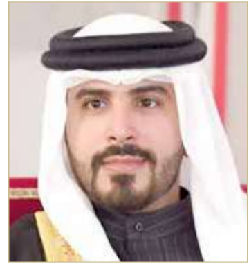
سمو الرائد الشيخ محمد بن سلمان

سلمان آل خليفة من حرجي على اكتساب مزيد من العلوم التي تسهم في تطوير القطاع العسكري في مملكة البحرين، سائلاً الله عز وجل أن يوفق سمو الرائد الركن بحري الشيخ عيسى بن سلمان بن حمد آل خليفة لخدمة مملكة البحرين وأبنائها، في ظل قيادة صاحب الجلالة ملك البلاد المعظم القائد الأعلى للقوات المسلحة.