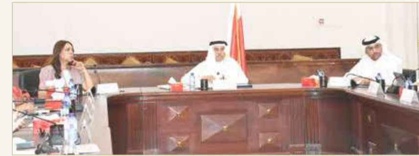
جانب من جلسة مجلس أمانة العاصمة أمس