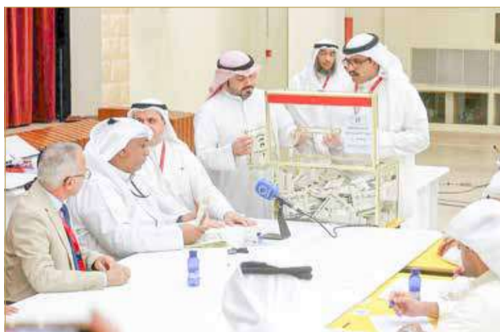
جانب من عملية فرز الأصوات في ضاحية عبدالله السالم في العاصمة الكويتية

السابع في البلاد منذ 2012 بعدما ألغت المحكمة الدستورية في مارس نتائج انتخابات العام الماضي التي حققت فيها المعارضة مكاسب كبيرة بسبب "مغالطات" شابت الدعوة