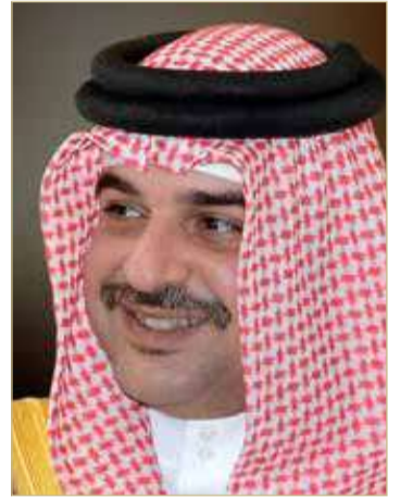
سمو الشيخ عبدالله بن حمد

بعث الممثل الشخصي لجلالة الملك المعظم سمو الشيخ عبدالله بن حمد آل خليفة، برفقة تهنئة إلى ملك البلاد المعظم القائد الأعلى للقوات المسلحة صاحب الجلالة الملك حمد بن عيسى آل خليفة، وولي العهد نائب القائد الأعلى للقوات المسلحة رئيس مجلس الوزراء صاحب سمو الملكي الأمير سلمان بن حمد آل خليفة، وإلى سمو الرائد الركن بحري الشيخ عيسى بن سلمان بن حمد آل خليفة؛ بمناسبة إنهاء سموه