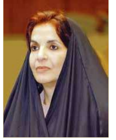
سمو الأميرة سبيكة بنت إبراهيم

بعثت قرينة عاهل البلاد المعظم رئيسة المجلس الأعلى للمرأة صاحبة سمو الملكي الأميرة سبيكة بنت إبراهيم آل خليفة برفقة تهنئة إلى سمو الرائد الركن بحري الشيخ عيسى بن سلمان بن حمد آل خليفة؛ بمناسبة إنهاء سموه بنجاح كبير دورة القيادة والأركان المشتركة من جامعة المشاة البحرية الأميركية بالولايات المتحدة الأميركية. وأشادت سموها على ضوء الإنجاز