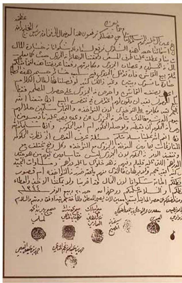
عرضة ناوخذة الغوص بالعام 1925