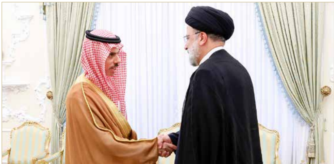
الرئيس الإيراني مستقبلاً وزير الخارجية السعودي