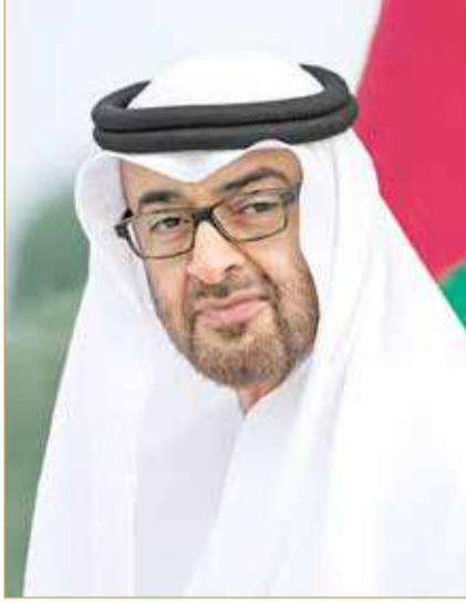
صاحب السمو رئيس دولة الإمارات العربية المتحدة

وخلال اللقاء أكد جلالة الملك المعظم وأخوه صاحب السمو رئيس دولة الإمارات العربية المتحدة الحرص على مواصلة نهج التشاور الأخوي لما فيه خير شعبيهما وتبادلاً وجهات النظر بشأن عدد من القضايا ذات الاهتمام المتبادل.