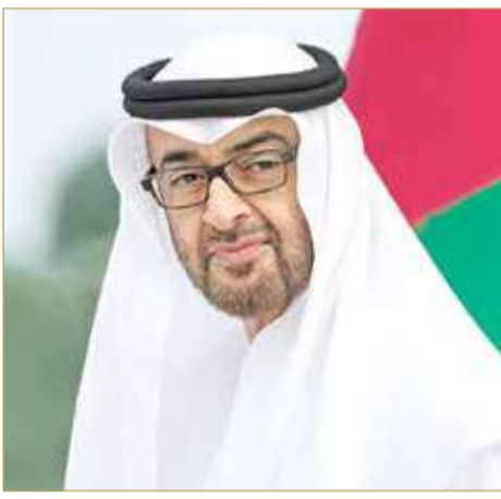
صاحب السمو رئيس دولة الإمارات العربية المتحدة

العربية المتحدة وشعبها الشقيق دوام التقدم والنماء والتطور تحت قيادتها الحكيمة. وخلال اللقاء أكد جلالة الملك المعظم وأخوه صاحب السمو رئيس دولة الإمارات العربية المتحدة الحرص على مواصلة نهج التشاور الأخوي لما فيه خير شعبيهما وتبادلاً وجهات النظر بشأن عدد من القضايا ذات الاهتمام المتبادل.