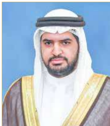
سمو الشيخ عيسى بن علي بن خليفة

الذي قدمه اللاعبون الأبطال ليرفعوا علم البلاد عالياً ويحققوا إنجازاً تاريخياً لكرة السلة البحرينية. وأشاد سموه بالمستوى الراقي الذي قدمه لاعبو نادي المنامة على امتداد منافسات البطولة وتوجهه بتحقيق هذا الفوز الرائع الذي يجسد المكانة المتميزة لكرة السلة البحرينية ويعكس كذلك ما يتميز به نادي المنامة من عناصر بارزة، متمنياً للنادي وكرة السلة البحرينية المزيد من التوفيق والنجاح.