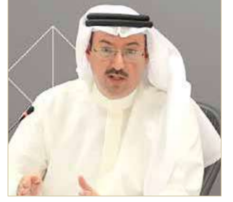
الشيخ محمد بن خليفة

قال الرئيس التنفيذي لمؤسسة التنظيم العقاري (ريرا) الشيخ محمد بن خليفة آل خليفة بأن موعد إطلاق البنك العقاري أصبح قريباً جداً. وعن معرض التمويلات الإسكانية، قال الشيخ محمد بن خليفة إن التمويلات الإسكانية مبادرة طيبة قامت بها وزارة الإسكان والتخطيط العمراني مشكورة، تم من خلالها إطلاق المواطنين والناس المهتمة في القطاع العقاري على الخدمات التي توفرها حكومة