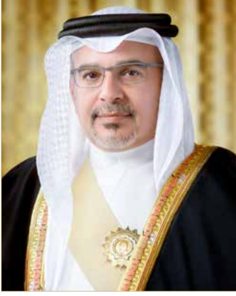
سمو ولي العهد رئيس الوزراء

تتويجهم ببطولة سوپر غرب آسيا لكرة السلة. وأشاد سموه في البرقية بالمستوى المتقدم الذي قدمه اللاعبون في هذه البطولة، متمنياً سموه جهود الجهازين الفني والإداري، والتي أسهمت في تحقيق هذا النجاح، والذي يضاف إلى سجلات إنجازات مملكة البحرين الرياضية.