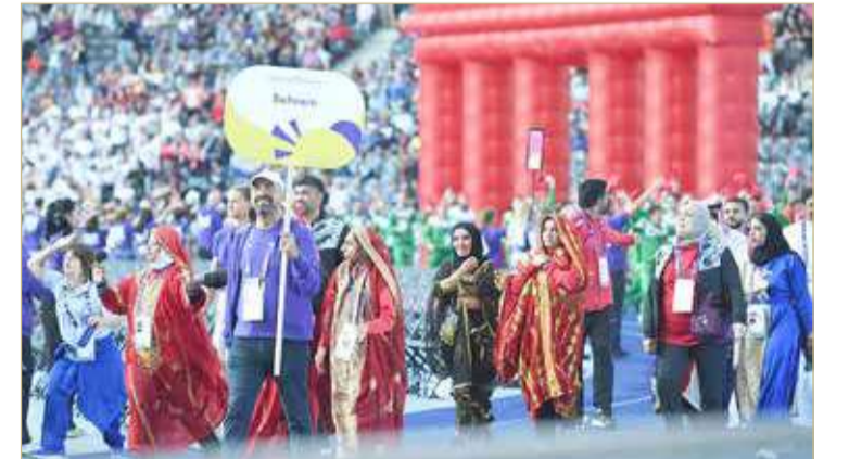
وفد البحرين بحفل الافتتاح

وعيش حياة مُرضية من خلال ممارسة الرياضة وتنظيم المسابقات التنافسية. وتشارك مملكة البحرين بوفد يضم 15 لاعباً ولاعبة في 6 ألعاب وهي ألعاب القوى والبوتشي والفروسية والبولينغ ورياضتين موحدين هما الريشة الطائرة والشرائح.