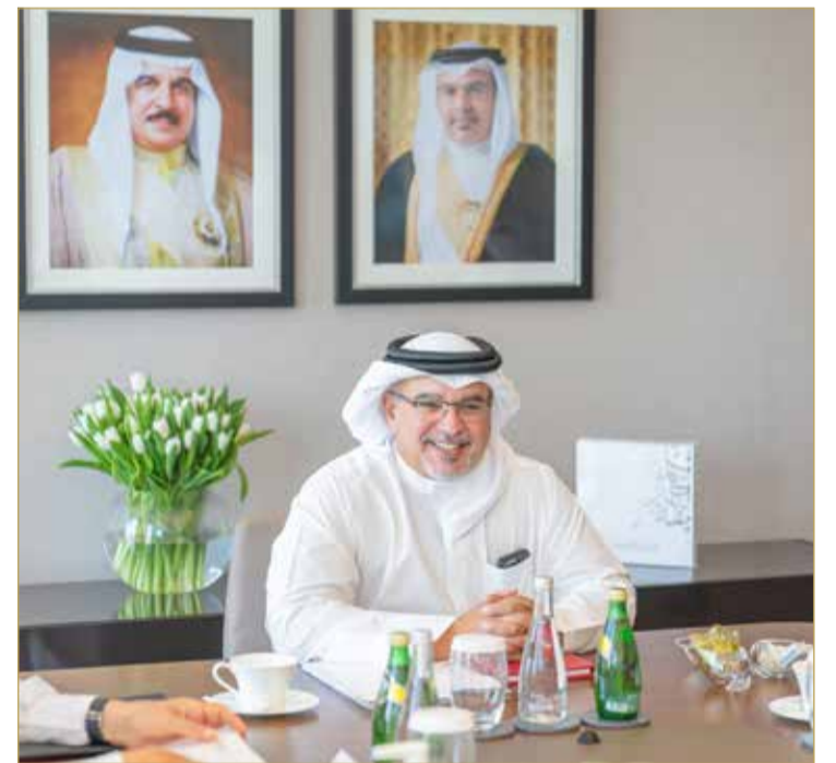
سمو ولي العهد رئيس الوزراء يترأس اجتماع مجلس التنمية الاقتصادية

أكد ولي العهد رئيس مجلس الوزراء رئيس مجلس التنمية الاقتصادية صاحب السمو الملكي الأمير سلمان بن حمد آل خليفة أن ما تحقق من مؤشرات إيجابية للنمو الاقتصادي واستقطاب الاستثمارات يؤكد ثبات الخطى على المسار الصحيح ونجاح مساعي فريق البحرين الواحد نحو تحقيق أهداف خطة التعافي الاقتصادي. جاء ذلك لدى ترؤس سموه اجتماع مجلس التنمية الاقتصادية الذي عقد صباح أمس في مقر المجلس