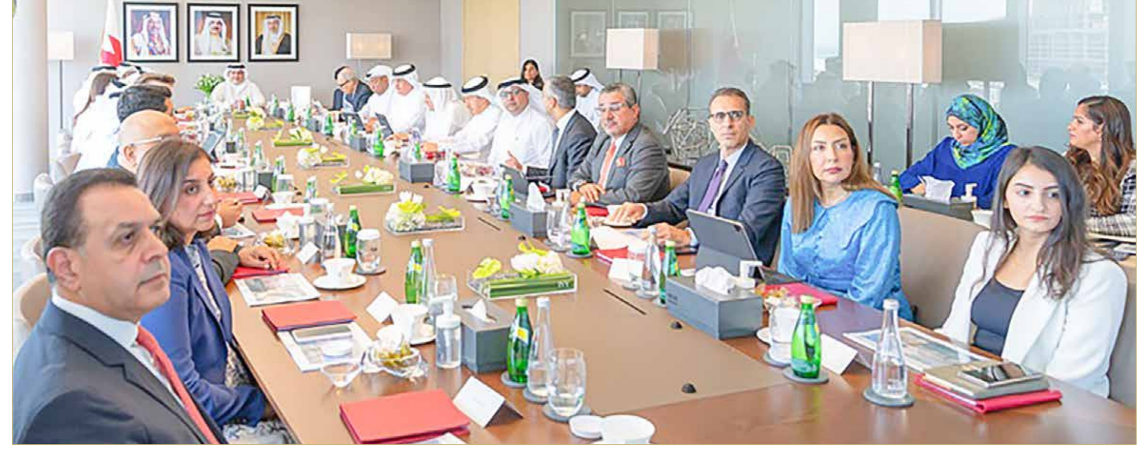
سمو ولي العهد رئيس مجلس الوزراء رئيس مجلس التنمية الاقتصادية يترأس اجتماع مجلس التنمية الاقتصادية في مقر المجلس ببلخج البحرين

◆ تعزيز روح المبادرة والإنجاز في جميع مناحي التنمية الاقتصادية... سمو ولي العهد رئيس الوزراء: