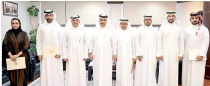
أعضاء نيابة جرائم الاتجار بالأشخاص بعد تسلمهم شهادات التكريم من قبل النائب العام

به نيابة الاتجار بالأشخاص بتوجيهات وتحت إشراف النائب العام من مهام لحماية ورعاية الضحايا والشهود وضمان حقوقهم القانونية، وبأشرت النيابة في الأشهر الستة الماضية التحقيق والتصرف في 14 قضية أحالت منها 7 قضايا إلى المحكمة المختصة. فضلاً عن دور الأجهزة الأمنية والتنفيذية الفاعل؛ ساهمت تلك المقومات مجتمعة في تبوء مملكة البحرين الصدارة عن استحقاق في التقرير الدولي المعني بمكافحة الاتجار بالأشخاص. وكرم النائب العام علي البوعينين أعضاء نيابة جرائم الاتجار بالأشخاص تقديراً لدورهم المتميز في دعم الجهود الوطنية بما حوّلهم القانون من صلاحيات لتحظى المملكة بهذه المكانة المشرفة على الصعيد الدولي.