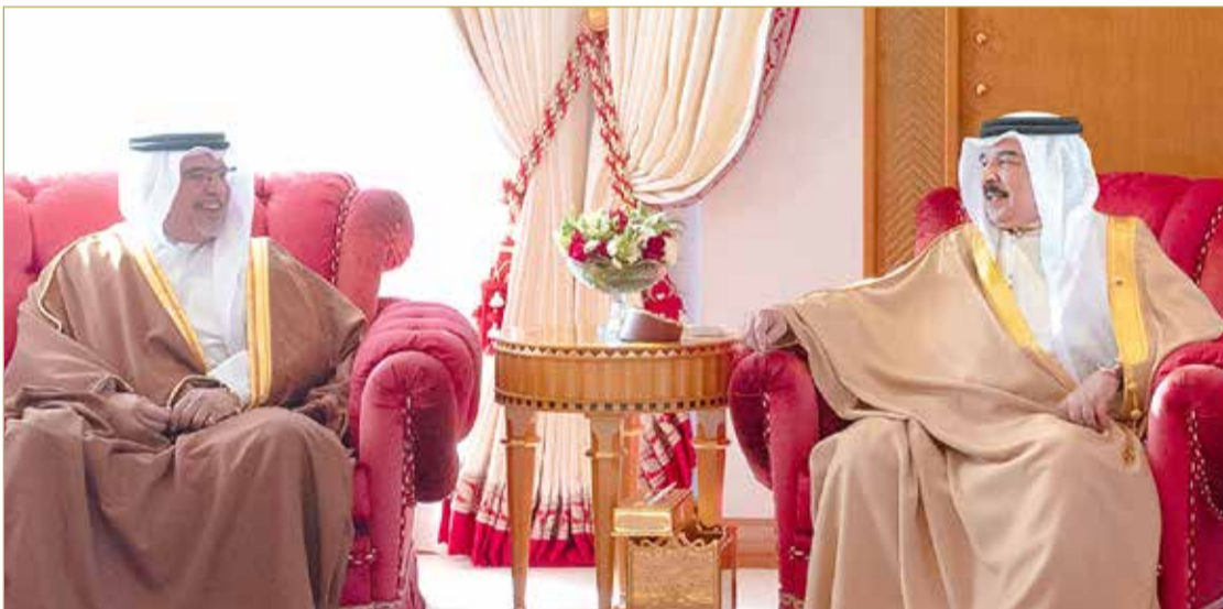
جلالة الملك المعظم يستقبل سمو ولي العهد رئيس الوزراء

من المنجزات الوطنية، وأعرب جلالته الملك المعظم عن الاعتزاز بالجهد الكبير والعمل الدؤوب والمثمر الذي يقوم به صاحب السمو الملكي ولي العهد رئيس مجلس الوزراء في خدمة المملكة وتعزيز مكانتها العالمية المرموقة وتنافسيتها ودعم المبادرات التي تدرى مسارات التنمية والتطوير وبما أنجزته الحكومة من مشروعات رائدة في جميع المجالات التي تحدم مسيرة الوطن وتحقق تطلعات المواطنين الكرام. كما أشاد جلالته بما تشهده مملكة البحرين من نهضة رياضية وشبابية وبالعامل الدؤوب والناجح والذي يقوم به ممثل جلالته الملك للأعمال الإنسانية وشؤون الشباب مستشار الأمن الوطني قائد الحرس الوطني قائد الحرس الملكي سمو الشيخ خالد بن حمد آل خليفة والنايب الأول لرئيس المجلس الأعلى للشباب والرياضة رئيس الهيئة العامة للرياضة رئيس اللجنة الأولمبية البحرينية سمو العقيد الركن الشيخ خالد بن حمد آل خليفة، ووزير الديوان الملكي الشيخ خالد بن أحمد آل خليفة. وخلال اللقاء، تم استعراض عدد من المواضيع المتعلقة بالشأن المحلي وفي مقدمتها دفع المسيرة التنموية الشاملة والنهضة الحضارية المباركة التي تشهدها البلاد لتعزيز مزيد