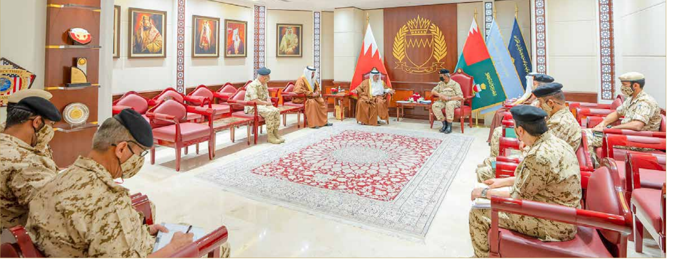
سمو ولي العهد نائب القائد الأعلى للقوات المسلحة رئيس مجلس الوزراء يزور القيادة العامة لقوة دفاع البحرين