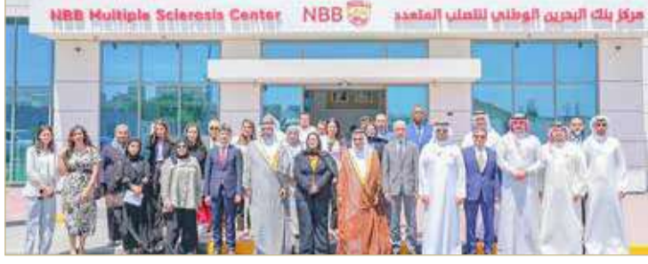
المنامة - وزارة الأشغال

وأفاد بأن المركز سيشمل الخدمات التي يحتاجها مرضى التصلب المتعدد وستتوافر فيه الخدمات التشخيصية والعلاجية والتأهيلية، والوقائية وسيتم تزويدهم بفريق يضم كوادر مهنية مؤهلة من مختلف التخصصات الطبية والصحية، لمواجهة المرض والتصدي له وتطوير وتحسين مستوى الخدمات الصحية المقدمة لهذه الفئة من المرضى من أجل تحسين جودة حياتهم وتمكينهم من التعامل والتعايش مع المرض.