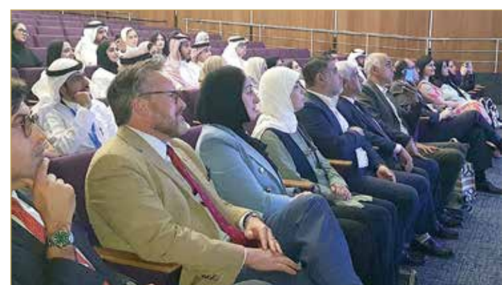
لقطة من حضور تدشين الموسم الأول

من الدراسة والاجتهاد والتعلم لكي يتطور، فالبحريني له حقوق وهذا صحيح، لكن حتى يصل إلى وظيفة أو مركز لابد أن يتعلم ويتدرب، فله حقوق وعليه واجبات والواجب الأكبر هو للوطن". وفي معرض حديثه عن الموازنة بين المسؤوليات، وجه نصيحته للطلبة بالتأكد على أن الموازنة مع الجميع أمر صعب حيث لابد أن تحدث خسارة في جانب ما: يوماً على حساب عائلتك، و يوماً على حساب مكتبك، و يوماً على حساب ارتباطك بالعمل السياسي، لكنه شدد بالتحذير من أن يكون الخاسر الأكبر هي "العائلة"، والدرس الأول الذي أقدمه هو عدم قبول تقديم اهتمام أقل لعائلتك المحيطة. ويأتي حفل تدشين الحلقة الأولى من الموسم الأول لبودكاست "صمم مستقبلك" كأحد الأنشطة التي تهدف إلى تشجيع الطلبة على اتباع نهج أكثر نشاطاً في التخطيط لمستقبلهم وبناءه من خلال حزمة من البرامج المتنوعة ذات الطابع الشمولي والتي صممت لتطوير المهارات الشخصية والقدرات العملية للطلاب، حيث يتم تسليط الضوء على شخصيات ناجحة من مختلف المجالات ليتمكن المشاهد من التعلم والاستفادة من خبراتها.