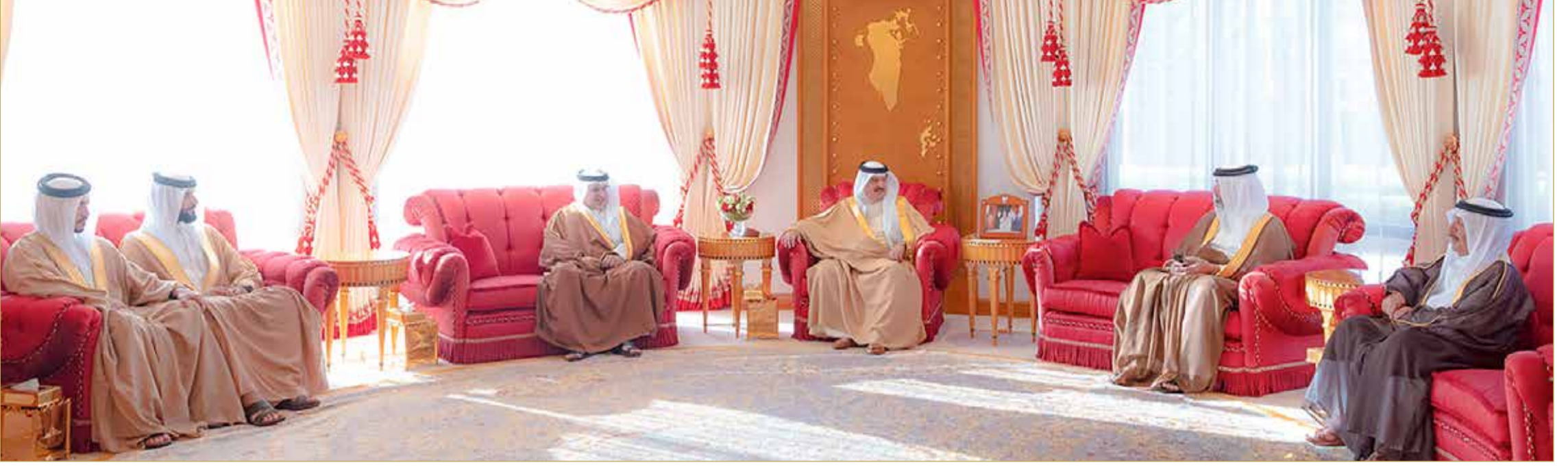
جلالة الملك المعظم يستقبل سمو ولي العهد رئيس مجلس الوزراء