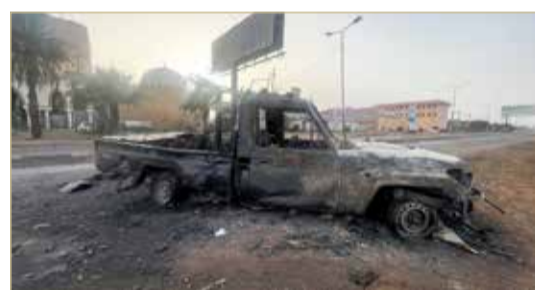
سيارة عسكرية محترقة شوهدت في الخرطوم

وطرفي القتال والشرطة والأمن والشباب ومنظمات المجتمع المدني. وتوصلنا إلى أننا لن نريح من القتال بل خسرننا، وكانت النتيجة أننا اتفقتنا على وقف القتال بالولاية".