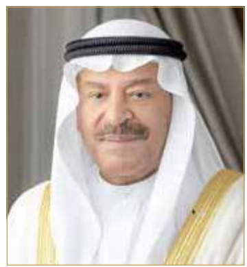
رئيس مجلس الشورى

وفي هذه المناسبة، أشار رئيس مجلس الشورى إلى أن النجاحات المتتالية للمملكة العربية السعودية الشقيقة في تنظيم هذه الشعيرة الإسلامية العظيمة أمر غير مستغرب، فقد سخرت المملكة العربية السعودية الشقيقة كل إمكانياتها وجهودها لخدمة الحجاج والدين الإسلامي الحنيف، وعملت كذلك على نشر قيم التعايش والسلام والاحترام المتبادل بين جميع المسلمين الذين يتقاطرون من شتى بقاع الأرض تلبيةً لنداء ربهم.