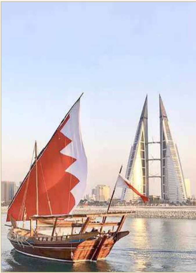
تتميز البحرين بسفينة تاريخية في صناعة السفن