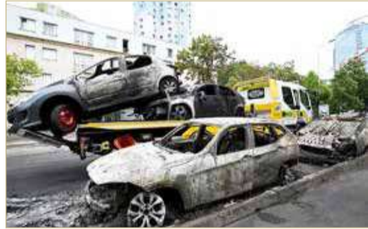
جانب من مشاهد الشغب بشوارع باريس

أنحاء البلاد لليوم الثاني "غير مبررة". جاء ذلك في مستهل اجتماع أزمة لماكرون مع كبار وزراء الحكومة. وقال ماكرون أمس الأربعاء، إن مقتل الشاب بالرصاص "لا يُغتفر".