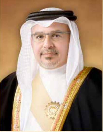
سمو ولي العهد رئيس الوزراء