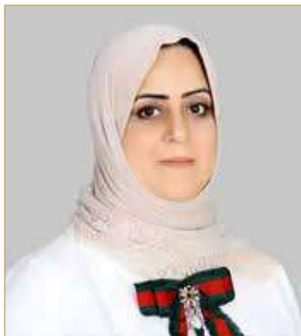
مديرة إدارة الصحة الحيوانية