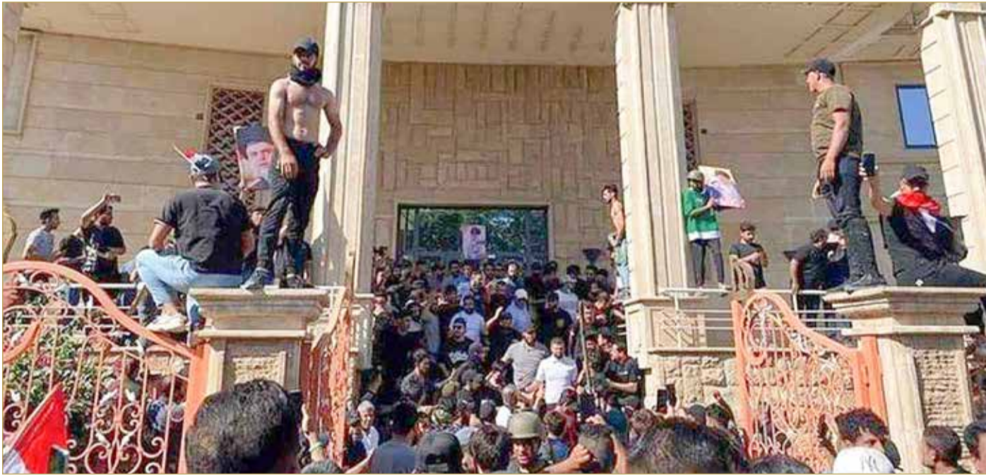
متظاهرون يقفون أمام السفارة السويدية في بغداد