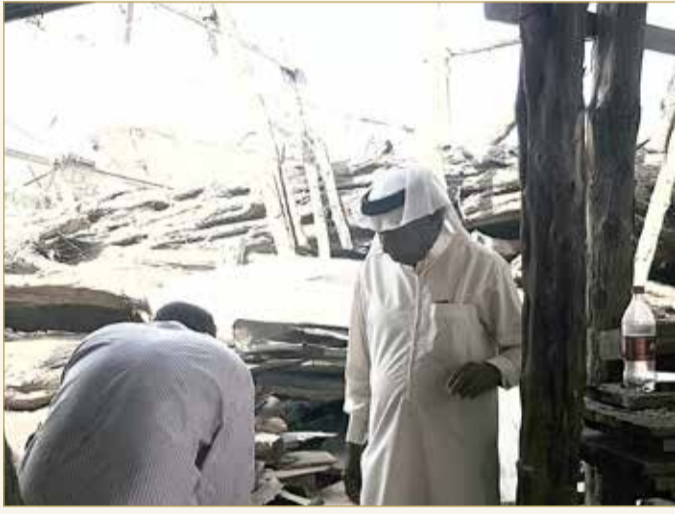
الإشراف على تفاصيل مراحل عمل بناء السفن بدقة

وتنظم اللوائح إجراءات هذه الصناعة، فالقرار رقم "2" لسنة 2021 نظم متطلبات تسجيل سفن الخدمات والقطر والركاب والبضائع والسفن التي تستخدم لأغراض تجارية وفق شروط تقديم الطلب من مالك السفينة أو من يوكله وإتمام إجراءات التسجيل وبياناته ومستنداته التي تشمل شهادة المنشأ وتاريخ ومكان إنشاء السفينة، علاوة على نوع السفينة ومحركها وقوته وأبعادها طولاً وعرضاً وعمقاً، وحمولتها الصافية والإجمالية واسم ولقب ومهنة ومؤطن وجنسية المالك أو المالكين على الشيوخ، مع بيان حصة كل منهم، واسم مجهز السفينة ولقبه ومهنته وجنسيته وموطنه، والحقوق العينية المترتبة على السفينة، فيما يأمل أساتذة بناء السفن في توجيه اهتمام أكبر لهذه الصناعة ودعمها والترويج لها باعتبارها من الصناعات التاريخية التي تميزت بها مملكة البحرين منذ غابر التاريخ، حيث تشير دراسة للمجلة العلمية المتخصصة "الثقافة الشعبية.. رسالة التراث الشعبي من البحرين إلى العالم" في عددها السابع، إلى أن أقدم نماذج سفن أهل البحرين ظهرت على تصاوير الأختام الدلمونية والمنحوتات الحجرية التي يقدر عمرها بأكثر من 2000 سنة قبل الميلاد.