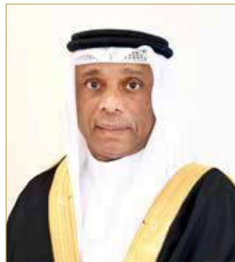
وكيل الزراعة والثروة البحرية

الاستخدام العشوائي أو المفرط للمضادات الحيوية. وتابعت "تشكل مقاومة مضادات الميكروبات تهديدًا لصحة ورفاهية الحيوانات، إذ يمكن للبكتيريا المقاومة أن تنتشر بين الإنسان والحيوان والبيئة ولذلك فهو مصدر قلق عالمي لصحة الإنسان والحيوان".