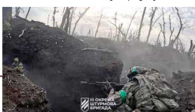
III ОКРЕГА ШТУРМОВА БРИГАДА

ويكتنف الغموض مصير عدد من كبار القادة العسكريين في روسيا، الذين تواروا عن الأنظار، في أعقاب تمرد "فاغنر"، وسط "تكهنات" وتقارير غير مؤكدة بشأن احتجاز قائد عسكري بارز، يعتقد أنه كان "على علم مسبق" بالأحداث. وفي موسكو، رفض الكرملين، أمس الخميس، الإجابة على أسئلة صحافيين عن الجنرال الروسي سيرجي سوروفيكيين "هرمجدون"، الذي لم يجر الإعلان عن وضعه أو مكانه منذ إحباط