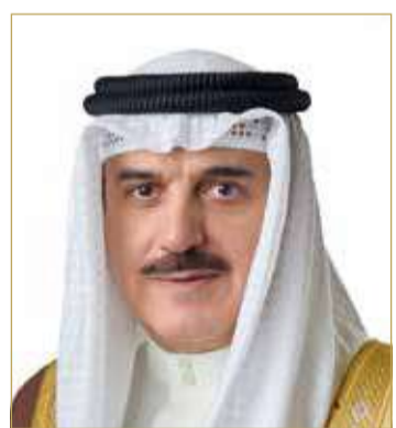
رئيس مجلس النواب

الشريفيين منذ تأسيسها على يد المغفور له الملك عبدالعزيز - طيب الله ثراه - في إدارة هذه الشعيرة العظيمة، والذي يؤكد دور وإسهامات وموقف المملكة العربية السعودية الراسخ والثابت، في خدمة الدين الإسلامي والمسلمين، داعياً المولى عز وجل أن يحفظ المملكة العربية السعودية وقيادتها الحكيمة وشعبها الشقيق، ويوفقها لتحقيق المزيد من التقدم والازدهار.