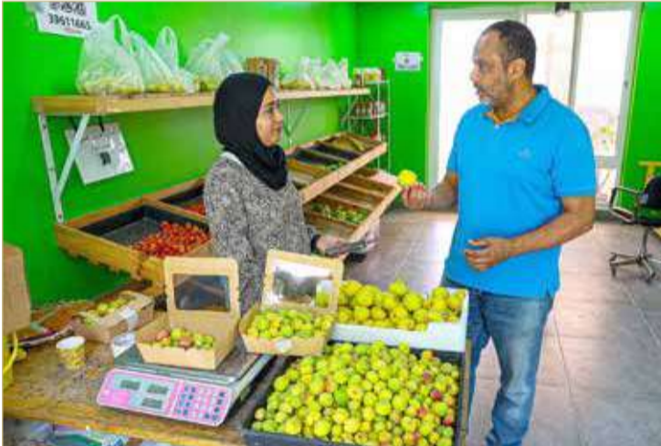
الرياني متحددا لـ "البلاد"