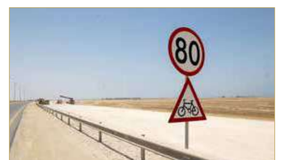
المسار الثاني للدراجات