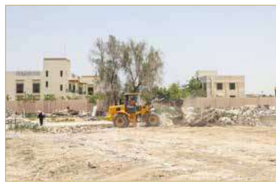
عقار إسطنبول الخيول