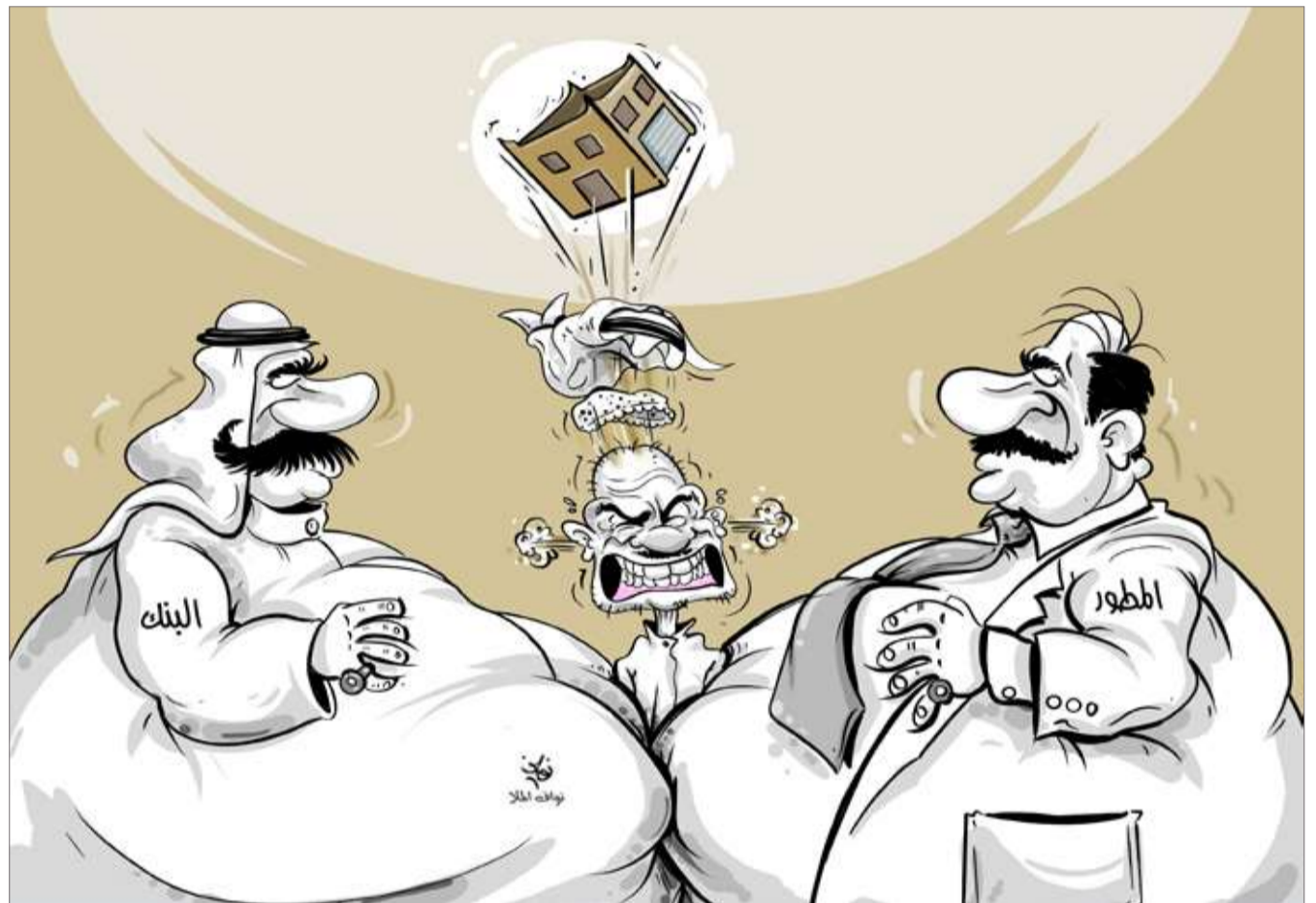
كاريم الفيز فنان السخرية