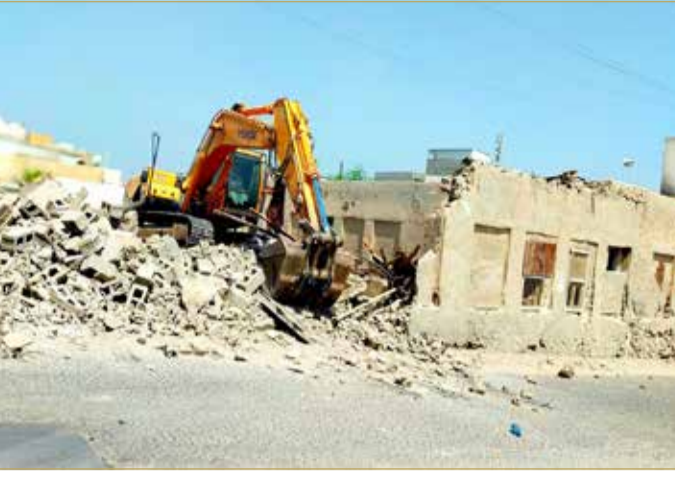
إزالة أحد البيوت المتهالكة الخطرة