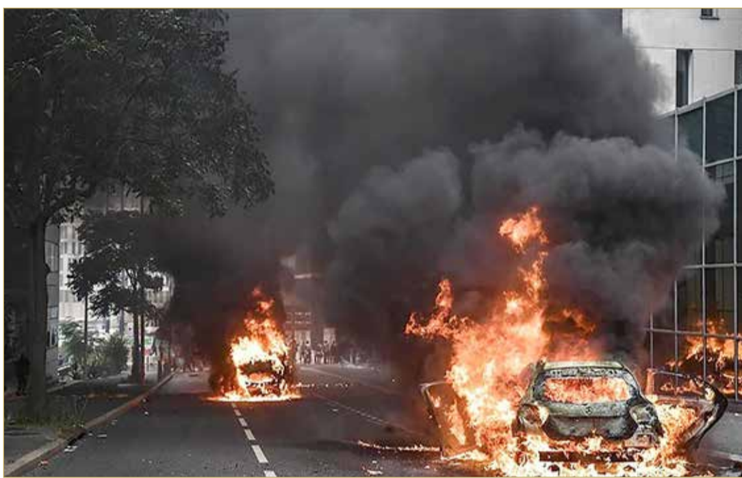
محتجون يضرمون النار بسيارات في وسط العاصمة باريس

هزت أعمال شغب شملت عمليات حرق ونهب وتخريب مقر إدارات عامة ومناوشات متفرقة أمس (الجمعة)، مدناً كثيرة في العاصمة الفرنسية باريس، بعد توجيه تهمة القتل العمد وحبس شرطي أقدم على قتل مراهق يبلغ 17 خلال عملية تدقيق مروزي. وندد الرئيس الفرنسي إيمانويل ماكرون أمس "بالاستغلال غير المقبول لوفاء" المراهق نائل، وأعلن نشر قوات أمنية إضافية للسيطرة على أعمال الشغب والاضطرابات التي تشهدها أنحاء مختلفة من فرنسا. وتم توقيف 875 شخصاً ليل الخميس وفجر الجمعة في فرنسا، وشملت حصيلة أعمال الشغب، إحراق حوالي 2000 سيارة وإشعال حوالي 3880 حريقاً على الطرقات العامة في عدة مدن، فيما لحقت أضرار بـ 492 مبنى.