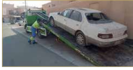
إزالة سيارات السكراب