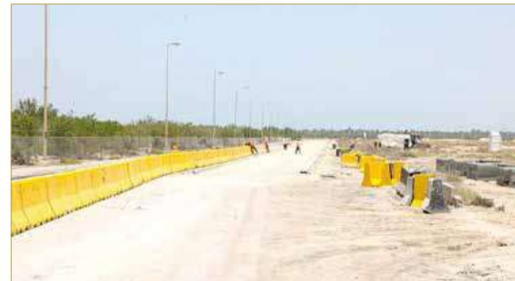
أطول مسار للدراجات