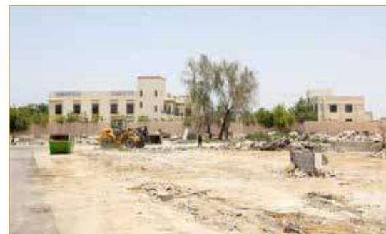
عقار إسطنبول الخيول