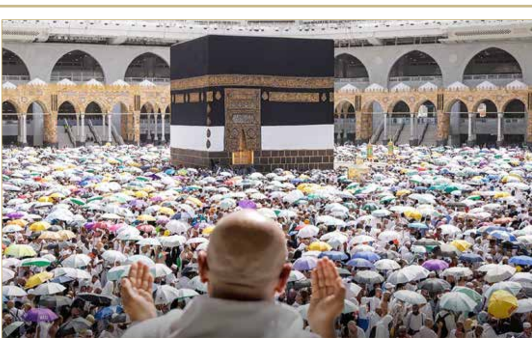
الحجاج يودعون بيت الله الحرام بعد طواف الوداع

الدولة المنقسمة. وقال المصدر العسكري الذي طلب عدم الكشف عن هويته لوكالة الصحافة الفرنسية إن غارات بطائرات مسيرة "مجهولة المصدر" استهدفت مساء الخميس قاعدة الخروبة الجوية الواقعة على بعد 150 كيلومتراً جنوب شرقي بنغازي (شرق) حيث "تتواجد عناصر من مجموعة فاغنر". وفي المقابل، كانت مواقع إخبارية نسبت الهجوم إلى القوات المسلحة التابعة لحكومة طرابلس التي تشكك سلطات شرق ليبيا بشرعيتها. (06)