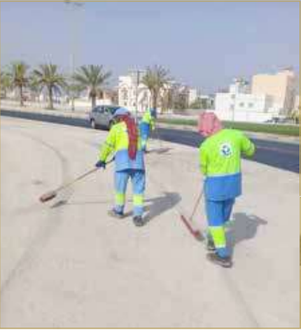
كنس الأرصفة يدوياً