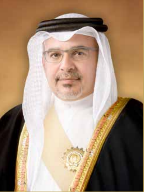
سمو ولي العهد رئيس الوزراء

وأعرب جلالتهم وسموهم في البرقية عن أطيب تهنئتهما وتمنيتهما للحاكمة العامة لكندا بموفور الصحة والسعادة ولشعب كندا الصديق تحقيق مزيد من التقدم والازدهار. وبعث ملك البلاد المعظم برقية تهنئة إلى بول كاجاما رئيس جمهورية رواندا بمناسبة ذكرى استقلال بلاده.