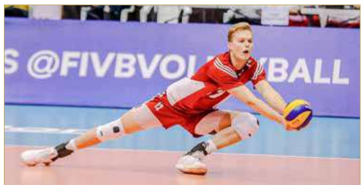
جانب من بطولة العالم الأخيرة التي احتضنتها البحرين العام 2019