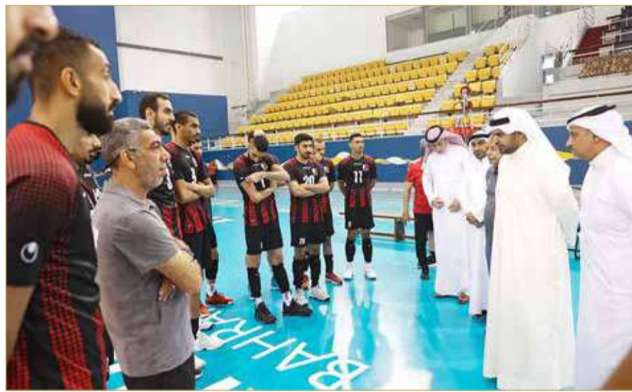
صاحبة السيف - اللجنة الأولمبية

تفقد وكيل وزارة شؤون مجلس الوزراء نائب رئيس اللجنة الأولمبية البحرينية سمو الشيخ عيسى بن علي بن خليفة آل خليفة تحضيرات المنتخب الأول ومنتخب الشباب للكرة الطائرة استعداداً للمشاركة المقبلة المتمثلة في بطولة كأس التحدي الآسيوي للرجال التي ستقام في الصين تايبيه من 8 لغاية 15 يوليو الجاري وبطولة العالم للشباب تحت 21 التي ستستضيفها البحرين من 7 لغاية 16 من الشهر ذاته.