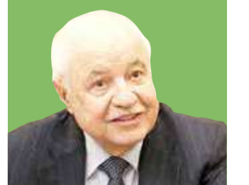
بقلم: د. طلال أبوغزاله

تجاوز الكونغرس لتجنب أزمة سقف الديون الأميركية