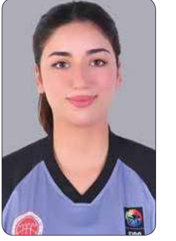
إعداد: حسن فضل