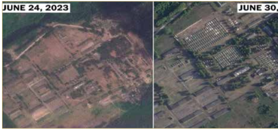
صور أقمار صناعية تظهر خياماً عسكرية ضخمة بقاعدة عسكرية في بيلاروسيا

حذر نائب رئيس مجلس الأمن الروسي ديمتري ميدفيديف، أمس السبت، من أن النشر المحتمل للأسلحة النووية في بولندا قد يؤدي إلى استخدامها. وقال ميدفيديف لوكالة "تاس" تعليقاً على رغبة بولندا في المشاركة في برنامج الناتو حول الاستخدام المشترك للأسلحة النووية: "مع الأخذ في الاعتبار حقيقة احتواء القيادة البولندية اليوم فقط على المختلين عقلياً، فإن طلب نشر أسلحة نووية في بولندا يهدد باستخدامها فحسب.. (حتى مع فهم أن القرار النهائي سيتخذ من قبل الأشخاص المسنين في الخارج)". وأشار إلى أن "هناك جانباً إيجابياً لهذا، موضحاً" سوف يختفي دودا ومورا فيتسكي وكاتشينسكي (رئيس حزب القانون والعدالة الحاكم في بولندا) وتختفي جميع الأرواح الشريرة وسيختفي الآخرون للأسف". وأعرب رئيس الوزراء البولندي، ماتيوس