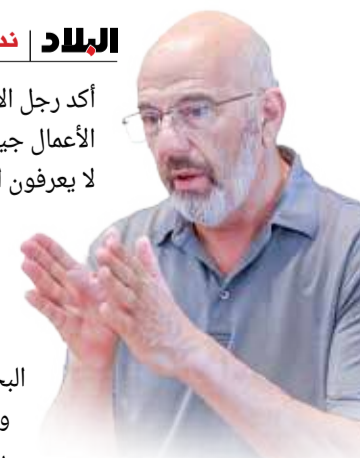
جيف هوفمان متحدثاً لـ "البلاد"

أكد رجل الأعمال الأميركي والعالم بمجال ريادة الأعمال جيف هوفمان أن كثيراً من الأميركيين لا يعرفون الدول التي يزورها ويقدم فيها ورش عمل عن ريادة الأعمال؛ ولذلك فإن مهمته تتضمن أيضاً تثقيف متابعيه من الأميركيين وغيرهم عن الأماكن التي يحل بها ومن بينها مملكة البحرين، حتى يرغبهم في زيارتها ومعرفة الكثير عنها. وأكد هوفمان أن ريادة الأعمال في الخليج تسير في الاتجاه الصحيح.