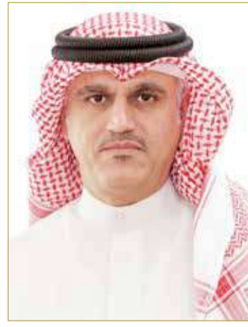
وكيل شؤون البلديات