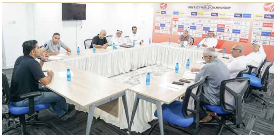
جانب من اجتماعات اللجنة التنفيذية للبطولة