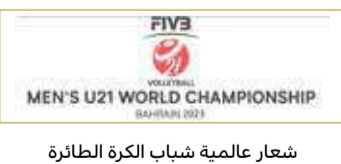
شعار عالمية شباب الكرة الطائرة

التنظيم، وأن استضافة مملكتنا العالمية مثل هذه البطولة المهمة لها دليل على ثقة المسؤولين بالاتحاد الدولي بإمكانات البحرين وقدرات شبابها المعطاء، مشيراً إلى أن الاستضافات العالمية الثلاث التي أقيمت بالبحرين على مستوى منتخبات الشباب شهدت جميعها النجاح على جميع المستويات بشهادة المنتخبات المشاركة، وأن الإمكانيات والتحديات تضاعفت من بطولة لأخرى، حيث استضافت البحرين أول بطولة عالمية العام 1987 في نسختها الرابعة لتسجل المملكة