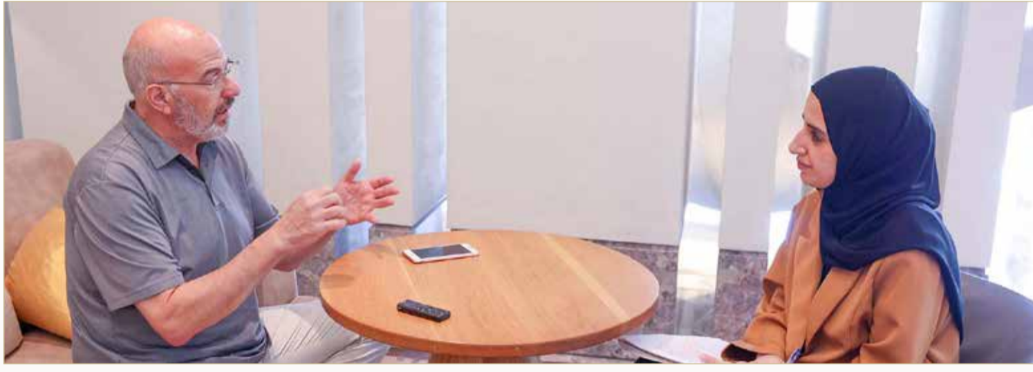
جيف هوفمان متحدثاً لـ "البلاد"

النصيحة الرئيسية هي أولاً أنه بإمكانهم أن يبدأوا مشاريعهم التجارية الخاصة بهم، يمكنهم الخروج وحل أي مشكلة والمساعدة في تعزيز اقتصاد مملكة البحرين، عليك أن تعرف مستقبلك وأنت قادر على فعل ذلك المستقبل، فهذه أول نصيحة هي إدراك ذلك والتحكم فيه. ثانياً هو أن يدرك الشباب أن علاقتهم هي كل شيء، لا يمكنك فعل ذلك بنفسك، فأنت بحاجة إلى فريق، ستحتاج إلى أشخاص لذلك يجب أن يبدأوا من الآن. راسلتي فتاة صغيرة على منصة "الإنستغرام" وقالت إنني أعلم أنك في بلدي، هل هناك أي طريقة يمكنكني من خلالها شراء القهوة لك هذا الصباح وطرح بعض الأفكار عليك؟ فقلت لها يمكنك المجيء إلى المجمع التجاري ومقابلتي هناك وذهبت إلى المقهى، هذه الفتاة فعلت كل ذلك بمفردها. يجب على الشباب الوصول إلى الأشخاص سواء في بلدهم أو عبر الإنترنت أينما كانوا وطلب المساعدة، يمكنهم تصميم القيام بذلك كونهم صغاراً في السن، فإذا رأوا شيئاً لا يعجبهم أو مشكلة فأول شيء يفترض أن يفعلونه بأن