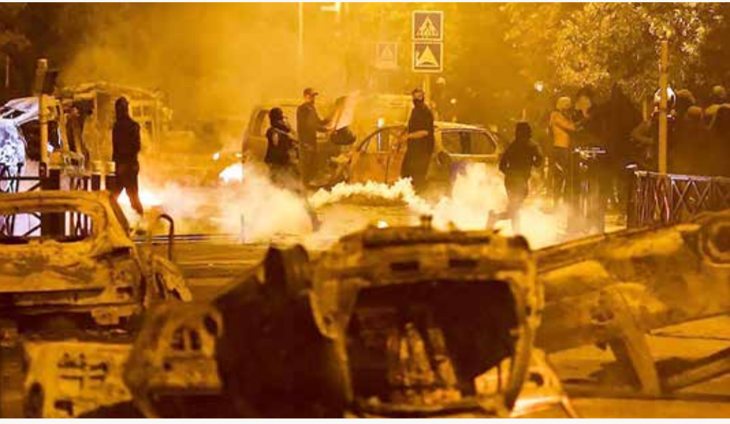
اشتبكات بين المتظاهرين والشرطة في باريس

معتبرة أنه "لا أساس" لهذا الاتهام. ويطلع جزء من الأوساط السياسية مسألة فرض حال الطوارئ في البلاد، وهي مسألة تلقى متابعة حثيثة في الخارج، خصوصاً أن فرنسا تستضيف في الخريف كأس العالم للكري ومن ثم دورة الألعاب الأولمبية الصيفية في باريس العام 2024. ويسمح فرض حال الطوارئ للسلطات الإدارية باتخاذ إجراءات استثنائية مثل منع التجول، وسبق أن فرضت في نوفمبر 2005 بعد أعمال شغب استمرت 10 أيام في الضواحي عقب مقتل مراهقين صعباً في محول كهربائي احتجياً داخله هرباً من مطاردة الشرطة لهما.