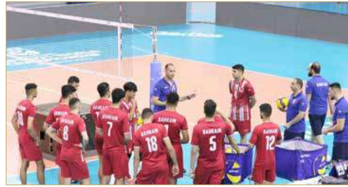
من تدريبات طائرة الاحمر تحضيرا للاستحقاق العالمي

وبعد كلمة رئيس لجنة الاحتكام، فتح المجال أمام أعضاء اللجنة التنفيذية وأعضاء لجنة الاحتكام لإبداء ملاحظاتهم المختلفة والنقاش حولها لتقريب وجهات النظر، منها ما هو متعلق بالية النقل التلفزيوني، والمواصلات والتغذية وتطبيق نظام الإحصاء الجديد "فولي ستيشن"، وعقب الاجتماع قامت لجنة الاحتكام بزيارة تفقدية لفندي البطولة، وصلات التدريب الأربع وصالة الاتحاد البحريني لكرة الطائرة وصالة الاتحاد البحريني لكرة الطاولة؛ للوقوف على جاهزيتها لانطلاقة المواجهات رسميا.