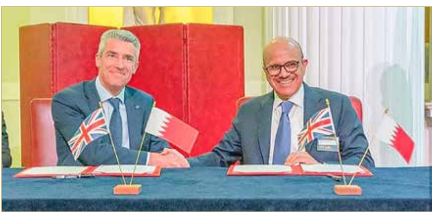
أثناء توقيع الاتفاقية

والمراقبة الموارد البحرية الطبيعية في المنطقة، وتقديم الاستشارات الفنية. وبهذه المناسبة، أكد وزير النفط والبيئة المبعوث الخاص لشؤون المناخ الدور الذي تلعبه المملكة المتحدة في سبيل المحافظة على البيئة على الصعيد الدولي، مشيراً إلى عمق العلاقات التاريخية الوطيدة بين البلدين الصديقين في مختلف المجالات، مبيناً أن توقيع مذكرة التفاهم تعكس حرص البلدين الصديقين وحرصهما على زيادة التعاون الثنائي والتنسيق المشترك في المجال البيئي وتوقيع إطار عمل في مجالات مراقبة البيئة والحياة البحرية.