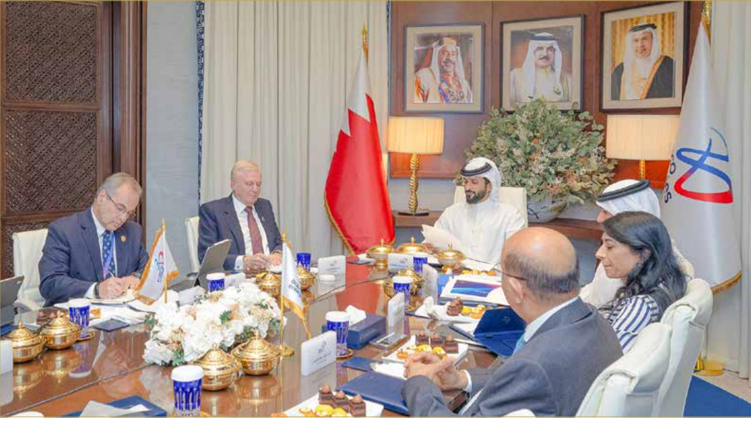
سمو الشيخ ناصر بن حمد يترأس اجتماع مجلس إدارة الشركة