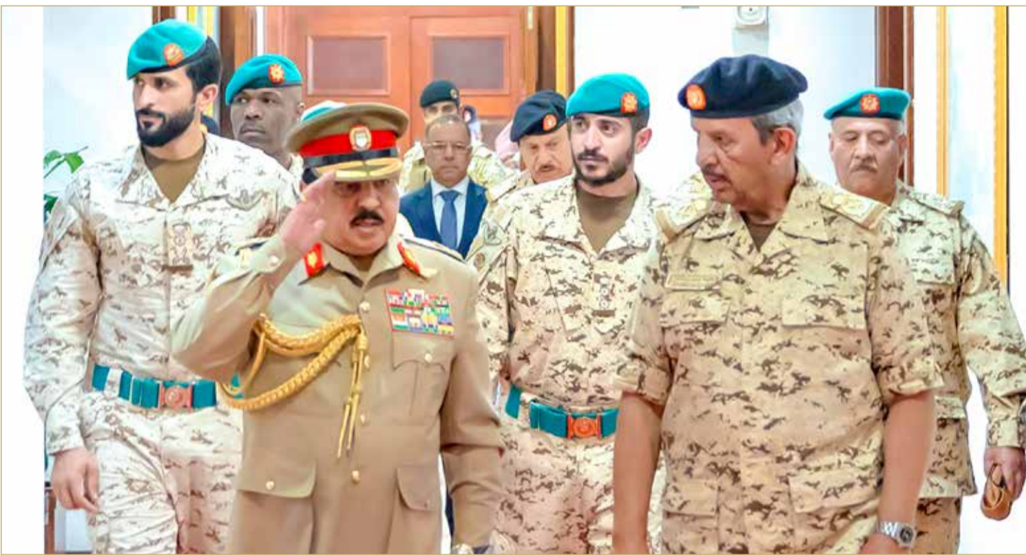
ملك البلاد المعظم القائد الأعلى للقوات المسلحة في زيارة إلى القيادة العامة لقوة دفاع البحرين