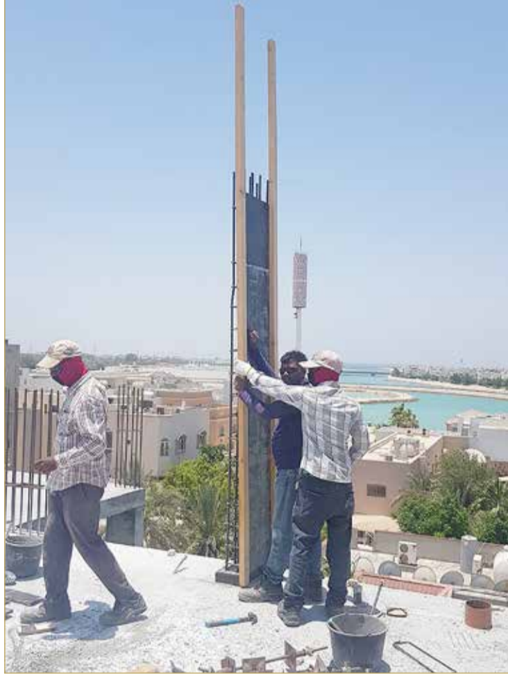
عمال يعكفون على تهيئة الأعمدة الخرسانية