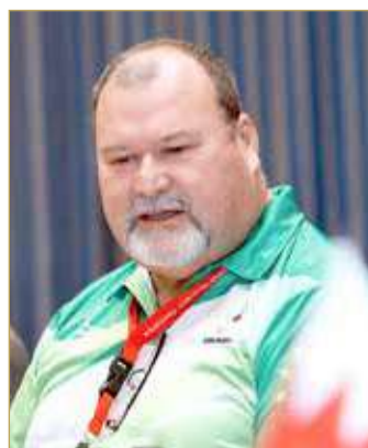
هيو ريتشارد جراهم

الضيافة والاستقبال الذي حظي به من أعضاء لجنته فور وصولهم البحرين صباح يوم الثلاثاء الماضي، وأضاف أن لديه فكرة إيجابية عن المستوى التنظيمي لمملكة البحرين بناء على التقارير التي تصل للاتحاد الدولي للعبة وممن سبقوه في الإشراف على البطولات العالمية في النسخ الماضية، التي حصلت فيها البحرين على درجة التميز على المستوى التنظيمي، معربا عن مسعده الكبيرة بوجوده بالبحرين، مثنيا الجهود التي بذلتها اللجنة التنفيذية لاستضافة البطولة وما تقوم به من أعمال جبارة وكبيرة، وأبدى هيو