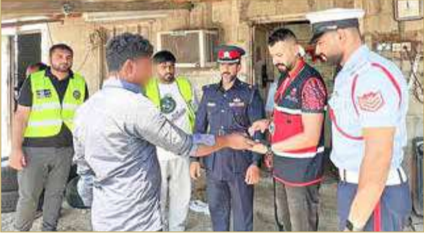
ضاحية السيف - هيئة تنظيم سوق العمل

نقذت هيئة تنظيم سوق العمل 4 حملات تفتيشية في محافظة العاصمة، ومحافظة المحرق والمحافظة الجنوبية، شملت عدداً من المحلات التجارية ومواقع العمل وأماكن تجمع العمالة. وأشارت الهيئة إلى أنه تم تنفيذ حملة تفتيشية مشتركة في المحافظة الجنوبية، بالتنسيق مع شؤون الجنسية والجوازات والإقامة، ومديرية شرطة المحافظة، فيما تم تنفيذ الحملة الثانية بالتنسيق مع الإدارة العامة للمباحث والأدلة الجنائية بوزارة الداخلية في محافظة المحرق. كما تم تنفيذ حملتين في محافظة العاصمة، الأولى بالاشتراك مع إدارة تنفيذ الأحكام، والأخرى بالتنسيق مع أمانة العاصمة، ومديرية محافظة العاصمة (شرطة المجتمع). وأوضحت أن الحملات التفتيشية أسفرت عن رصد عدد من المخالفات، لاسيما أحكام قانون هيئة تنظيم سوق العمل وقانون الإقامة بمملكة البحرين والبلديات، وضبط عدد من العمال المخالفين للأنظمة والقوانين، مبينة أنه تم اتخاذ الإجراءات القانونية بشأنها.