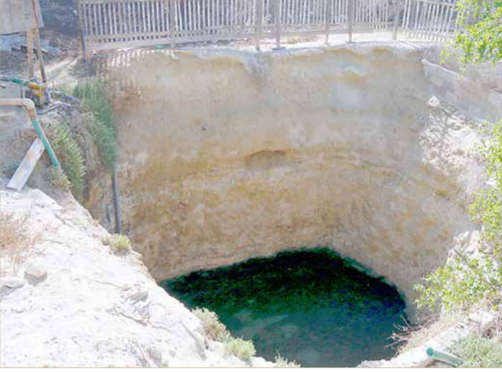
عين مياه طبيعية في المملكة