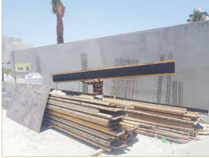
آخر مهمة قبل استراحة الظهيرة

الساعة الحادية عشرة والنصف، حيث كان أكثر من 10 عمال ينقلون كميات من الأخشاب، وعودًا عند الساعة الثانية عشرة والنصف ظهرًا، كانت المجموعة مستلقية في جانب مظلل من المشروع، من جانب آخر، فإن الملاحظة الواضحة أنه في الكثير من المواقع، يتم تخصيص مناطق مناسبة لاستراحة تدوم أربع ساعات، لكن، يعمل بعض العمال دون توقف في الجزء المظلل من المشروع.