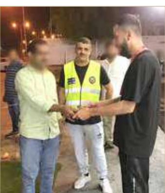
الجنوبية، أما الرابعة فكانت في المحافظة الشمالية بالتنسيق مع إدارة تنفيذ الأحكام.

ودعت الهيئة الجميع للإبلاغ عن أية شكاوى تتعلق بمخالفات سوق العمل والعمالة غير النظامية من خلال ملء الاستمارة الإلكترونية المخصصة للإبلاغ على الموقع الرسمي للهيئة. www.imra.gov.bh أو الاتصال على مركز اتصال الهيئة 17506055.