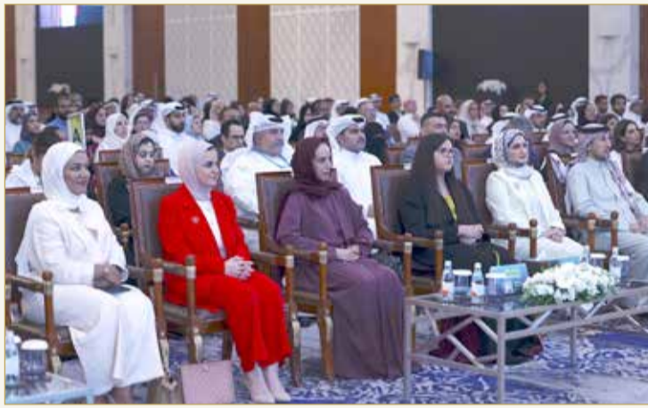
وزير شؤون الشباب روان توفيق وحضور الحفل

* فازت "ريثينك" من "Rethink" من الجامعة الأمريكية في البحرين بجائزة "أفضل أداء مالي" برعاية "تمكين".