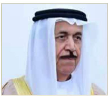
رئيس المجلس الأعلى للشؤون الإسلامية

وووجه رئيس المجلس الأعلى للشؤون الإسلامية بمملكة البحرين الشكر لمجلس حكماء المسلمين؛ برئاسة فضيلة الإمام الأكبر أحمد الطيب، شيخ الأزهر، مؤكداً أن اهتمام الحكماة بالشباب نابع من قناعة راسخة بأهمية الدور الذي يمكن أن يقوم به الشباب في تقدم الأمم والمجتمعات. وأعرب الشيخ عبدالرحمن بن محمد بن راشد آل خليفة عن تقديره لجهود مجلس حكماء المسلمين، في ضرورة الاستفادة من طاقات الشباب في تشكيل حراك عالمي قادر على المساهمة في مواجهة التحديات المعاصرة وضاعة مستقبل أفضل للإنسانية.