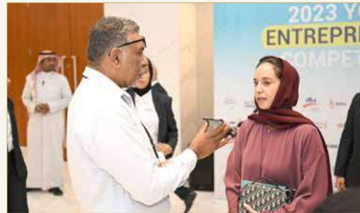
سمو الشيخة حصّة بنت خليفة تتحدث للزميل سعيد محمد سعيد

فئة الجامعات للعام 2023، و"أفضل شركة في فئة المدارس الثانوية للعام 2023"، بالإضافة إلى جائزة "أفضل منتج في فئة الجامعات للعام 2023"، و"أفضل منتج في فئة المدارس الثانوية للعام 2023"، وأيضاً "أفضل تأثير اجتماعي في فئة الجامعات 2023"، و"أفضل تأثير اجتماعي في فئة المدارس الثانوية للعام 2023"، تقديرًا للمساهمات البارزة للشركات الطلابية المشاركة، كما تضمنت المسابقة هذا العام 6 جوائز مميزة تقديراً للإنجازات الاستثنائية وهي: جائزة "أفضل جناح وعلامة تجارية" برعاية بنك السلام، وجائزة "الابتكار" برعاية البحرين والكويت، وجائزة "التميز في التكنولوجيا" برعاية بابكو، وجائزة "التميز في الإدارة البيئية الاجتماعية" برعاية بنك البحرين الوطني، وجائزة "أفضل أداء مالي" برعاية "تمكين"، وجائزة "أفضل