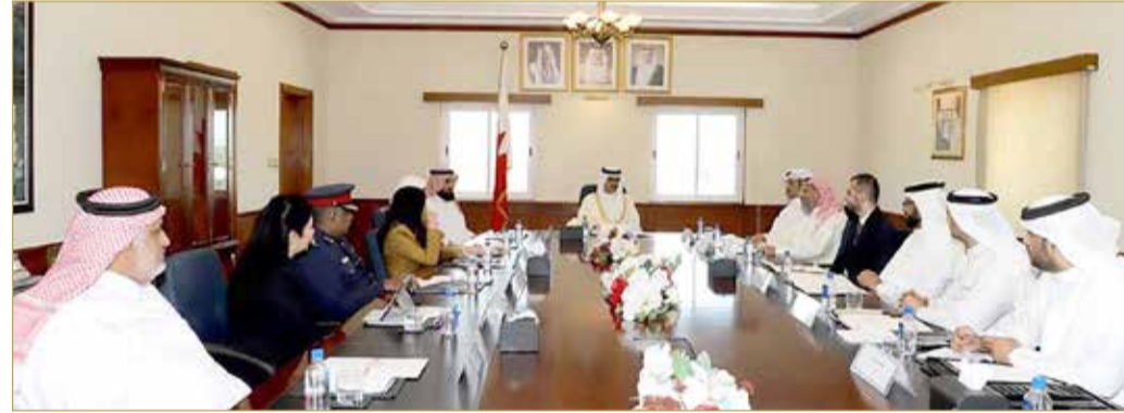
سمو محافظ الجنوبية يترأس ختام اجتماعات المجلس التنسيقي في دورته الثالثة

وتقديره لأعضاء المجلس على دورهم الفاعل والبارز لخدمة مجتمع الجنوبية في مختلف المجالات، الأمر الذي يؤكد دور التواصل في تعزيز التعاون والتنسيق مع مختلف الجهات، وأشار سموه إلى أن المجلس التنسيقي قد ساهم في إنشاء سلسلة من المشاريع الخدمية والمستدامة التي تلبى احتياجات الأهالي وتوفر الخدمات بالجودة العالية وبالشكل الذي يرتقي