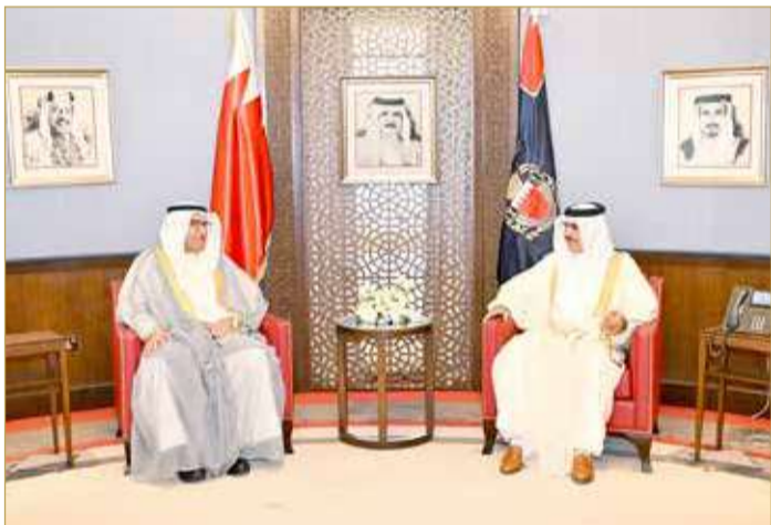
وزير الداخلية مستقبلاً وكيل وزارة الداخلية الكويتي