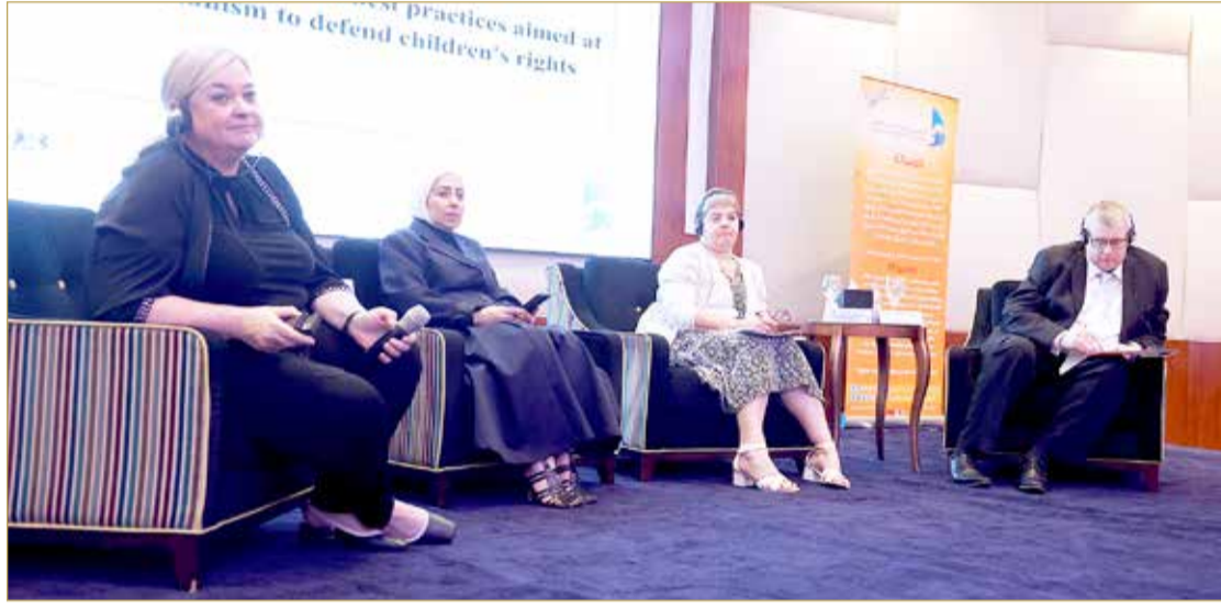
جانب من جلسة تبادل الأفكار والعصف الذهني لحماية الطفل

الحكومية ومؤسسات المجتمع المدني والمنظمات غير الحكومية الإقليمية والدولية ذات العلاقة بحقوق الطفل، والتواصل مع الجماهير في المجتمع، إضافة إلى تمثيل آراء الأطفال والشباب والدفاع عن القضايا المتعلقة بحقوق الطفل، والتحقيق في أي أمر يتعلق بحقوق الطفل، بما في ذلك مدى كفاية الشكاوى وخدمات الدعم والمساندة للأطفال، وإجراء متابعات وتقييمات حول تأثير حقوق الأطفال على السياسات والتشريعات الجديدة، وإجراء بحوث ودراسات تتعلق بحقوق وآراء ومصالح الأطفال، والتكليف بإجراء بحوث ذات صلة بحقوق وآراء ومصالح الأطفال.