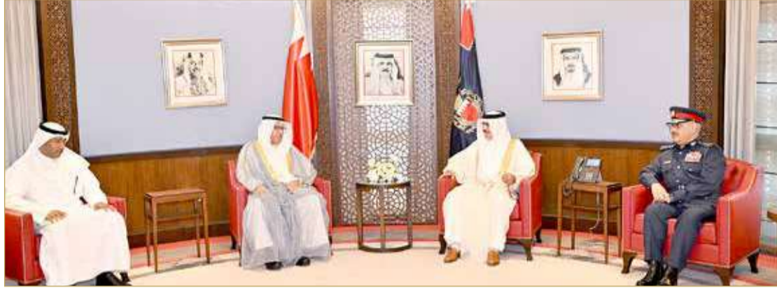
وزير الداخلية مستقبلاً وكيل الداخلية الكويتي

العقوبات البديلة وبرنامج السجون المفتوحة، لافتاً إلى تطور العمل الأمني، استناداً إلى الإجراءات الاستباقية وتطبيق الإجراءات القانونية السليمة. وأشار إلى أن انخفاض معدل الجريمة في البحرين دليل نجاح العمل الأمني، منوهاً إلى أهمية المبادرات التي يتم إطلاقها من أجل تعزيز الهوية الوطنية في ظل ما يشهده العالم من تحولات. وتم خلال اللقاء، بحث مجالات التعاون والتنسيق الأمني وتبادل الخبرات في مجال التدريب، وفتح آفاق جديدة من التعاون الثنائي. كما تم التطرق إلى عدد من الموضوعات والمستجدات الأمنية على الساحة الإقليمية، بما يسهم في حفظ الأمن وتطوير الجهود المشتركة؛ لمواجهة التحديات الأمنية الراهنة وتطوير آليات العمل المشترك.