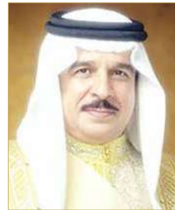
ملك البلاد المعظم

البشرية جمعاء، واستذكر قداسته الزيارة التاريخية الناجحة التي قام بها للمملكة العام الماضي، والتي أسهمت في تعزيز علاقات التعاون الوثيقة مع الفاتيكان وترسيخ قيم