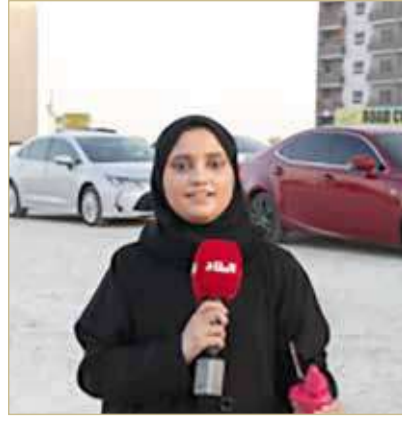
"البلاد" خلال التغطية