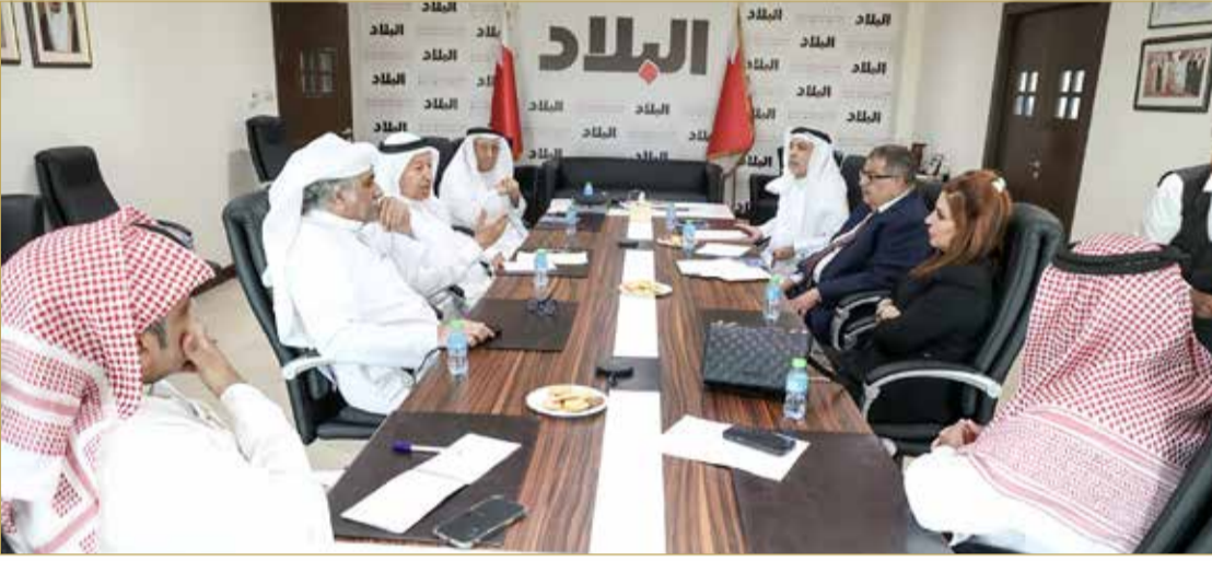
جانب من لقاء إدارة "البلاد" مع إدارة جمعية المحامين