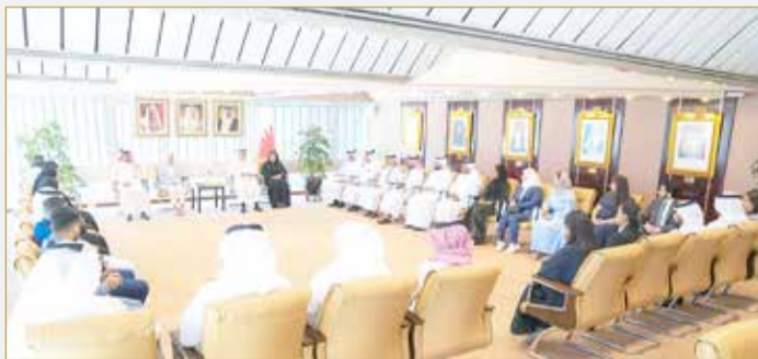
جانب من لقاء وزير العدل والشباب مع المحامين الشباب

بالمنطقة الدبلوماسية، وأن تعديل قانون المحاماة في مرحلة الأخيرة، إضافة إلى تطبيق العقوبات البديلة لغير البحرينيين في أوطانهم، مشيرين إلى أن العقوبات البديلة أثبتت نجاحها في عدم تكرار الجرائم، لمعظم من تم إدخالهم في برنامج العقوبات البديلة.