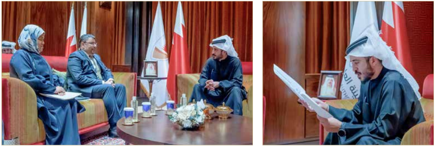
سمو الشيخ خالد بن حمد يستقبل وزير شؤون الكهرباء والماء

كفاءة الطاقة لديها انطلاقا من جهود الهيئة في رعاية الأندية وتقديم أفضل الخدمات لهم. من جانبه، أعرب ياسر حميدان عن تقديره للجهود التي يقودها سمو الشيخ خالد بن حمد آل خليفة؛ للإسهام في تطوير الرياضة في مملكة البحرين والتي حققت إنجازات بارزة، مؤكدا حرص وزارة شؤون الكهرباء والماء على دعم القطاع الرياضي لتحقيق مزيد من المكتسبات في هذا المجال.