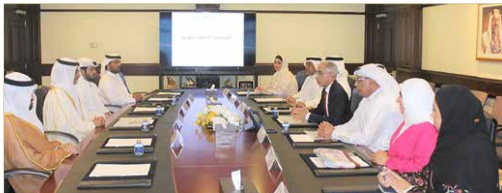
سمو محافظ الجنوبية يلتقي وزير الأشغال

وفي مستهل اللقاء، أكد سموه حرص الجنوبية على تحقيق التطلعات المستقبلية والمستدامة للأهالي، ضمن التوجيهات السديدة لملك البلاد المعظم صاحب الجلالة الملك حمد بن عيسى آل خليفة، ودعم ولي العهد رئيس مجلس الوزراء صاحب السمو الملكي الأمير سلمان بن حمد آل خليفة، منوها سموه بأن المحافظة مستمرة في متابعة احتياجات الأهالي المتعلقة بالجوانب الخدمية والتنمية بالتعاون مع الجهات المختصة. كما بحث سمو المحافظ تطورات العمل في عدد من المشروعات الخدمية والتنمية التي يجري تنفيذها بالمحافظة، ومناقشة سبل الارتقاء بالمشروعات الخدمية