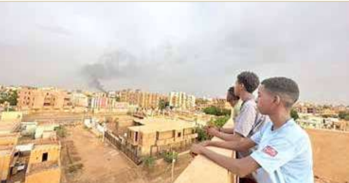
قصف عشوائي يقتل 34 بينهم أطفال في أم درمان

وبحسب البيان فإن هذه العقوبات "ستحد من حريتهن العالي من خلال منع مواطني المملكة المتحدة والشركات والبنوك من التعامل معهن والضغط على الأطراف للانخراط في عملية السلام".