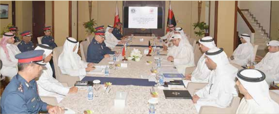
اجتماع اللجنة الأمنية المشتركة بين البحرين والكويت

وأن الأهداف مشتركة في التكامل لمواجهة التحديات والمتغيرات الأمنية. في السياق ذاته، أعرب وكيل وزارة الداخلية بدولة الكويت الشقيقة عن شكره لرئيس الأمن العام على حسن الاستقبال وكرم الضيافة والإعداد والتنظيم للاجتماع وتوفير أسباب نجاحه، معبراً عن اعتزاز دولة الكويت بالعلاقات مع مملكة البحرين وما تشهده من تطور مستمر في ظل الرعاية التي تحظى بها من قيادتي البلدين الشقيقين.