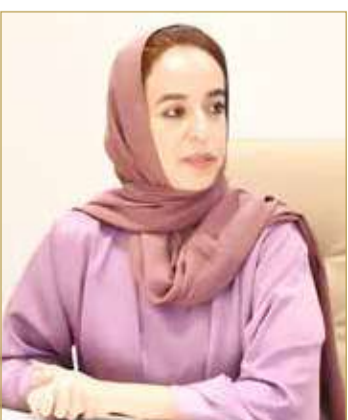
سمو الشيخة حصة بنت خليفة