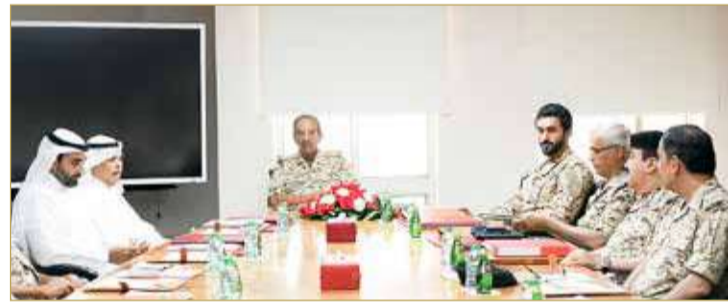
القائد العام يترأس الاجتماع الأول للمجلس الأعلى للمؤسسة العسكرية لتطوير التصنيع الحربي بحضور سمو مستشار الأمن الوطني قائد الحرس الملكي

التصنيع الحربي والاستثمار في مجال البحوث العسكرية والاستعانة بالكفاءات البشرية التي سخرت لها قوة دفاع البحرين، التي تؤكد إمكاناتها في عملية البحث والتخطيط والتنفيذ منذ التأسيس وحتى يومنا هذا، من خلال برامج التدريب والتأهيل وكسب العلم والمعرفة في مختلف المجالات والتخصصات، خصوصاً الصناعات العسكرية، وتنمية الكوادر الوطنية المؤهلة في هذا الشأن والتهوض الرقي بها علمياً لقيادة وتنفيذ عملية التصنيع الحربي وتطوير عتادنا العسكري. (02)