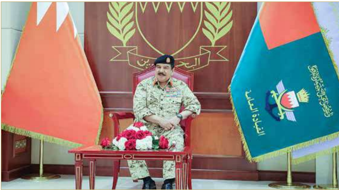
جلالة الملك المعظم القائد الأعلى للقوات المسلحة يزور القيادة العامة لقوة دفاع البحرين

وبالكفاءة العالية التي يتسم بها جميع رجال قوة دفاع البحرين، وما يتميزون به من بسالة وشجاعة في جميع المهام التي توكل لهم، مضيافاً دائماً على قدر المسؤولية وموضع ثقتنا وتقديرنا المستمر. (02)