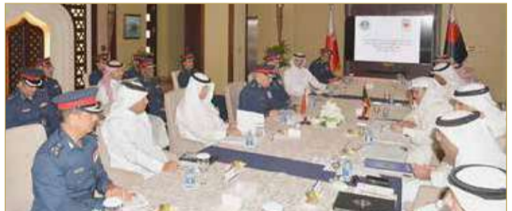
اجتماع اللجنة الأمنية المشتركة بين البحرين والكويت

اتفقت وزارتا الداخلية في مملكة البحرين ودولة الكويت الشقيقة، على تشكيل فرق عمل تنفيذية مشتركة؛ للبحث في عدد من مجالات التعاون والتنسيق الأمني، من بينها الأمن الجنائي، الأمن السيبراني، ومكافحة الإرهاب، إضافة إلى موضوعات المرور والعمليات والربط الإلكتروني والجوازات والتأشيرات والمنافذ، على أن تقوم فرق العمل برفع تقارير عن نتائج أعمالها إلى اللجنة الأمنية المشتركة. جاء ذلك في الاجتماع الأول للجنة، الذي عقد في مملكة البحرين على مدى يومين، برئاسة رئيس الأمن العام الفريق طارق الحسن، ووكيل وزارة الداخلية بدولة الكويت الشقيقة الفريق أنور البرجس، وأشار رئيس