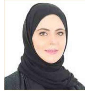
مديرة الإنتاج الزراعي

المطلوبة لتقديم على الدعم هي تعبئة استمارة التقدم، نسخة من هوية المزارع، نسخة من البطاقة الذكية، إضافة إلى نسخة من وثيقة الأرض (إن وجد)، وعقد ساري المفعول، نسخة من بطاقة عنوان المزرعة، وإثبات لآخر تاريخ شراء الأغذية البلاستيكية (في حال كان مصدر الشراء من موردين آخرين).