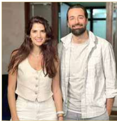
من فيلم حسن المصري