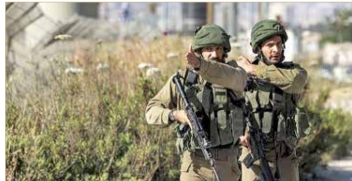
مناوشات على الحدود تثير توترا أمنيا واستنفارا

جاء في بيان نشرته وكالة الإعلام اللبنانية الرسمية، عقب سقوط 3 جرحى من الجانب اللبناني، إثر استهدافهم بقنبلة من قبل الجيش الإسرائيلي. وفيما تحدثت تقارير صحافية لبنانية عن أن الجرحى الثلاثة هم عناصر في جماعة "حزب الله"، لم يصدر أي تعقيب للجماعة. وقالت ارديل إن "بعثة الأمم المتحدة لحفظ السلام على اطلاع على التقارير المعلقة عن حادث وقع على طول الخط الأزرق، ونحن نتابع الوضع". وأضافت "الوضع الآن حساس للغاية،