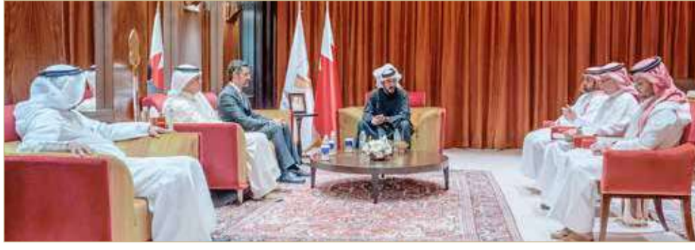
سمو الشيخ خالد بن حمد يستقبل وزير شؤون البلديات والزراعة

ورحب سمو الشيخ خالد بن حمد آل خليفة بوزير شؤون البلديات والزراعة، واطلع سموه على المشروعات التنموية التي تعتمزم الوزارة تنفيذها لدعم المنظومة الرياضية، في إطار التكامل بين