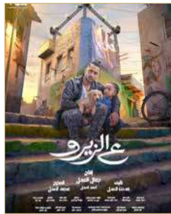
محمد رمضان ع الزيرو