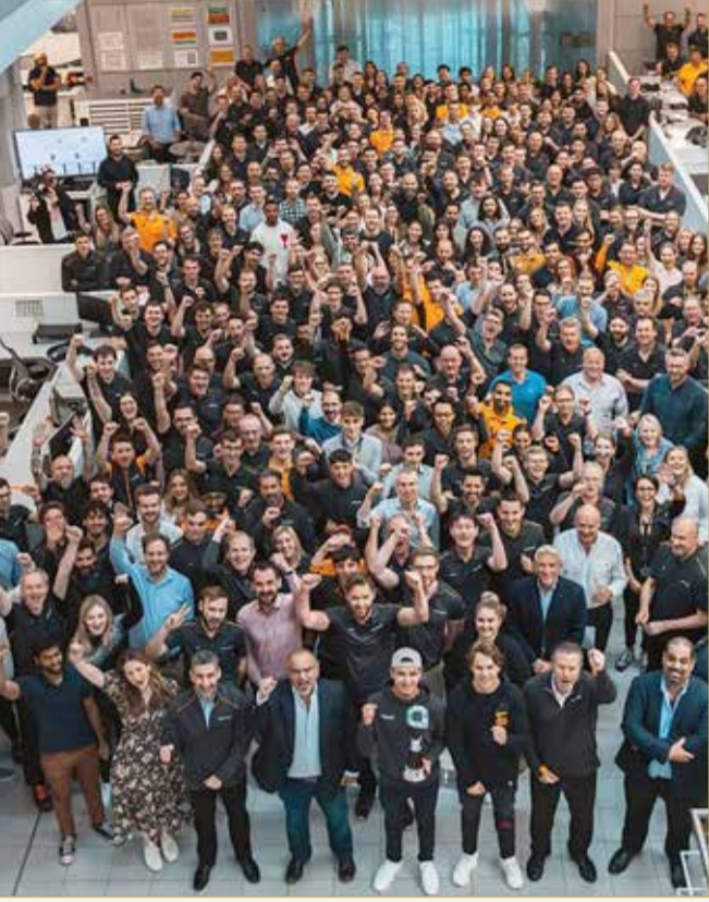
ولي العهد رئيس مجلس الوزراء صاحب السمو الملكي الأمير سلمان بن حمد آل خليفة بتوسط فريق مكلارين، بحضور وزير المالية والاقتصاد الوطني الشيخ سلمان بن خليفة آل خليفة، في صور نشرها الفريق بحسابه على "الانستغرام".