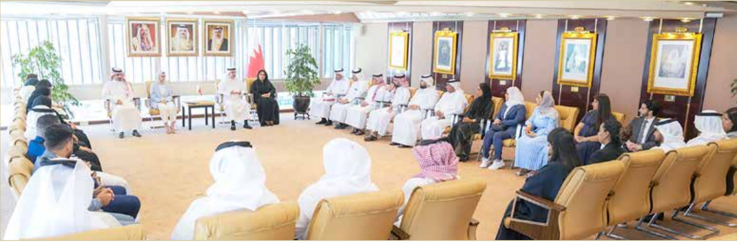
جانب من لقاء وزير العدل والشباب مع المحامين الشباب