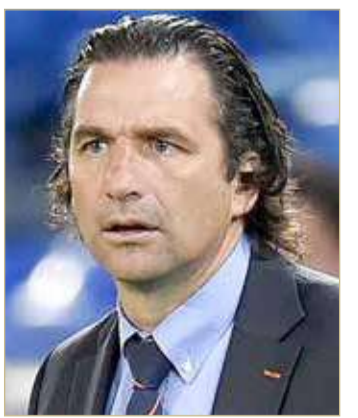
خوان أنطونيو بيتزي

ولفت إلى أن بيتزي سيكون على رأس الإدارة الفنية للمنتخب الوطني مع جهاز فني معاون سيتم التعاقد معه بناءً على توصية المدرب الأرجنتيني. وأوضح الأمين العام للاتحاد البحريني لكرة القدم أن الجهاز معاون سيضم عناصر متكاملة كل في مجال اختصاصه وبما يخدم عمل المدرب وفق رؤيته الفنية الخاصة، معرباً عن خالص الأمنيات للمدرب بيتزي وطاقه بالتوفيق والنجاح في المهمة المقبلة مع المنتخب الوطني.