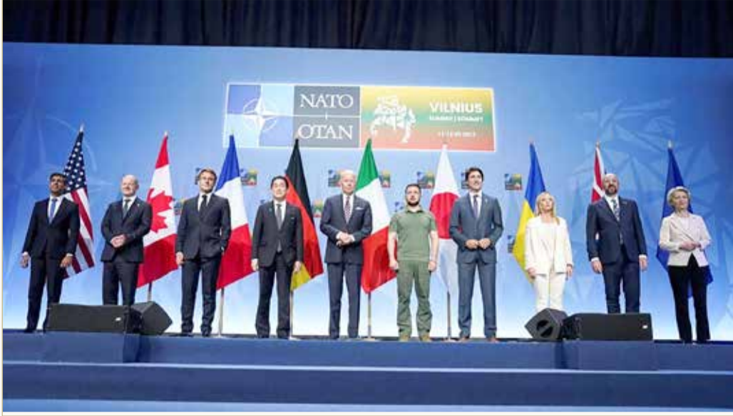
من قمة مجموعة الدول الصناعية السبع الكبرى في فيلنيوس

وأضافت الدول السبع في البيان الذي أصدرته على هامش اجتماعات قمة حلف شمال الأطلسي في فيلنيوس أنه "في حال شنت روسيا هجوما مسلحا في المستقبل، نعتزم تقديم مساعدة أمنية سريعة ومستمرة لأوكرانيا، وأعدت عسكرية متطورة في المجالات البرية والبحرية والجوية، فضلا عن مساعدة اقتصادية، من أجل تكييد روسيا تكاليف اقتصادية وسواها". كما أكدت مجموعة السبع،