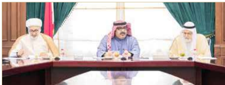
مجلس أمناء كلية عبدالله بن خالد للدراسات الإسلامية يعقد اجتماعه الدوري

الإنشائية الخاصة بالمقر الجديد للكلية. واستعرض مجلس الأمناء المقترح المقدم من رئيس المجلس بتأسيس برنامج تمهيدي للطلبة الملتحقين بالكلية، مع تطبيق نظام الإعفاء من البرنامج أو من بعض مقرراته طبقاً لأداء الطلبة المستجدين، حيث تم تكليف اللجنة الأكاديمية المنبثقة عن المجلس بإعداد التقارير اللازمة عن ذلك وعرضها على المجلس في اجتماعه المقبل. واعتمد المجلس مقترح لائحة الرسوم الجديدة للكلية، وكلف أمانة السر بالتنسيق في شأنها مع التعليم العالي؛ لاتخاذ ما يلزم في شأنها طبقاً للإجراءات واللوائح المعتمدة في هذا الخصوص.