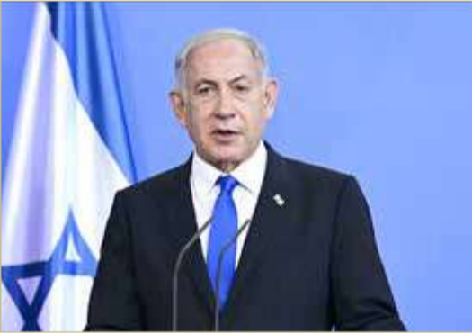
رئيس الوزراء الإسرائيلي بنيامين نتنياهو

ومنذ عام 2021، تنظر المحكمة المركزية الإسرائيلية بالقدس في اتهامات وجهها النائب العام إلى رئيس الوزراء، منها الاحتيال وخيانة الأمانة وتلقي الرشوة، بينما ينفي نتنياهو صحتها. وأوضحت الصحيفة أن "الالتماس قدمه 39 مشتكيًا،