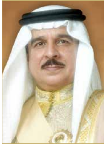
ملك البلاد المعظم

الثنائية المتميزة التي تربط بين مملكة البحرين والجمهورية الفرنسية وما تشهده من تطور مستمر ومتصاعد، مؤكداً مواصلة العمل على تنمية هذه العلاقات والارتقاء بها إلى مستويات أرحب وأشمل، بما يحقق مصالح البلدين الصديقين. كما بعث صاحب السمو الملكي ولي العهد رئيس مجلس الوزراء بريقة تهنئة مماثلة إلى رئيسة وزراء الجمهورية الفرنسية الصديقة الزابيث بورن.