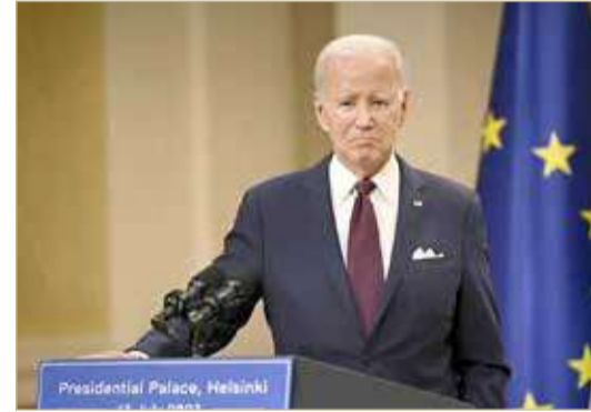
بايدن خلال مؤتمر صحفي في هلسنكي

وتوقع الرئيس الأمريكي أن "يؤدي الهجوم الأوكراني المضاد إلى مفاوضات مع روسيا لإنهاء الحرب". وقال: "أمل وأتوقع، كما سترون، أن تحزر أوكرانيا تقدماً مهماً في هجومها وأن يفضي ذلك إلى تسوية