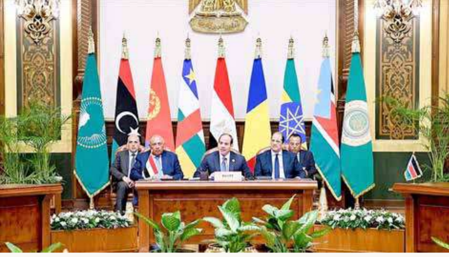
كلمة الرئيس المصري في قمة دول جوار السودان

وقال السيسي، في البيان الختامي، إنه تم الاتفاق على إنشاء آلية وزارية تعقد اجتماعها الأول في تشاد لوضع خطة تنفيذية تتضمن وضع حلول عملية وقابلة للتنفيذ لوقف الاقتتال، بحسب بيان للرئاسة المصرية. وأوضح أن الآلية مكلّفة أيضًا بالتوصل إلى حل شامل للأزمة عبر التواصل المباشر مع الأطراف السودانية المختلفة، في تكاملية مع الآليات القائمة، بما فيها إيغاد والاتحاد الأفريقي. "وضع السيسي أفاد كذلك بأن الآلية ستعمل على "وضع الضمانات التي تكفل الحد من الآثار السلبية للأزمة على دول الجوار، ودراسة آلية إيصال