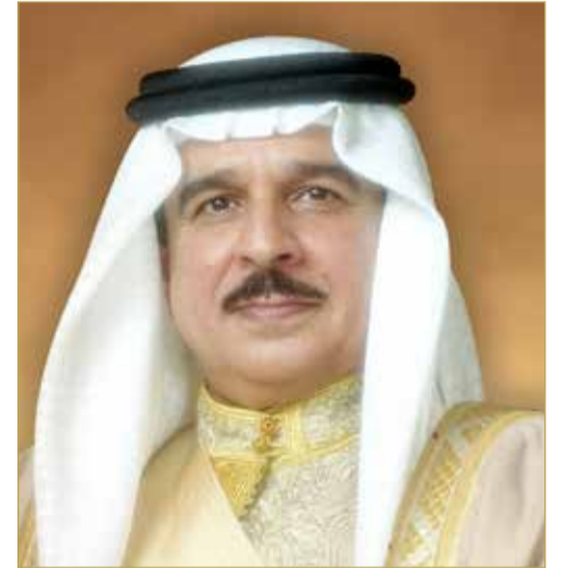
ملك البلاد المعظم

المنازمة - بنا أشاد ملك البلاد المعظم صاحب الجلالة الملك حمد بن عيسى آل خليفة، بالمنجزات الحقوقية البارزة التي حققتها مملكة البحرين في مجال حقوق الإنسان حتى أصبحت المملكة نموذجاً رائداً في هذا المجال، مؤكداً نهج المملكة الثابت في صيانة حقوق الإنسان ودعم كل ما من شأنه احترام هذه الحقوق في ظل التزامها التام بكل المواثيق والقوانين الدولية المتعلقة بها، والتي هي جزء أساسي من ثقافة البحرين وهويتها العربية وعقيدتها الإسلامية. وأثنى جلالاته على الجهود المثمرة