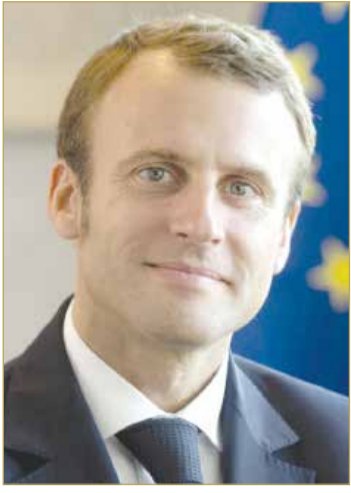
رئيس الجمهورية الفرنسية