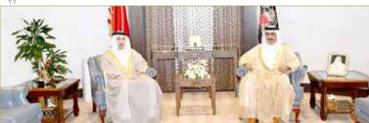
وزير الداخلية في لقاء مع محافظ العاصمة