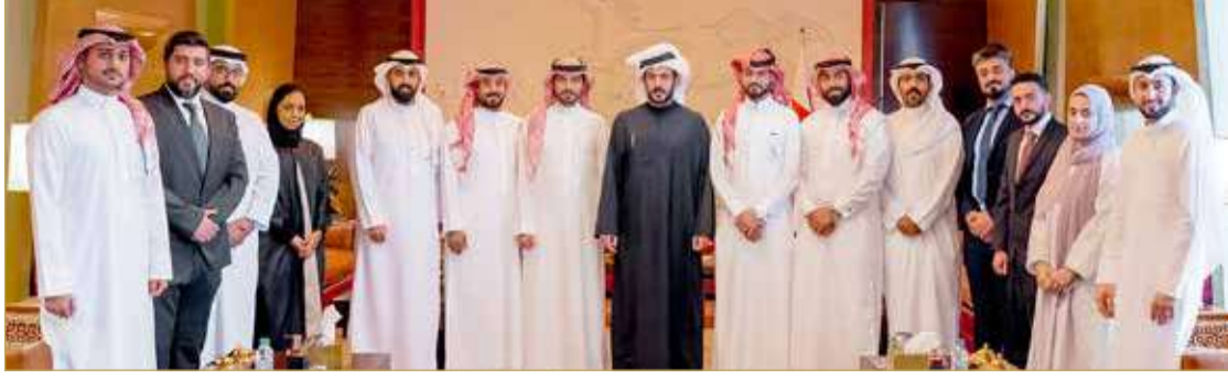
الرفاع - المكتب الإعلامي سمو الشيخ خالد بن حمد بن عيسى آل خليفة

أكد النائب الأول لرئيس المجلس الأعلى للشباب والرياضة رئيس الهيئة العامة للرياضة رئيس اللجنة الأولمبية البحرينية سمو الشيخ خالد بن حمد آل خليفة أن مملكة البحرين تفخر بشبابها المنجز؛ نظراً للنجاحات التي حققها أبناء البحرين على كافة الأصعدة والمستويات حتى انتقلت تلك الإنجازات من الفضاء المحلي إلى الخارجي، وهو ما يعكس تميز شبابنا في ظل الدعم والاهتمام الذي يحظى به شباب الوطن من قبل ملك البلاد المعظم صاحب الجلالة الملك حمد بن عيسى آل خليفة ومساندة ولي العهد رئيس مجلس الوزراء صاحب السمو الملكي الأمير سلمان بن حمد آل خليفة ومؤازرة ممثل جلالة الملك للأعمال