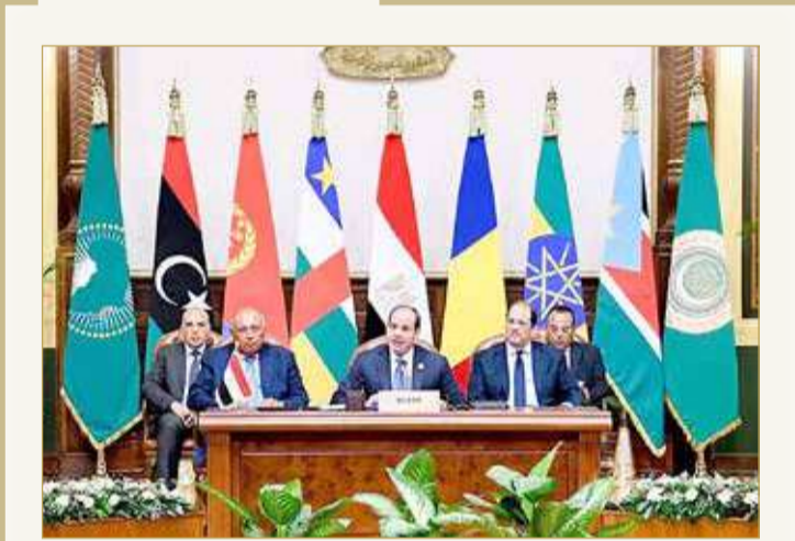
كلمة الرئيس المصري في قمة دول جوار السودان