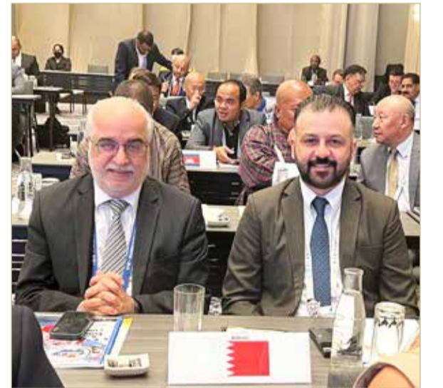
مشاركة وفد البحرين باجتماع الجمعية العمومية

من نيبال، أغابيتو كايسترانو من الفلبين، كو وان كي من هونغ كونغ، شينغ وانغ من الصين تايبيه، ونغوين مانغ هونغ من فيتنام، ويون شيل كو من كوريا الجنوبية. وحسم الجنرال التايلاندي سورابونغ أرياموغكول منصب النائب الأول لرئيس الاتحاد بالتزكية فيما حسمت التوزيعات الجغرافية للمناطق منصب نواب الرئيس وهم: الكويتي سيار العنزي، والصيني وانغ نان، والأندونيسي تيغور مانغابول، والباكستاني محمد أكرم، الأوزبكي أندري أبدوفاليف. كما تم خلال الاجتماع اعتماد شعار جديد للاتحاد الآسيوي لألعاب القوى.