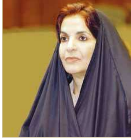
سمو الأميرة سبيكة بنت إبراهيم

بعثت قرينة عاهل البلاد المعظم رئيسة المجلس الأعلى للمرأة صاحبة السمو الملكي الأميرة سبيكة بنت إبراهيم آل خليفة برفقية تهنئة إلى رئيسة مجلس أمناء مركز الشبيخة إبراهيم بن محمد آل خليفة للثقافة والبحوث الشبيخة مي بنت محمد آل خليفة؛ بمناسبة منحها الوسام الإمبراطوري الياباني "وسام الشمس المشرقة والنجمة الذهبية والفضية"، تقديرًا