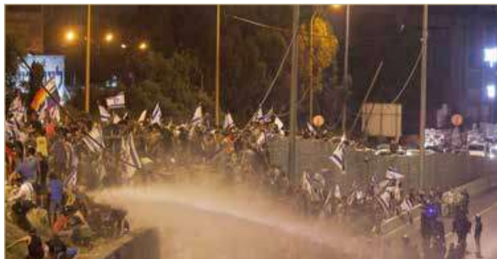
احتجاجات ضد إصلاح القضاء في تل أبيب

إنه "في مواجهة تقدم الإصلاح حان الوقت لتوجيه ضربة حاسمة". وأضافت "سيستغرق الأمر عدة أيام ونحن بحاجة إليكم.. انضموا إلينا". ويهدف الإصلاح الذي تؤوله الحكومة أكثر الأحزاب يمينية في تاريخ إسرائيل، إلى تغليب سلطة النواب على سلطة القضاة.