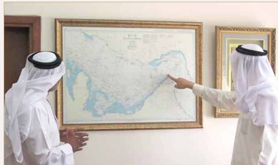
على الخريطة يشرح مسار سفن الشحن من رأس الخيمة إلى البحرين

في الجائحة خسرت مليوناً و600 ألف دينار في تأسيس مصنع لصهر الحديد