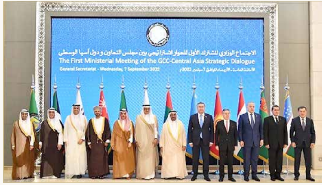
أول قمة خليجية مع دول وسط آسيا في جدة

المالية، وغيرها. وأعرب الفلاح عن تطلعه إلى زيادة حجم استثمارات جمهوريات وسط آسيا في المملكة العربية السعودية وتنويعها. ويأتي انعقاد القمة وسط ما تشهده العاصمة السعودية الصيفية من حراك سياسي ودولي كثيف على وقع التحولات الإقليمية والدولية، بعدما عقدت قمماً إثر أخرى في أقل من أسبوع. بدأت بالقمة السعودية-اليابانية الأحد، ثم السعودية-التركية الإثنين.