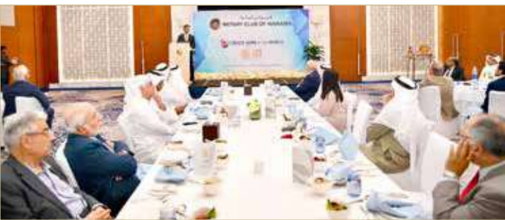
المبارك يستعرض مشروع زراعة أشجار القرم مع نادي روتاري المنامة

البحرين الوزير إلى هدف مضاعفة عدد الأشجار في مملكة البحرين من 1.8 مليون شجرة إلى 3.6 مليون شجرة بحلول العام 2035، وكذلك زيادة عدد أشجار القرم أربعة أضعاف من 400 ألف شجرة حالياً إلى 1.6 مليون شجرة بحلول العام 2035.