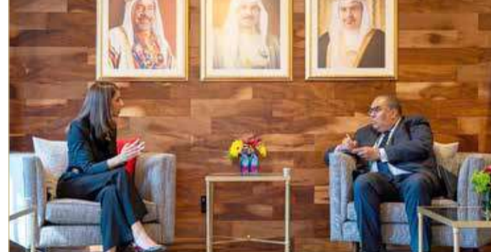
وزيرة التنمية المستدامة تلقي المبعوث الخاص للأمم المتحدة لتمويل أجندة 2030

لعام 2023، والمقام في نيويورك بعنوان "تسريع التعافي من مرض فيروس كورونا والتنفيذ الكامل لخطة التنمية المستدامة لعام 2030 على جميع المستويات"، بهدف تقديم الاستعراض الوطني الطوعي الثاني لمملكة البحرين بشأن التقدم المحرز في تحقيق أهداف التنمية المستدامة، حيث تمت مناقشة الجهود العالمية التي يبذلها صندوق النقد الدولي لدعم النمو الاقتصادي العالمي خاصة في مرحلة ما بعد جائحة