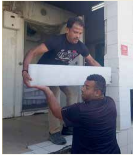
قطاع الإنشاءات من أنشط الفئات تزودا بقوالب الثلج

◆ يتوقع إداريو مصانع الثلج إقبالاً متزايداً من الزبائن الأسبوع المقبل