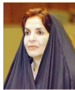
سمو الأميرة سبيكة بنت إبراهيم