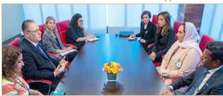
الوفد البحريني يلتقي مساعد الأمين العام للأمم المتحدة

المملكة والخبرات المكتسبة. من جانبه، أعرب الدردي عن دعمه لتجربة المملكة الرائدة في تحقيق أهداف التنمية المستدامة، مثنياً قدرتها على تجاوز التحديات بطرق مبتكرة وسباق وحرصها على التعاون الدولي وتبادل الخبرات ترسيخاً لنهج مملكة البحرين القائم على مبدأ "عدم ترك أحد يتخلف عن الركب".