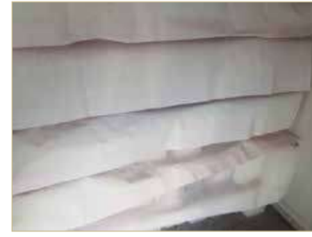
طريقة حفظ القوالب في مراكز البيع