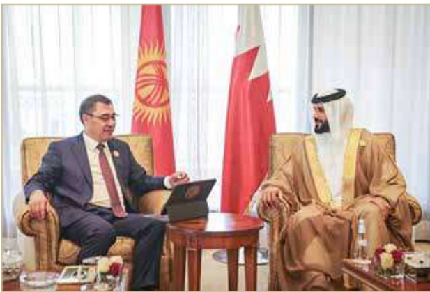
سمو الشيخ ناصر بن حمد يستقبل رئيس الجمهورية القيرغيزية