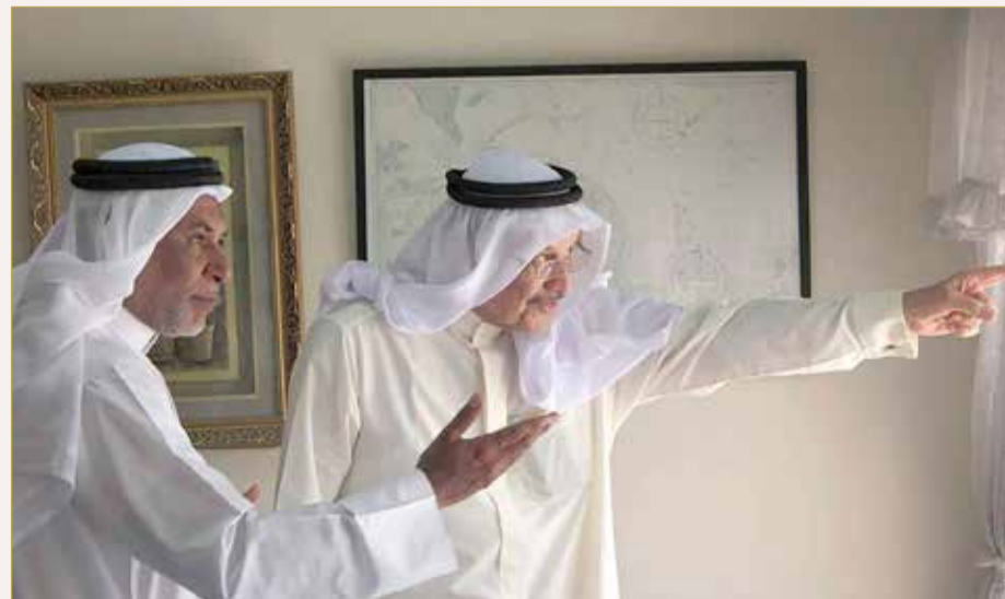
نظرة إلى حيث ترسو السفن

صدقني هذا ما أتمناه، وأطمح لأن يتحقق هذا الحلم بعون الله، لدينا شركات يعمل فيها عدد كبير من البحارة وهم من غير البحرينيين أو الخليجيين في الغالب الأعم، فلو أنشأنا معهداً أو كلية بحرينية متخصصة في الإدارة والأعمال المهنية في البواخر وعلى الأرض؛ كونها كلها أعمال متماسكة ومرتبطة ببعضها البعض، فهذا سيعكس حرصنا على الاهتمام بالعلوم البحرية ونخرج البحارة والكباتنة البحرينيين الذين سيجدون فرص عمل واعدة في البحرين وفي دول الخليج كذلك، وكل شركة، وهذا ما أنا متأكد منه، ستساهم في هذا المشروع ليكون لدينا كوادر متخصصة في علوم البحار.