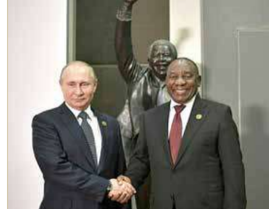
رئيس جنوب إفريقيا: توقيف بوتين سيكون بمثابة إعلان حرب

غفوزديكا، إضافة إلى رادار "تي بي كيو-50" أميركي الصنع. ووفقاً لما نقله موقع روسيا اليوم، فقد بلغت خسائر أوكرانيا البشرية على المحاور كافة خلال يوم واحد نحو 730 جندياً.