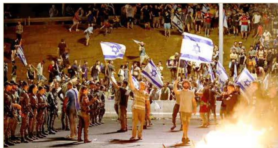
أقر الكنيست قانوناً للتعديلات القضائية أثار احتجاجات الإسرائيليين

كما قال زعماء الاحتجاج الإسرائيليون إن آلاف من جنود الاحتياط المتطوعين قد يمتنعون عن الخدمة إذا واصلت الحكومة السير في نهجها. كما حذر ضباط كبار سابقون من أن جاهزية إسرائيل لخوض الحروب قد تكون في خطر.