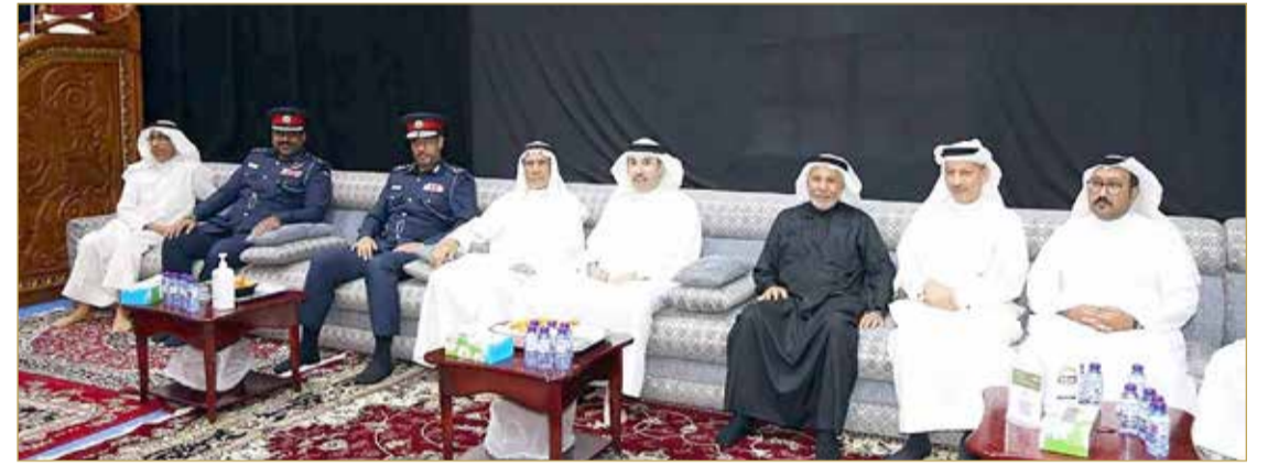
محافظ العاصمة يزور عدداً من مآتم منطقة سترة

المنامة - وزارة الداخلية تنفيذاً لتعليمات وزير الداخلية الفريق أول الشيخ راشد بن عبد الله آل خليفة بمتابعة احتياجات المآتم وتقديم الخدمات المطلوبة في موسم عاشوراء وتيسير الأمور المتصلة بهذه المناسبة، زار محافظ العاصمة الشيخ راشد بن عبدالرحمن آل خليفة عدداً من المآتم في منطقة سترة. وأكد أن المحافظة تعمل على