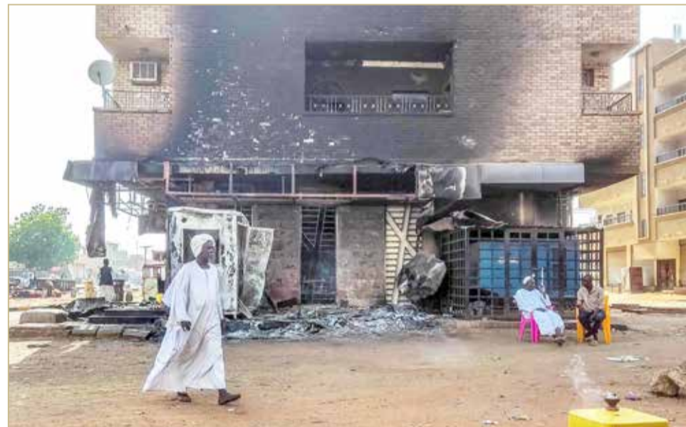
انزلق السودان إلى هاوية الاقتتال بين الجيش وقوات الدعم السريع في 15 أبريل الماضي

وقوات الدعم السريع في 15 أبريل الماضي، بينما كانت الأطراف العسكرية والمدنية تضع المسامحة النهائية على عملية سياسية كان من المفترض أن تقضي إلى تشكيل حكومة مدنية.