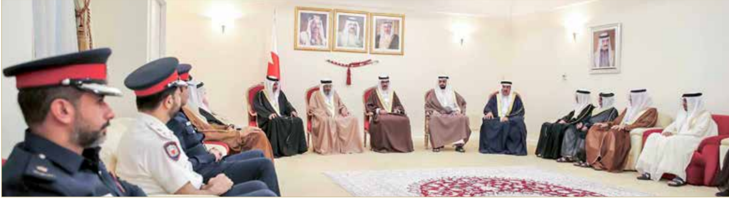
سمو محافظ الجنوبية في لقاء مع الأهالي بالمجلس الأسبوعي