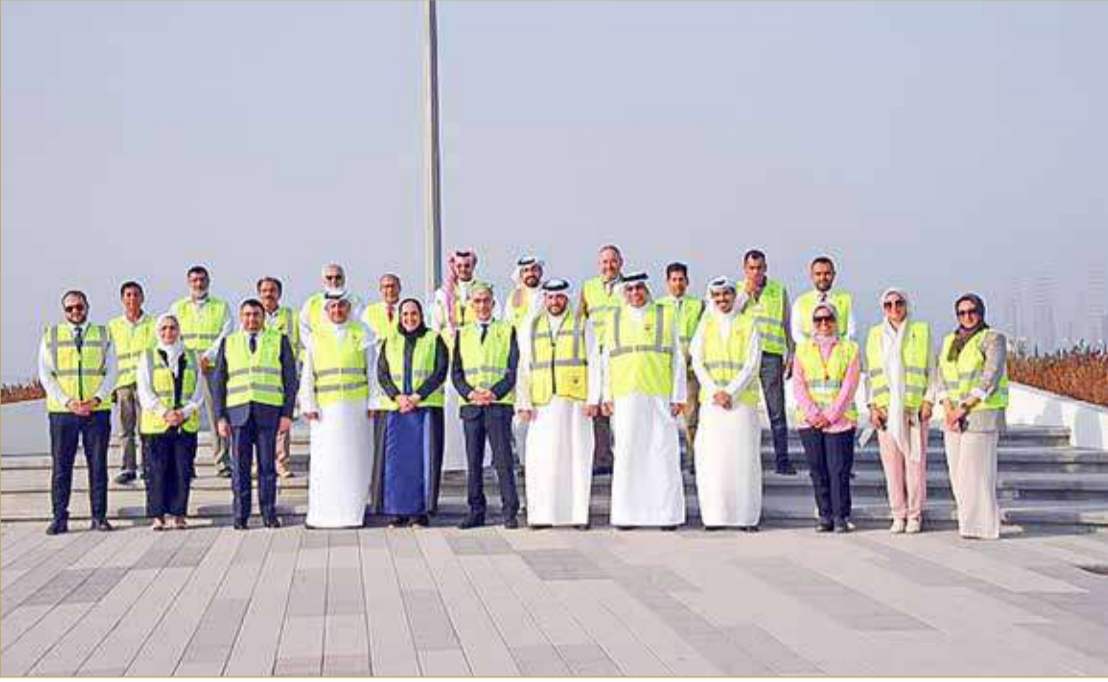
زيارة تفقدية لوزراء الأشغال والكهرباء والإسكان

قام رئيس هيئة الكهرباء والماء كمال أحمد ووزير الأشغال إبراهيم الحواج، ووزير شؤون الكهرباء والماء ياسر حميدان و وزيرة الإسكان والتخطيط العمراني آمنة الرميحي، بزيارة تفقدية لمشروع شرق سترة الإسكاني، لتفقد الأعمال الإنشائية للوحدات السكنية، بالإضافة إلى خدمات البنية التحتية الجارية حالياً بالمشروع.