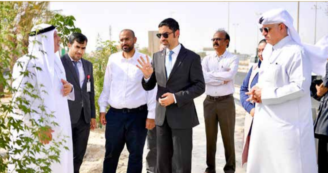
المنامة - وزارة شؤون البلديات والزراعة

تفقد وزير شؤون البلديات والزراعة وائل المبارك أعمال التشجير والتجميل الجاري تنفيذها على امتداد جانبي ووسط شارع الشيخ خليفة بن سلمان بطول 14 كيلومتراً والذي يبدأ من تقاطعات الجسر العلوي شارع الشيخ عيسى بن سلمان وشارع الشيخ خليفة لغاية تقاطع الزلق.