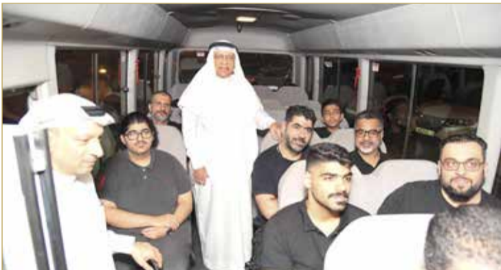
رئيس الأوقاف الجعفرية يبدن مشروع خدمات نقل المعزين لموسم عاشوراء

من 6 مسارات رئيسة إلى العاصمة المنامة في موسم عاشوراء، من ليلة السابع حتى ليلة العاشر من محرم؛ لنقل المعزين من وإلى داخل العاصمة (من السادسة مساءً حتى الثانية فجراً)؛ لخدمة المشاركين في إحياء ذكرى عاشوراء بيسر وسهولة. (05)