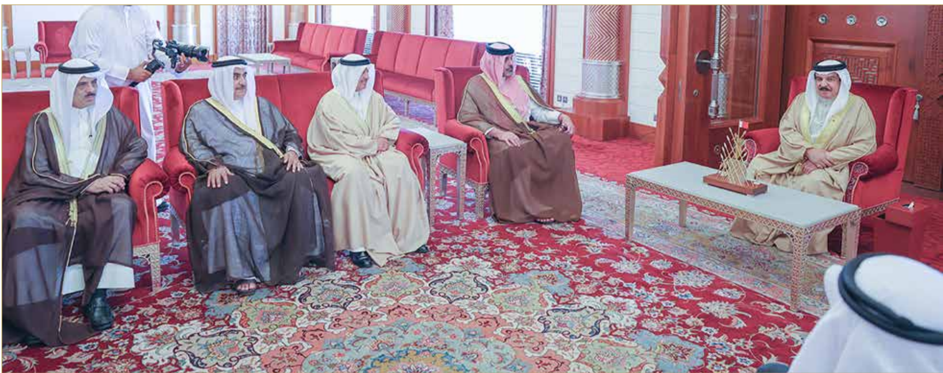
المنامة - بنا

◆ كتب صدرت بظروف وأوقات معينة لا يجب أن يعتد بها مراجع تاريخية