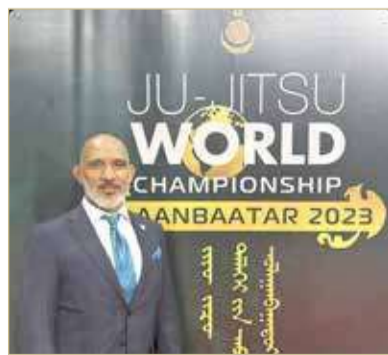
رئيس الاتحاد البحريني للجوجيتسو

سلمان بن محمد آل خليفة، لارتقاء بهذه اللعبة وتهيئة الأجواء المثالية للمنتخبات الوطنية في سبيل حصد الإنجازات في المحافل المقبلة، مبينا إلى أن المنتخب مقبل على مشاركات عديدة تحتاج إلى زيادة الاستعداد والوصول إلى كامل الجاهزية من أجل تحقيق إنجازات جديدة والحضور الدائم على منصات التتويج.