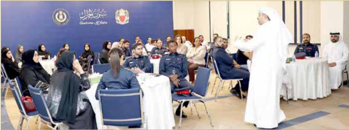
جانب من المحاضرة