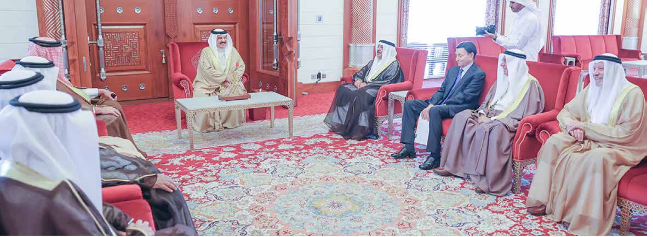
جلالة الملك المعظم يستقبل مستشاري جلالتة وعددا من المسؤولين

◆ يجب تحري الدقة عندما يُكتب تاريخ البحرين وأهلها واعتماد المصادر الموثوقة... الملك المعظم: