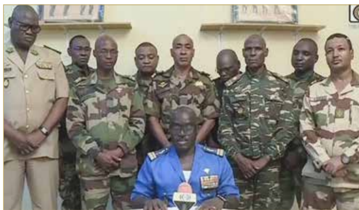
قائد الجيش في النيجر يعلن تأييد الانقلاب

سادت حالة من القلق حول العالم في "بلد اليورانيوم" بعدما أعلن جيش النيجر ولاءه لقوات الدفاع والأمن التي أطاحت بالرئيس محمد بازوم، أمس الأول، وذلك تفادياً للاقتتال داخل صفوف القوات المسلحة. جاء ذلك في بيان وقعه رئيس أركان الجيش، أمس الخميس، فيما اندلعت أعمال عنف في عاصمة النيجر عقب الانقلاب. وفي وقت سابق كان رئيس النيجر المعزول محمد بازوم قال إن المواطنين سيحمون المكتسبات التي تحققت بعد كفاح طويل، ومن جانبه أعلن وزير خارجية النيجر حسومي مسعودو نفسه رئيساً للحكومة بالنيابة، داعياً للتعنية لمقاومة "الانقلاب"، مؤكداً أن حكومة بازوم هي "الحكومة الشرعية".