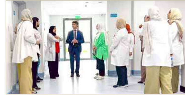
الرئيس التنفيذي للمستشفيات يطلع على جاهزية المركز