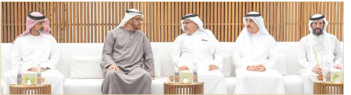
سمو ولي العهد رئيس الوزراء يقدم واجب العزاء إلى سمو رئيس دولة الإمارات