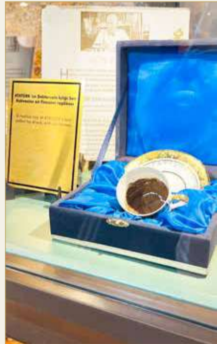
متحف تاريخ القهوة التركية

ويعتبر أهالي مدينة صفران أهل كرم وضيافة، من خلال استضافتهم الضيوف والسياح لتقديم شاي الزعفران وإكرامهم بتناول الحلوى واحتساء القهوة التركية.