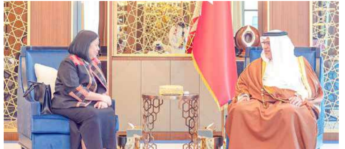
سمو ولي العهد رئيس الوزراء مستقبلاً السفير الفلبينية

أكد نائب رئيس مجلس الوزراء الشيخ خالد بن عبدالله آل خليفة أن التطور اللافت الذي تشهده الخدمات الإسكانية في صورتها المبتكرة، وتحديثها المتواصل لتلبية الاحتياجات، يجسد الجهود المبذولة لرفع كفاءة الدعم والحماية الاجتماعية المقدمة للمواطنين؛ للإسهام في جعل الأسرة البحرينية آمنة ومستقرة على الدوام، بما يتماشى