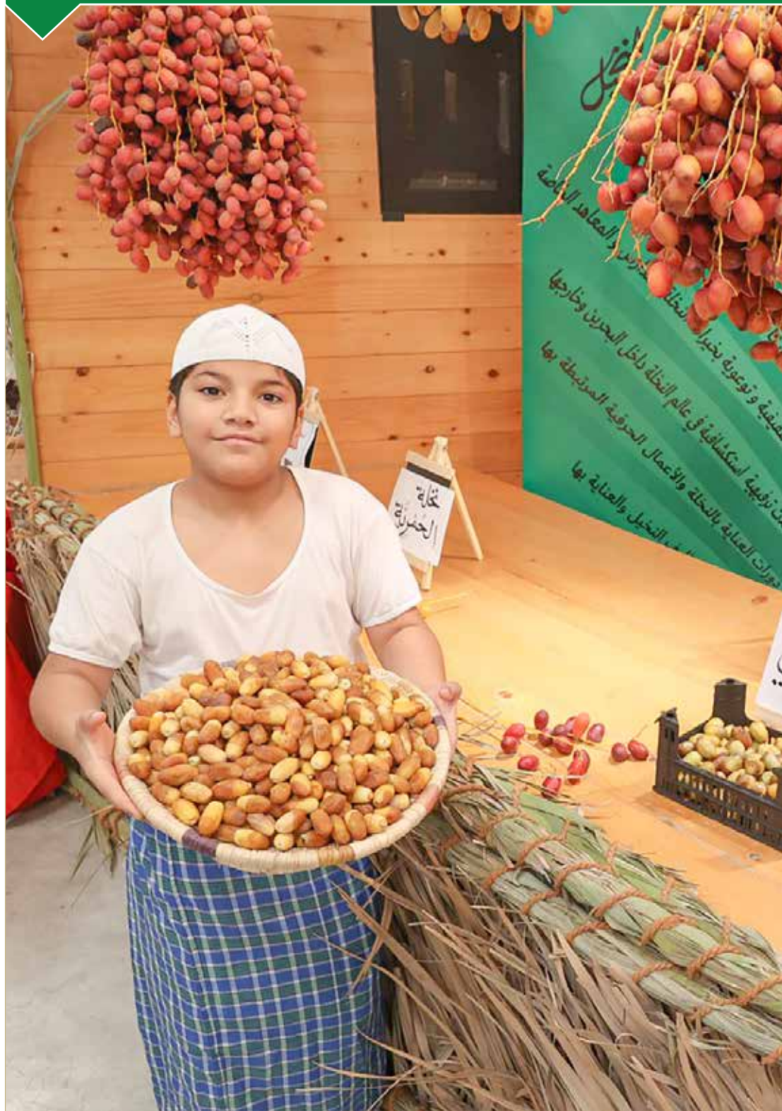
افتتاح مهرجان خيرات النخلة بسوق المزارعين الدائمة في هورة عالي