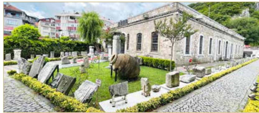
المتحف الروماني بمدينة أمصرة

أما منطقة كارابوك، فتتميز بالأجواء الشتوية وتساقط الأمطار طوال أيام السنة، وتعتبر هذه المنطقة الساحلية المطلة على البحر الأسود ملاذاً مناسباً للاستجمام والاسترخاء بعيداً عن ضوضاء المدن وحركة سير المركبات، وتكثر في المنطقة الساحلية المطاعم التي تقدم مأكولات بحرية على طريقة الطهو التركي، كما تعتبر من المناطق التي تجمع بين التراث القديم والحداثة في حركة العمران والبناء المتأثر بثقافة الرومان. وفي وسط المدينة يوجد متحف روماني وجسر مشاة وأقدم محلات بيع الأيسكريم التقليدي التركي، وتتميز المنطقة بوجود مطاعم ومحلات مناسبة لقضاء السهرات العائلية.