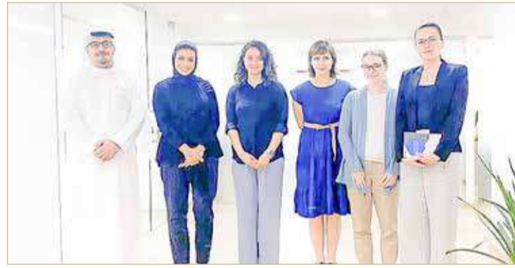
هيئة تنظيم سوق العمل تستقبل وفدا من ممثلي المنظمة الدولية للهجرة

كما استمع الوفد إلى شرح لدور المركز الإقليمي للتدريب وبناء القدرات لمكافحة الاتجار بالأشخاص في توفير قاعدة من المدربين المعتمدين من الممارسين والعاملين في الصفوف الأمامية في مجال التدريب.