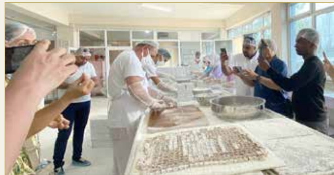
مصنع إنتاج حلوى الحلجوم في مدينة صفران