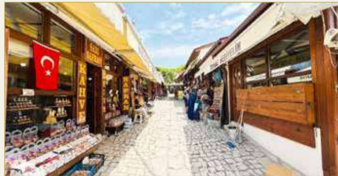
السوق الشعبية في مدينة صفران