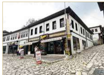
سوق الحلويات بمدينة صفران بولو

وتتميز بولو كمدينة لإنتاج الشوكولاتة التركية؛ نظراً لوجود مصانع عدة لإنتاج وصناعة الشوكولاتة الذي يتم تصديره لدول وبلدان عدة، كما تتميز المنطقة بإنتاج أجود أنواع العسل والأجبان. وتعتمد معظم مطاعم مدينة بولو في الطهو على الأخشاب، سواء في عمليات الشواء أو أنواع الطهو الأخرى. وبحسب الأتراك، فإن أجود أنواع إنتاج "السجق" و"النقانق" تكون في مدينة بولو.