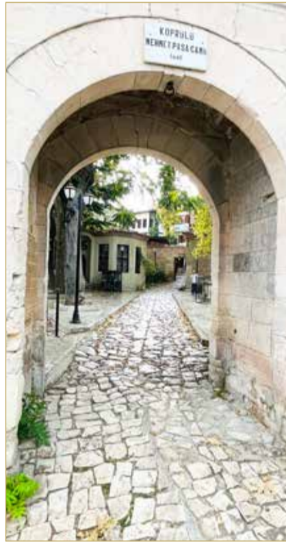
طريق المطاعم التراثية