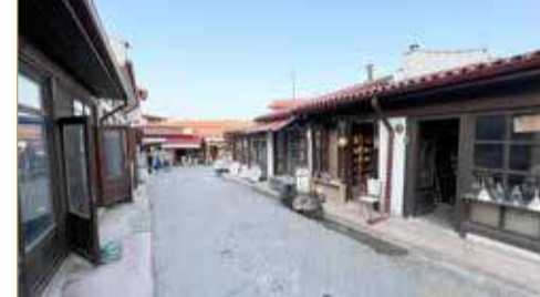
سوق الصفاير في منطقة كاستومونو القديمة

وشاركت "البلاد" في رحلة "الطريق إلى البحر الأسود؛ لاستكشاف الأطعمة والمناطق السياحية الجديدة" مع عدد من كبريات المؤسسات الإعلامية في منطقة الشرق الأوسط، وعند الوصول إلى منطقة كاستومونو