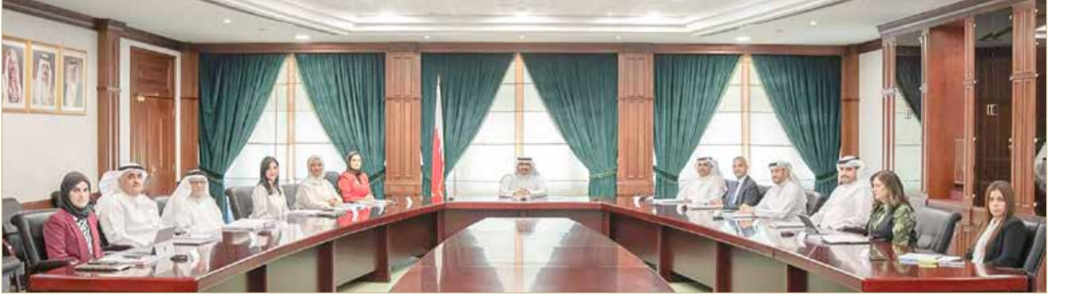
وزير التربية والتعليم يترأس الاجتماع الدوري لمجلس التعليم العالي