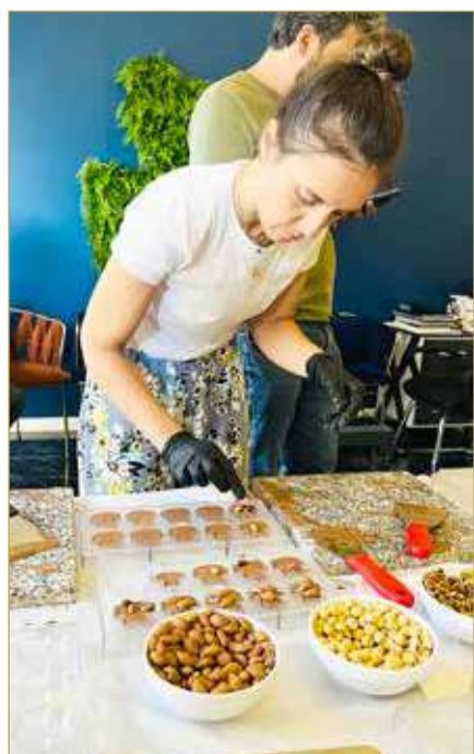
معمل صناعة الشوكولاتة في مدينة بولو