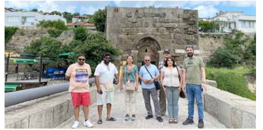
الوفد الإعلامي على جسر الطريق إلى البحر الأسود