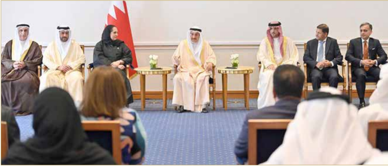
نائب رئيس مجلس الوزراء يرعى حفل تكريم الشركات المشاركة في معرض التمويلات الإسكانية