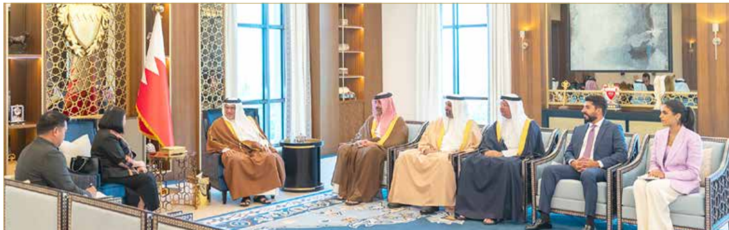
سمو ولي العهد رئيس الوزراء مستقبلاً السفيرة الفلبينية

جاء ذلك لدى لقاء سموه، في قصر القضيبيبة أمس، بحضور الممثل الشخصي لجلالة الملك المعظم سمو الشيخ عبدالله بن حمد آل خليفة،