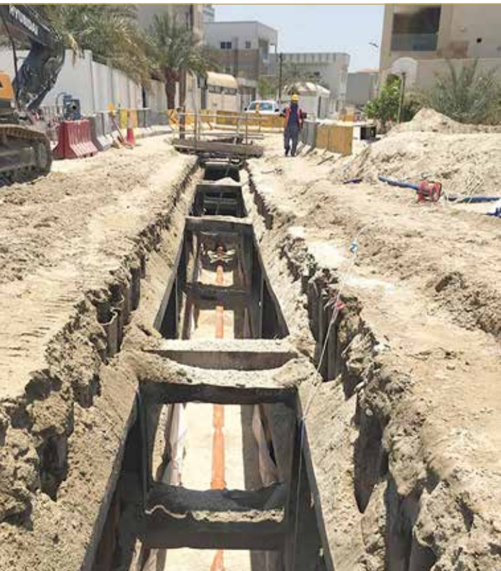
جانب من أعمال المشروع