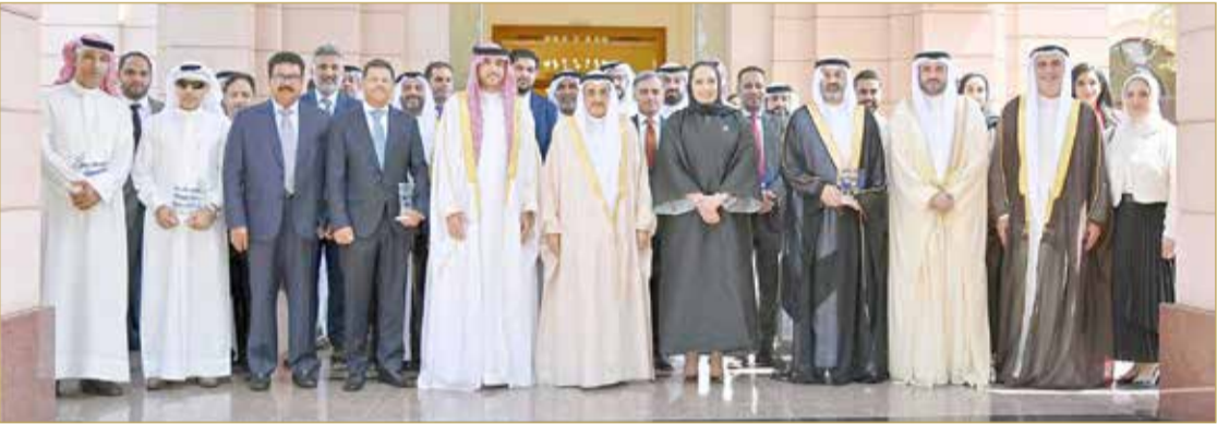
نائب رئيس مجلس الوزراء مع المكرمين