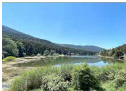
جزيرة بولو الساحرة