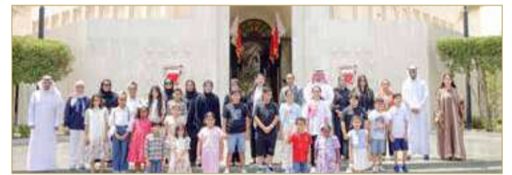
لجنة التوازن بين الجنسين تنظم ملتقى أبناء الموظفين