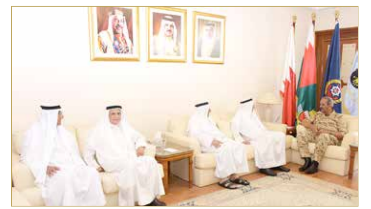
الرفاع - قوة الدفاع

استقبل القائد العام لقوة دفاع البحرين المشير الركن الشيخ خليفة بن أحمد آل خليفة، صباح أمس الأربعاء، جلال محمد جلال وإخوانه.