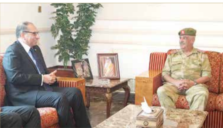
سمو رئيس الحرس الوطني يستقبل السفير الباكستاني بمناسبة انتهاء فترة عمله

المشتركة لمملكة البحرين وجمهورية باكستان الإسلامية الشقيقة، متمنياً له التوفيق والنجاح في مهامه المقبلة. من جانبه، أعرب سفير جمهورية باكستان الإسلامية لدى مملكة البحرين عن شكره وتقديره لسمو رئيس الحرس الوطني، على ما يوليه سموه من حرص واهتمام لتعزيز أفاق العلاقات الثنائية بين البلدين، بما يعود بالخير والنماء على البلدين والشعبين الشقيقين، متمنياً لمملكة البحرين مزيداً من التقدم والازدهار.