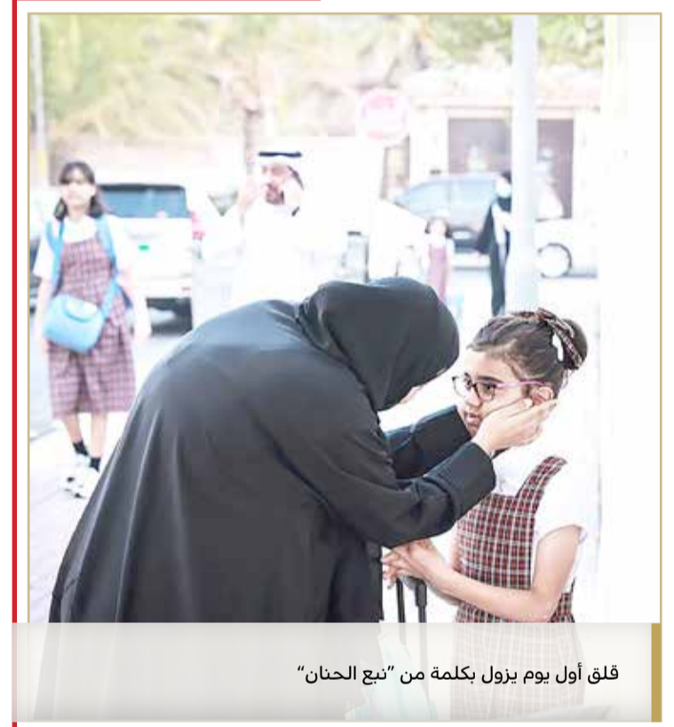
قلق أول يوم يزول بكلمة من "تبع الحنان"