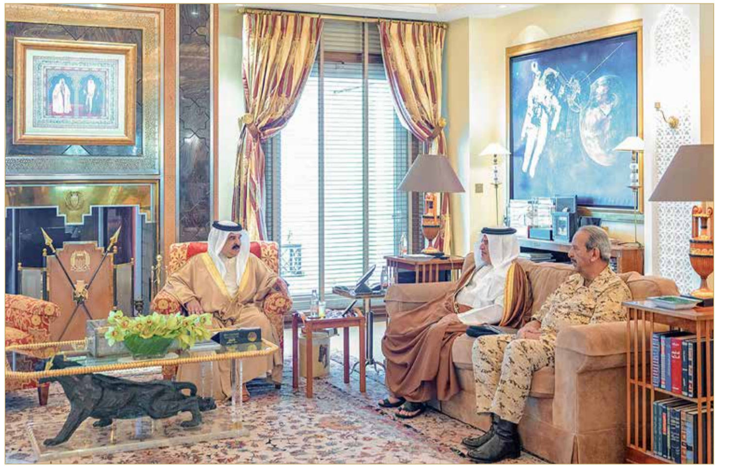
جلالة الملك المعظم مستقبلاً سمو ولي العهد رئيس الوزراء