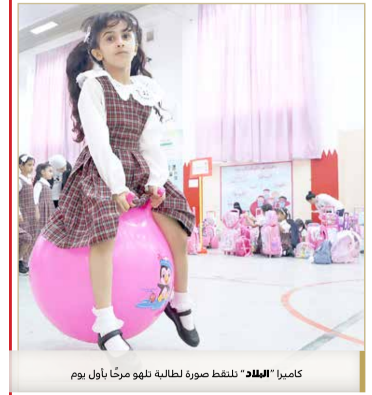
كاميرا "البلاد" تلتقط صورة لطلبة تلهو مرحاً بأول يوم

للطلبة، إلى جانب التوسع في استقطابهم ودمجهم في التعليم الحكومي، وزيادة عدد العاملين الداعمين لهم. وفي إطار اهتمام الوزارة بمنح الوقت الكافي للطلبة للتواصل الأسري والاجتماعي وتطوير المواهب المتنوعة بعد الدوام المدرسي، فإنها ستطبق هذا العام الجدولة الزمنية الجديدة لدوام الطلبة، والتي سيكون فيها موعد انصراف طلبة المرحلة الابتدائية في الساعة 12:30، والمرحلة الإعدادية في الساعة 1:15، والمرحلة الثانوية في الساعة 1:45.