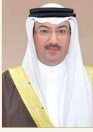
الشيخ محمد بن خليفة بن عبدالله

يذكر أن انطلاق معرض سيتي سكيب العالمي في الرياض يعتبر من إحدى الفعاليات العقارية المهمة في المنطقة، والذي يضم أكثر من 2000 مستثمر و350 جهة عارضة من كبار المستثمرين العالميين في القطاع العقاري تحت سقف واحد تمثل أكثر من 170 دولة، كما يضم أكثر من 250 متحدثاً لاستعراض أحدث الأفكار والرؤى في القطاع العقاري.