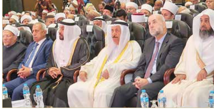
رئيس المجلس الأعلى للشؤون الإسلامية لدى مشاركته في المؤتمر الدولي للمجلس الأعلى للشؤون الإسلامية بمصر

أخطار الانفلات في استخدامها، مما يستدعي الإلمام بكل ما يتعلق بالأمان الرقمي فيها، ووضع ضوابط شرعية واضحة لتوظيفها في مجالات الإفتاء والخطاب الديني والعمل الدعوي، وتوقيع بروتوكولات بين المؤسسات الدينية تتعلق باستخدام الرشيد