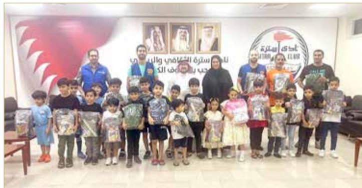
المنامة - نادي روتاري سيف البحرين