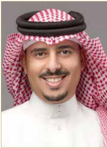
الشيخ خالد بن خليفة آل خليفة

وذكر أنّ برنامج البكالوريوس في إدارة الفنادق الدولية مُسكن على الإطار الأوروبي للمؤهلات (EQF)، ومُسند على الإطار الوطني للمؤهلات، لافتًا إلى أن كلية “Vatel” الفرنسية، للعام الثاني على التوالي، نالت على المرتبة 11 عالميًا ضمن تصنيفات QS “العالمية للجامعات في إدارة الضيافة والفندقة، بحسب المادة أو التخصص، للعام 2023، من بين 160 جامعة على مستوى العالم، QS World University Rankings by Subject 2023: Hospitality