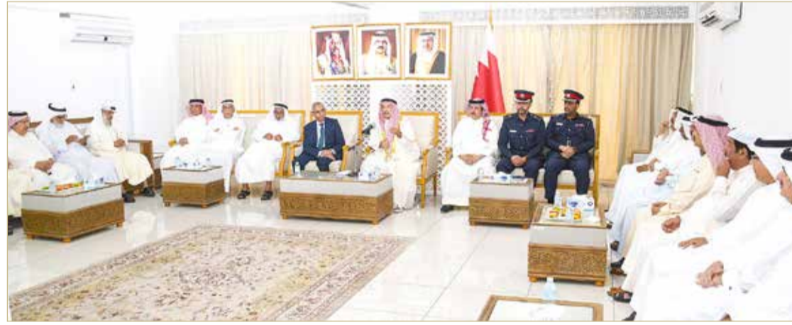
السيطين - محافظة المحرق

والشباب على مستوى الفرق، معربين عن تهانيمهم بإنجاز المشرف الذي يضاف إلى سلسلة إنجازات الفريق الملكي للقدرة في سباقات الخيل العالمية. وفي مداخلات الأهالي، أكد رواد المجلس أهمية احتضان أصحاب المتاحف الشخصية من مقتنيي الوثائق والمخطوطات والصور التاريخية، وتوفير أماكن عرض مناسبة لهم للمحافظة على الإرث البحريني الأصيل، مؤكداً أن محافظة المحرق تزخر بالمتاحف المنزلية وأصحاب المقتنيات التاريخية الحاضرة لذلك الماضي العريق.