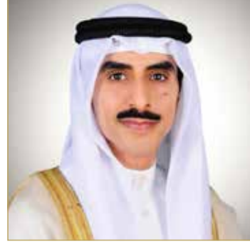
الشيخ ثامر جابر الأحمد الصباح

مجالات العمل التطوعي المختلفة والتي جاءت نظير دعمها للعديد من دول العالم، مما ساهم في ترسيخ قيم التطوع وإبرازه كقيمة إنسانية عالية وجوهر نبيل في المجتمعات على الصعيدين العربي والعالمي. يذكر أن جائزة سمو الشيخ عيسى بن علي آل خليفة للعمل التطوعي يتم منحها في شهر سبتمبر من كل عام، بالتزامن مع احتفالات اليوم العربي للتطوع، وتنظيمها جمعية الكلمة الطيبة بالتعاون مع الاتحاد العربي للتطوع، وتهدف إلى تشجيع المتطوعين على تقديم حلول مبتكرة من خلال أعمال تطوعية تساهم في مواجهة التحديات والأزمات المختلفة وتفعيل أدوارهم في مجال العمل التطوعي ونشر ثقافته.