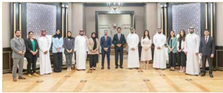
المنامة - وزارة شؤون البلديات والزراعة

وتطوير قدراتهم وتأهيلهم للمشاركة في مختلف المواقع الحكومية، مؤكداً أن البرنامج يسهم في تطوير الكوادر الوطنية عبر إكسابهم مجموعة من الخبرات والمهارات والتجارب، وصل مهاراتهم بما يثري العمل الحكومي ويسهم في عملية التطوير، وفق رؤى صاحب السمو الملكي ولي العهد رئيس مجلس الوزراء