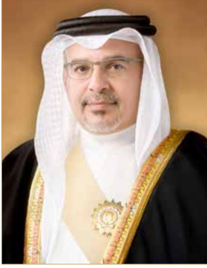
سمو ولي العهد رئيس الوزراء

وقد أعرب جلالتهم وسموهم في البرقيتين عن خالص تعازيهم وصادق مواساتهم لأخيهم العاهل المغربي ولأسر الضحايا ولشعب المملكة المغربية الشقيقة في هذا المصاب الأليم، راجيًا جلالتهم وسموهم المولى العلي القدير أن يتغمد الضحايا بواسع رحمته ومغفرته وأن يلهم أهلهم وذويهم جميل الصبر والسلوان، متمنين