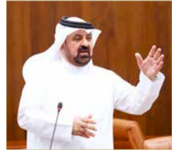
النائب محمد المعرفي

أقساط بما يتناسب مع ظروفه الطارئة، لكن المدرسة أصرت على رفض التحاق البنات حين سداد جميع المتأخرات، وهو ما اضطر ولي الأمر إلى التوجه إلى الوزارة لنقل ابنته، لكنها رفضت تسجيلها كذلك دون تسليم شهادة إخلاء طرف وكشف درجات من المدرسة الخاصة التي طالبت بتسديد جميع المتأخرات لتسليمه هذه الأوراق، فأصبحت البنات بين مطرقة المدرسة الخاصة وسندان وزارة التربية والتعليم. وأوضح أنه من حق المدرسة تحصيل كافة الرسوم التي تم الاتفاق عليها، لكن آلية التحصيل من طرف وإصرار الوزارة من طرف آخر أدت لخلق هذا الوضع الذي لا يقبله عاقل على أرض مملكة البحرين.