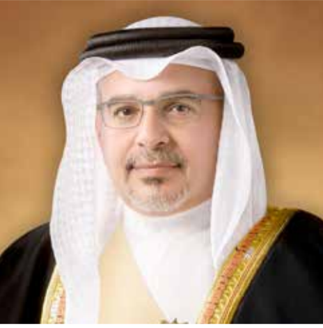
سمو ولي العهد رئيس الوزراء