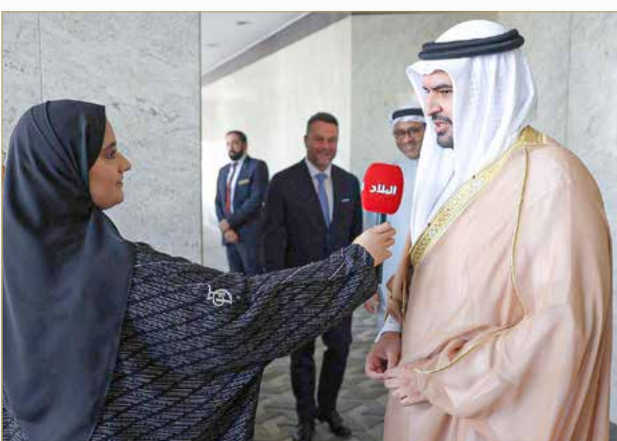
سمو الشيخ عيسى بن علي مصحراً إلى "البلاد"