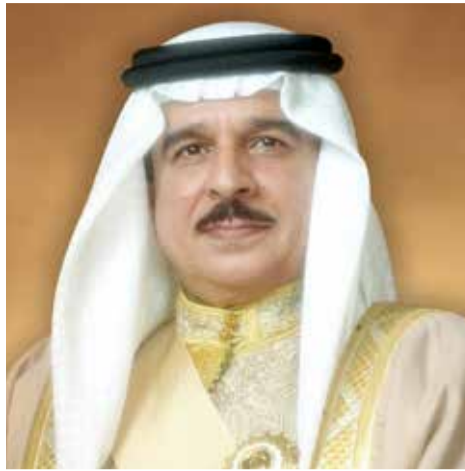
ملك البلاد المعظم

الجلالة الملك حمد بن عيسى آل خليفة، والدعم المستمر من صاحب السمو الملكي ولي العهد رئيس مجلس الوزراء، مما كان له الأثر البارز في نجاح دور السلطة التشريعية في إنجاز المشاريع والمبادرات على مختلف الأصعدة والتي تحمل بصمات رؤية الحكومة المستقبلية؛ من أجل خدمة مملكة البحرين.