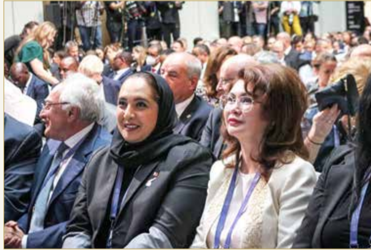
وزيرة الإسكان تترأس وفد المملكة في قمة بودابست

الموجه للأسر البحرينية يتضمن أيضاً الاهتمام بالمرأة البحرينية، وتمكينها من جميع حقوقها السياسية والاجتماعية، بالإضافة إلى توفير البرامج التي تخدم فئات الأطفال والنشئة، منوهة أيضاً بدور مؤسسات المجتمع المدني في مشاركة الحكومة في دعم الأسر البحرينية والحفاظ على استقرارها. وأكدت وزيرة الرفاهية أن مملكة البحرين تحرص على المشاركة في مثل هذه الفعاليات الدولية التي تسهم في تبادل المعرفة والخبرات والتجارب، مؤكدة استعداد المملكة المستمر لمشاركة نظرائها من دول العالم بتجاربه وسياساتها في مختلف المجالات، ولاسيما في مجال دعم الأسر.