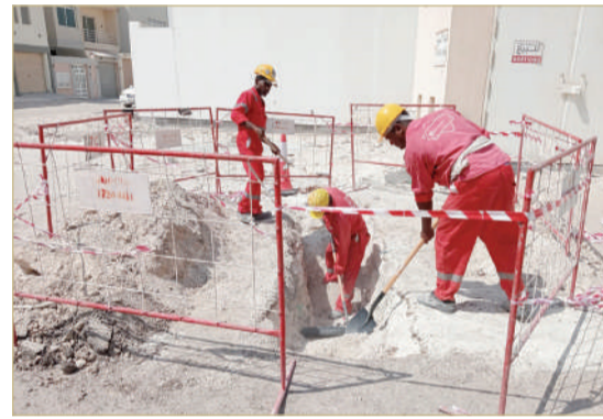
بدء أعمال الحفر الاستكشافية

والمقيمين وقاطني المنطقة التعاون والتقيد بالإشارات التحذيرية الإرشادية أثناء فترة تنفيذ المشروع؛ حفاظا على سلامتهم.