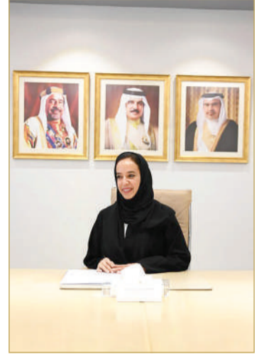
سمو الشيخة حصة بنت خليفة

الرفاع - المجلس الأعلى للمرأة عقدت لجنة "المرأة في مجال التكنولوجيا المالية" اجتماع عمل برئاسة عضو المجلس الأعلى للمرأة سمو الشيخة حصة بنت خليفة آل خليفة، وذلك بمقر المجلس، جرى خلاله استعراض جهود اللجنة خلال الفترة