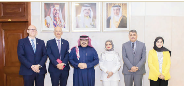
وزير التربية والتعليم يستقبل وفداً من الكلية الملكية للجراحين (RCSI)