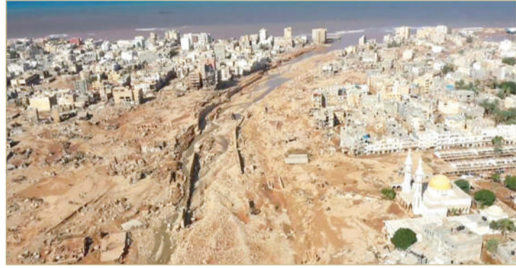
دمار هائل خلفته الفيضانات في شرق ليبيا

درنة إجابات: لم يبق تطلبات إصلاح السدّين المنهارين جبراً على ورق ومن سيساعدهم في مواجهة أخطار الأوبئة؟ بعد تظاهرة شارك فيها مئات السكان، قرر رئيس حكومة شرق البلاد أسامة حماد أمس الإثنين حل المجلس البلدي في درنة وطلب فتح تحقيق.