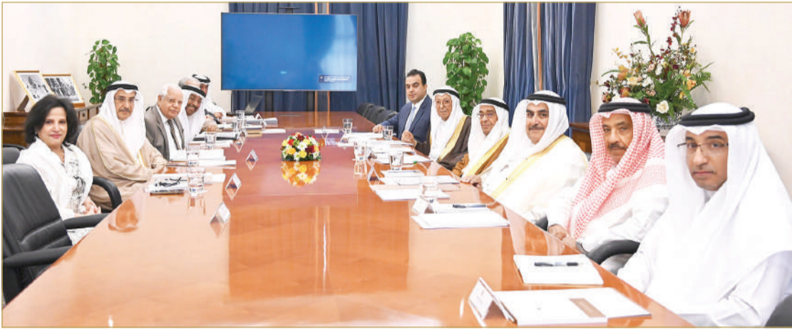
سمو الشيخ محمد بن مبارك يتراأس الاجتماع السابع للدورة الرابعة لمجلس أمناء جائزة عيسى لخدمة الإنسانية

الاجتماع الدوري لمجلس أمناء منتدى الجوائز العربية، الذي سيعقد خلال شهر أكتوبر القادم بعمان الأردن، كما كلف المجلس الأمانة العامة للجائزة بتوسيع مشاركة جائزة عيسى لخدمة الإنسانية في معرض "ديهاد" الدولي للإغاثة بدبي في أبريل 2024.