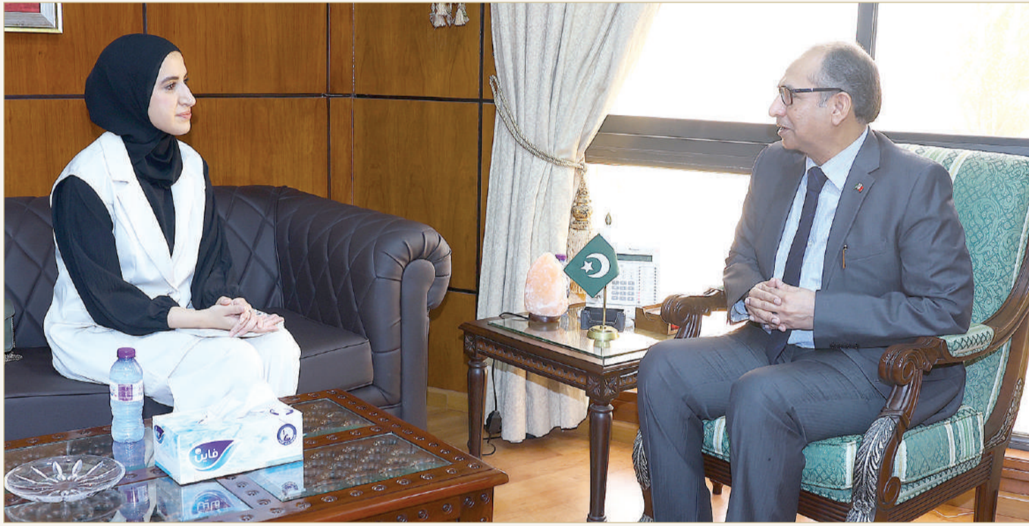
"البلاد" - حوار سفير جمهورية باكستان الإسلامية

مع ذلك، هناك حاجة إلى قوة متماسكة لتحقيق الاندماج الوطني في هذا المجتمع المتعدد الأعراق والأديان. إن كونك باكستانياً هو بمثابة قوة اجتماعية جاذبة، ما يعزز الشعور بالهوية ويعمل كحاجز ضد الطائفية والانقسام الريفي والعربي.