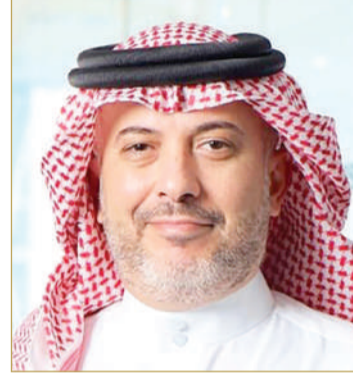
الشيخ خليفة بن إبراهيم