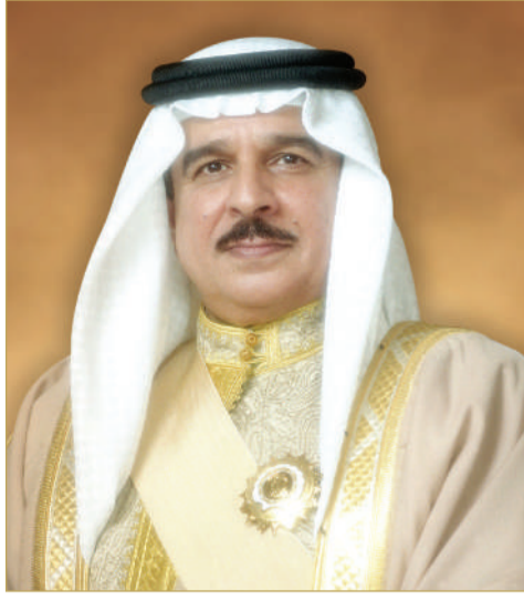
جلالة الملك المعظم

بعث ملك البلاد المعظم صاحب الجلالة الملك حمد بن عيسى آل خليفة وولي العهد رئيس مجلس الوزراء صاحب السمو الملكي الأمير سلمان بن حمد آل خليفة برقيتي تهنئة إلى رئيس جمهورية نيبال الديمقراطية الاتحادية رام شاندرام بوديل بمناسبة ذكرى يوم الدستور ليبلاده، أعرب جلالتهم وسموهم في البرقيتين عن أطيب تهنئتهما وتمنياتها له بموفقور الصحة والسعادة ولشعب جمهورية نيبال الديمقراطية الاتحادية بالمزيد من التقدم والازدهار.