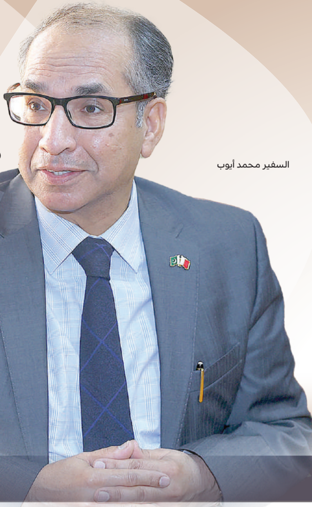
السفير محمد أيوب

قال سفير جمهورية باكستان الإسلامية لدى مملكة البحرين محمد أيوب إن حجم التبادل التجاري المشترك للسلع بين باكستان والبحرين بلغ حوالي 150 مليون دولار، إضافة إلى خدمات بقيمة 160 مليون دولار. وأشار السفير خلال لقاء أجرته معه "البلاد" في مكتبه؛ بمناسبة انتهاء فترة عمله سفيراً لدى مملكة البحرين إلى أن أبرز الصادرات من باكستان إلى البحرين تشمل الأرز والقطن الخام والروبيان واللحوم الحلال والفواكه والخضروات الطازجة، وكذلك تستورد باكستان منتجات الألمنيوم والحديد والمنسوجات الصناعية. وفيما يلي نص اللقاء: