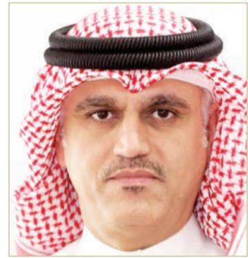
الشيخ محمد بن أحمد

من التلقيات والأضرار. بدوره، شدد رئيس المجلس البلدي للمنطقة الشمالية سيد شبر الوادعي على أن حديقة سار المزمع تنفيذها