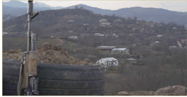
أذربيجان تطلق عمليات عسكرية في كاراباخ

باغ، معتبرة أن هدف باكو من ذلك هو "التطهير العرقي" في الجيب الانفصالي الذي تسكنه غالبية من الأرمن. كما قالت وزارة الخارجية الأرمينية في بيان "شنت أذربيجان عدواناً جديداً واسع النطاق على شعب كاراباخ، في سعي منها لاستكمال سياسة التطهير العرقي".