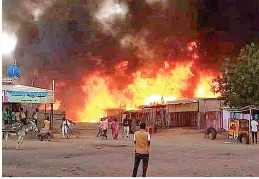
مليشيات قبلية تشترك مع القوات السودانية في بورتسودان

هذه الأوضاع في البلاد سيسفر عن "موت العديد والعديد من الآلاف من الأطفال". ميدانياً، اشتبك الجيش السوداني مع عناصر مليشيا قبلية في بورتسودان، وفق ما أفاد شهود، في أولى المعارك في المدينة الساحلية التي كانت ما تزال بمنأى من الحرب العنيفة المتدلعة في السودان منذ أبريل. وأفاد شاهد في المدينة المطلّة على البحر الأحمر بحصول "تبادل لإطلاق النار بين الجيش ومليشيا يقودها شعبة ضرار"، القيادي في قبيلة البجا في وسط بورتسودان. وقال شاهد مشرطاً عدم كشف هويته إن "جنوداً انتشروا في المنطقة بعد إزالة نقاط تفتيش كانت للمليشيا أقامتها"، في حين أفاد آخرون بـ"عودة الهدوء" بعد فترة قصيرة.