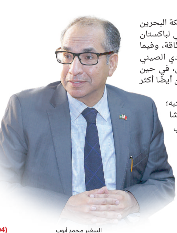
السفير محمد أيوب (04)

قال سفير جمهورية باكستان الإسلامية لدى مملكة البحرين محمد أيوب إن الموقع الجغرافي والاستراتيجي لباكستان يجعلها مركزاً اقتصادياً إقليمياً طبيعياً وممر طاقة، وفيما يتعلق بقطاعات الاستثمار، يوفر الممر الاقتصادي الصيني الباكستاني فرصاً هائلة للمستثمرين البحرينيين، في حين أن السياحة الغذائية والأمن الغذائي قد يصبحان أيضاً أكثر القطاعات جاذبية وربحية لهؤلاء المستثمرين. وقال أيوب في لقاء أجرته معه "البلاد" في مكتبه؛ بمناسبة انتهاء فترة عمله سفيراً: شهدت انتعاشاً اقتصادياً ملحوظاً بعد جائحة "كوفيد 19" في البحرين. وأشار إلى أن حجم التبادل التجاري المشترك للسلع بين باكستان والبحرين بلغ نحو 150 مليون دولار، إضافة إلى خدمات بقيمة 160 مليون دولار. وأردف أن أبرز الصادرات من باكستان إلى البحرين تشمل الأرز والقطن الخام والروبيان واللحوم الحلال والفواكه والخضروات الطازجة.