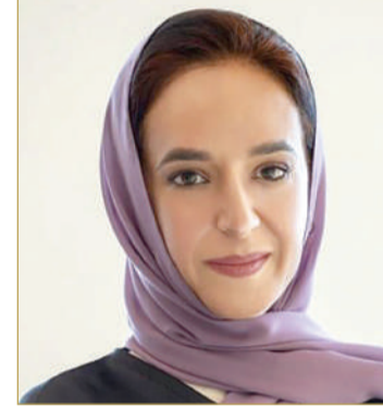
سمو الشخة حصة بنت خليفة

للمستقبل واعد. وتعد بورصة البحرين شريكاً دائماً في تزويد طلاب الصف الرابع الابتدائي في مملكة البحرين بالمهارات المالية الأساسية التي تمتد لما وراء الفصول الدراسية. إن السجل الناجح لهذا البرنامج يعد خبير دليل على تأثيره الملموس في تمكين الجيل القادم من الرواد البحرينيين. ويتضمن البرنامج 7 ورش عملية لتزويد الطلبة بالمهارات الأساسية اللازمة؛ لتعزيز ثقافتهم المالية، ويشمل ذلك التفكير، والتحديد، والتخطيط، والتنفيذ، والتوفير، والتقدم، والتقييم. ويتعلم الطلاب المشاركون في البرنامج العديد من المفاهيم والمصطلحات المالية الأساسية التي تشمل إدارة